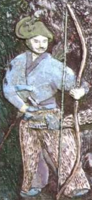
行藤（むかばき）の説明板

「行藤」(むかばき)とは、昔、武士が騎馬で狩猟や遠くに行くときに鹿・熊・虎などの毛皮で作ったものを腰から脚にかけて着用したものです。行藤山という名前の由来はこの山の遠望がこの「行藤」の形に似ているところからきています。