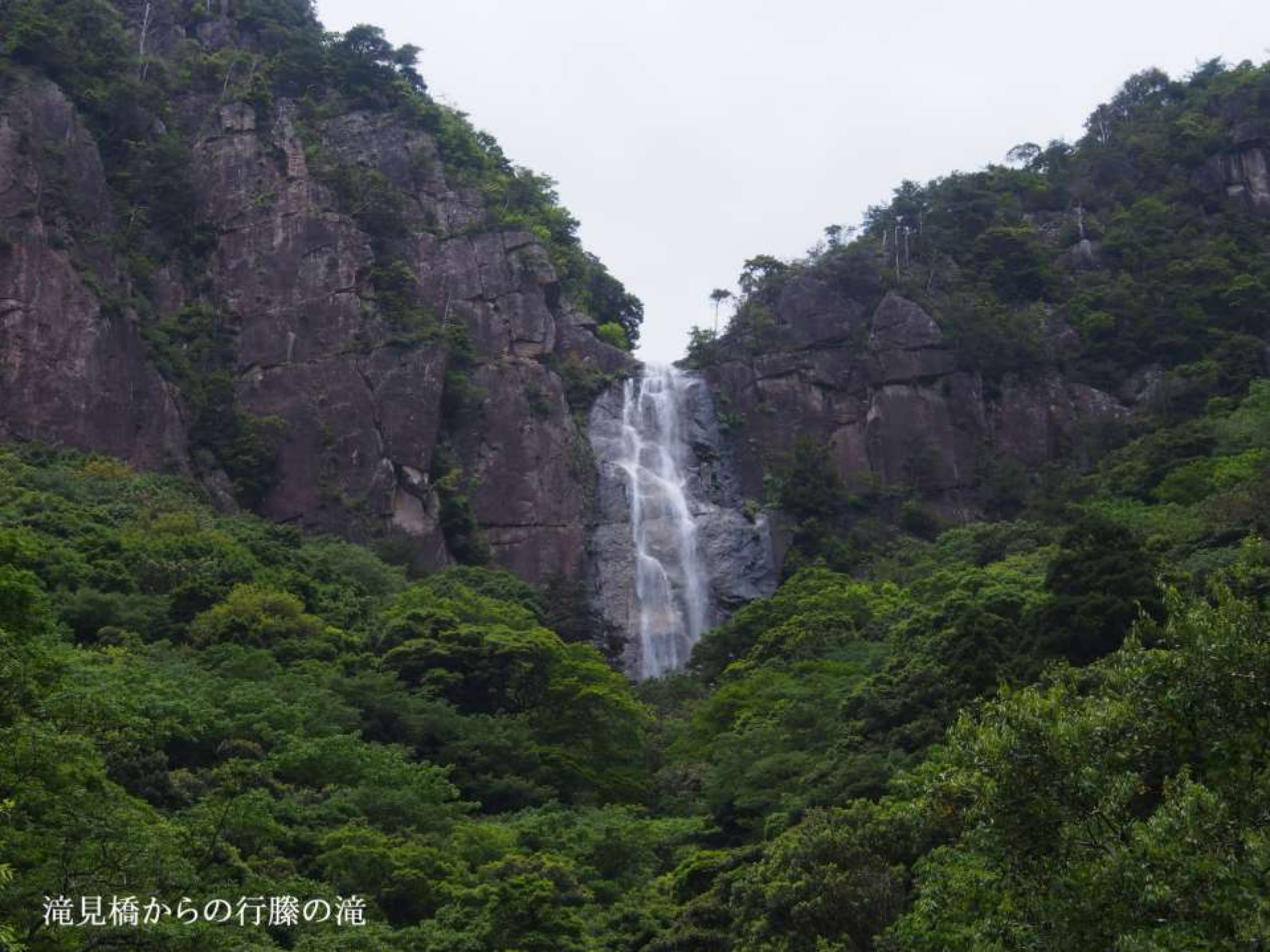
滝見橋からの行藤の滝