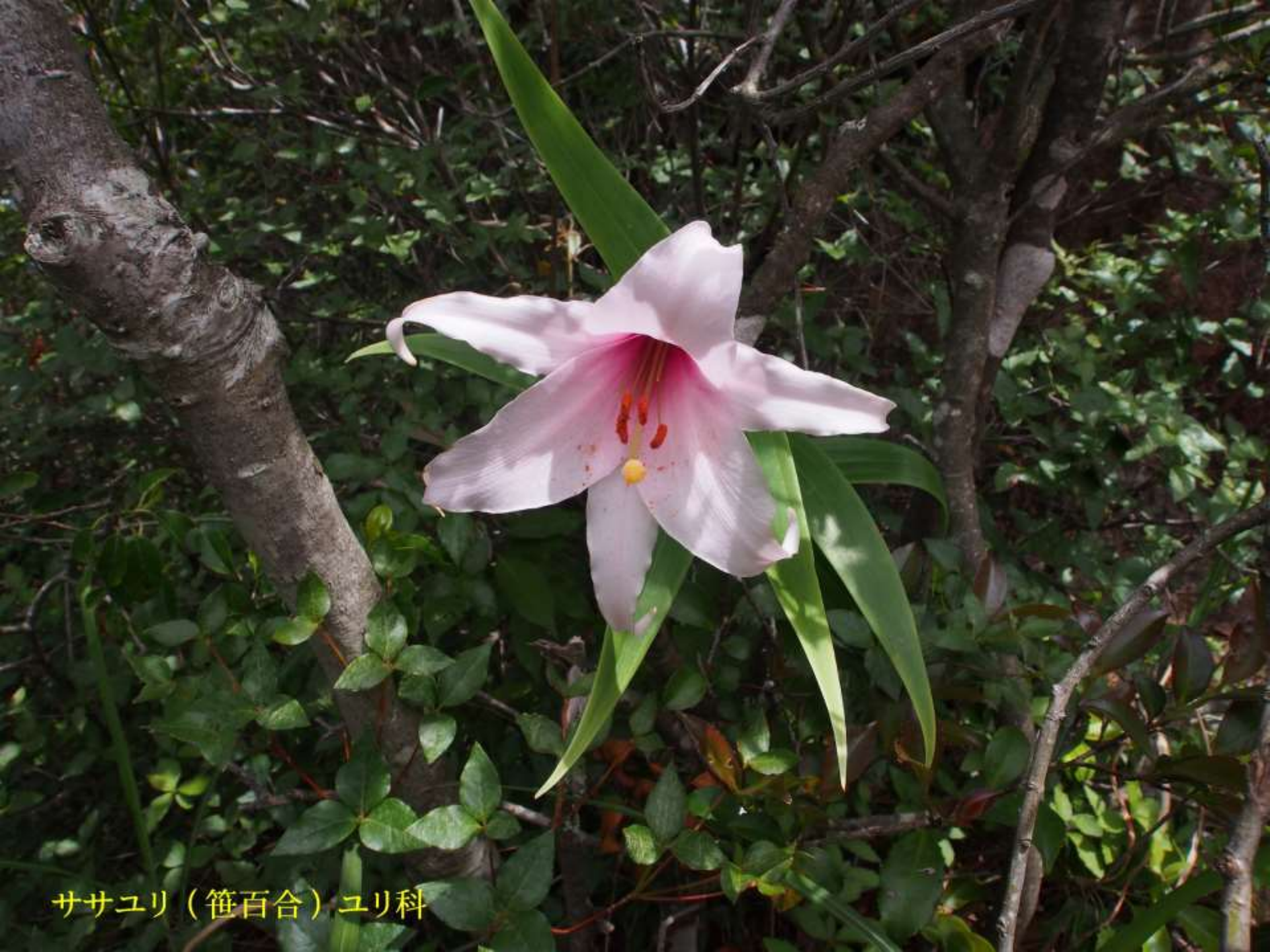
ササユリ（笹百合）ユリ科