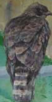
クマタカ ツシタカ科 留鳥(ツシタカ)