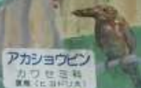
アカショウビン カブセミ科 留鳥(ヒヨドリ)