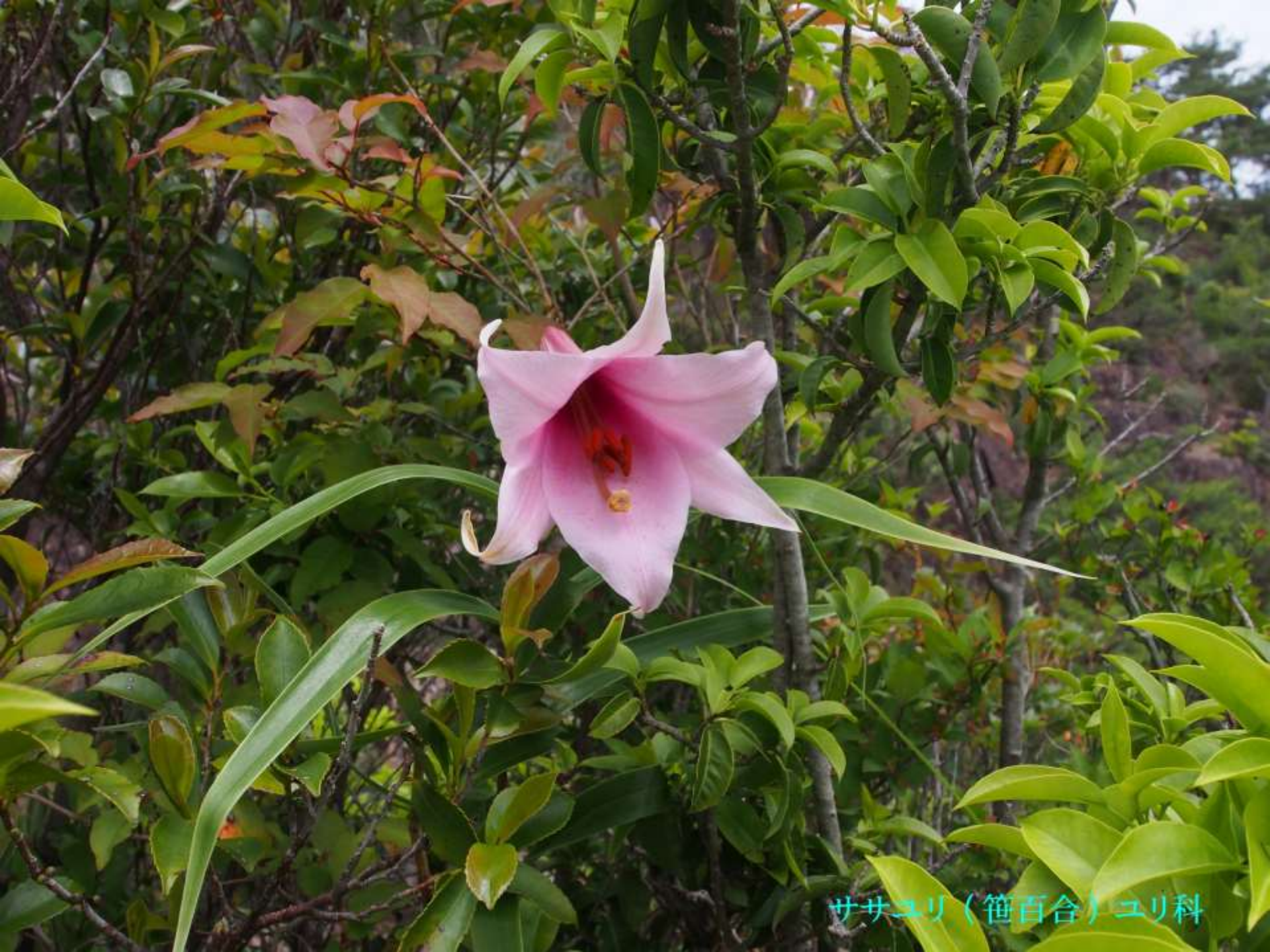
ササユリ（笹百合）ユリ科