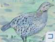
コジケイ キジ科 留鳥(ヒト)