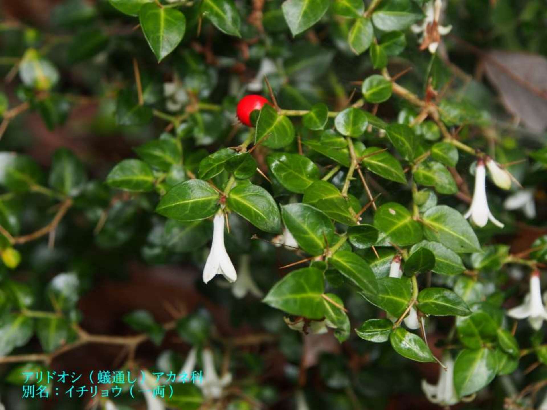
アリドオシ（蟻通し）アカネ科 別名：イチリョウ（一両）