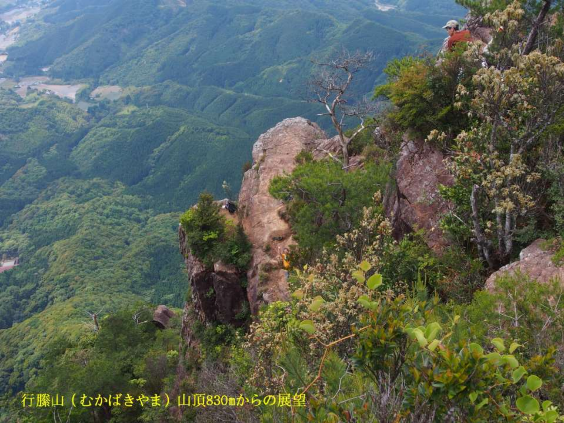
行藤山（むかばきやま）山頂830mからの展望