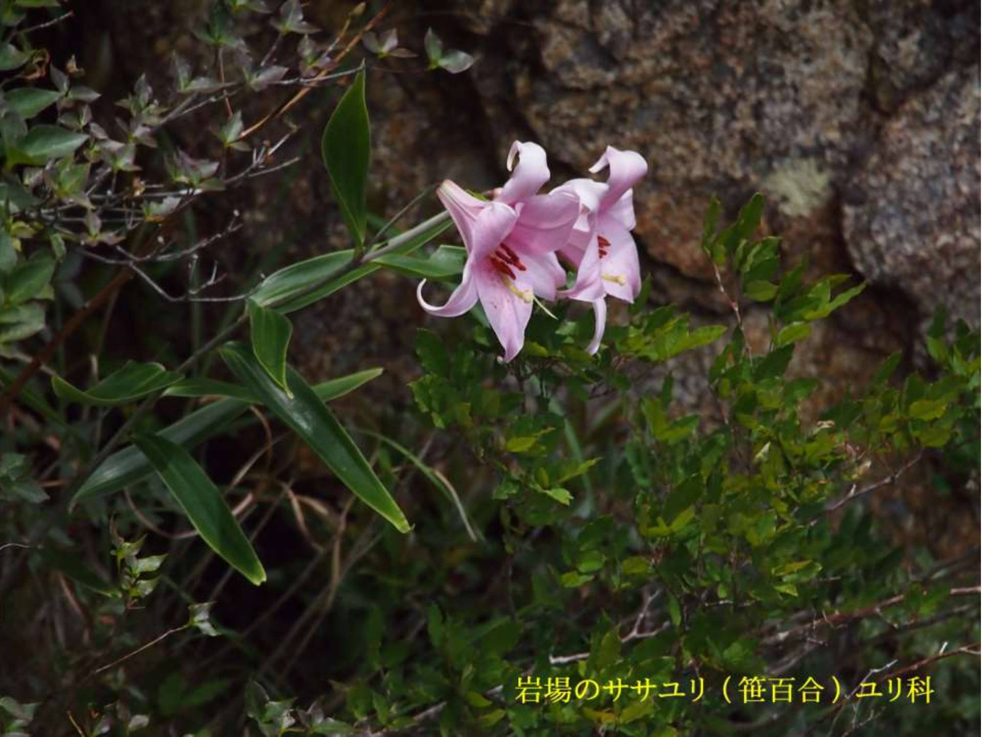
岩場のササユリ（笹百合）ユリ科