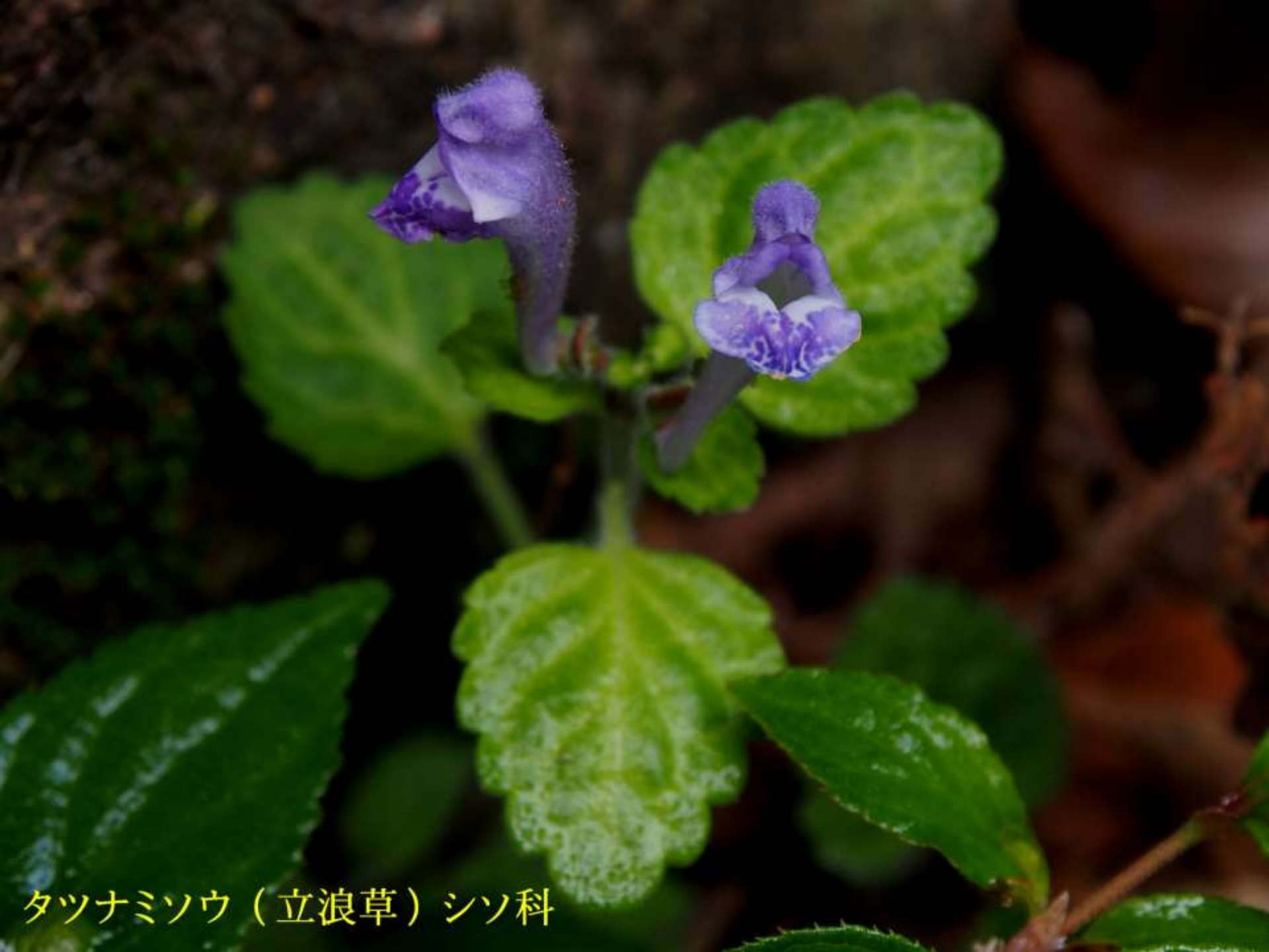
タツナミソウ（立浪草）シソ科