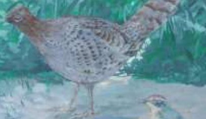
アオゲラ キツキ科 留鳥(ヒヨドリ)