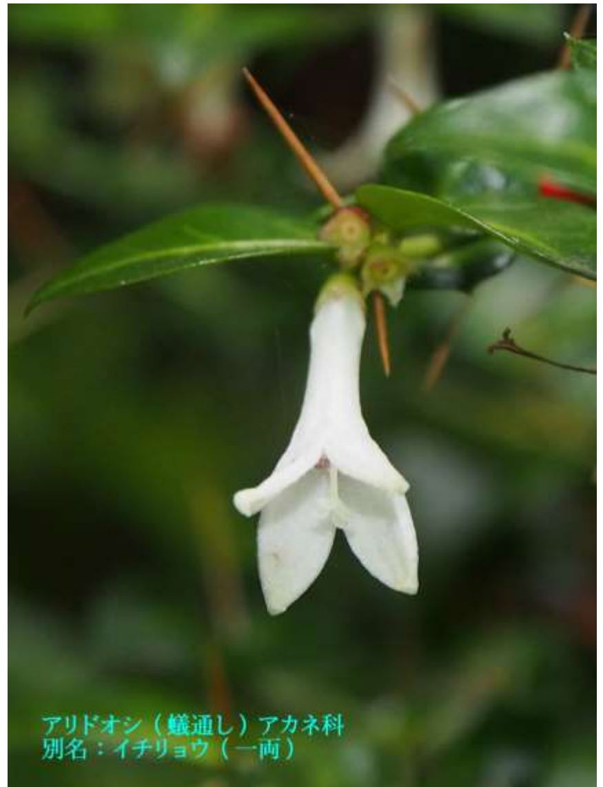
アリドオン（蟻通し）アカネ科 別名：イチリョウ（一両）