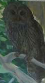
フクロウ フクロウ科 留鳥(フクロウ)