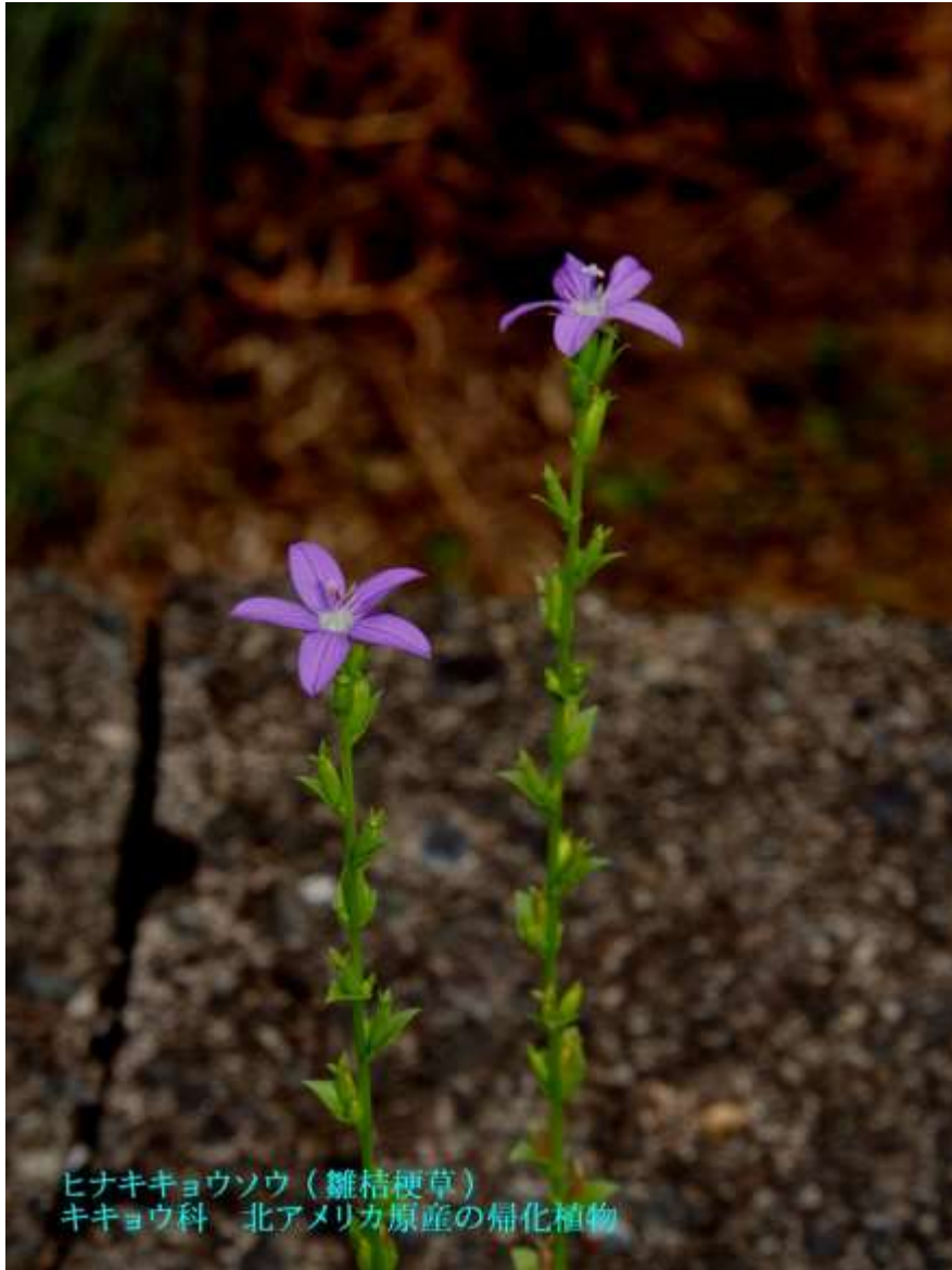
ヒナキキョウソウ（雛桔梗草） キキョウ科 北アメリカ原産の帰化植物