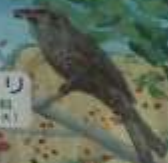
ヒヨドリ ヒヨドリ科 留鳥(ヒヨドリ)