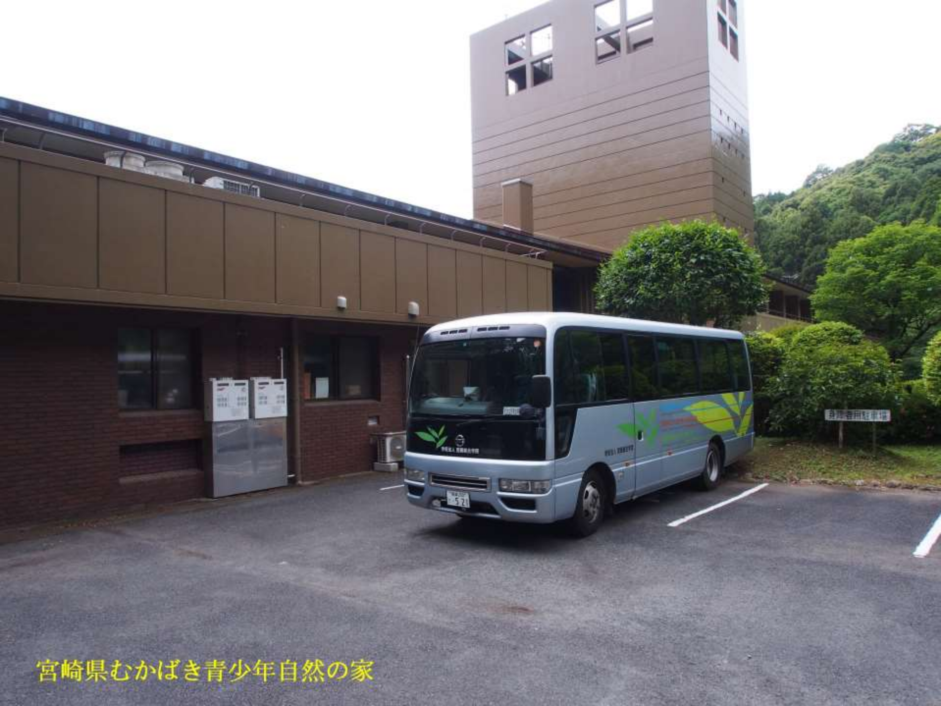
宮崎県むかばき青少年自然の家