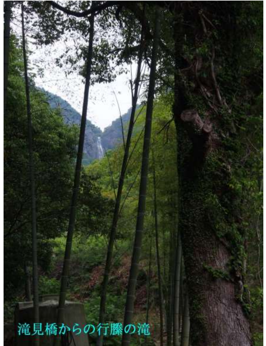
滝見橋からの行藤の滝