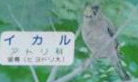
イカル 鷹科 留鳥(ヒヨドリ)