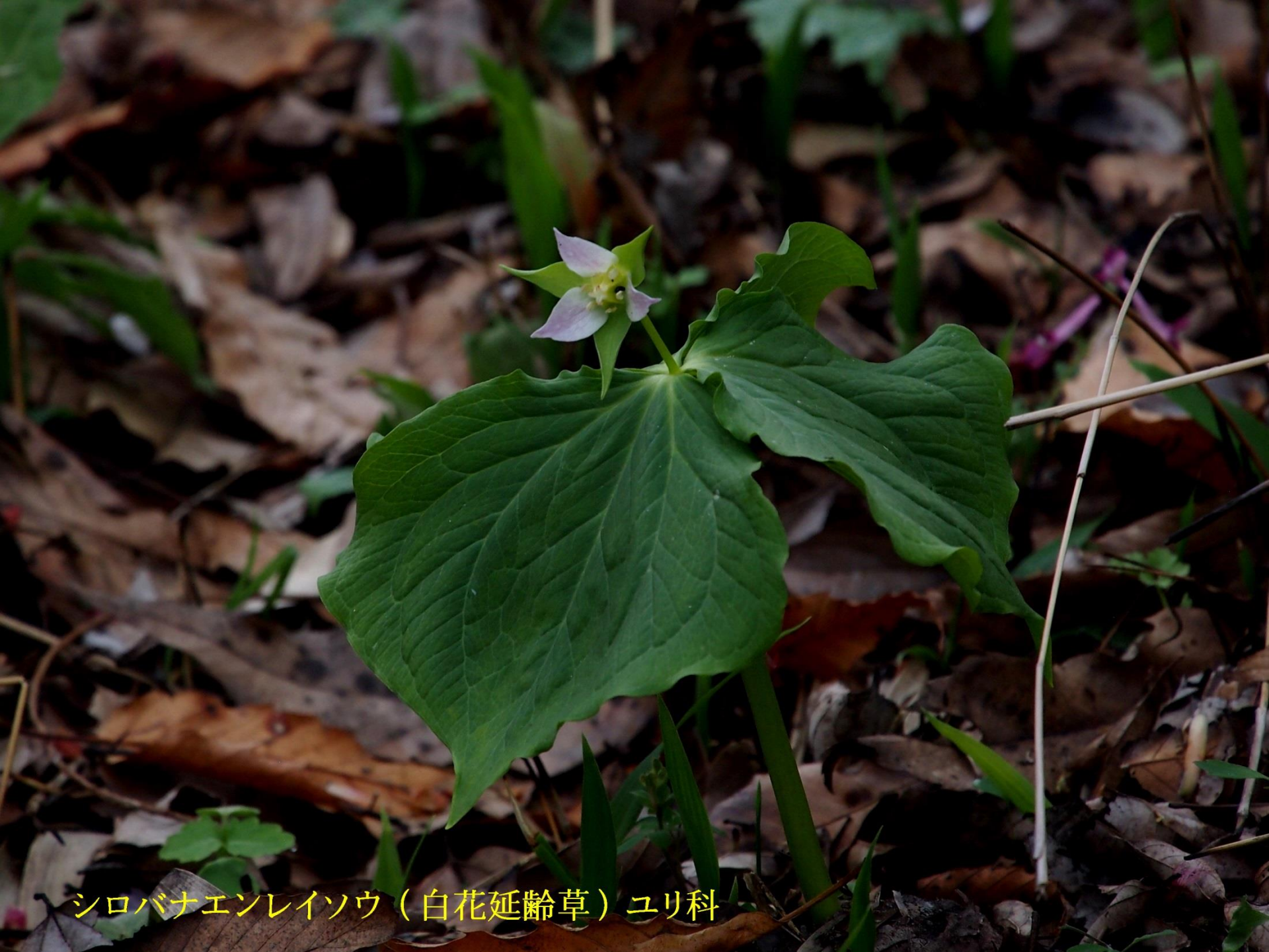
シロバナエンレイソウ（白花延齡草）ユリ科