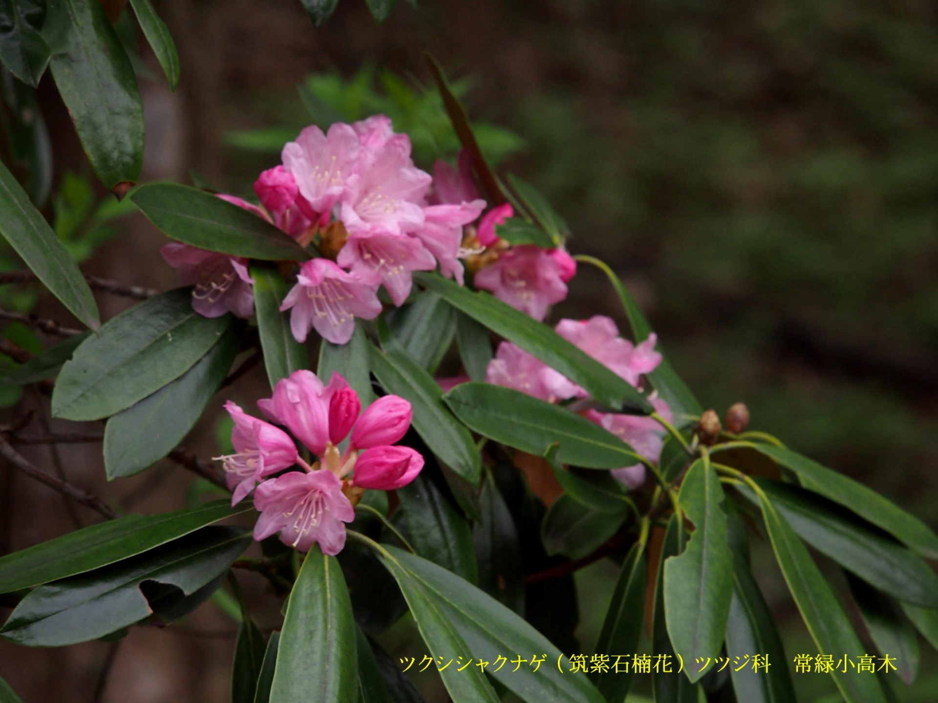
ツクシシャクナゲ（筑紫石楠花）ツツジ科 常緑小高木