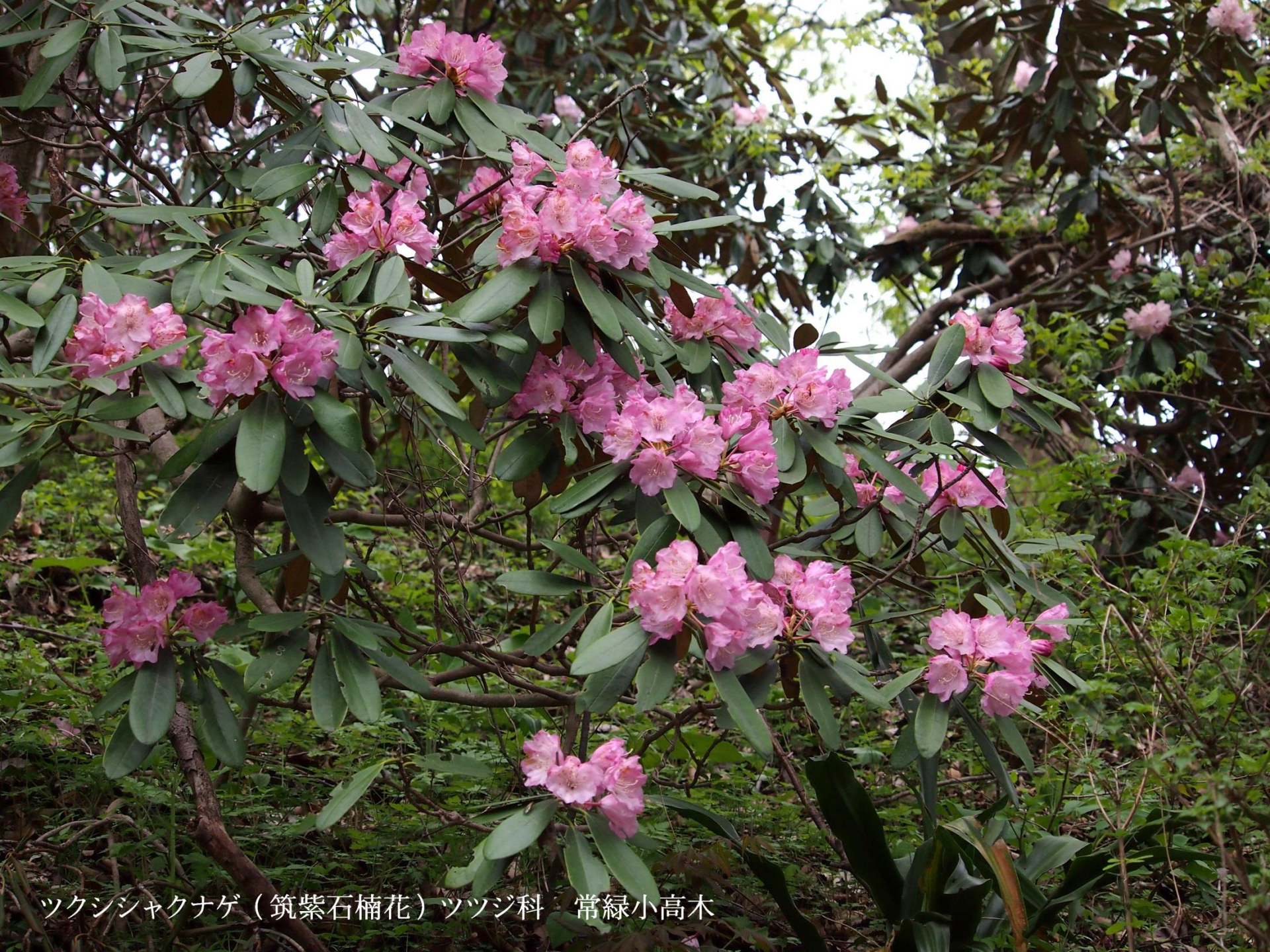
ツクシシャクナゲ（筑紫石楠花）ツツジ科 常緑小高木