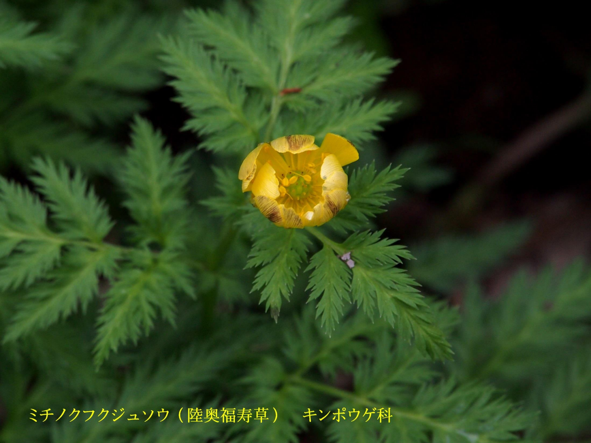
ミチノクフクジュソウ（陸奥福寿草） キンポウゲ科