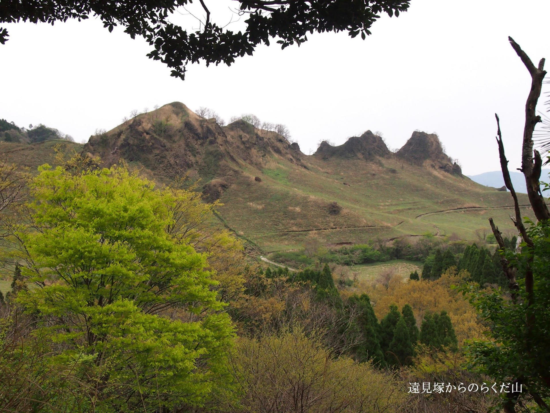
遠見塚からのらくだ山