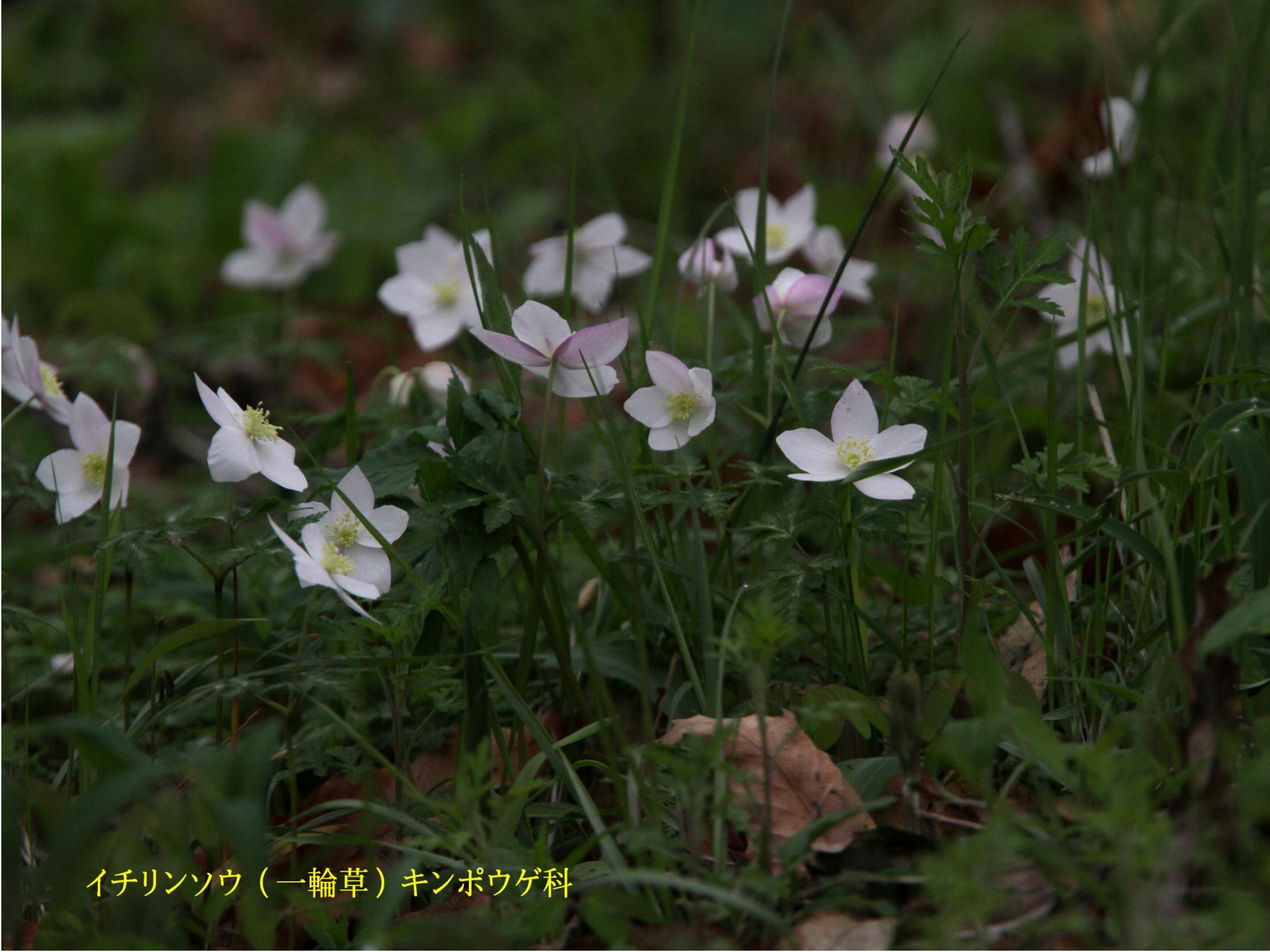
イチリンソウ（一輪草）キンポウゲ科