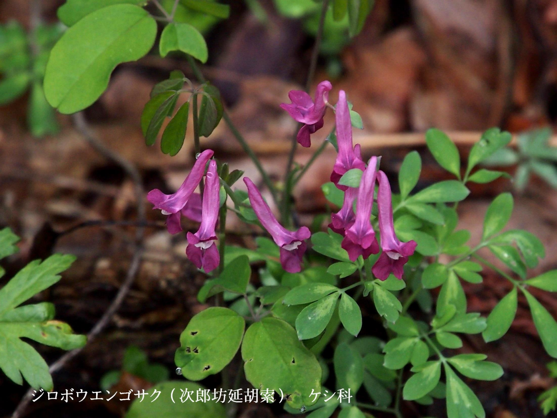
ジロボウエンゴサク（次郎坊延胡索） ケシ科