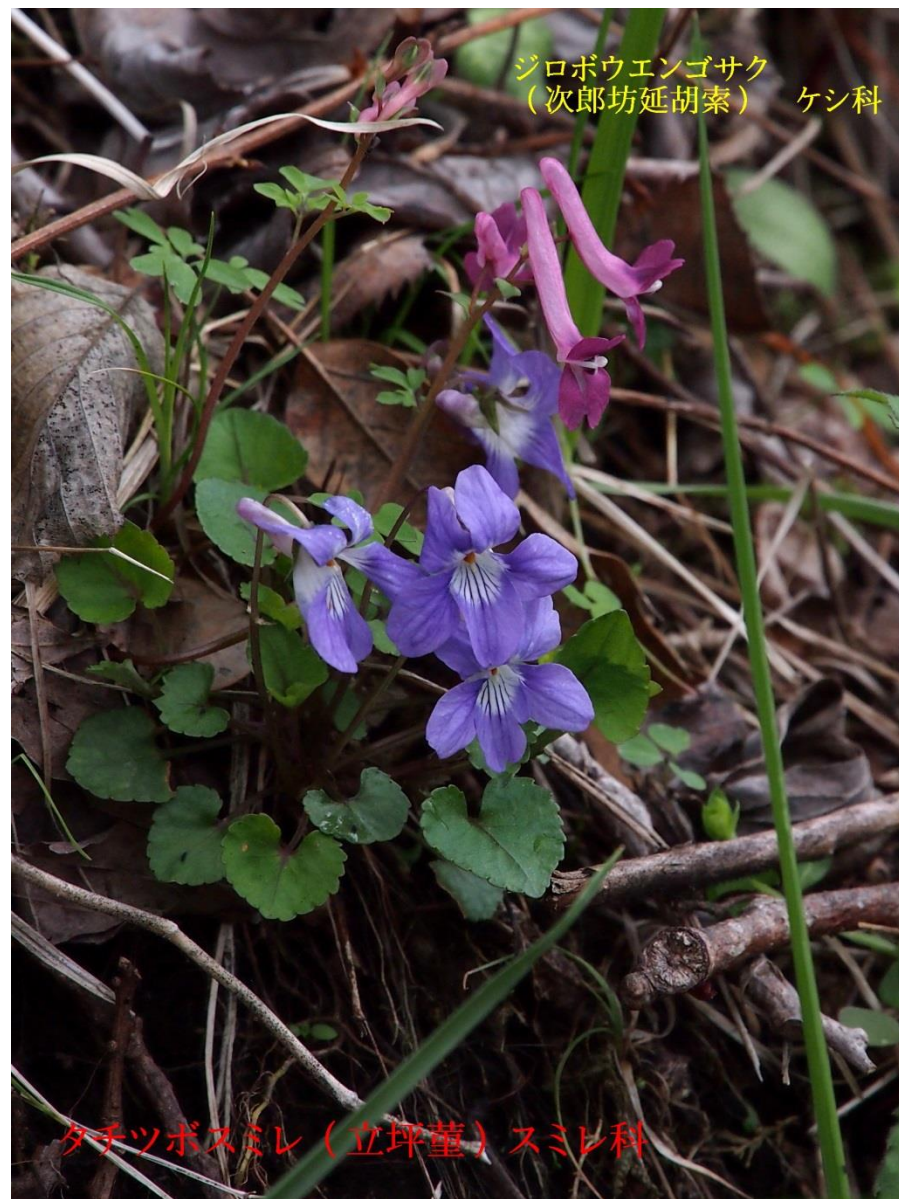
ジロボウエンゴサク (次郎坊延胡索) ケシ科