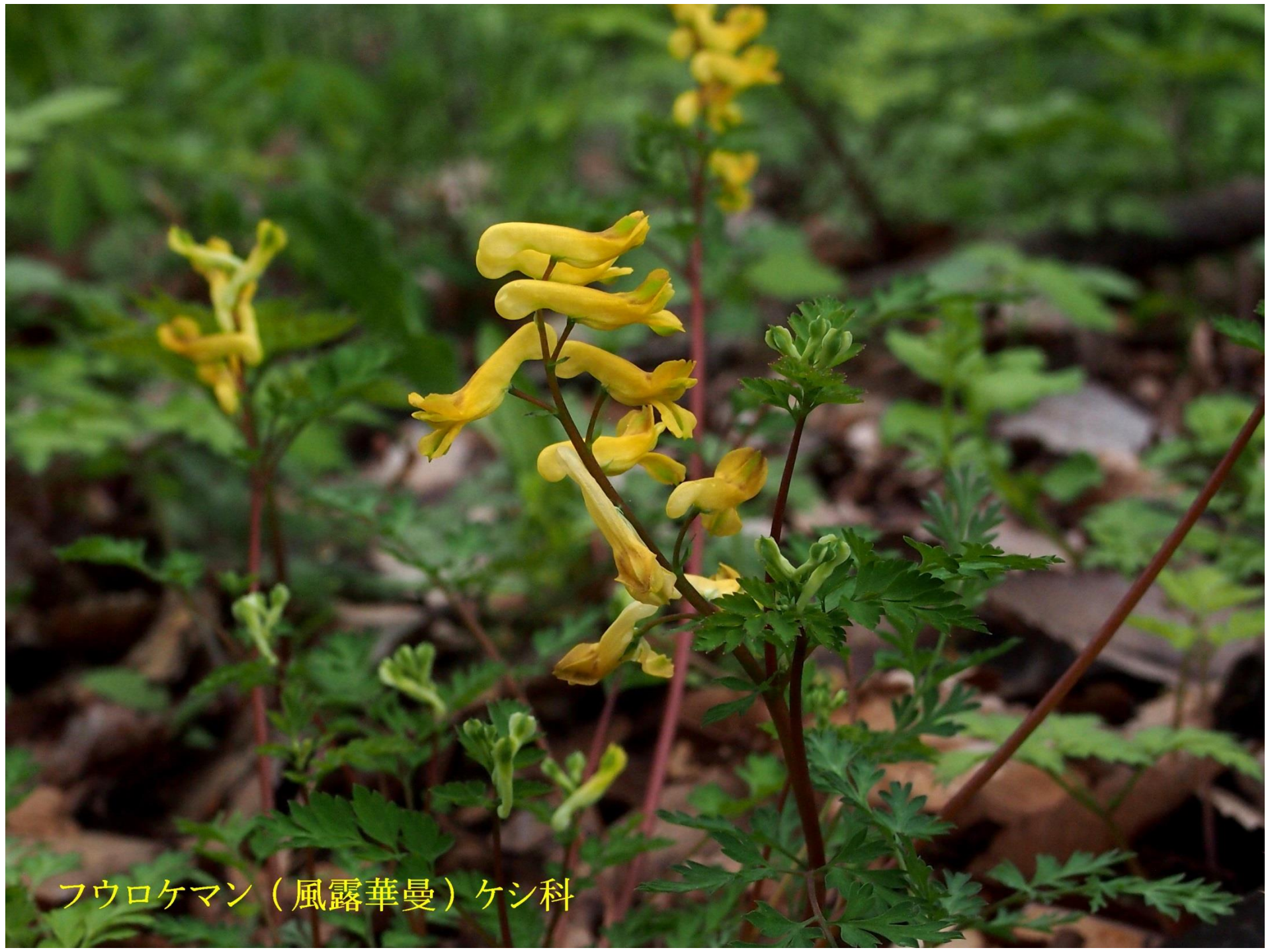
フウロケマン（風露華曼）ケシ科