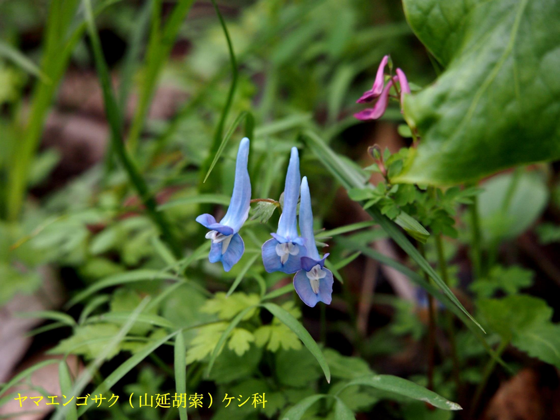
ヤマエンゴサク（山延胡索）ケシ科