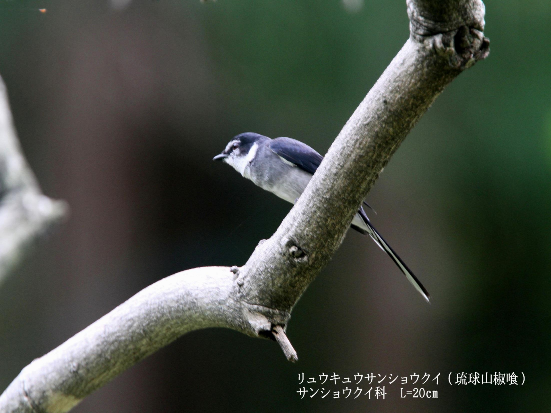
リュウキュウサンショウクイ（琉球山椒喰） サンショウクイ科 L=20cm