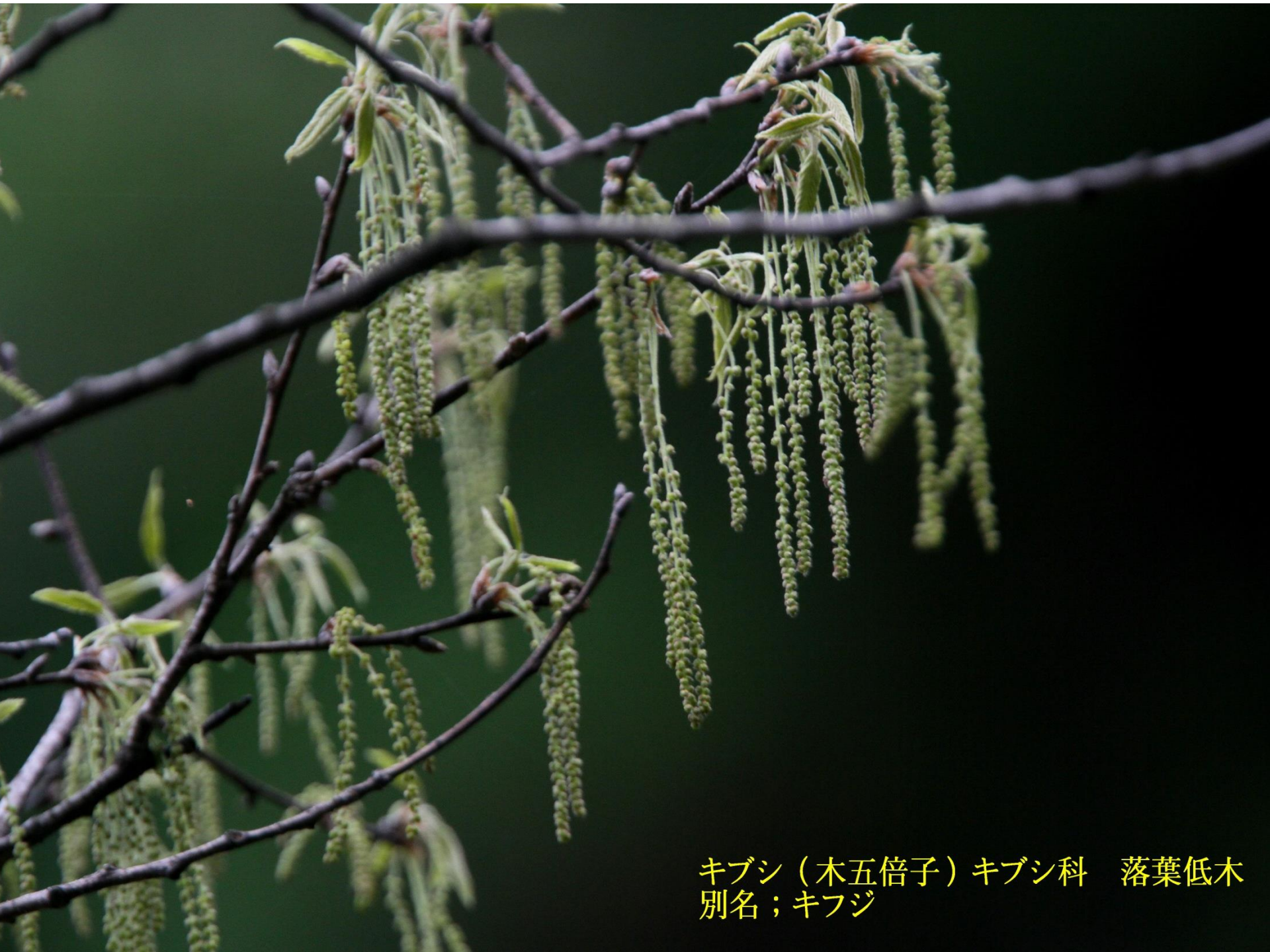
キブシ（木五倍子）キブシ科 落葉低木 別名；キフジ