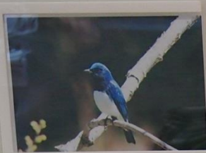
りのきのサンショウクイ