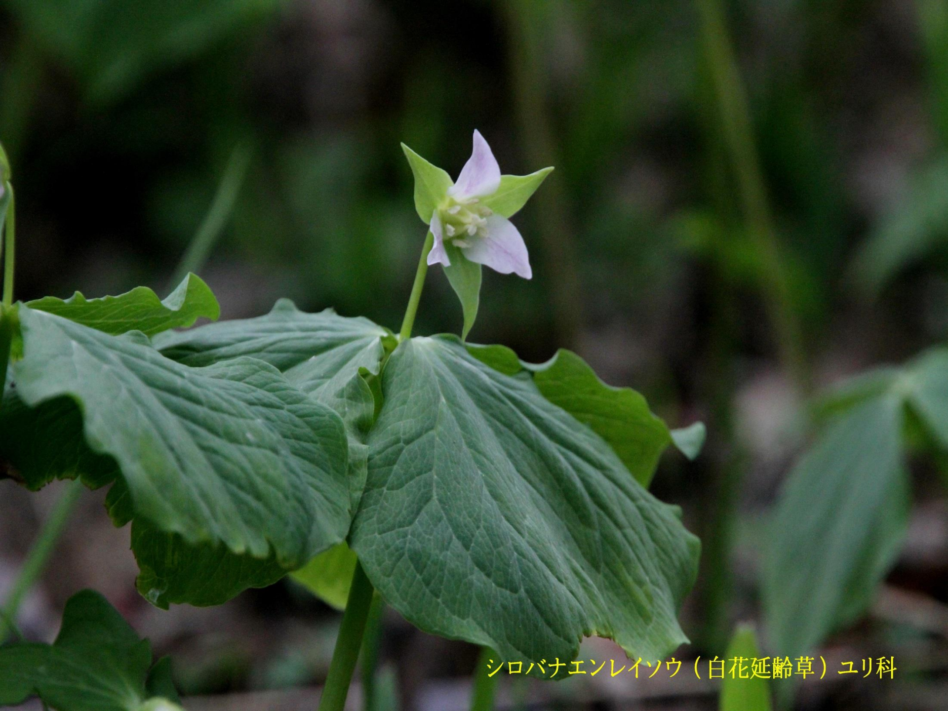
シロバナエンレイソウ（白花延齡草）ユリ科