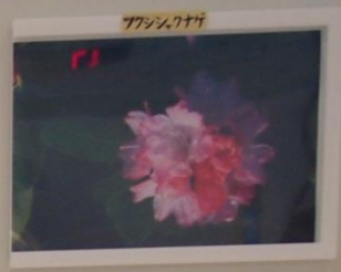
アソシロバナエンレイ