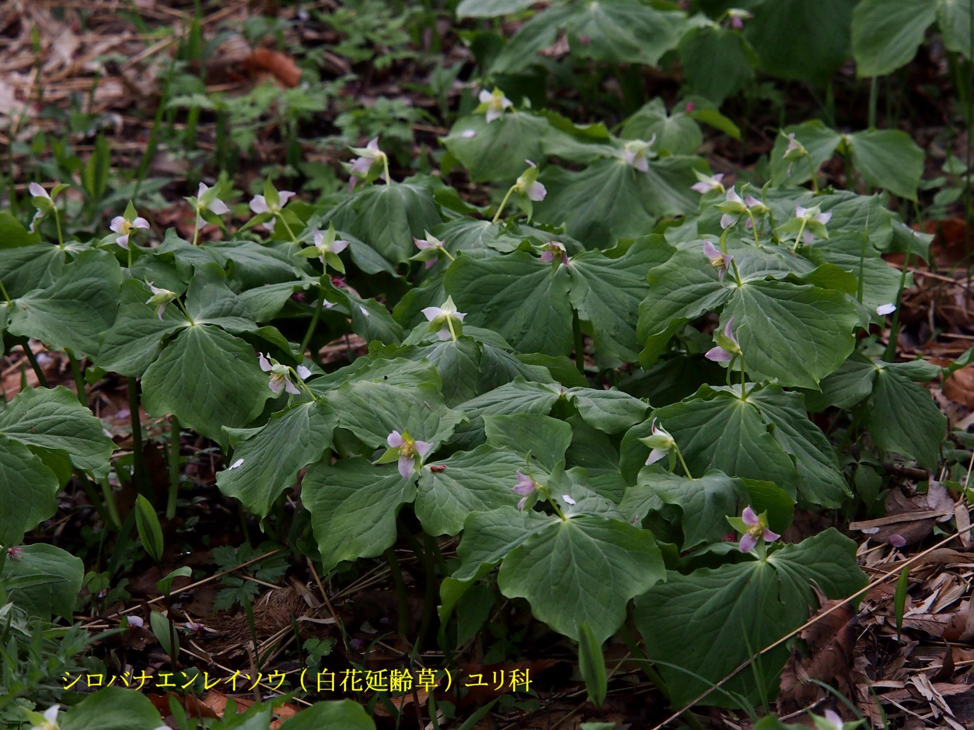
シロバナエンレイソウ（白花延齢草）ユリ科