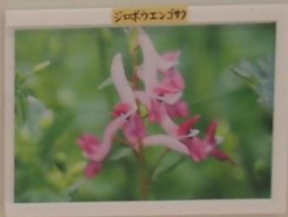
シロバナエンレイ