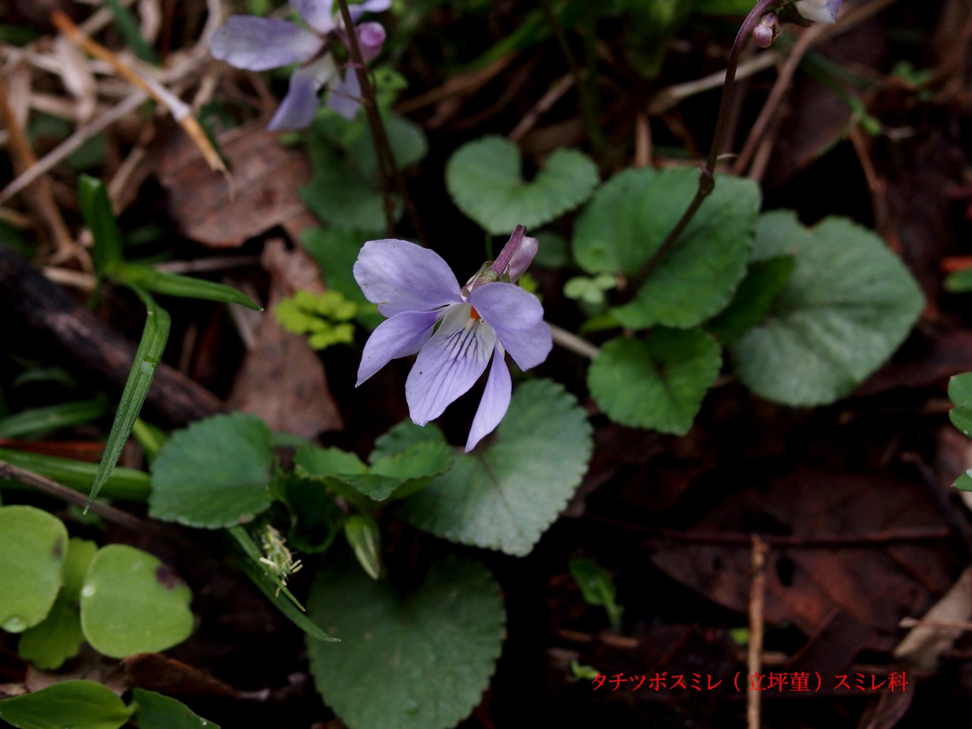
タチツボスミレ（立坪堇）スミレ科