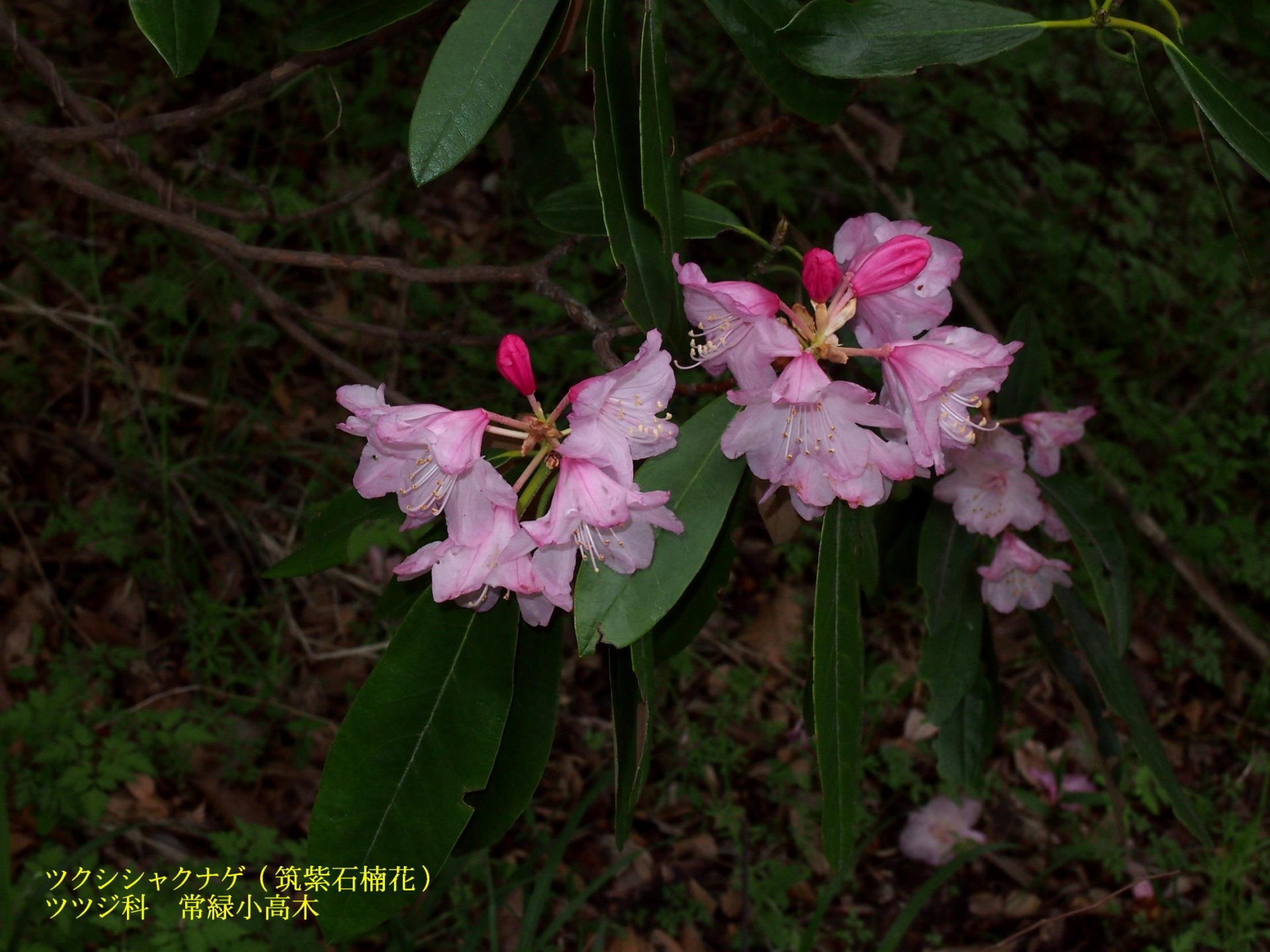
ツクシシャクナゲ（筑紫石楠花） ツツジ科 常緑小高木