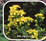
アキノキリンソウ

Each year, from May to June, Kyushu azaleas burst into bloom in a belt surrounding the volcanic wastelands, creating one of Japan's quintessential spring images. Called kyushu azalea in Japanese, the plant grows only on Kyushu, an island to the southwest of the main Japanese archipelago. "Parade of Kyushu," the azaleas grace the hills, mountains, and valleys in addition to Aso. Growing in the midst of harsh environmental conditions such as volcanic ash and gases, Kyushu's azalea stands as one of nature's most breathtaking creations. Still, however, each time volcanic eruptions, landslides, and other disasters strike the islands, the plants are often killed.