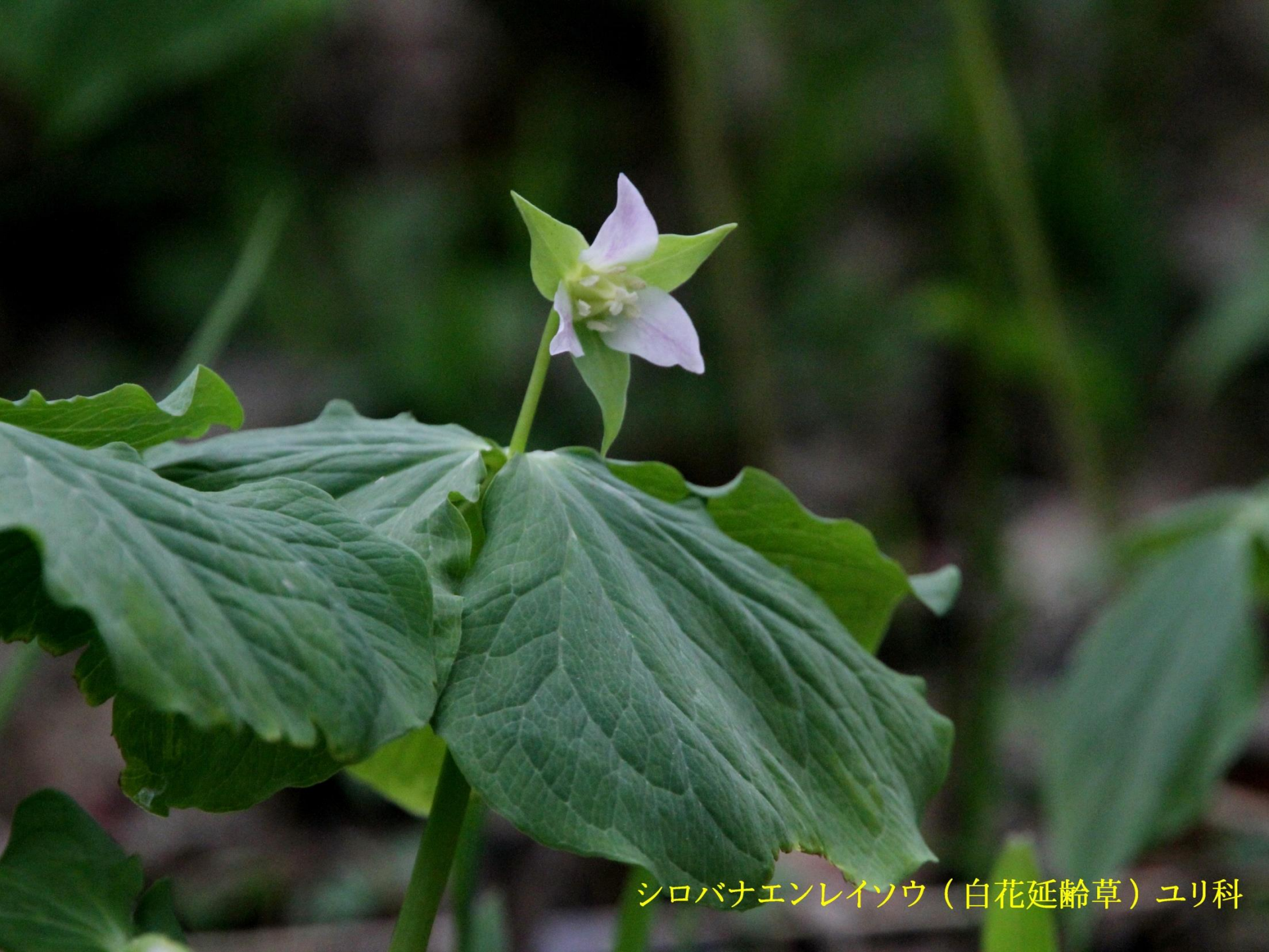
シロバナエンレイソウ（白花延齡草）ユリ科