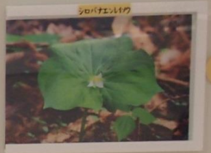
シロバナエンレイ