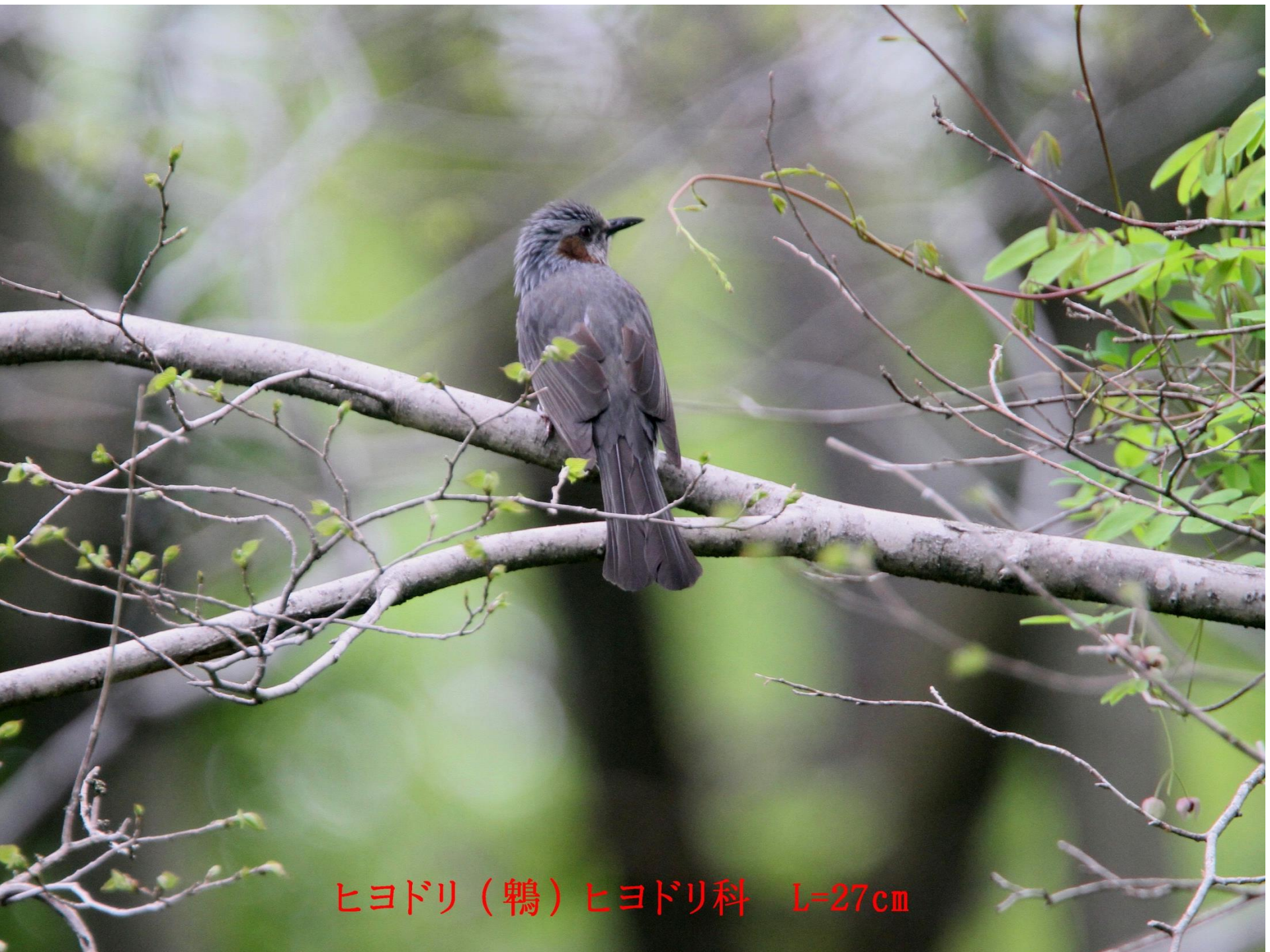
ヒヨドリ (鶉) ヒヨドリ科 L=27cm