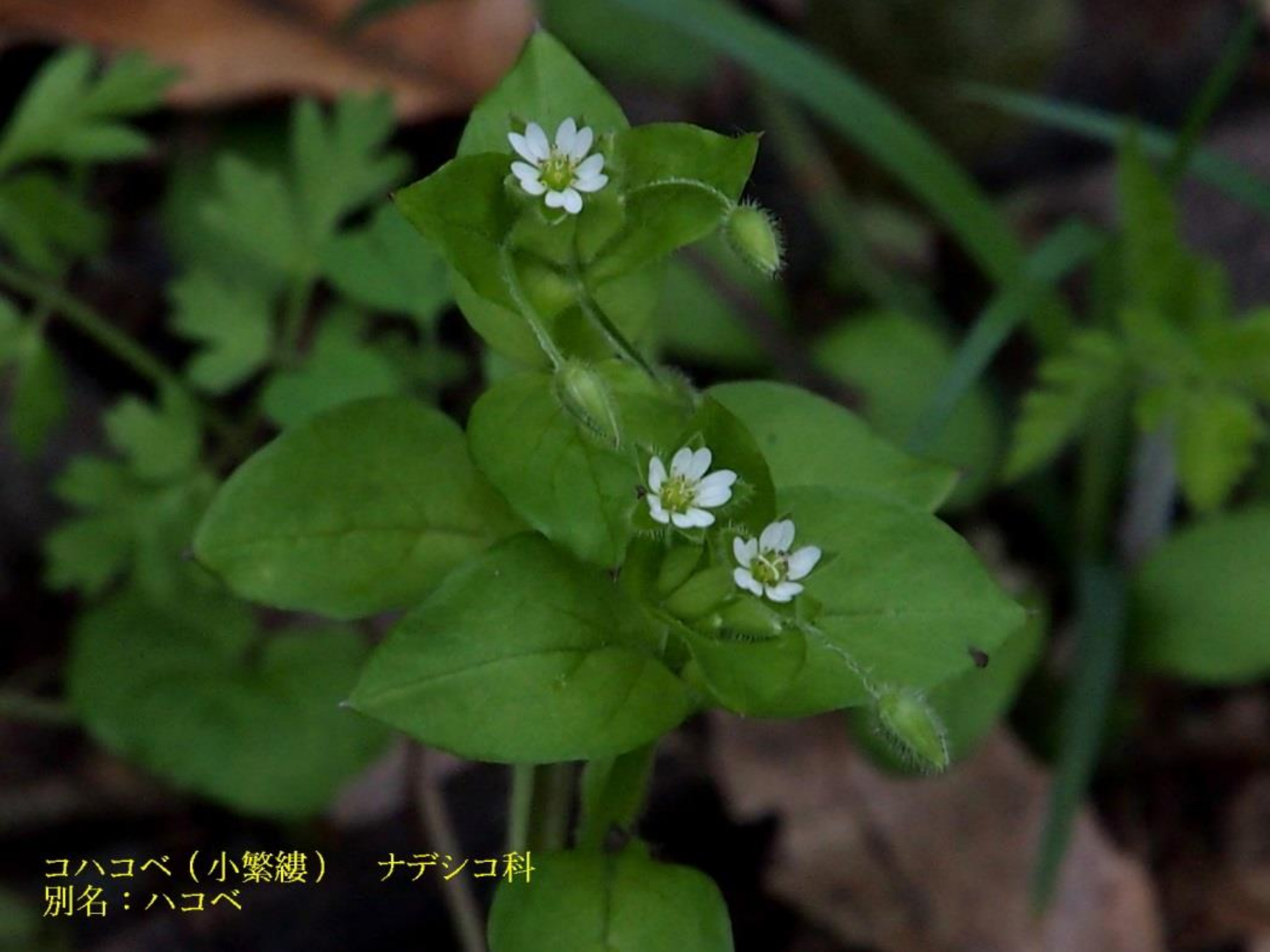
コハコベ (小繁縷) ナデシコ科 別名：ハコベ