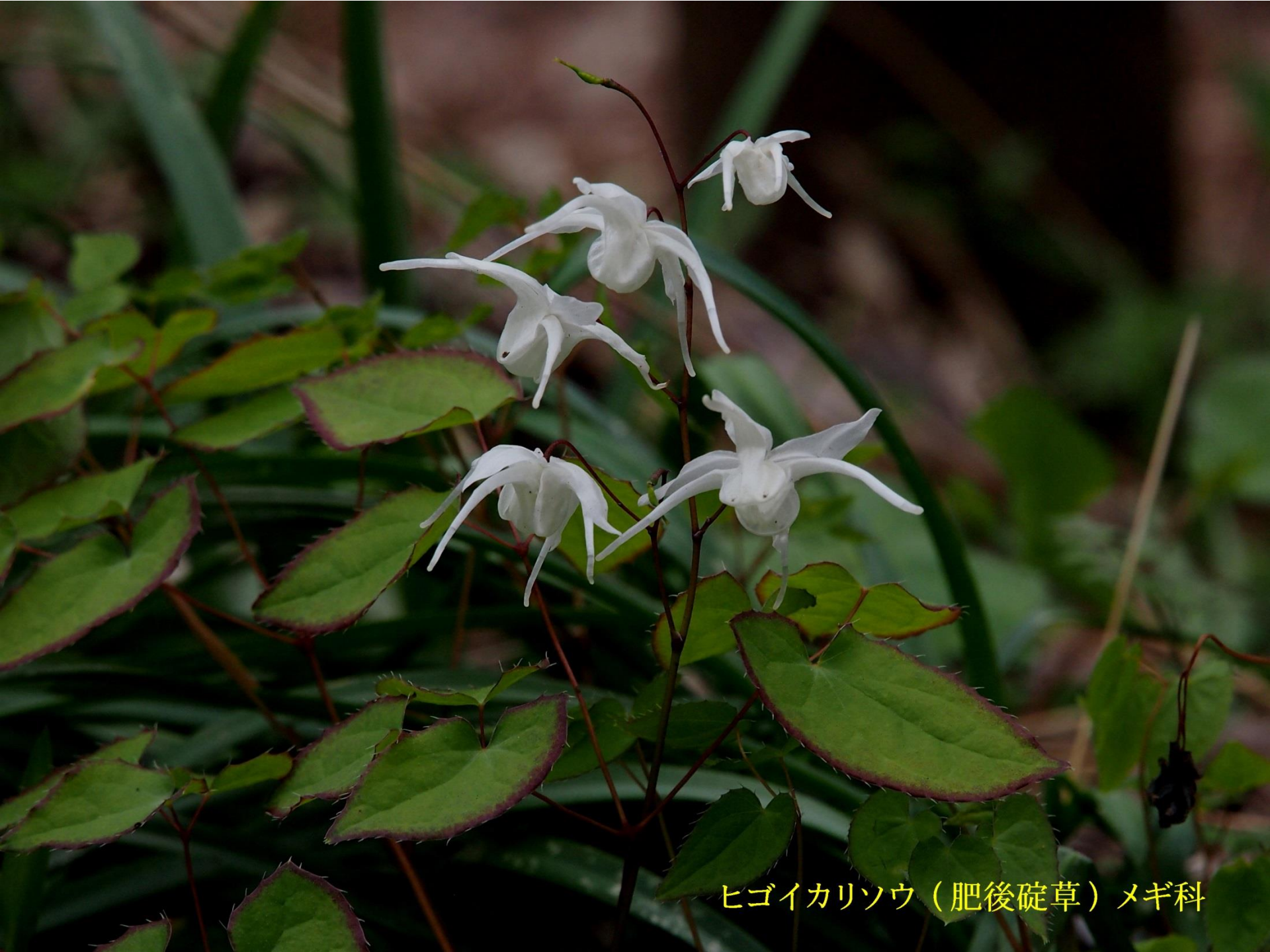
ヒゴイカリソウ（肥後碓草）メギ科