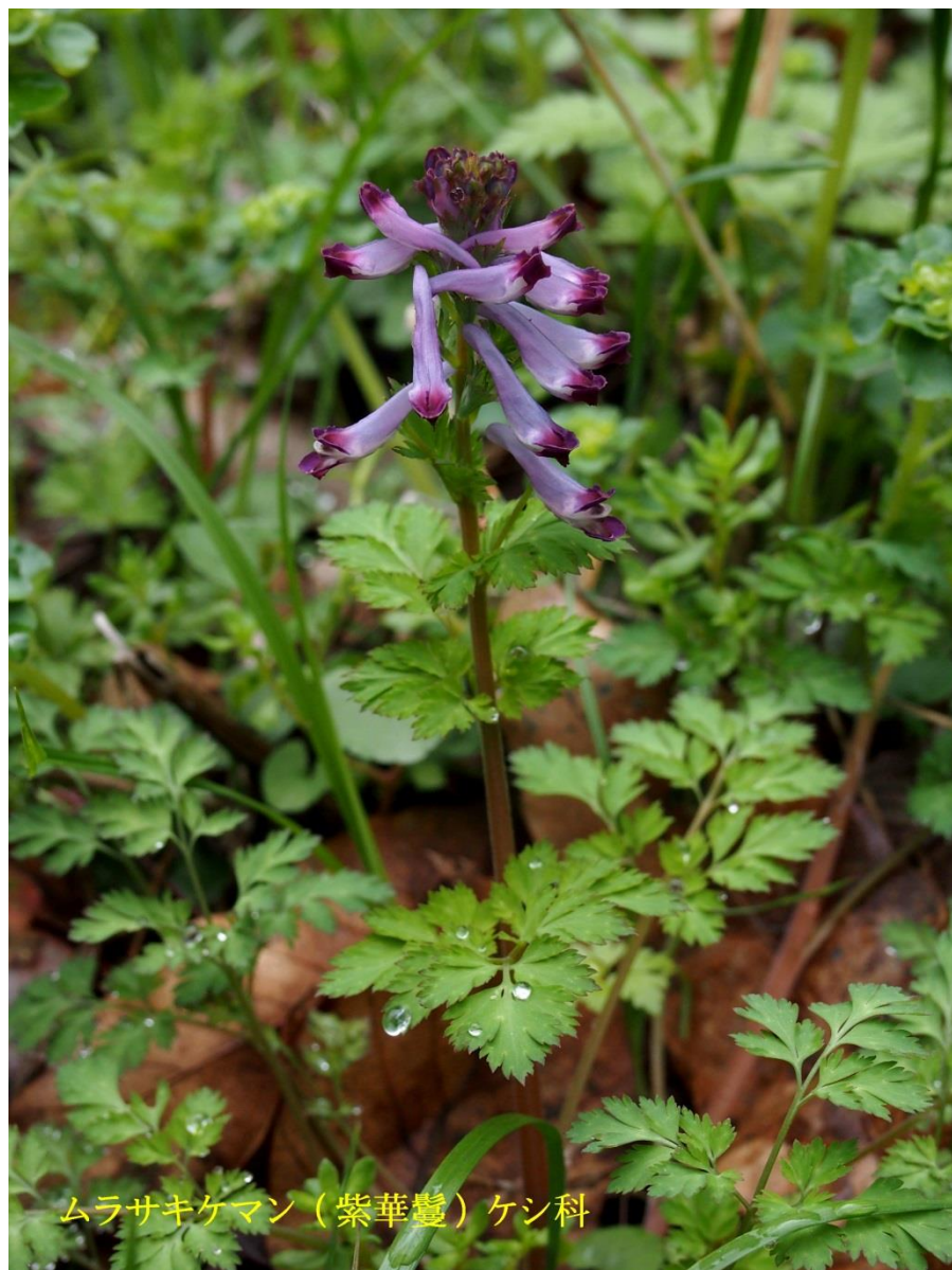
ムラサキケマン (紫華鬘) ケシ科