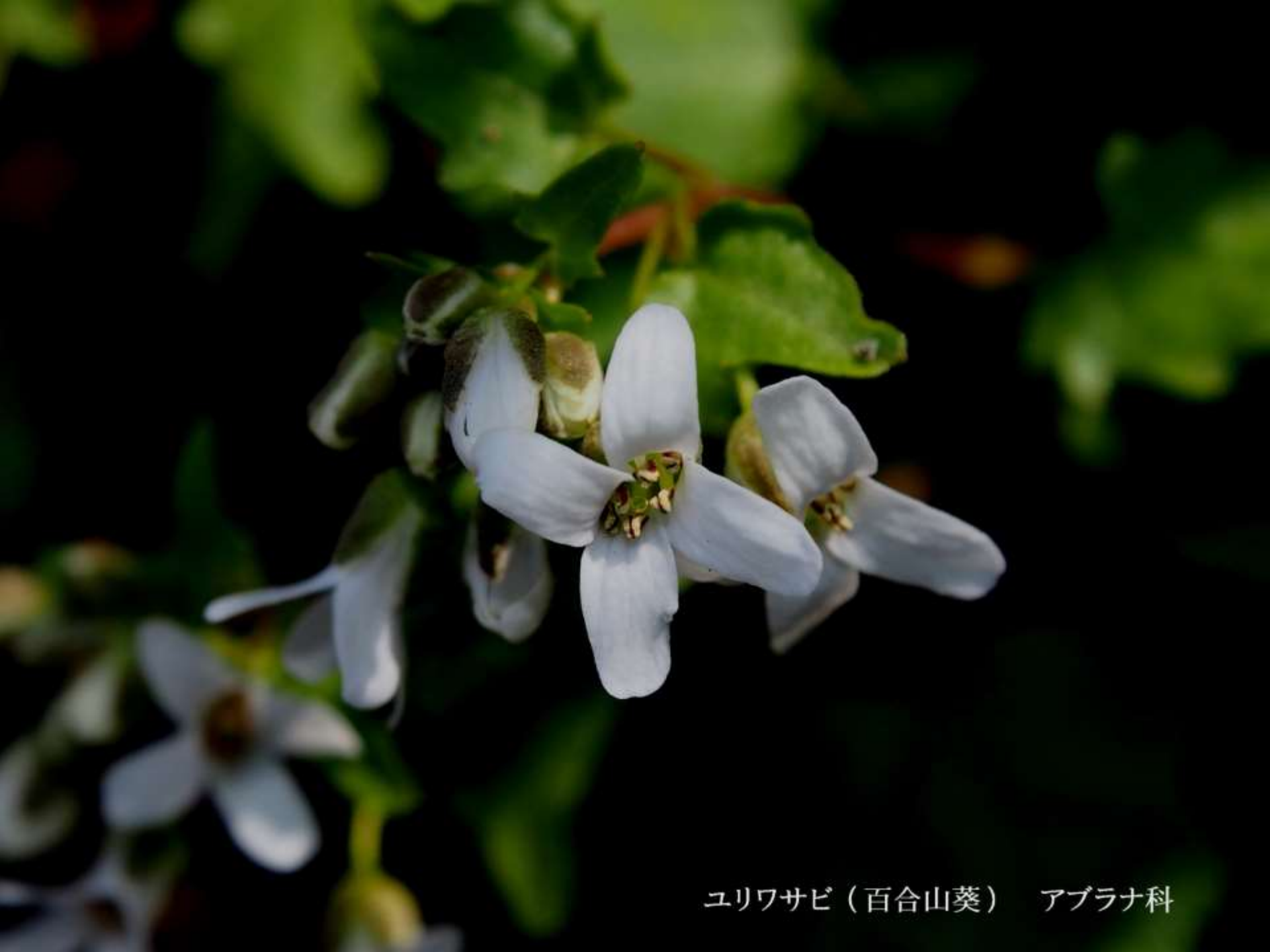
ユリワサビ（百合山葵） アブラナ科