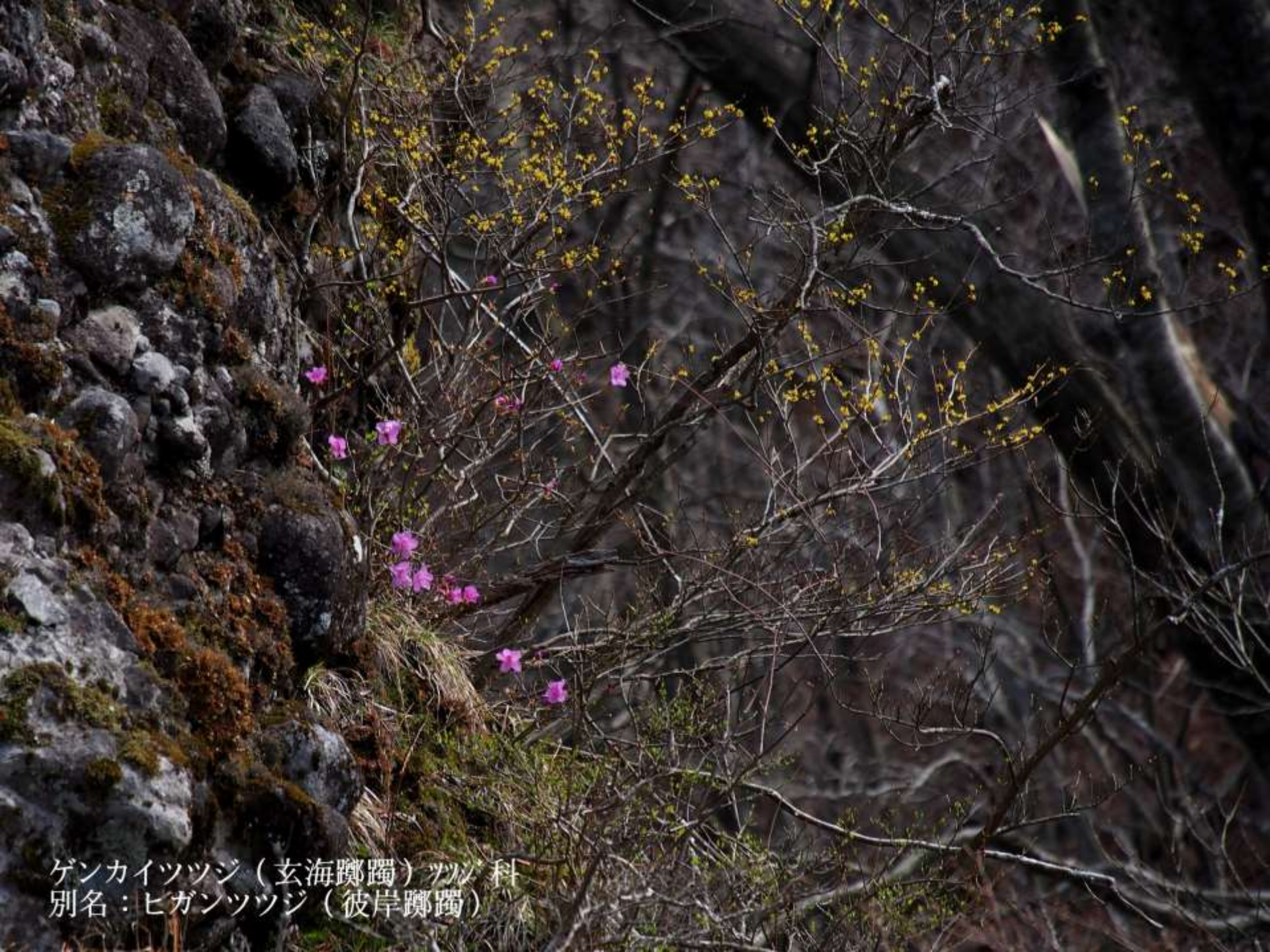
ゲンカイツツジ（玄海躑躅）ツツジ科 別名：ヒガンツツジ（彼岸躑躅）