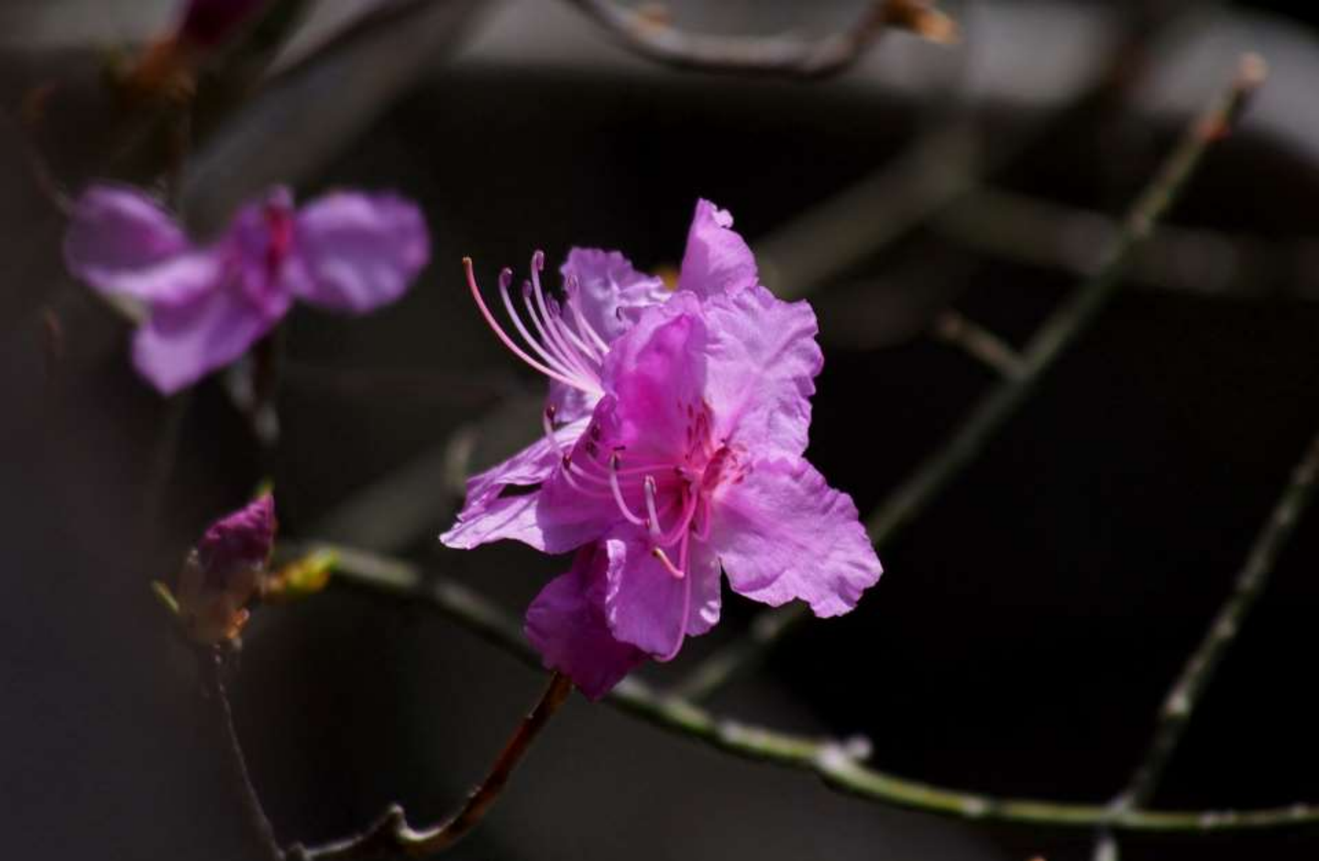
ゲンカイツツジ（玄海躑躅）ツツジ科 別名：ヒガンツツジ（彼岸躑躅）