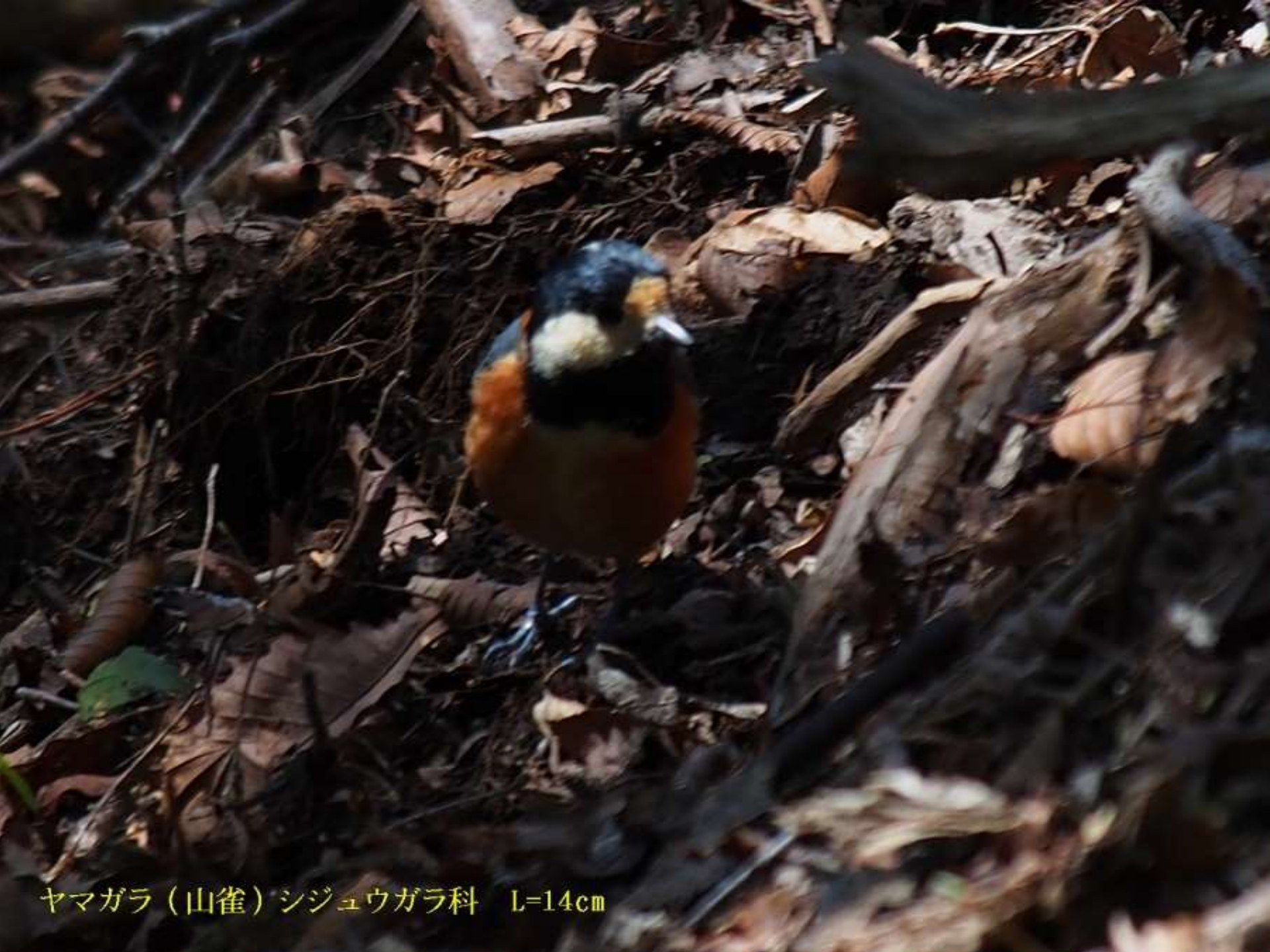
ヤマガラ（山雀）シジュウガラ科 L=14cm