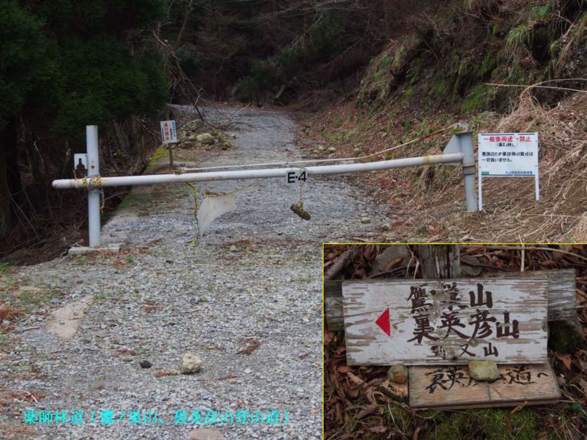
栗師林道（鷹ノ巣山、栗彦山登山道）