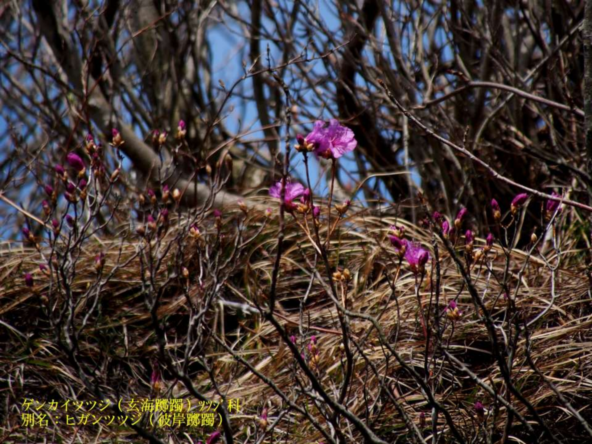
デンカイツツジ（玄海躑躅）ツツジ科 別名：ヒガンツツジ（彼岸躑躅）