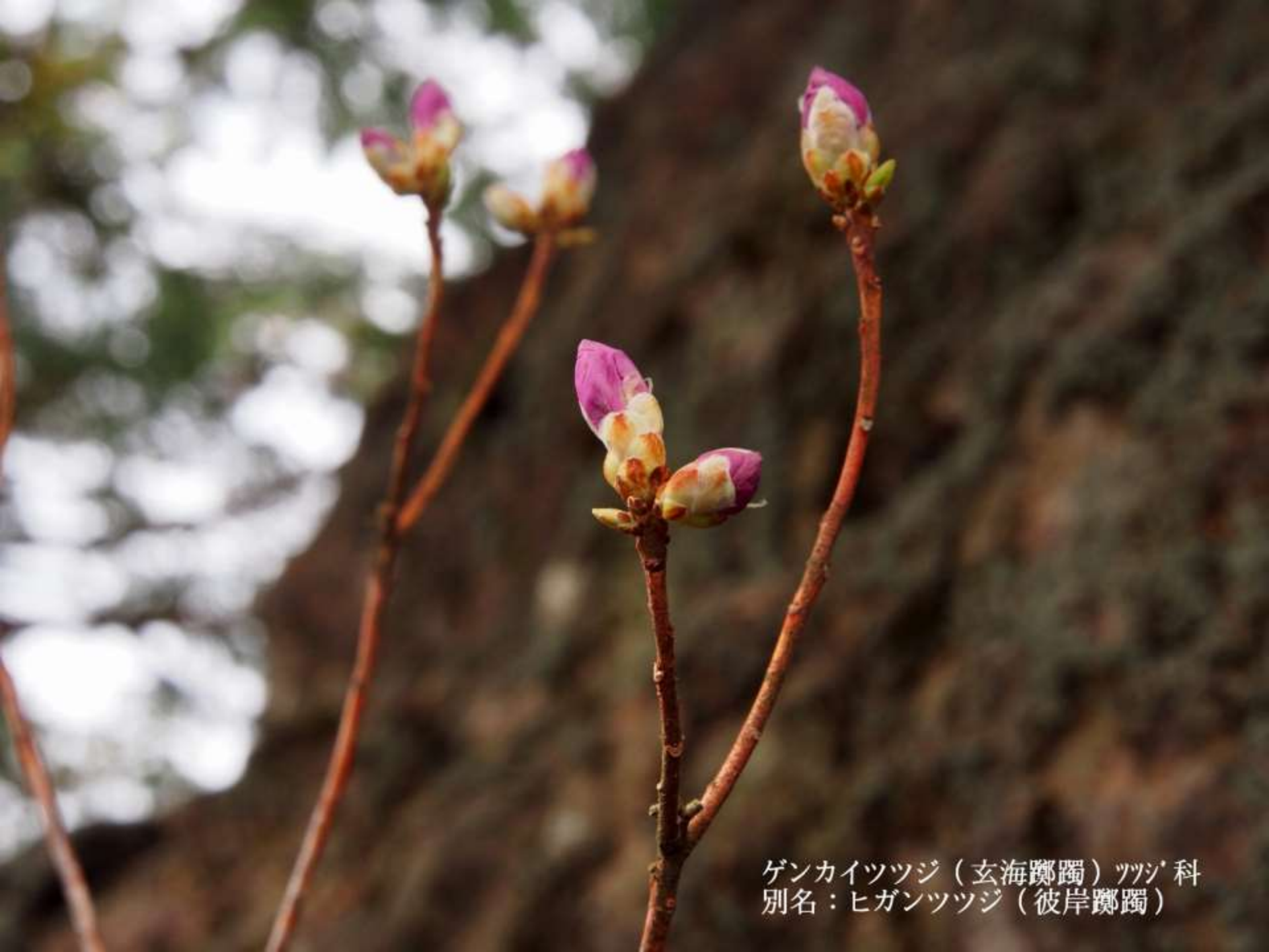
ゲンカイツツジ（玄海躑躅）ツツジ科 別名：ヒガンツツジ（彼岸躑躅）