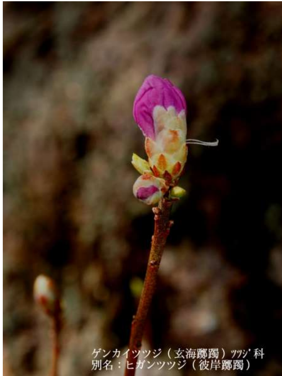
ゲンカイツツジ（玄海躑躅）ツツジ科 別名：ヒガンツツジ（彼岸躑躅）