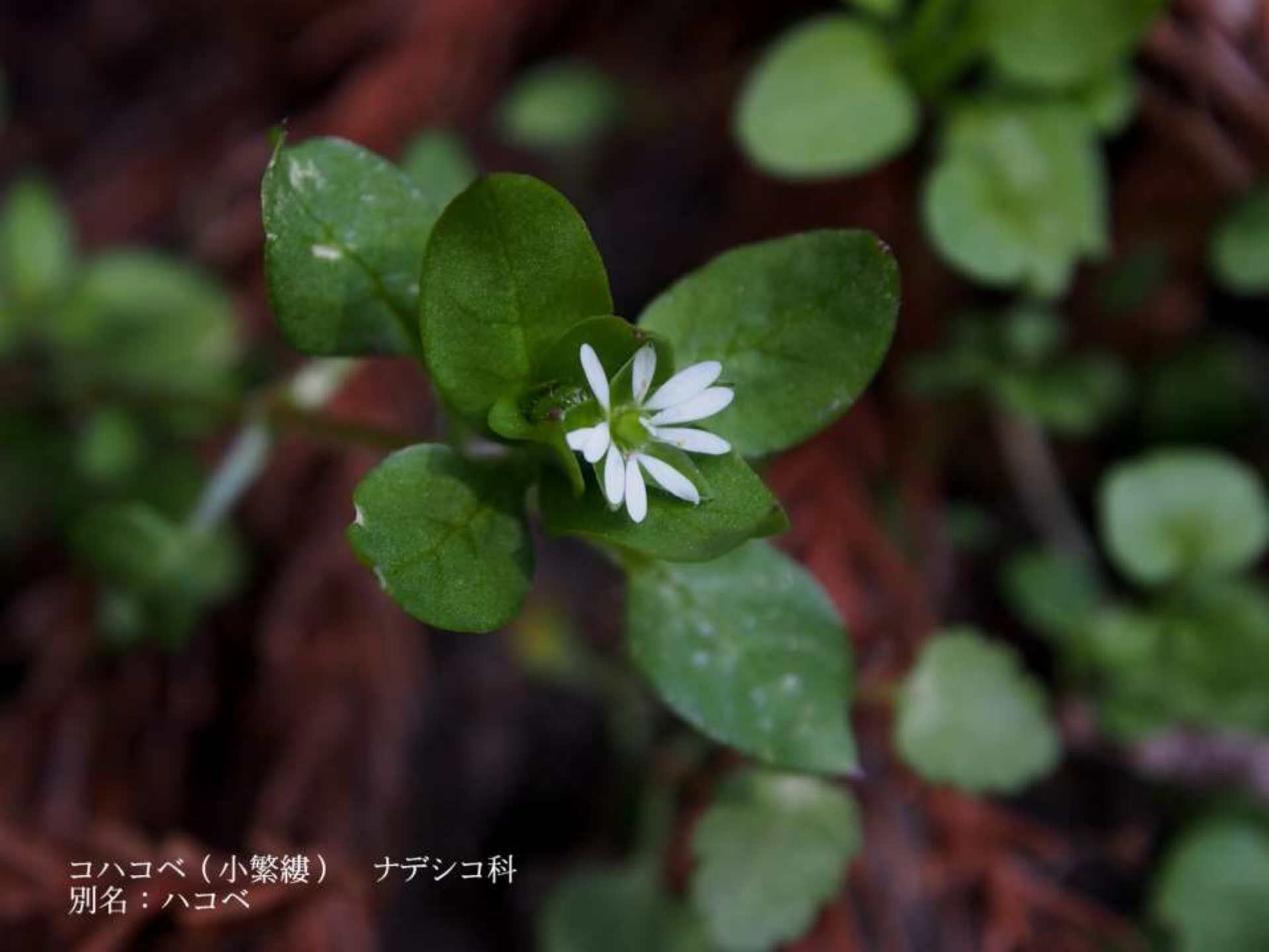
コハコベ（小繁縷） ナデシコ科 別名：ハコベ