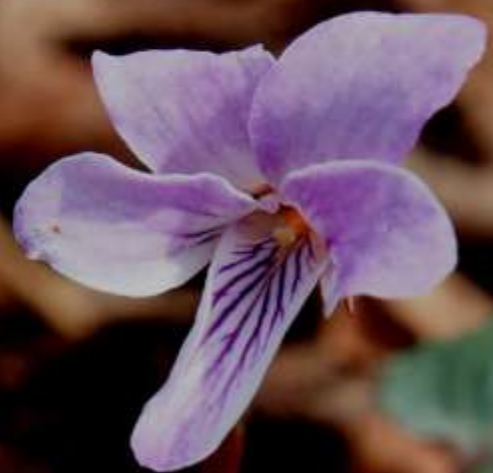
シハイスミレ（紫背堇）スミレ科