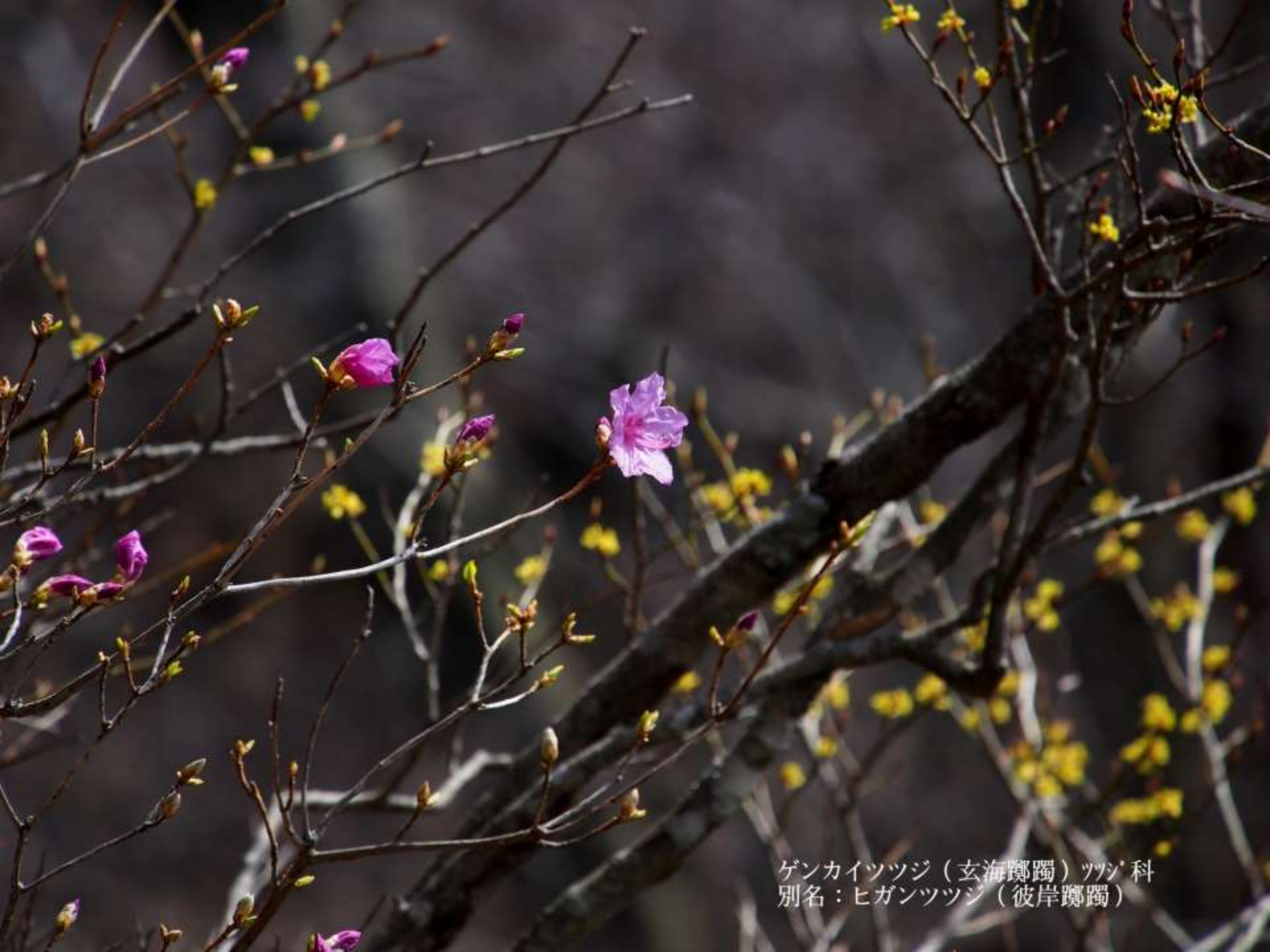
ゲンカイツツジ（玄海躑躅）ツツジ科 別名：ヒガンツツジ（彼岸躑躅）