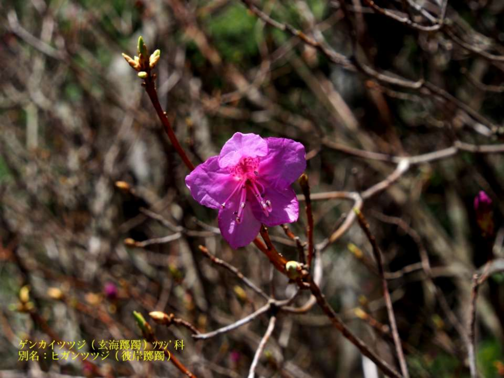
ゲンカイツツジ（玄海躑躅）ツツジ科 別名：ヒガンツツジ（彼岸躑躅）