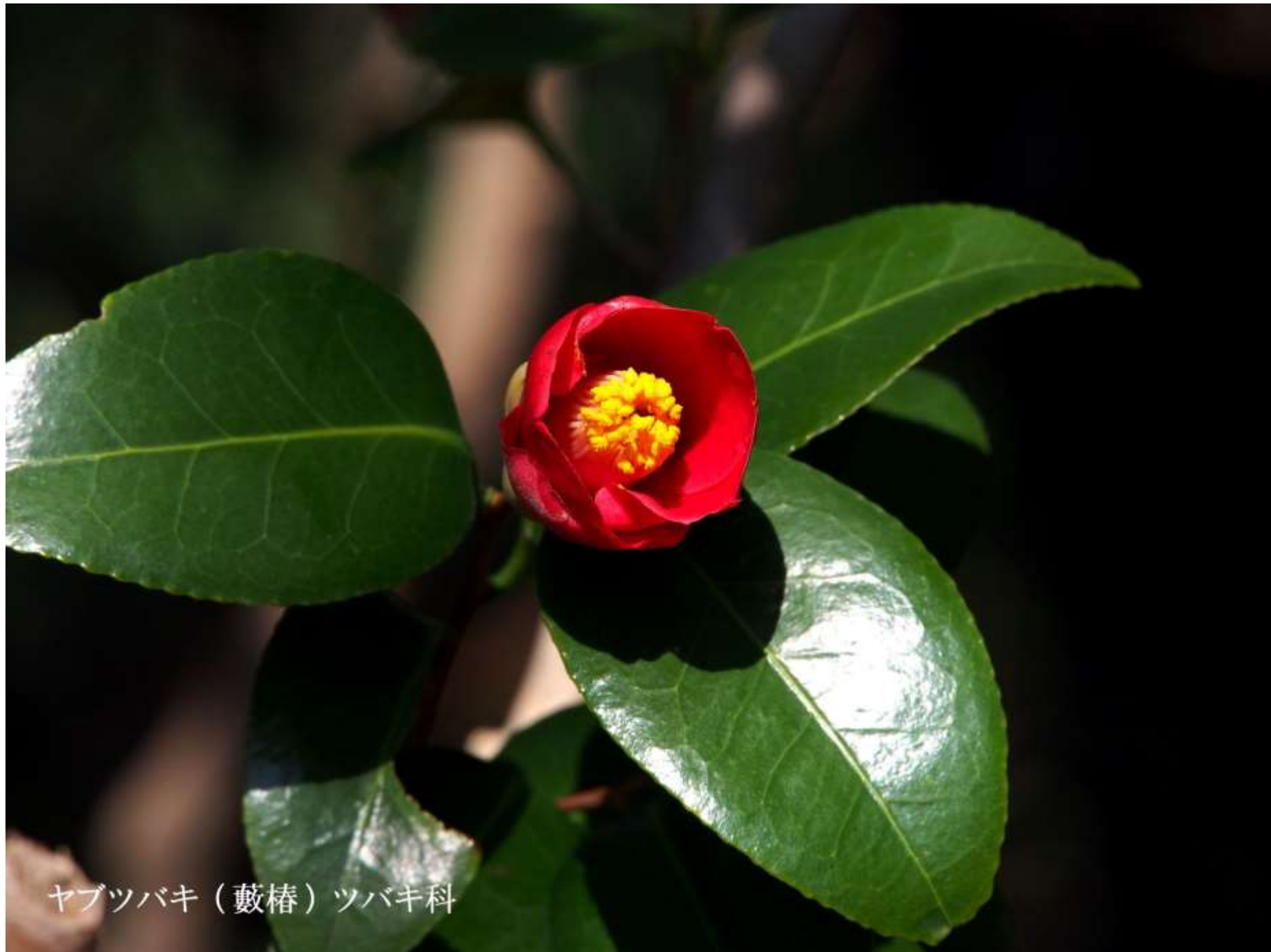
ヤブツバキ（藪椿）ツバキ科