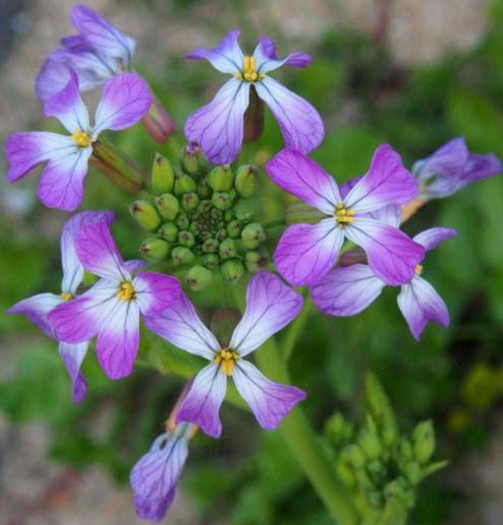
ハマダイコン（浜大根）アブラナ科