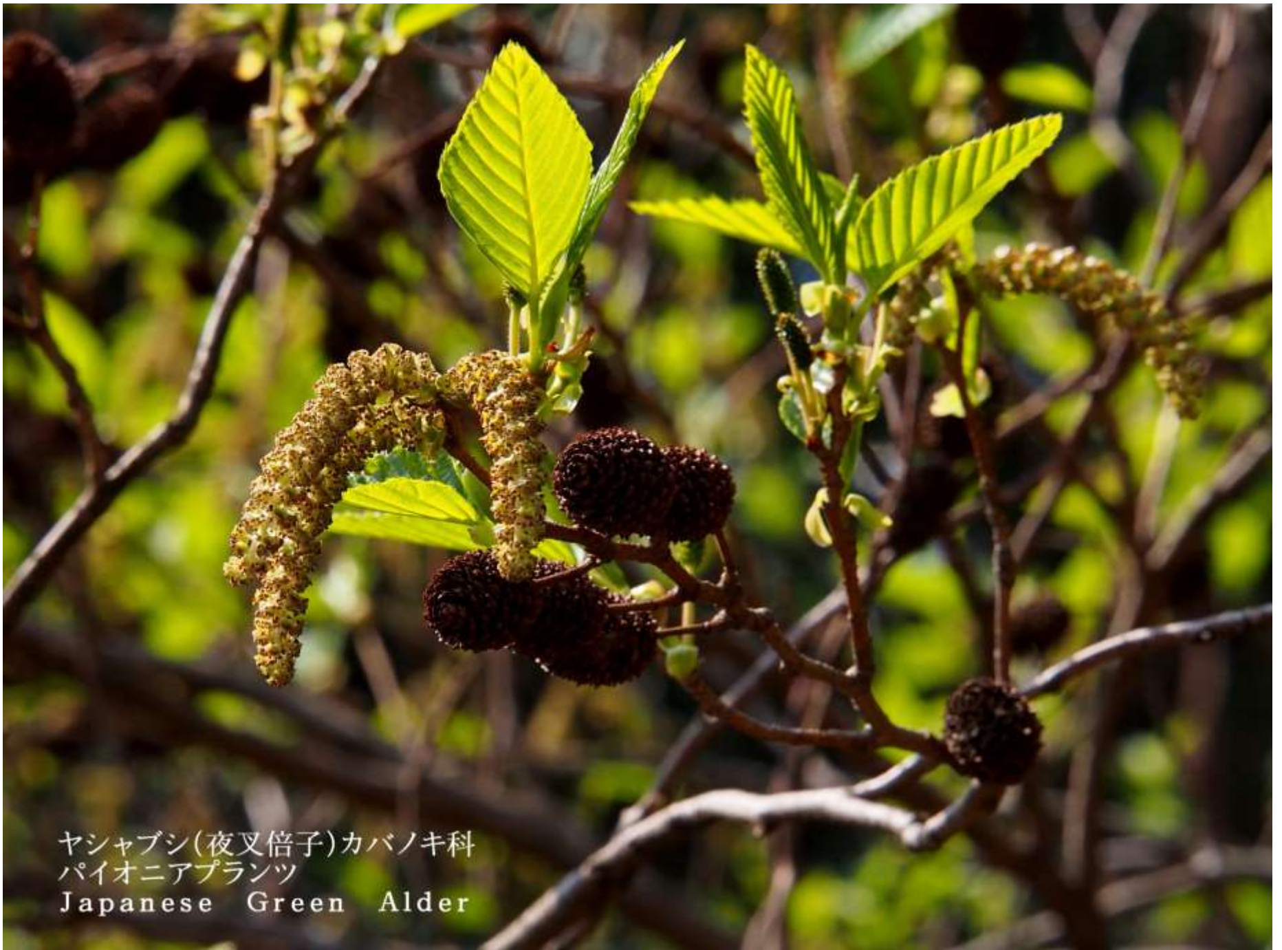
ヤシャブシ(夜叉倍子)カバノキ科 パイオニアプランツ Japanese Green Alder