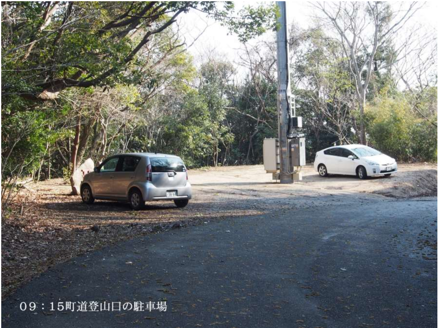
09 : 15町道登山口の駐車場