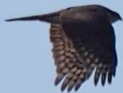
ハイタカ（鷯）ワシタカ科 L=オス32cm、メス39cm