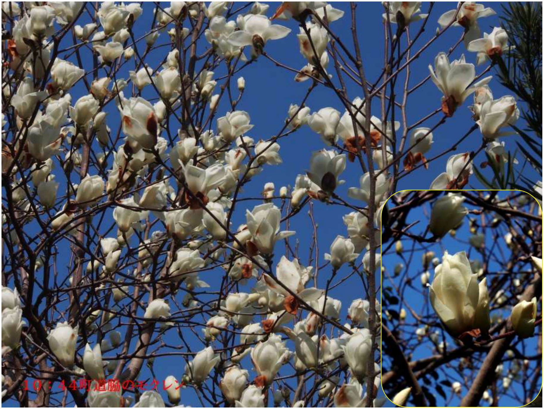
10:44町道脇のモクレン