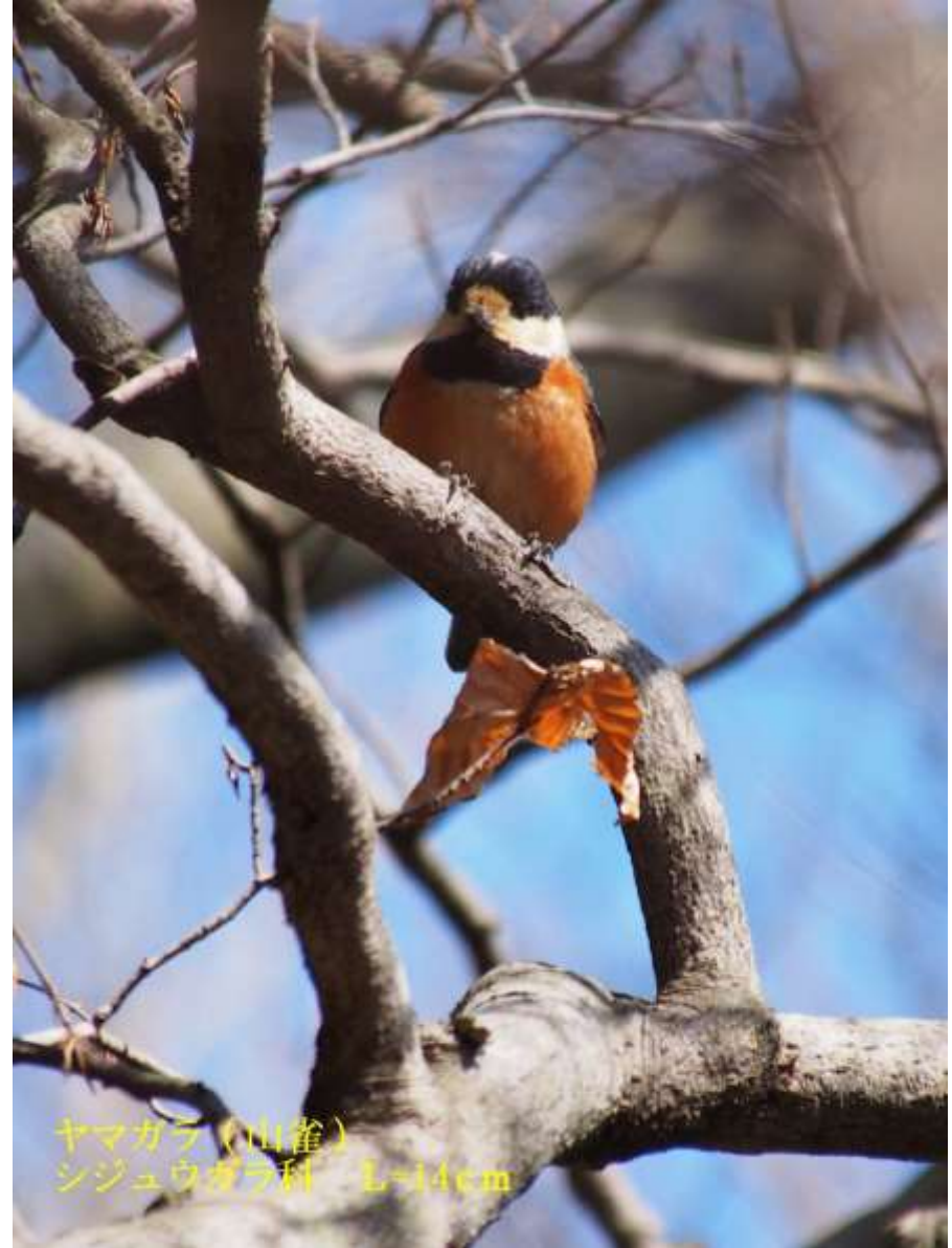
ヤマガラ (山雀) シジュウガラ科 L=14cm