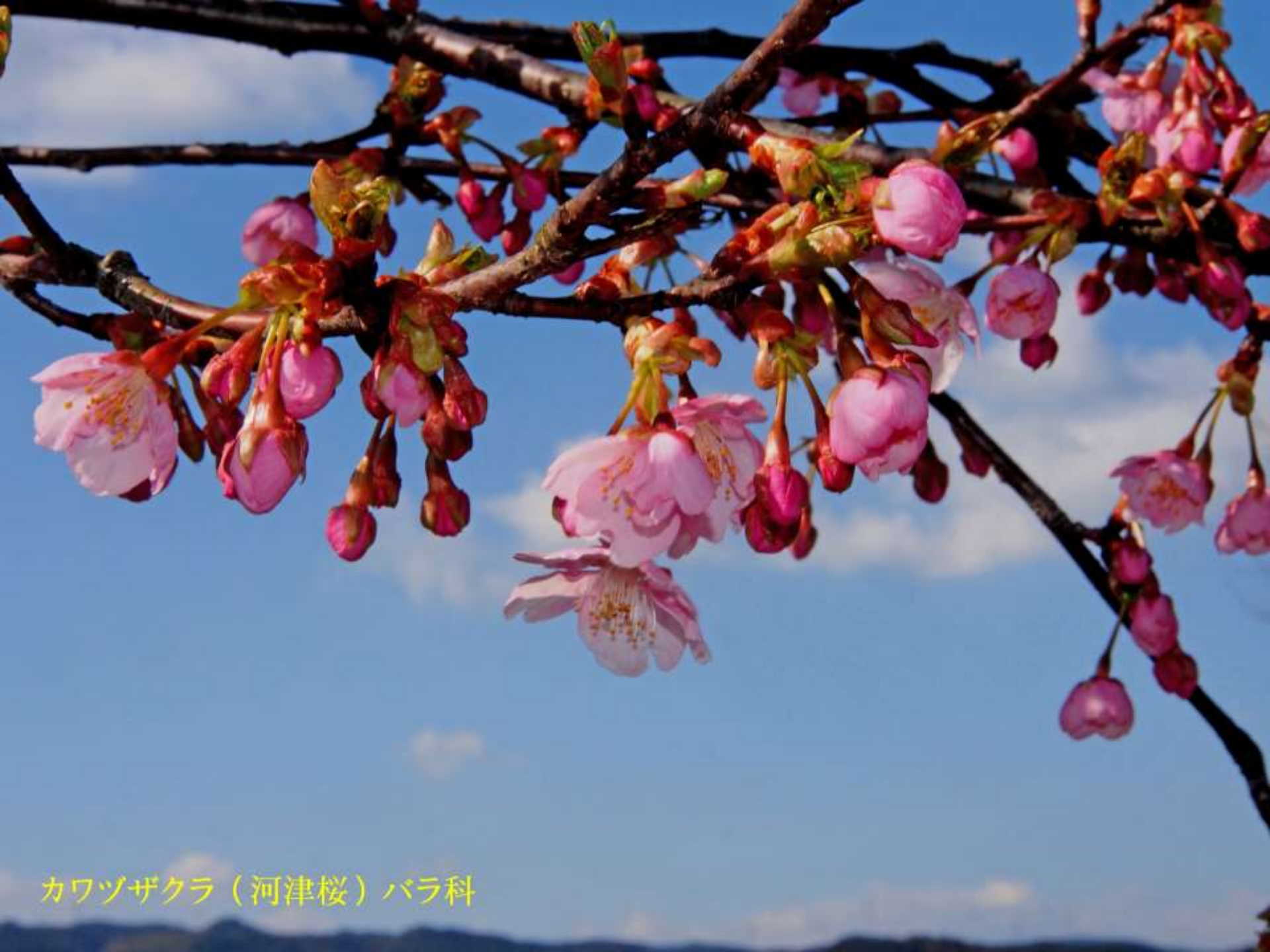
カワヅザクラ（河津桜）バラ科