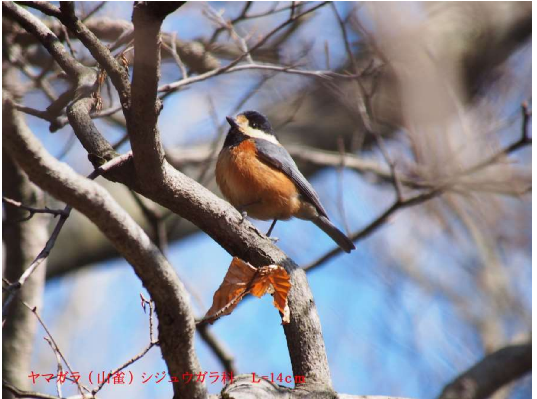
ヤマガラ（山雀）シジュウガラ科 L=14cm