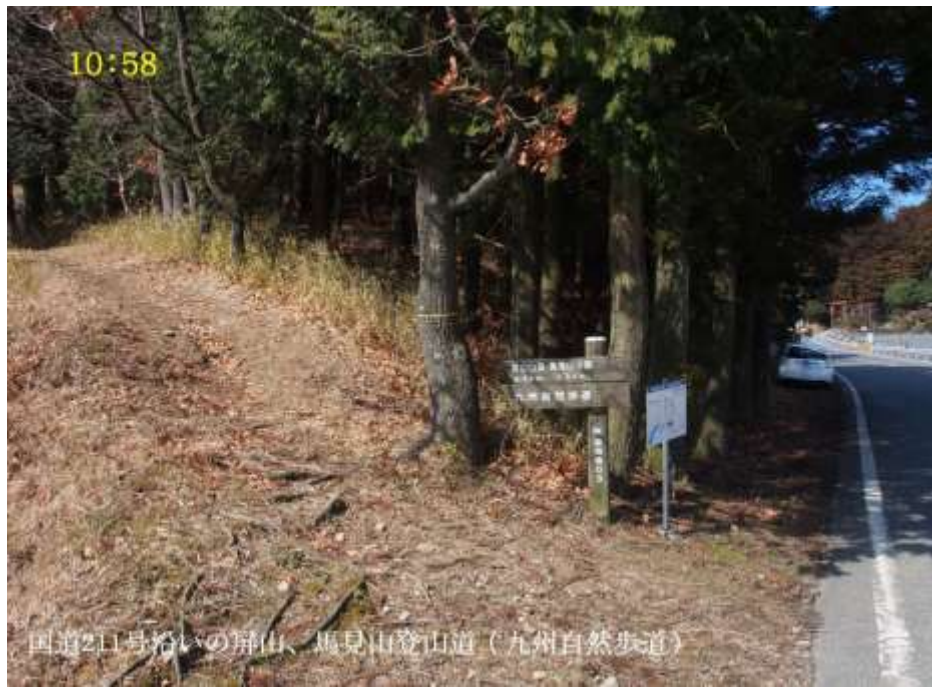
国道211号沿いの屏山、馬見山登山道(九州自然歩道)