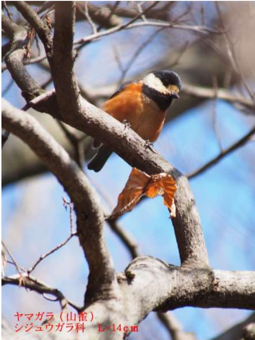
ヤマガラ (山雀) シジュウガラ科 L=14cm