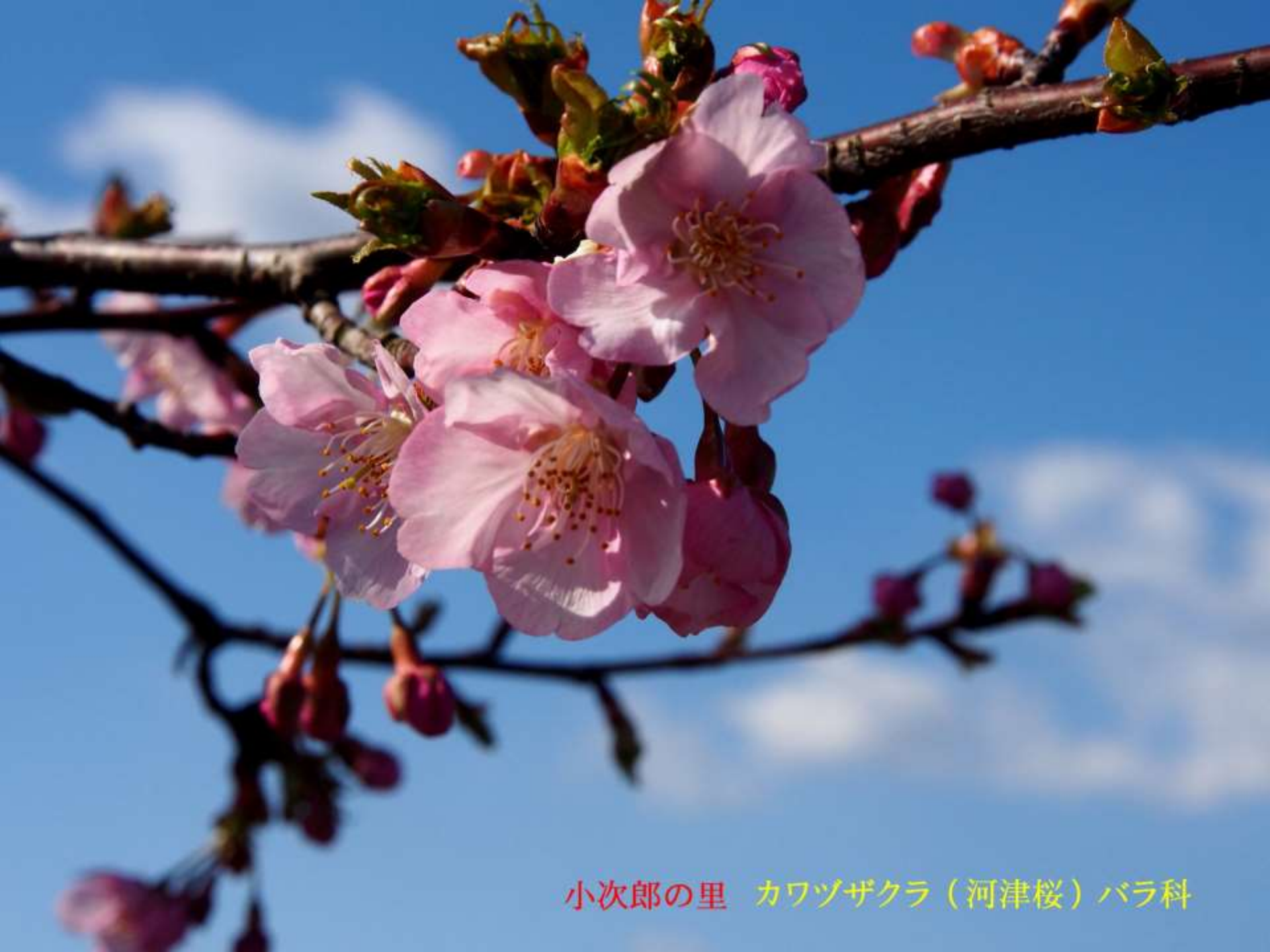
小次郎の里 カワヅザクラ（河津桜）バラ科