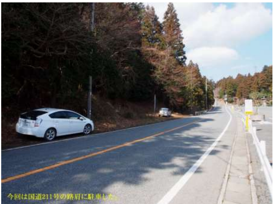
今回は国道211号の路肩に駐車した。