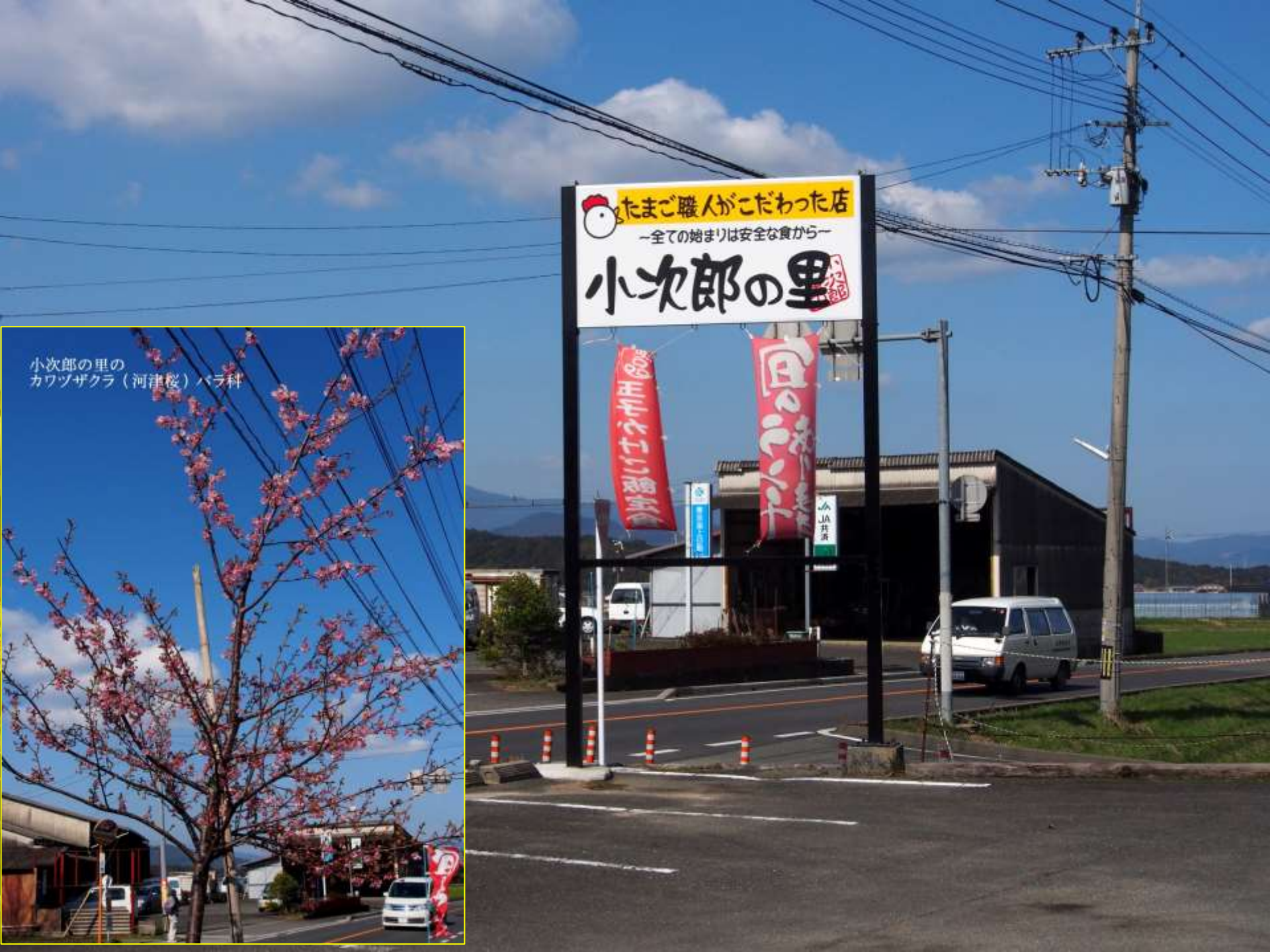
小次郎の里の カワツザクラ（河津桜）バラ科