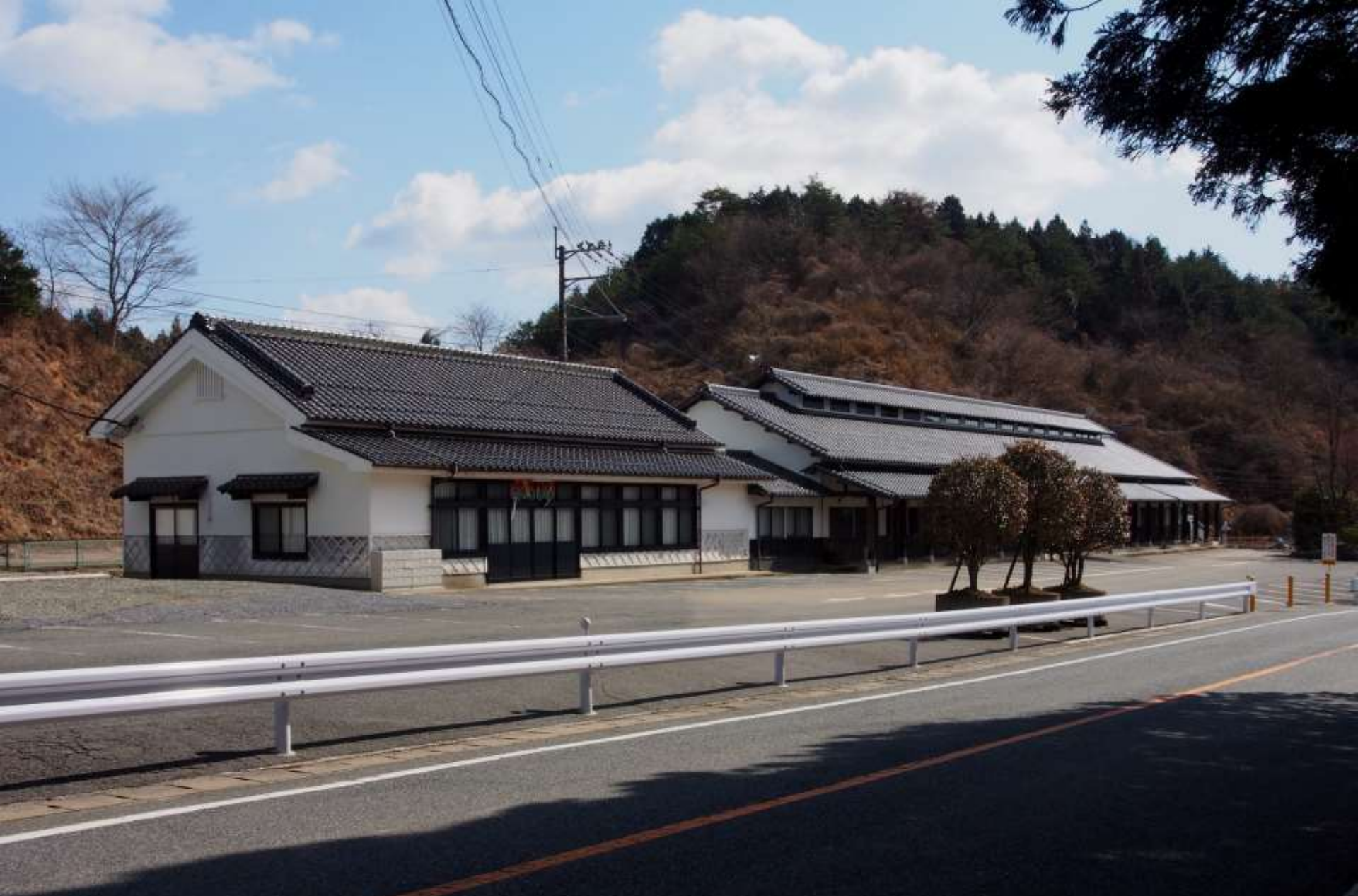
閉鎖した小石原小石原民芸村（こいしわらみんげいむら）。 以前、馬見山登山のときにはこの広い駐車場を利用した。