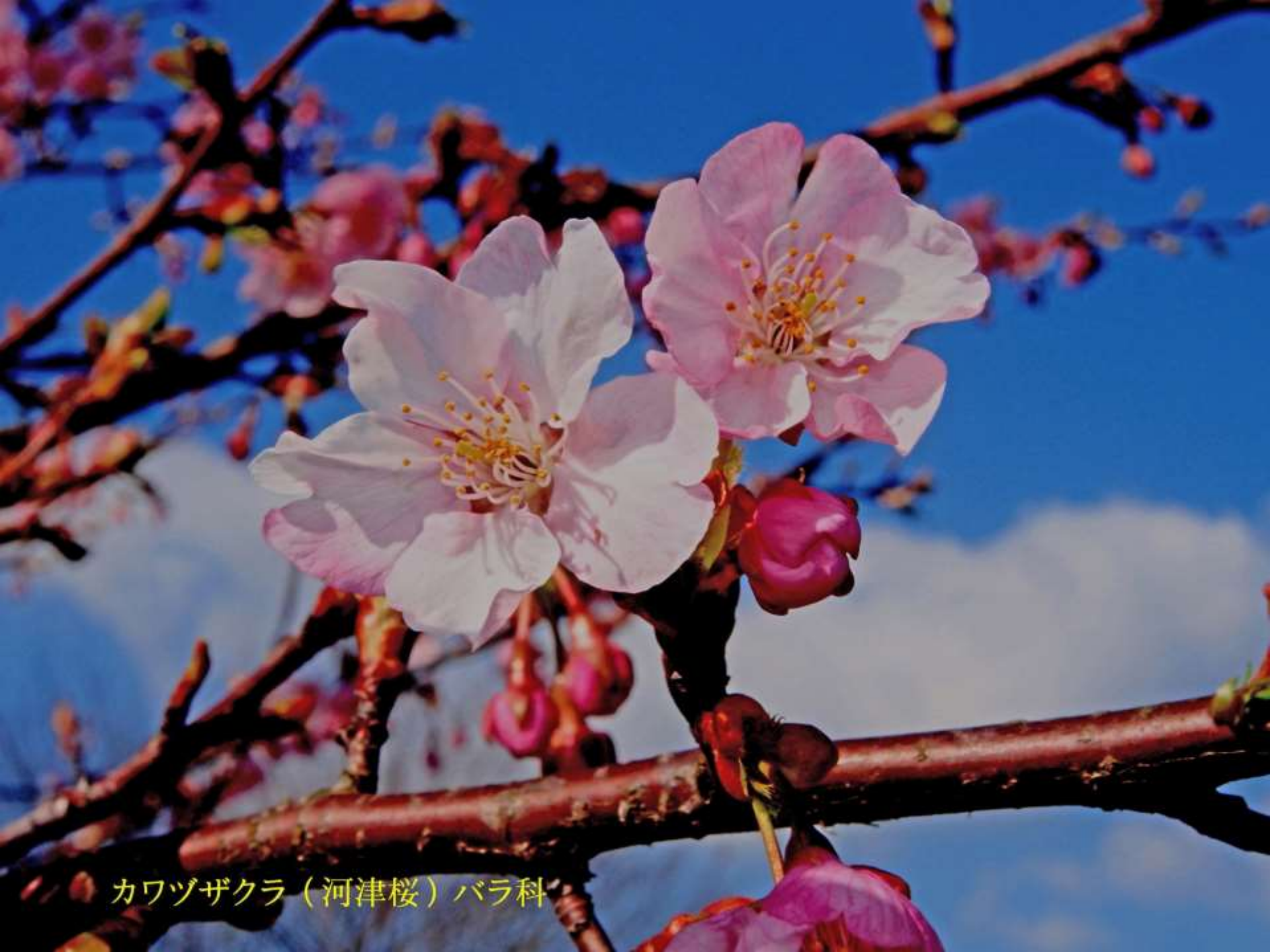
カワヅザクラ（河津桜）バラ科