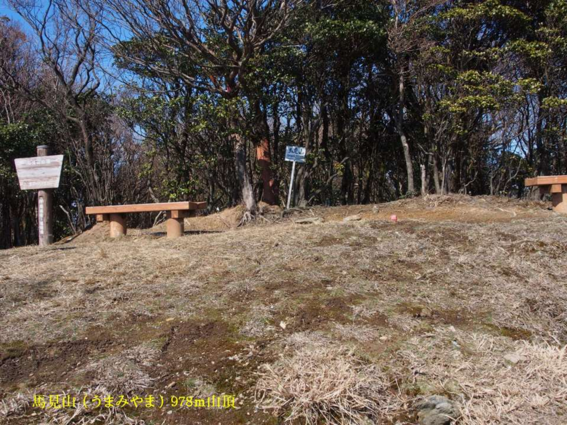
馬見山(うまみやま) 978m山頂