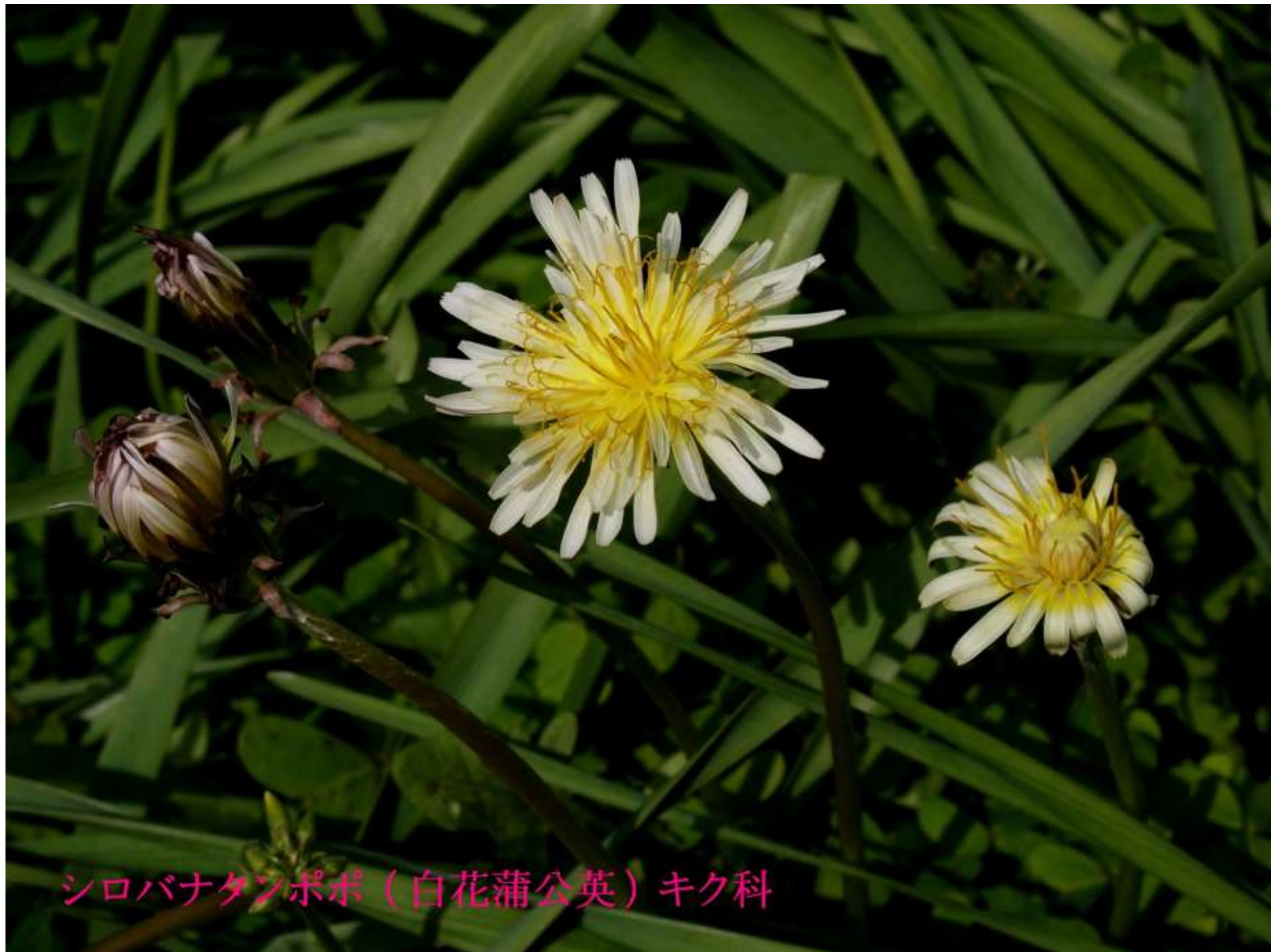
シロバナタンポポ (白花蒲公英) キク科