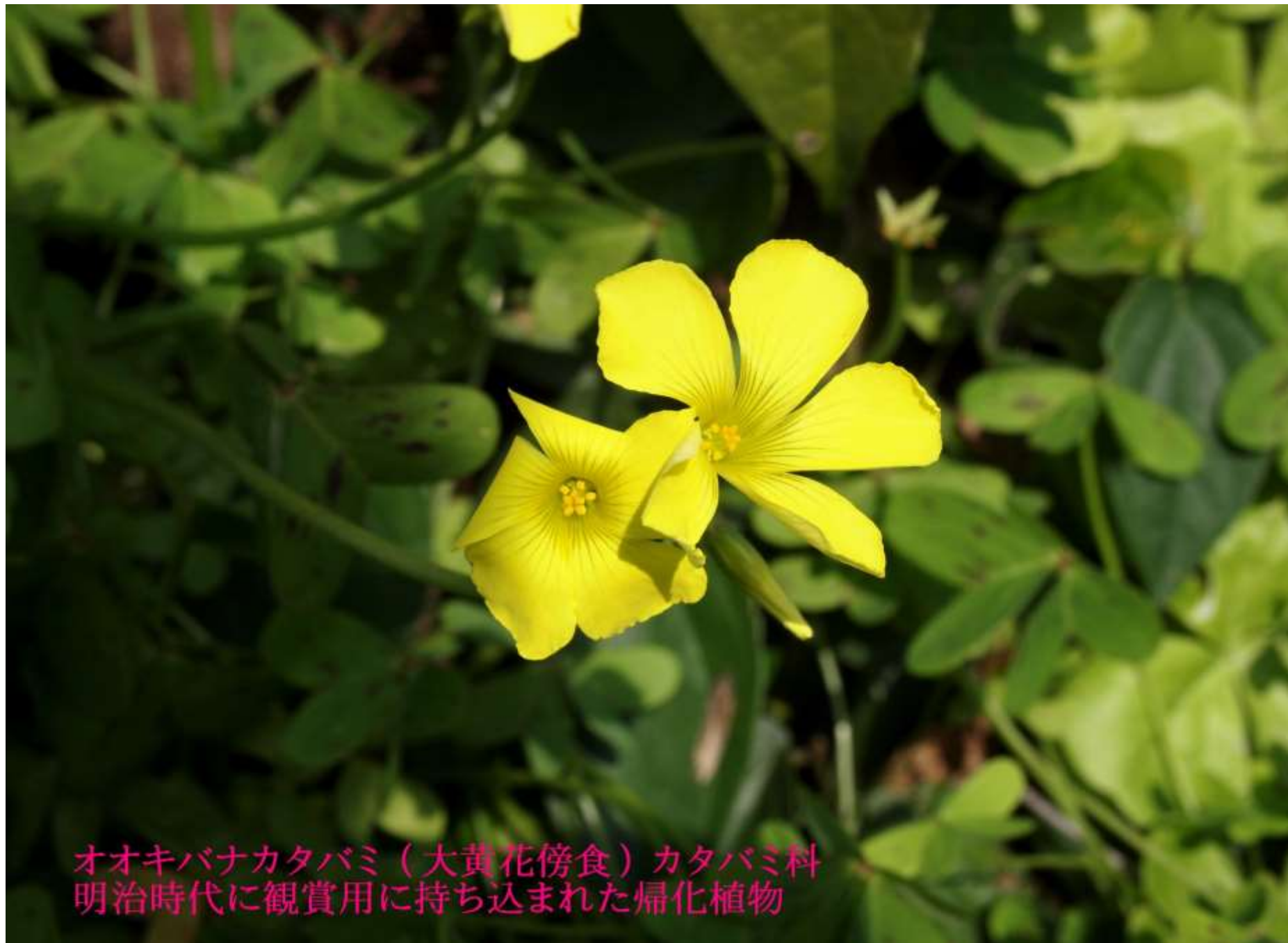
オオキバナカタバミ（大黄花傍食）カタバミ科 明治時代に観賞用に持ち込まれた帰化植物