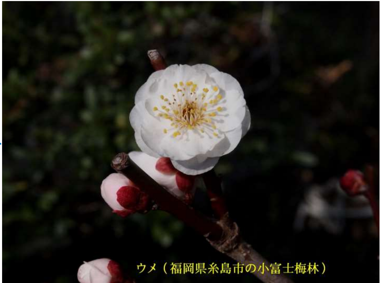
ウメ（福岡県糸島市の小富士梅林）