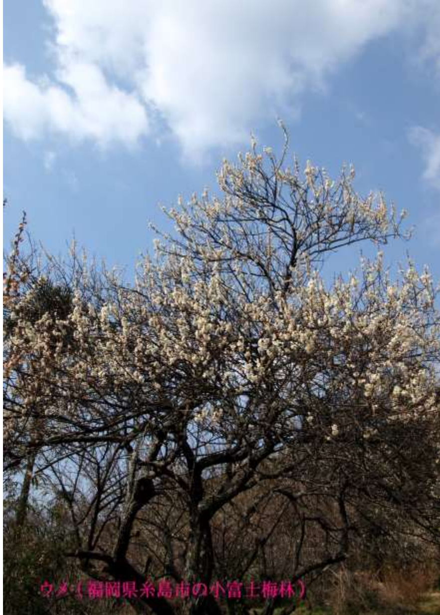
ウメ（福岡県糸島市の小富士梅林）