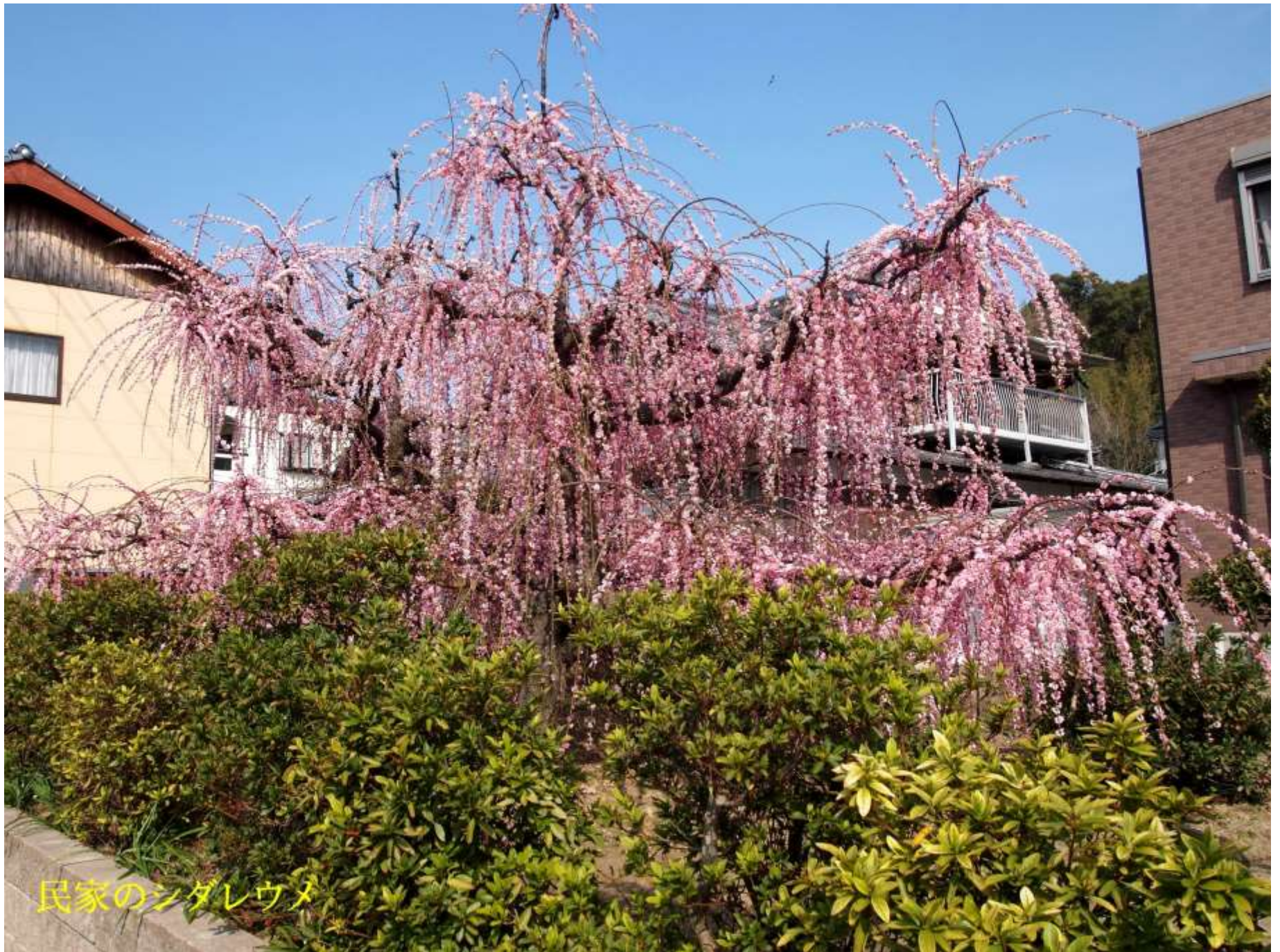
民家のシダレウメ