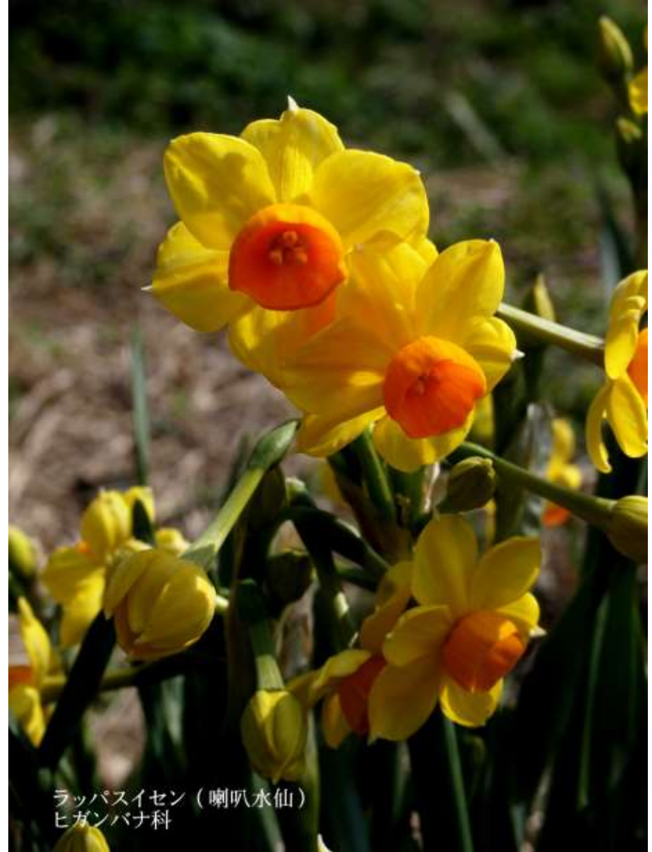
ラッパスイセン（喇叭水仙） ヒガンバナ科