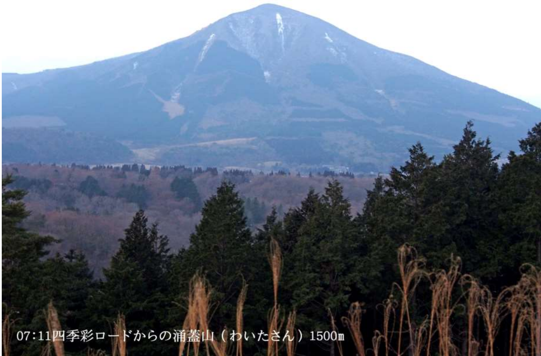
07:11四季彩ロードからの涌蓋山（わいたさん）1500m