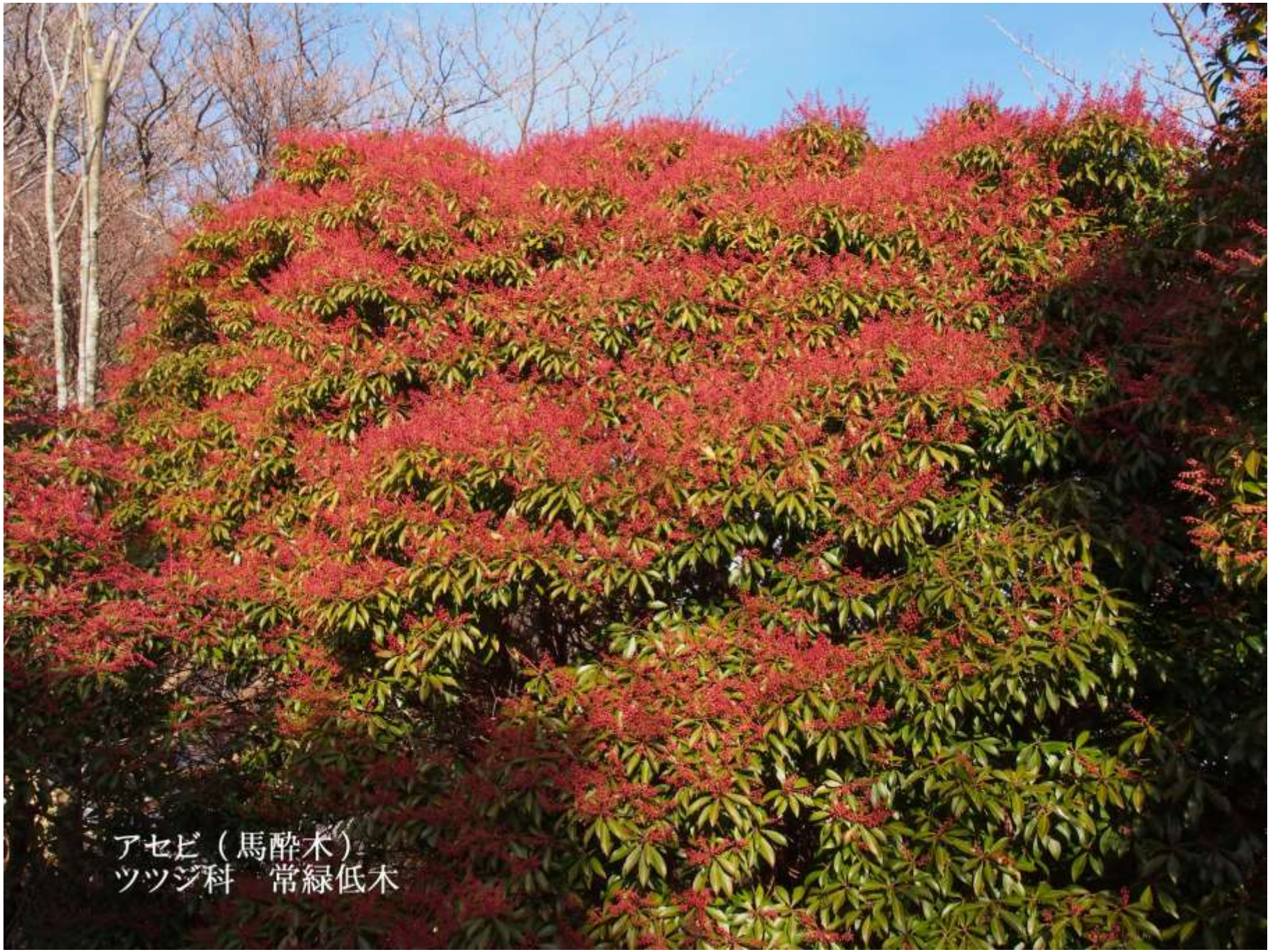
アセビ (馬酔木) ツツジ科 常緑低木