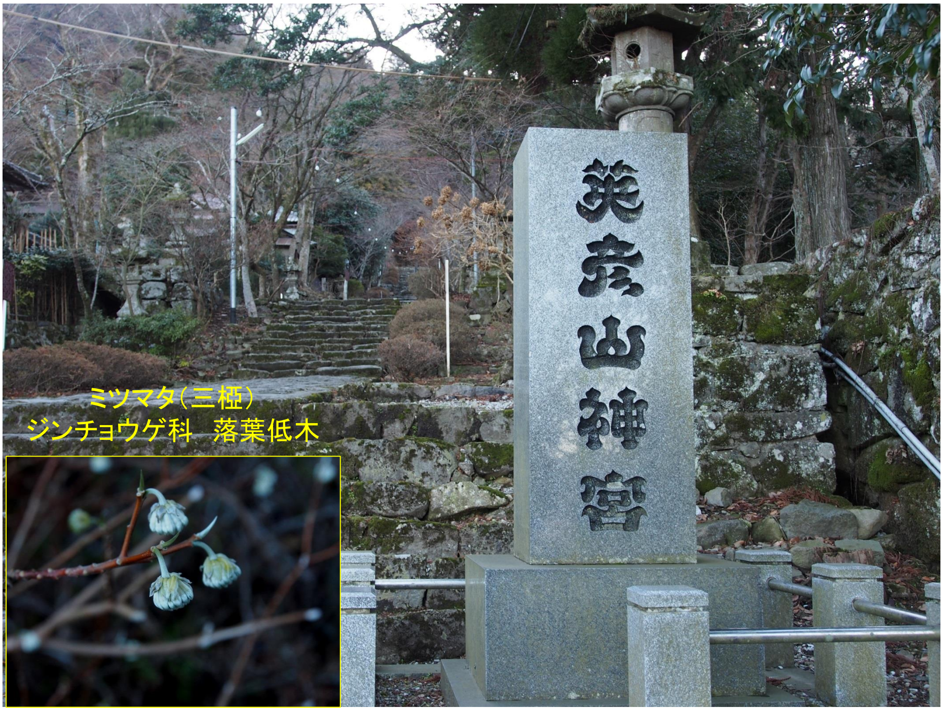
ミツマタ(三桮) ジンチョウゲ科 落葉低木