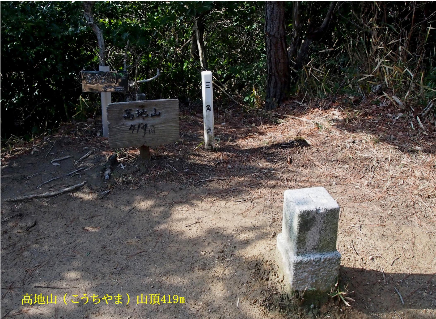
高地山（こうちやま）山頂419m