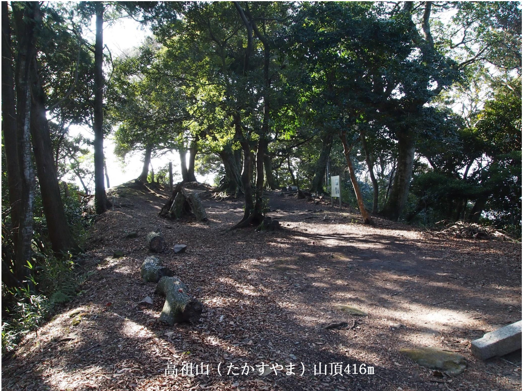
高祖山（たかすやま）山頂416m