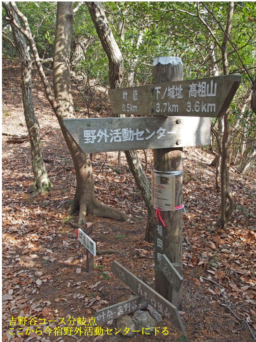
吉野谷コース分岐点 ここから今宿野外活動センターに下る