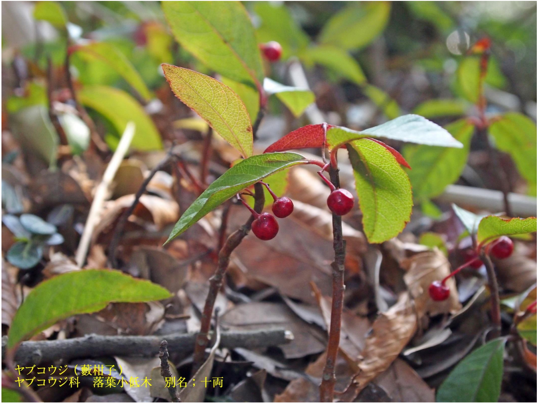
ヤブコウジ (藪柑子) ヤブコウジ科 落葉小低木 別名；十両