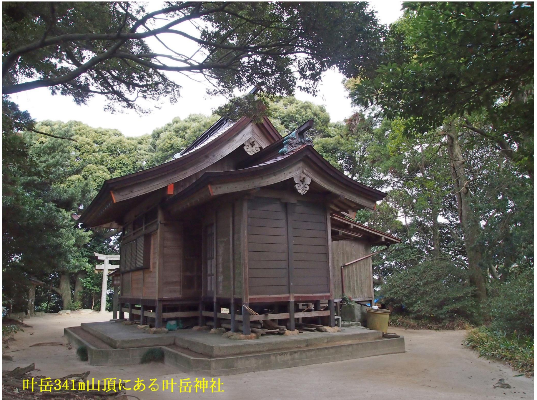
叶岳341m山頂にある叶岳神社