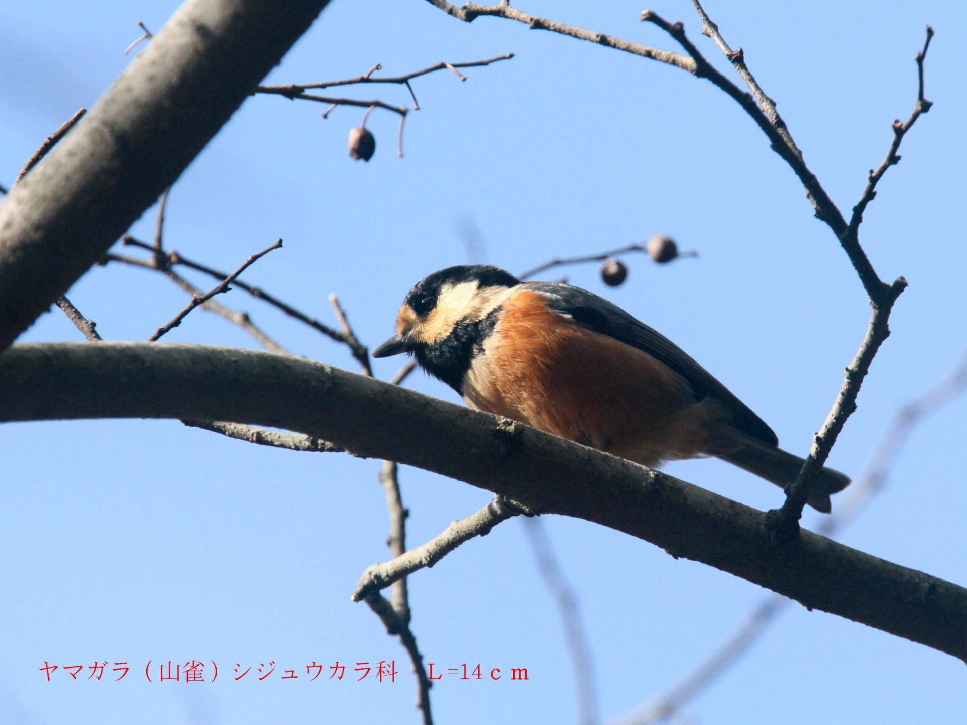
ヤマガラ（山雀）シジュウカラ科 L=14 c m