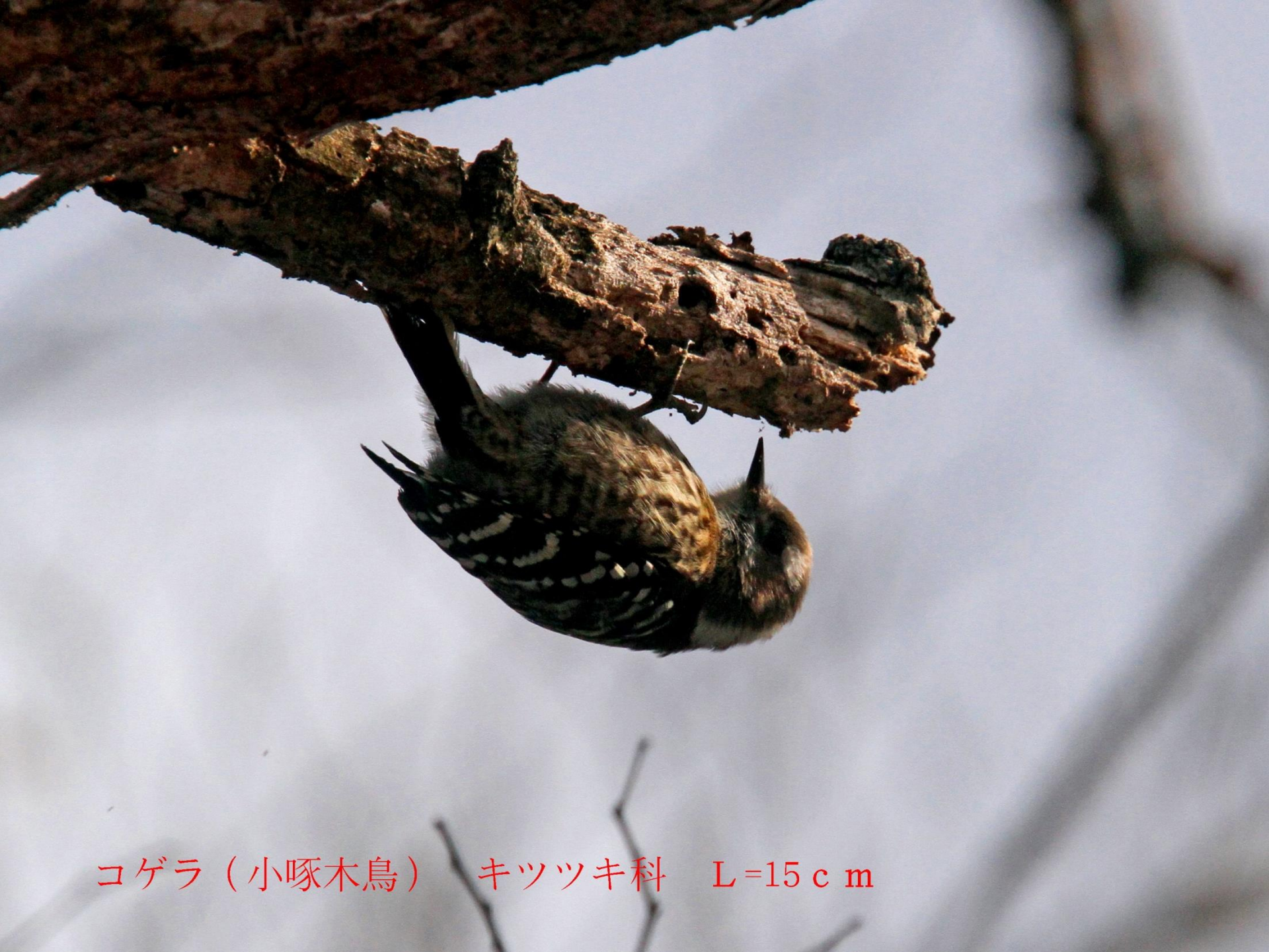
コゲラ (小啄木鳥) キツツキ科 L=15 c m