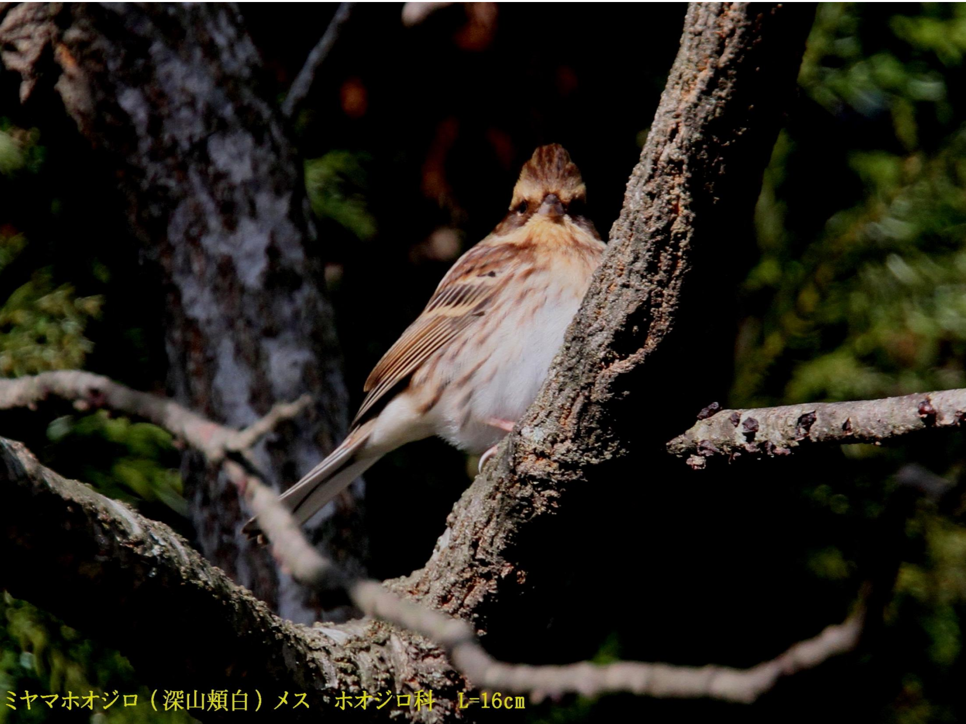
ミヤマホオジロ（深山頬白）メス ホオジロ科 L=16cm