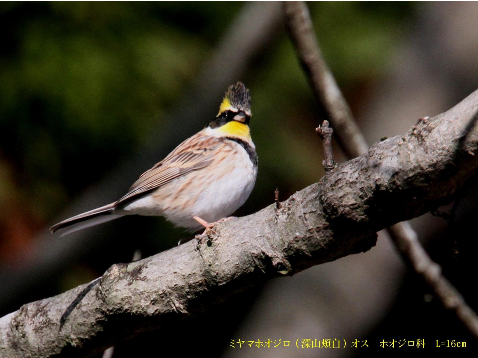
ミヤマホオジロ（深山頬白）オス ホオジロ科 L=16cm