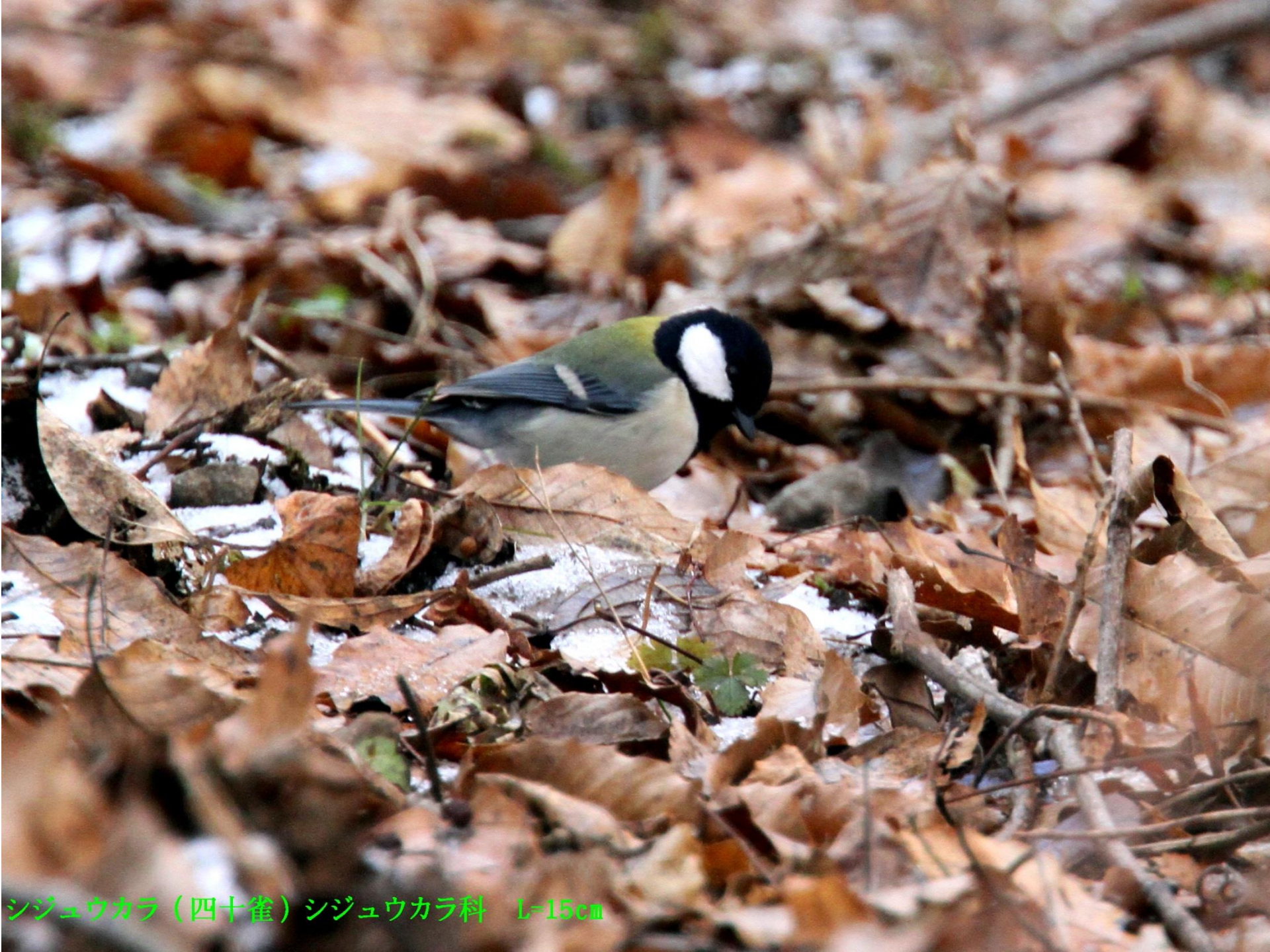
シジュウカラ (四十雀) シジュウカラ科 L=15cm