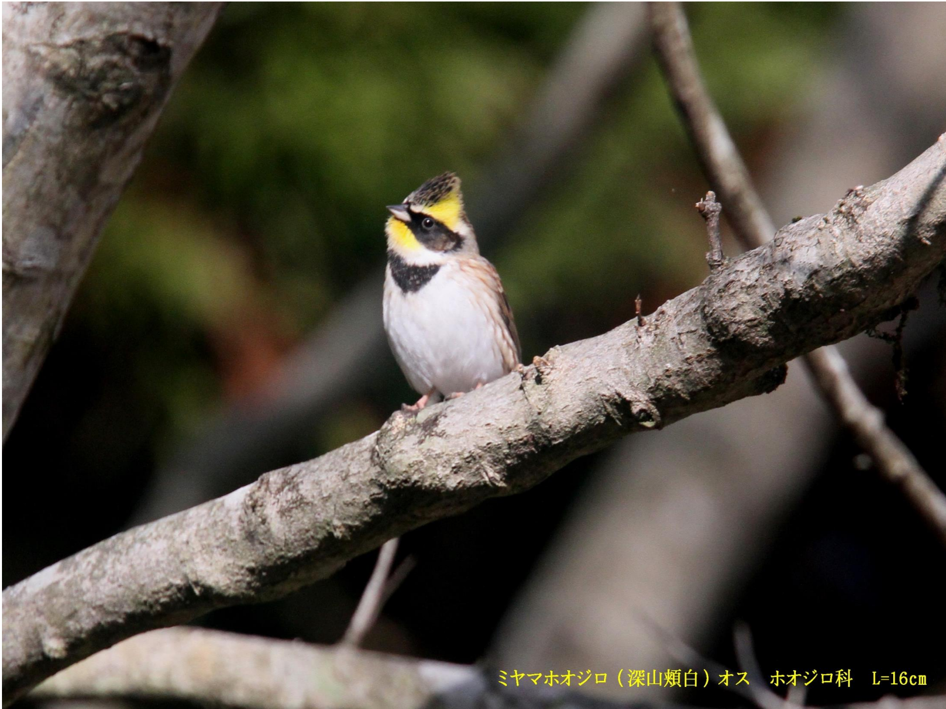
ミヤマホオジロ（深山頬白）オス ホオジロ科 L=16cm