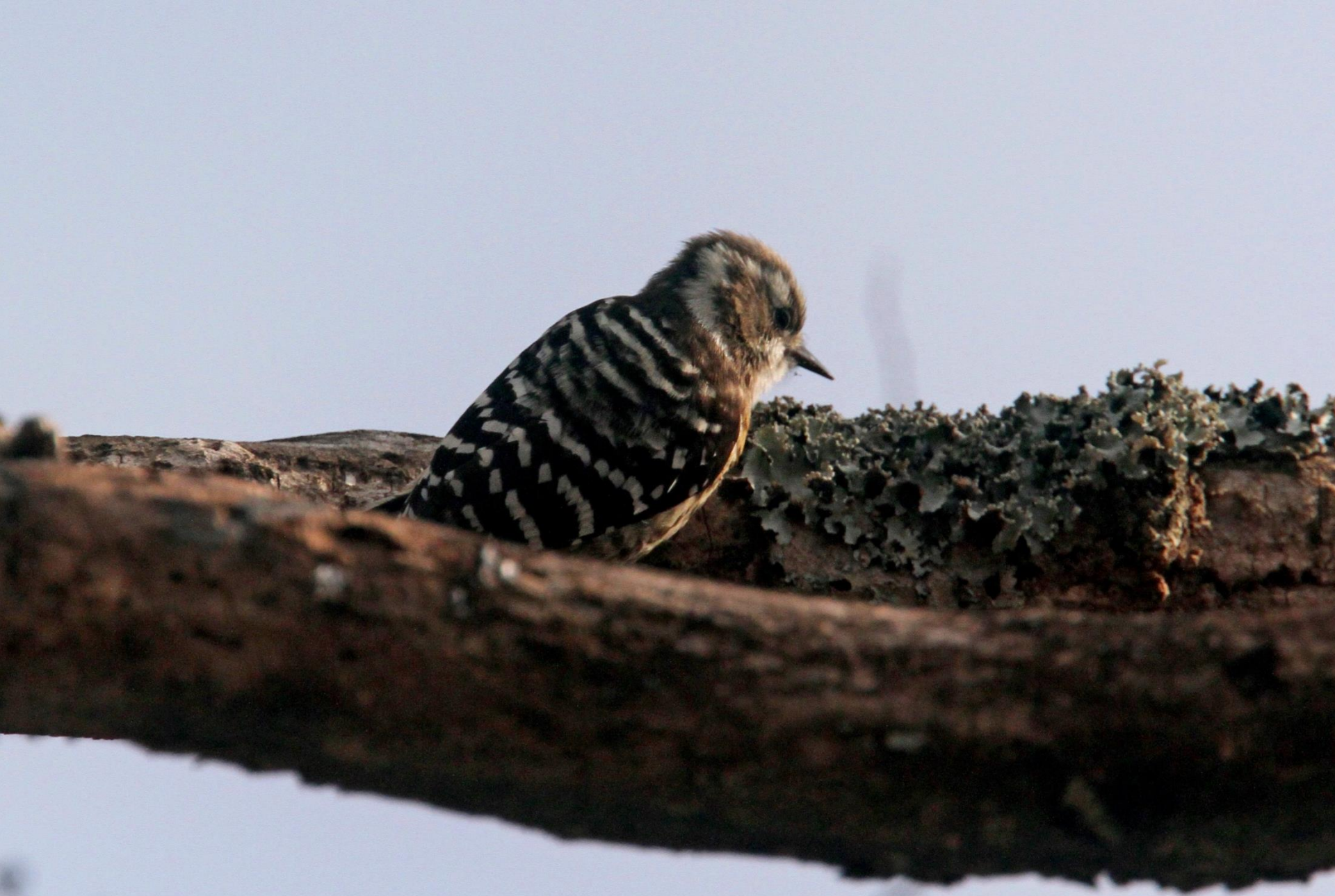
コゲラ（小啄木鳥） キツツキ科 L=15 c m