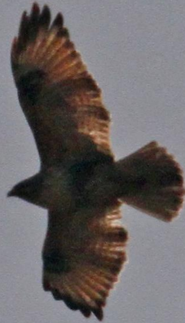
ノスリ（鷲）ワシタカ科 L=55cm