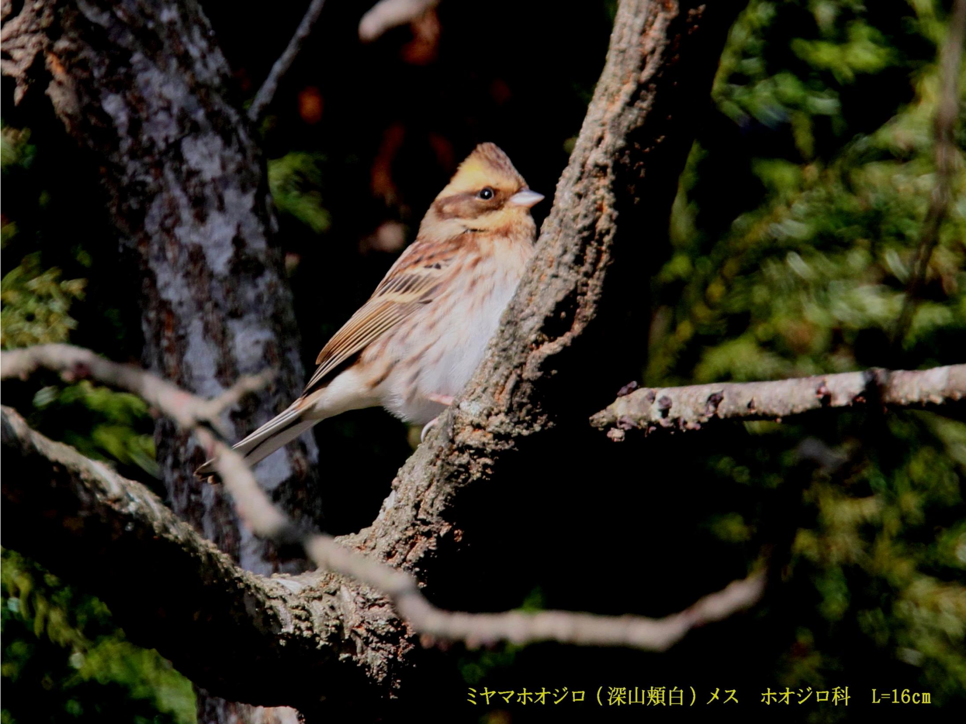
ミヤマホオジロ（深山頬白）メス ホオジロ科 L=16cm