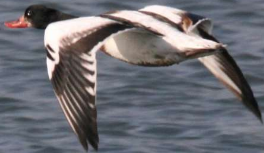
ツクシガモ (筑紫鴨) ガンカモ科 L=63cm