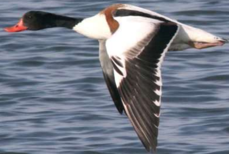
ツクシガモ（筑紫鴨）ガンカモ科 L=63cm