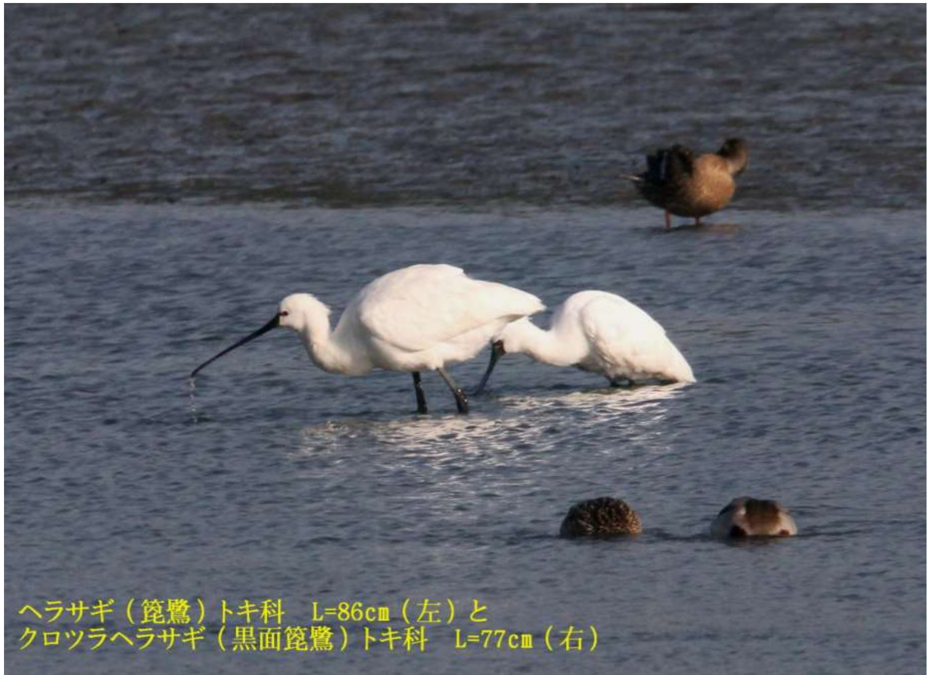
ヘラサギ（篋鷺）トキ科 L=86cm（左）と クロツラヘラサギ（黒面篋鷺）トキ科 L=77cm（右）