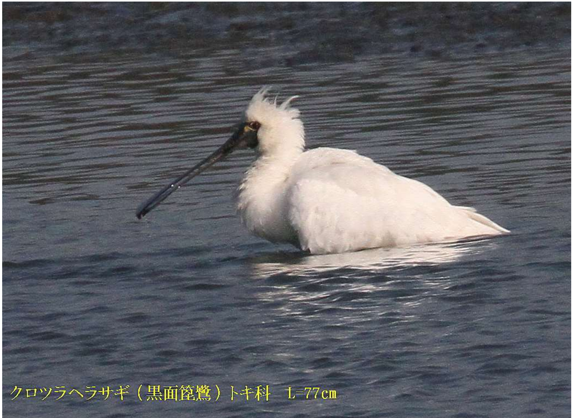
クロツラヘラサギ（黒面篋鷺）トキ科 L=77cm