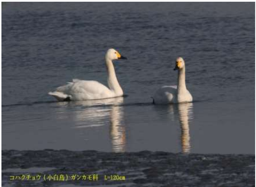
コハクチョウ (小白鳥) ガンカモ科 L=120cm