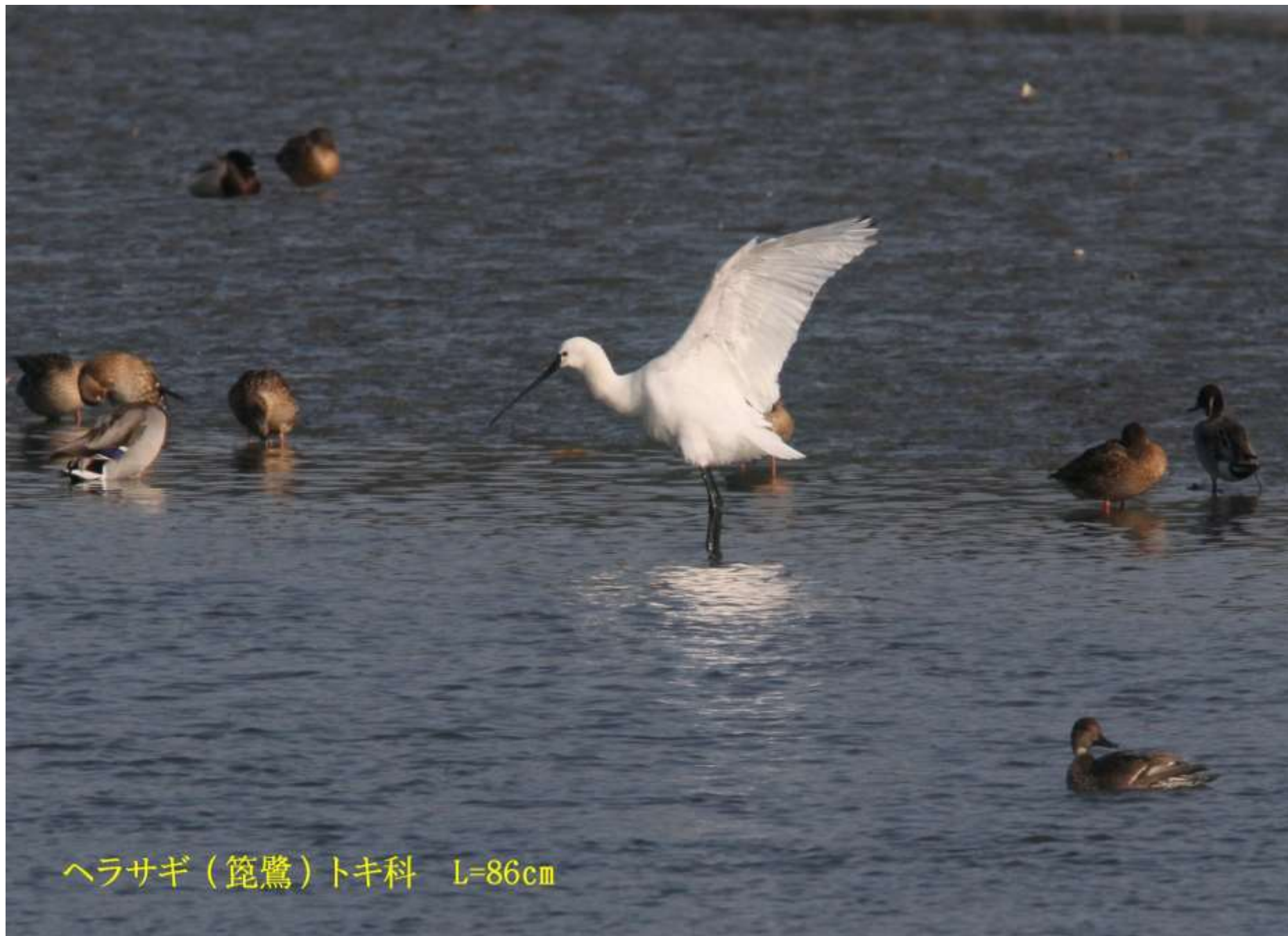
ヘラサギ（篋鷺）トキ科 L=86cm