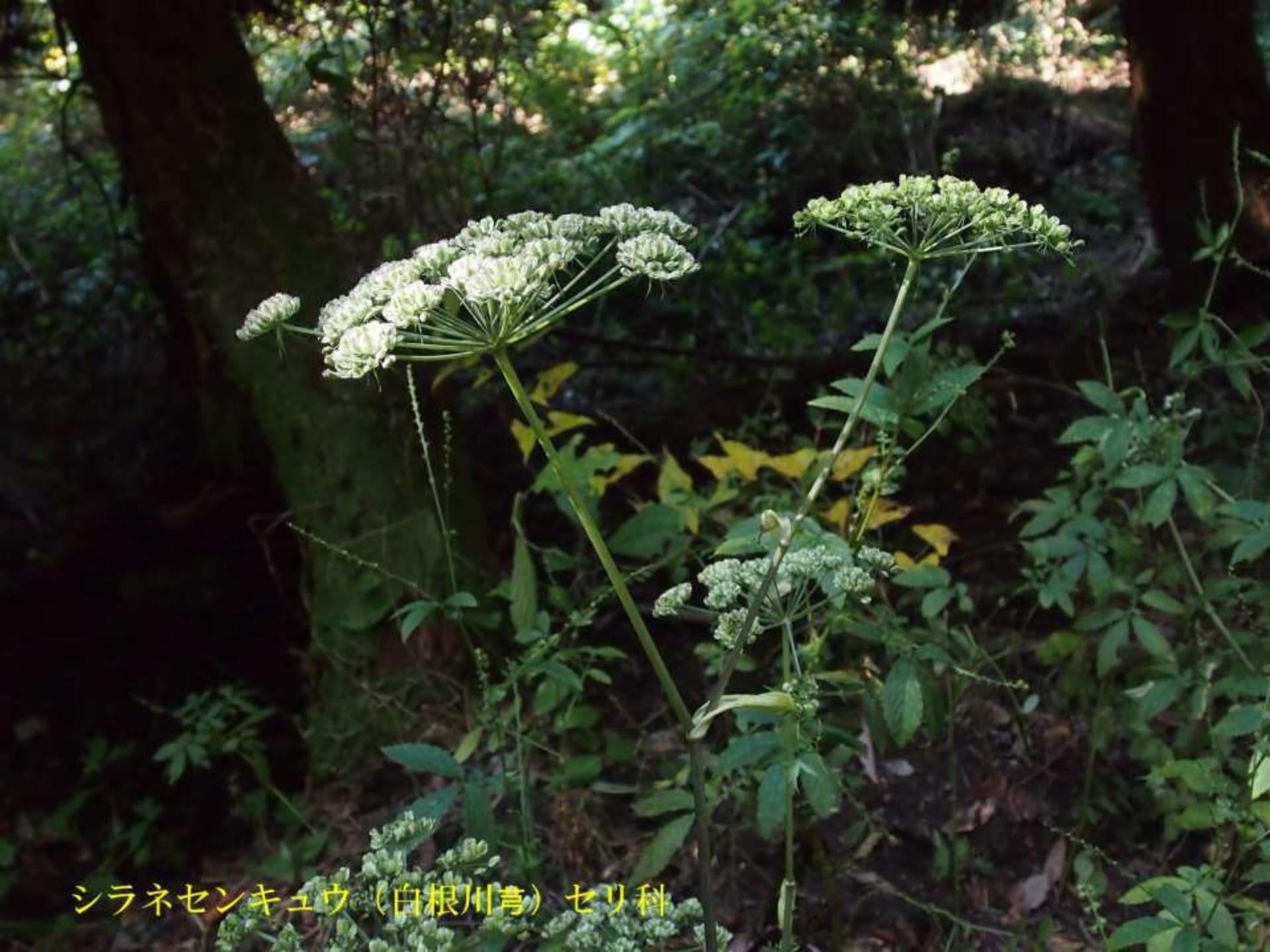
シラネセンキュウ (白根川考) セリ科