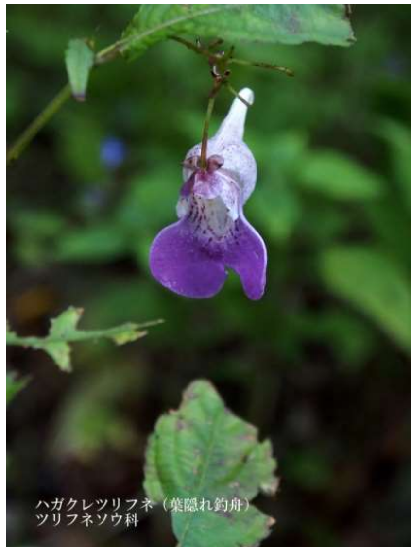
ハガクレツリフネ (葉隠れ釣舟) ツリフネソウ科