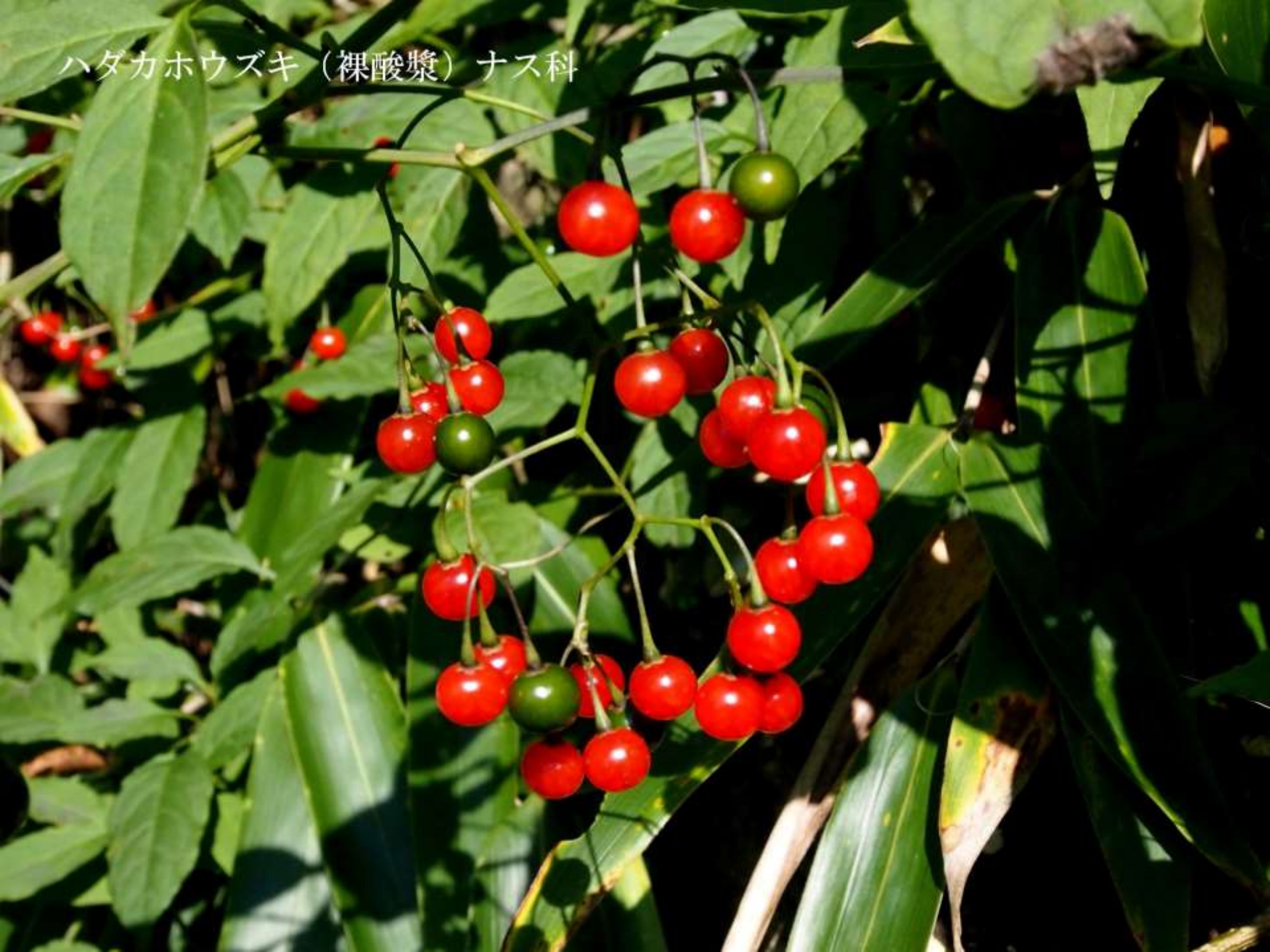
ハダカホウズキ（裸酸漿）ナス科