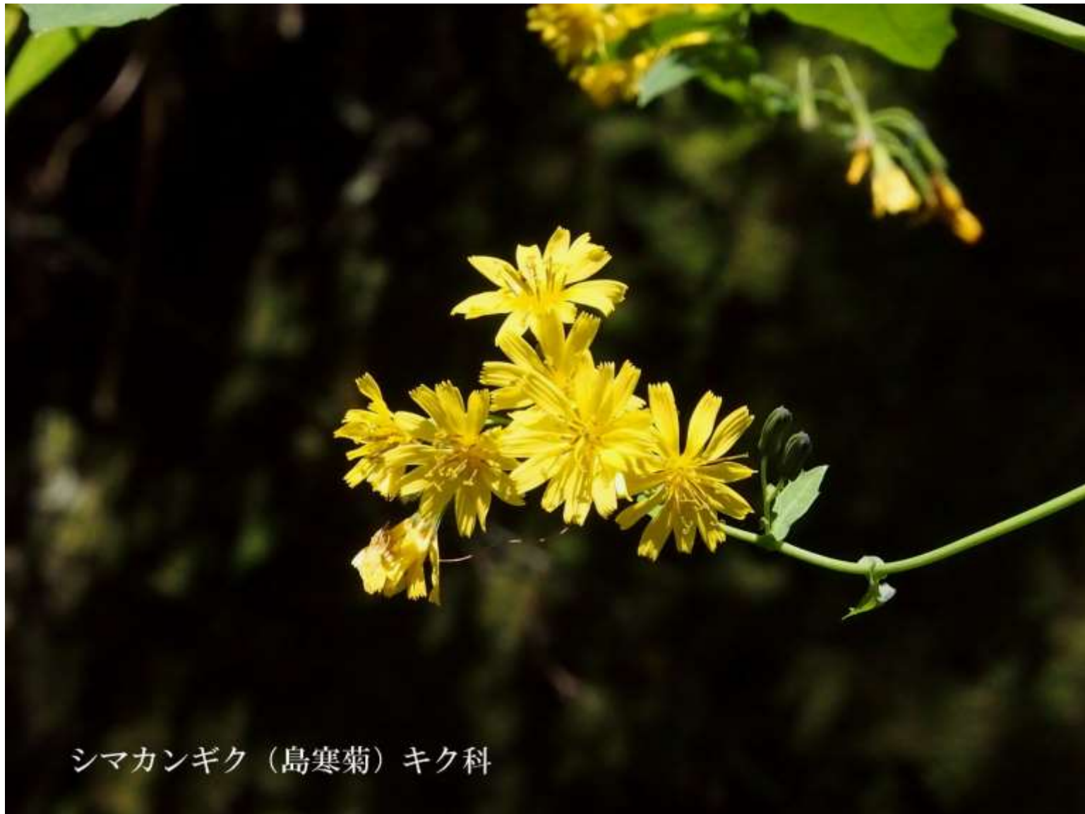
シマカンギク（島寒菊）キク科