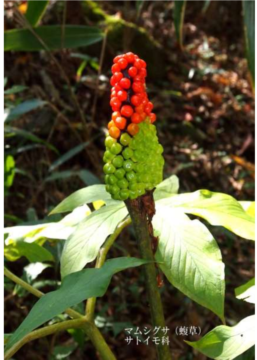
マムシグサ (蝮草) サトイモ科