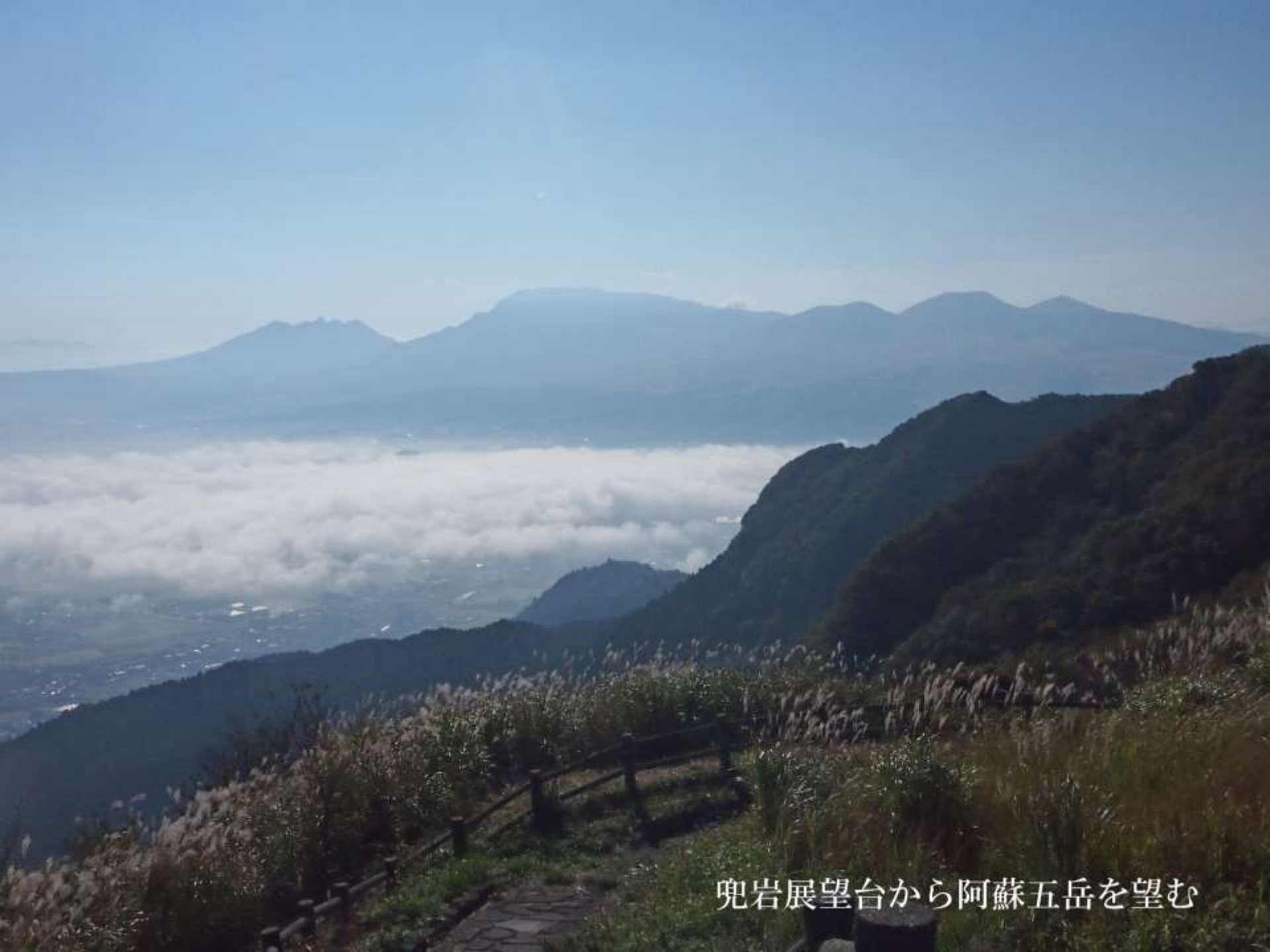
兜岩展望台から阿蘇五岳を望む