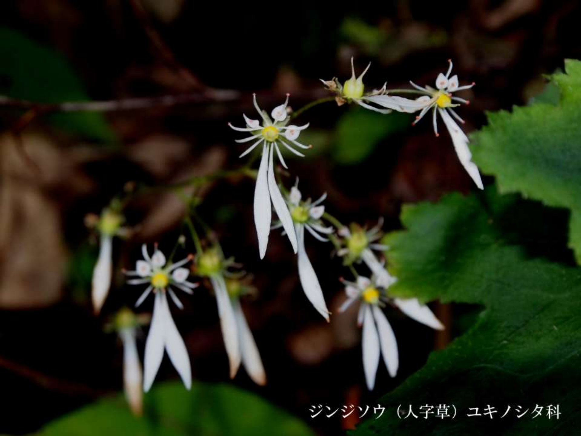
ジンジソウ（人字草）ユキノシタ科