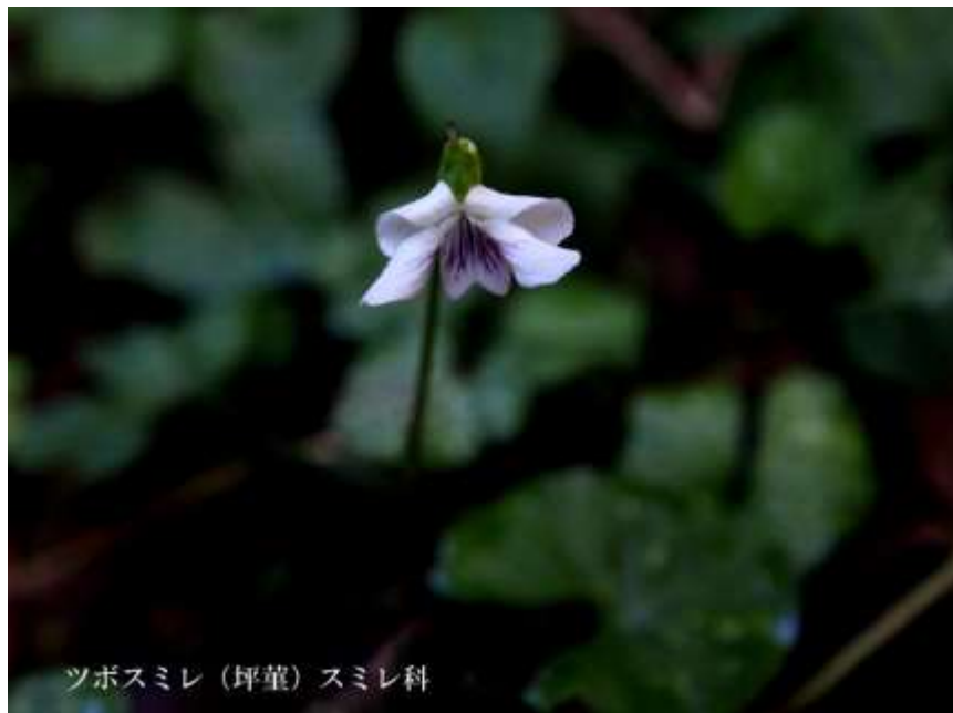
ツボスミレ (坪葎) スミレ科