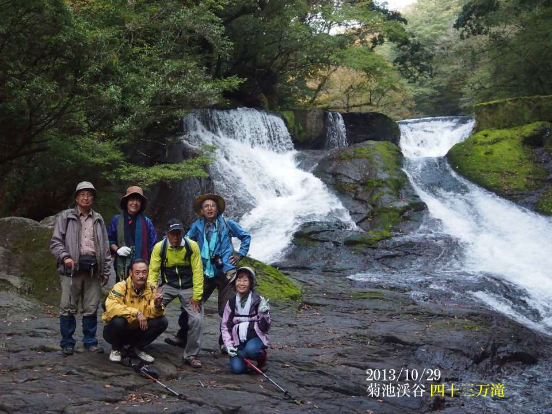
2013/10/29 菊池溪谷 四十三万滝