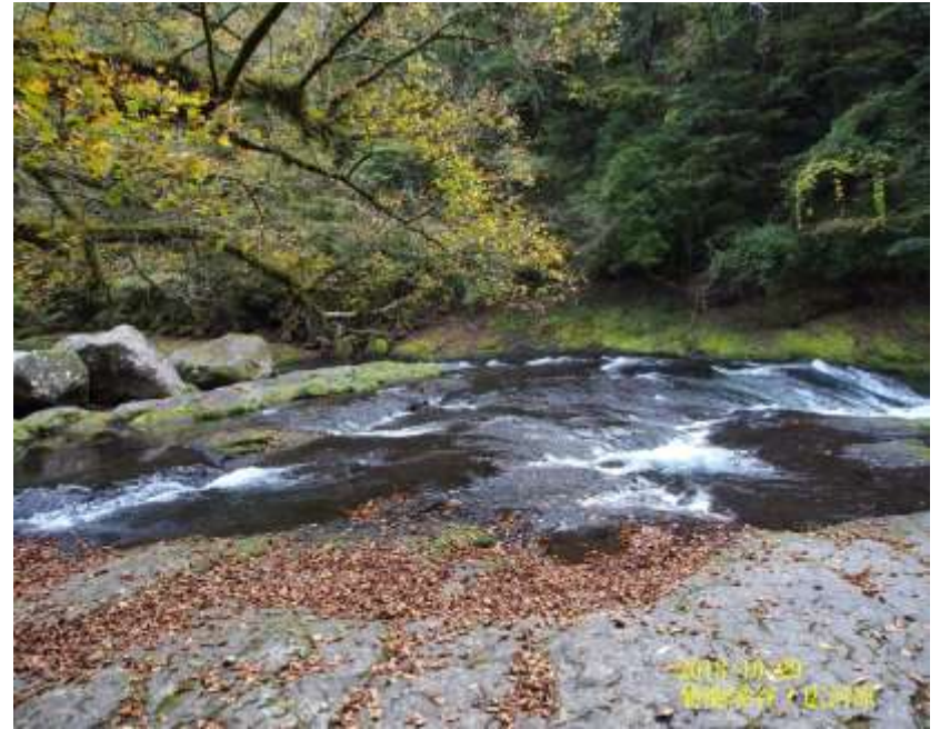
43万滝 菊池渓谷・四万滝