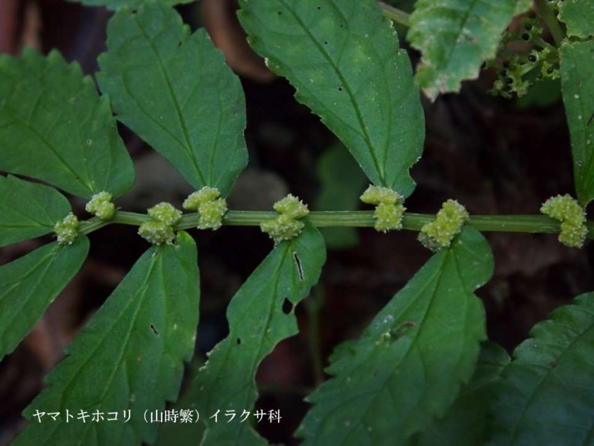
ヤマトキホコリ (山時繁) イラクサ科