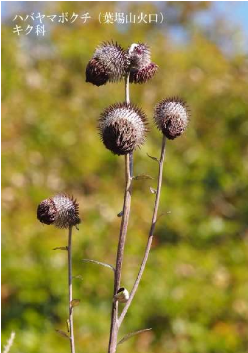
ハバヤマボクチ (葉場山火口) キク科