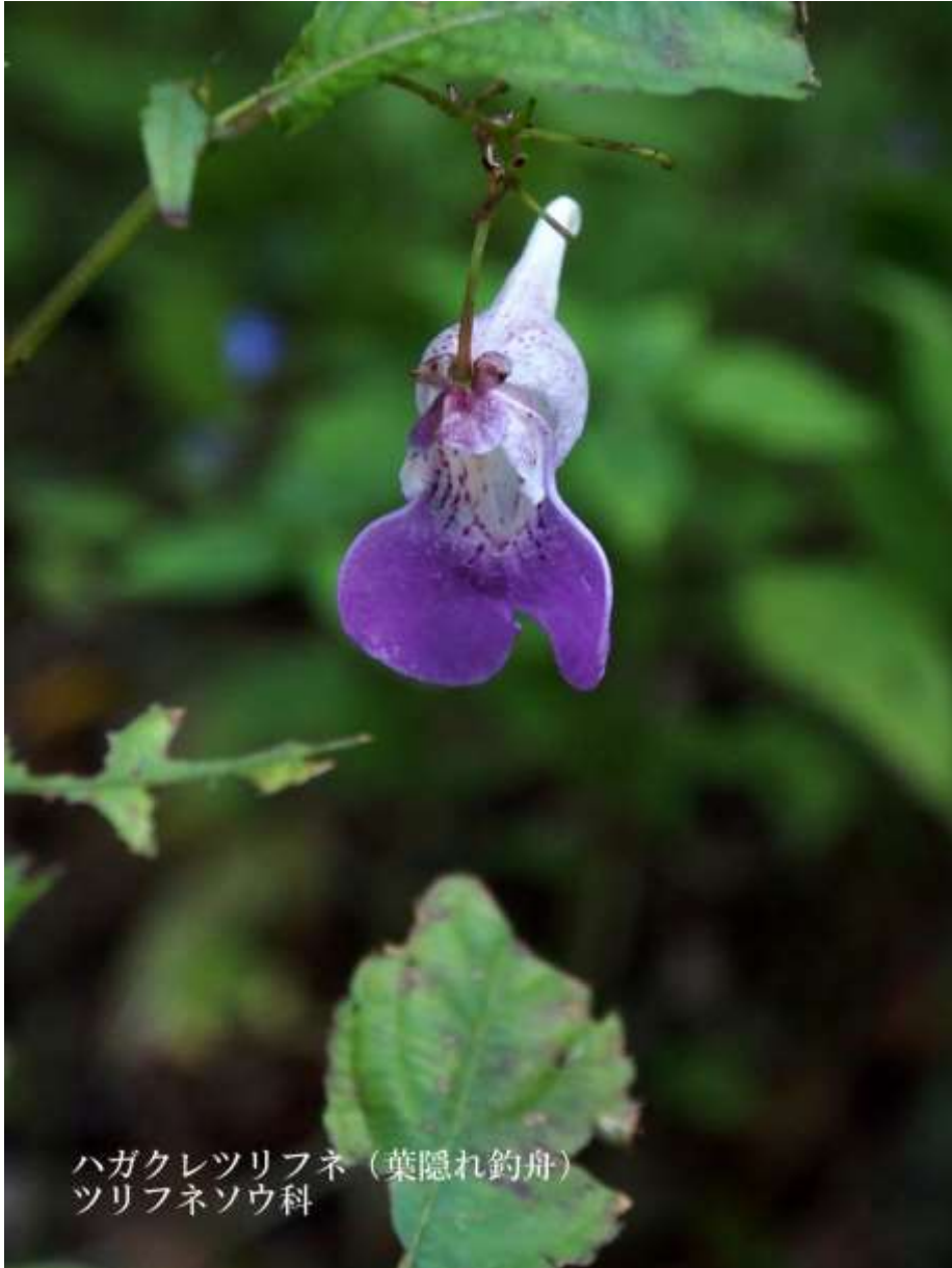
ハガクレツリフネ (葉隠れ釣舟) ツリフネソウ科