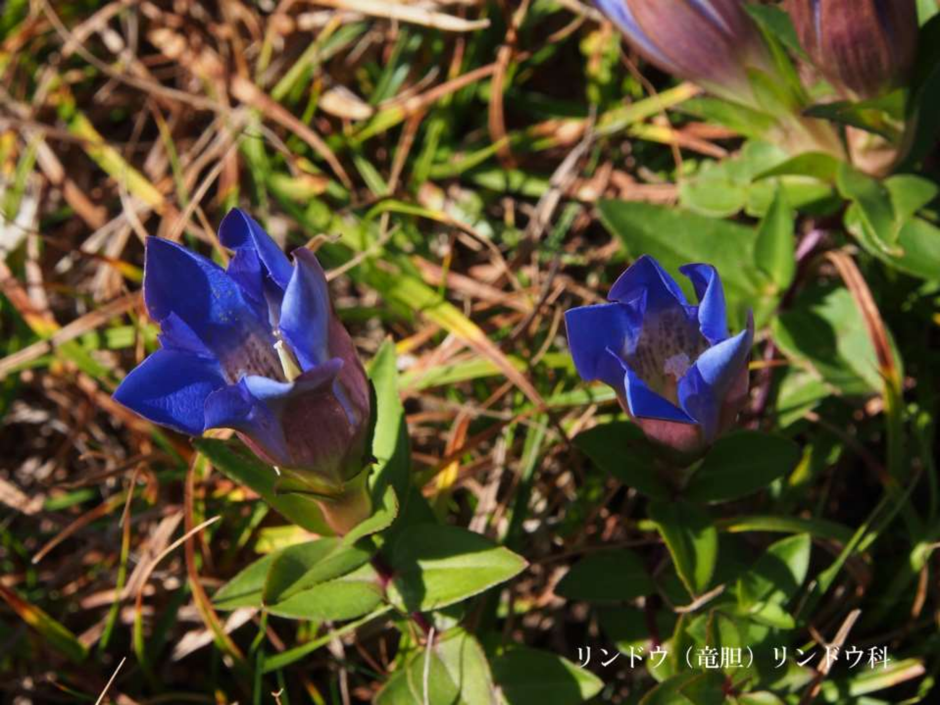
リンドウ（竜胆）リンドウ科