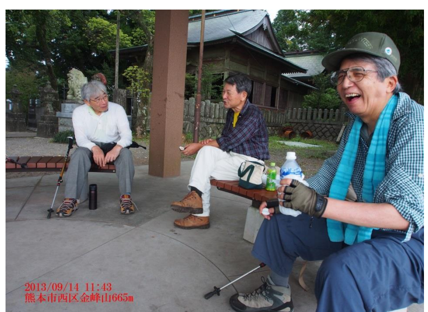
2013/09/14 11:43 熊本市西区金峰山665m