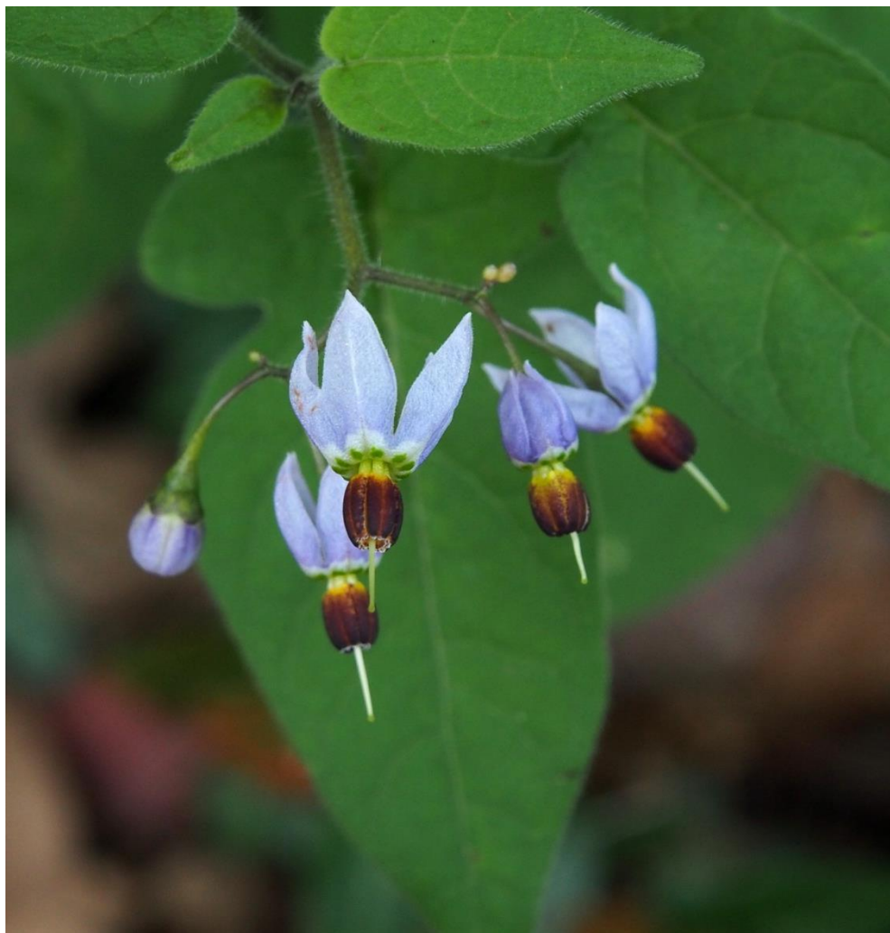
アメリカイヌホオズキ (亜米利加犬酸漿)ナス科