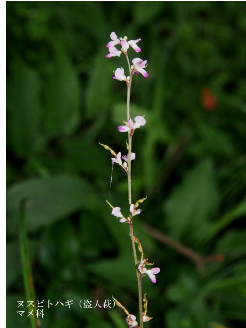
ヌスビトハギ (盗人萩) マメ科