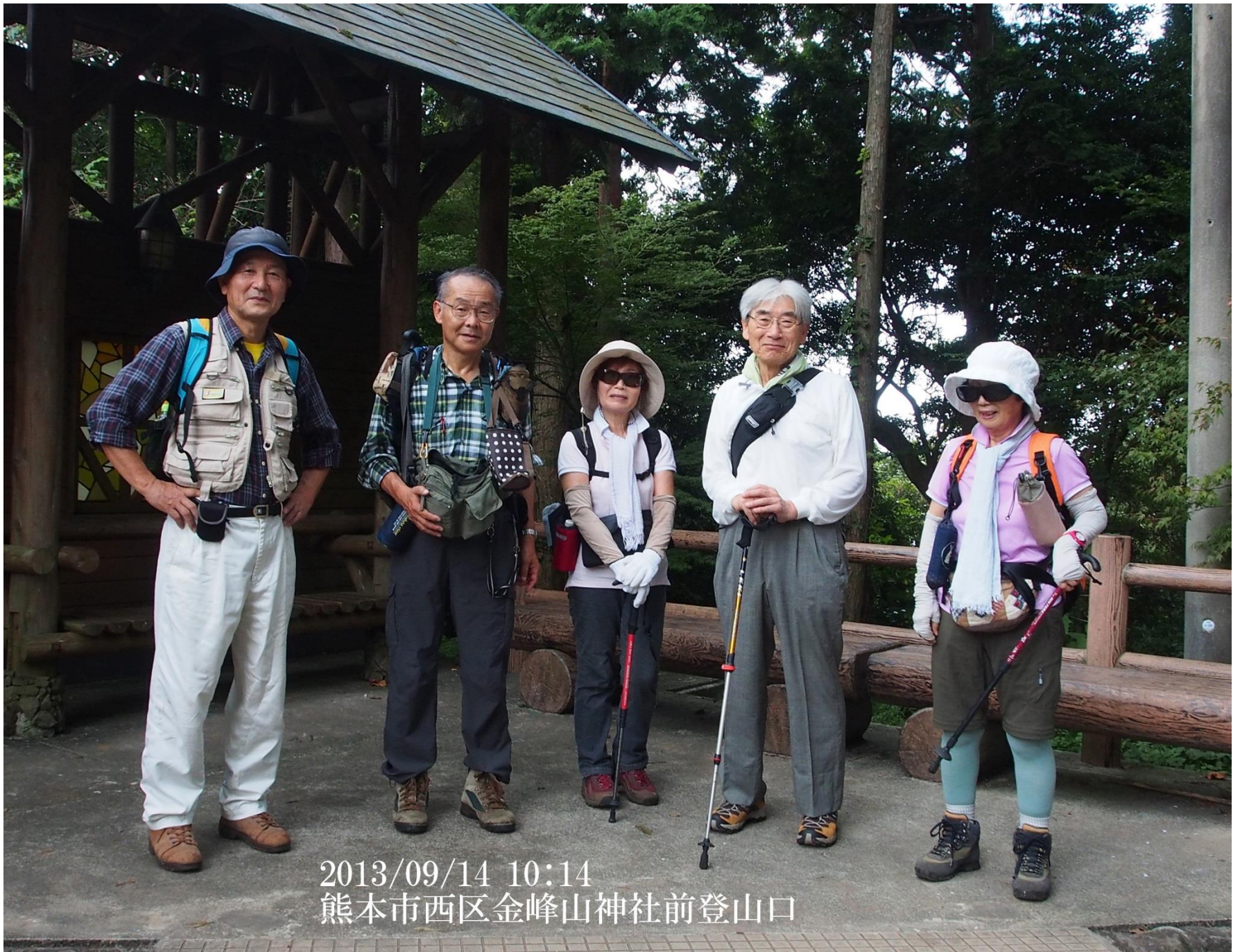
2013/09/14 10:14 熊本市西区金峰山神社前登山口