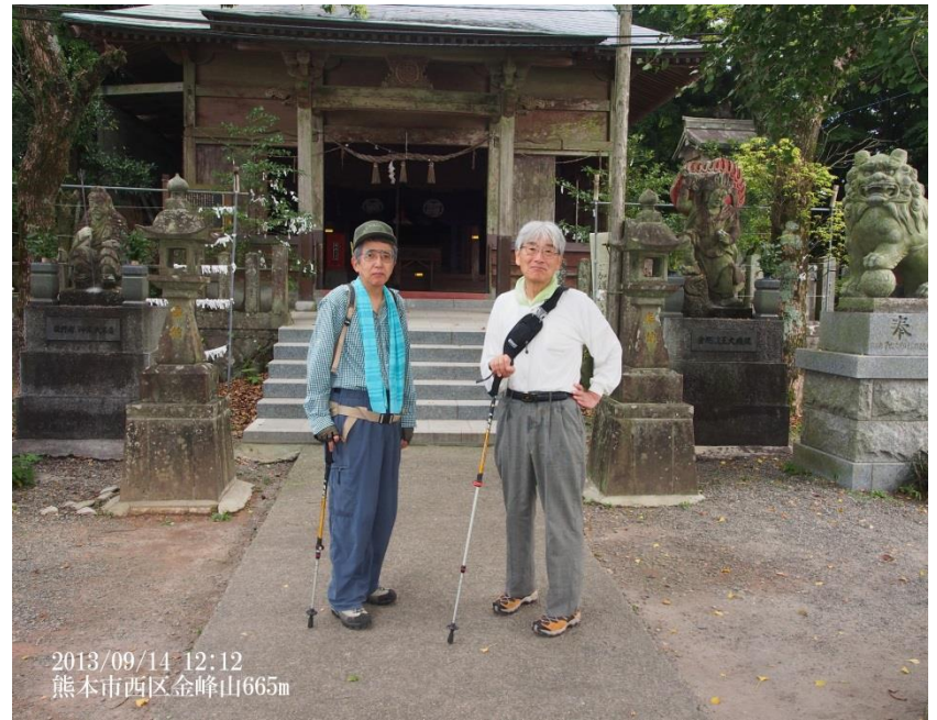
2013/09/14 12:12 熊本市西区金峰山665m