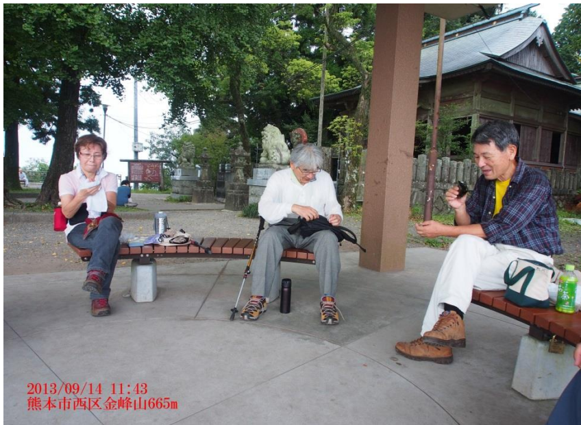
2013/09/14 11:43 熊本市西区金峰山665m