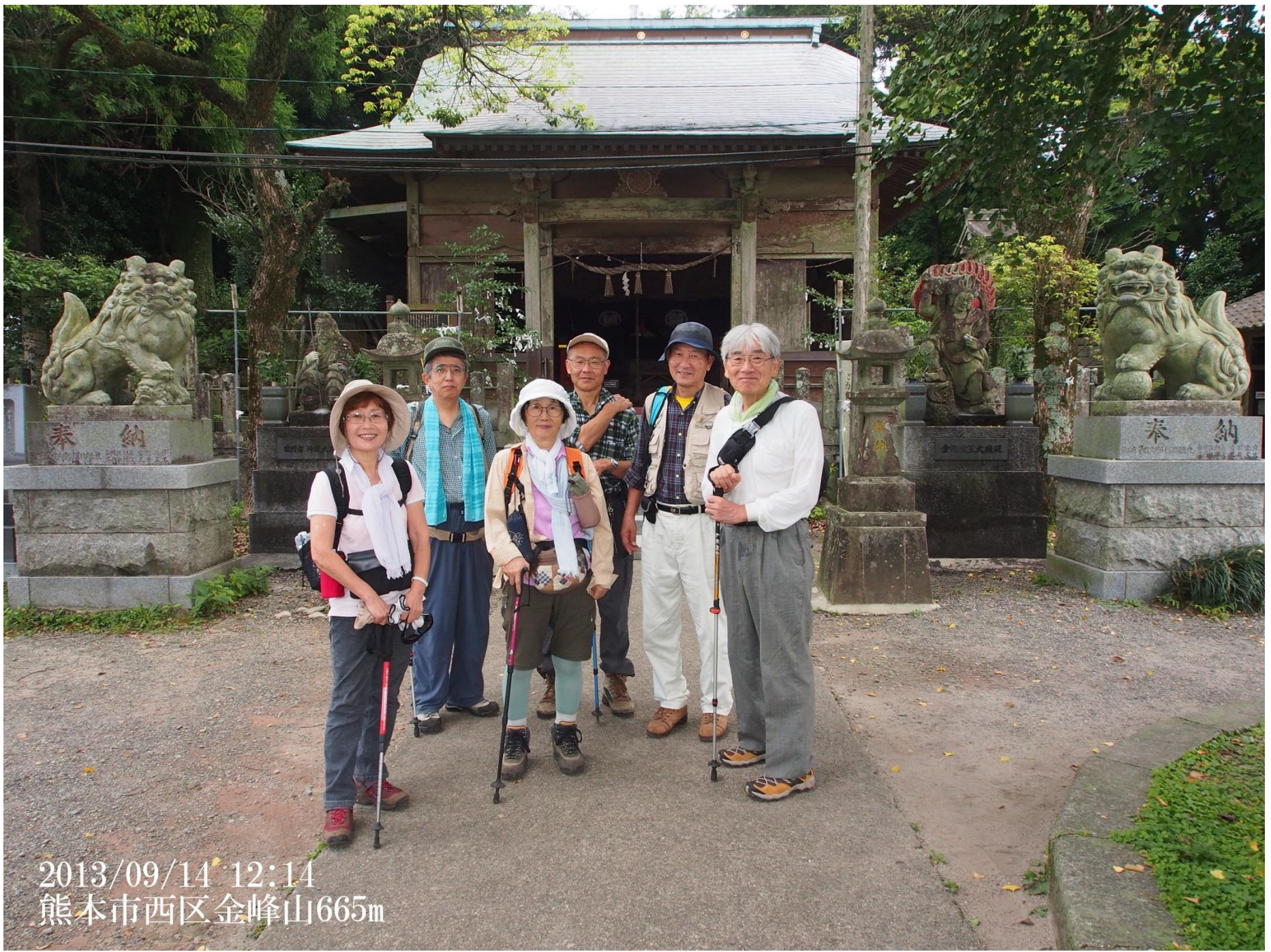
2013/09/14 12:14 熊本市西区金峰山665m