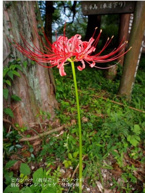
ヒガンバナ (彼岸花) ヒガンバナ科 別名: マンジュシャゲ (曼珠沙華)