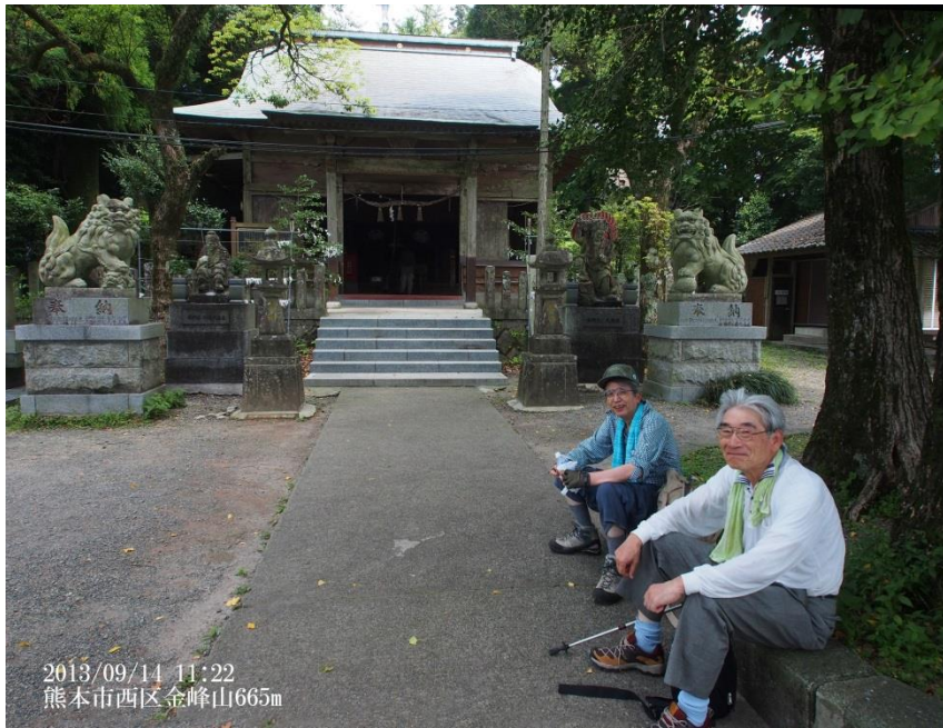
2013/09/14 11:22 熊本市西区金峰山665m