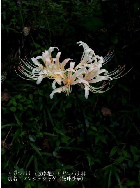
ヒガンバナ (彼岸花) ヒガンバナ科 別名: マンジュシャゲ (曼珠沙華)