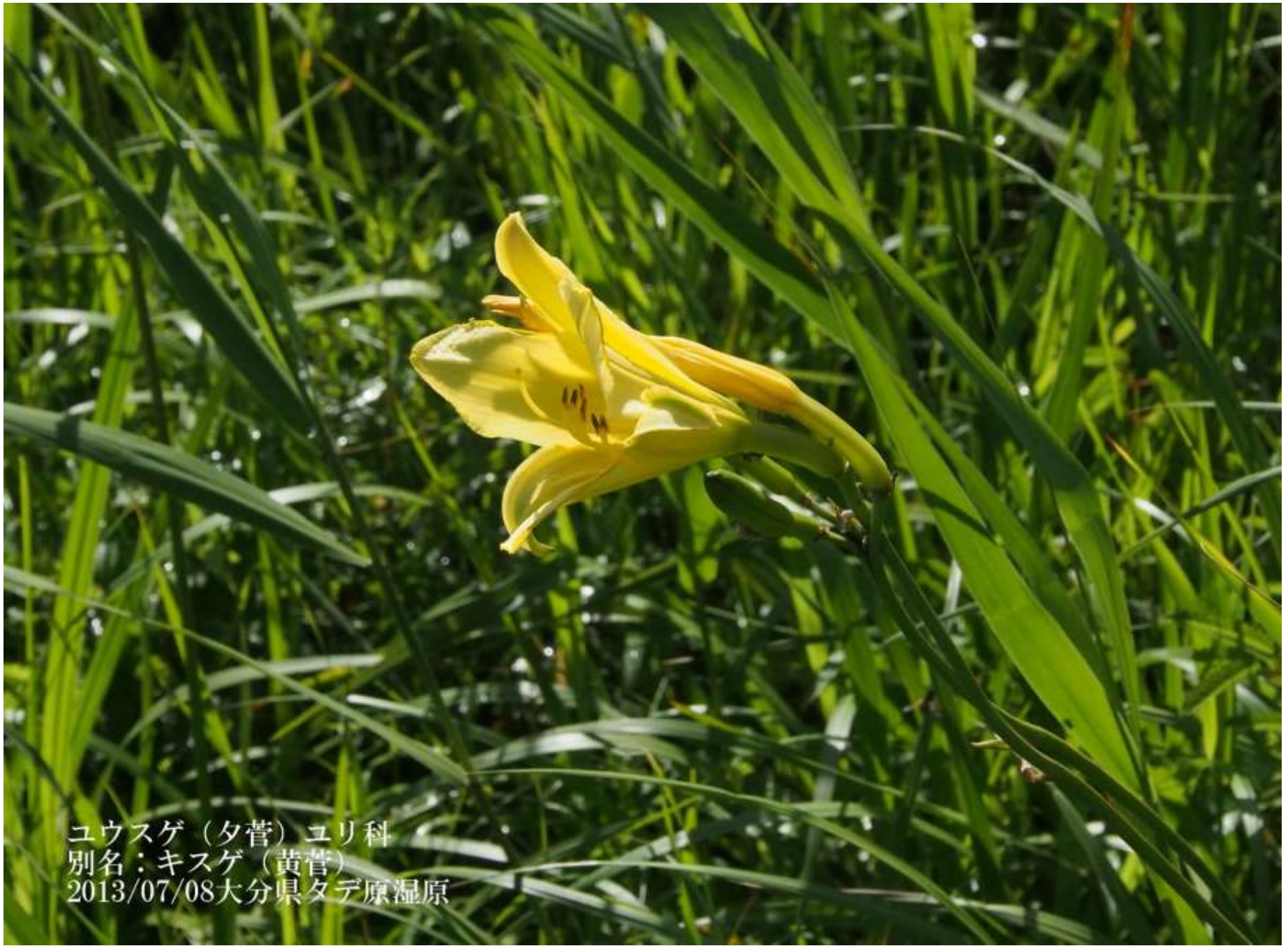
ユウスゲ（夕菅）ユリ科 別名：キスゲ（黄菅） 2013/07/08大分県夕デ原湿原