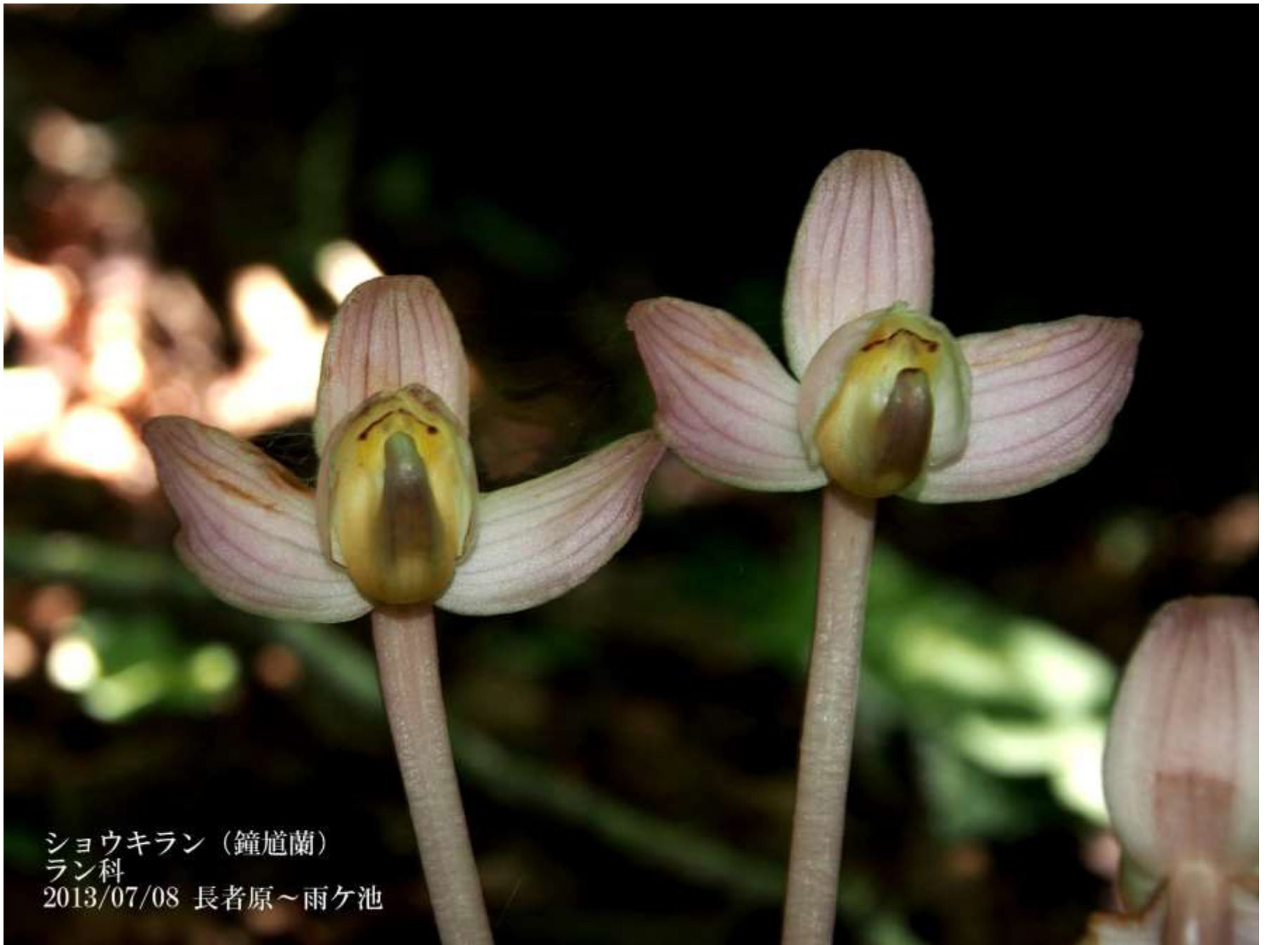
ショウキラン（鐘馗蘭） ラン科 2013/07/08 長者原～雨ヶ池