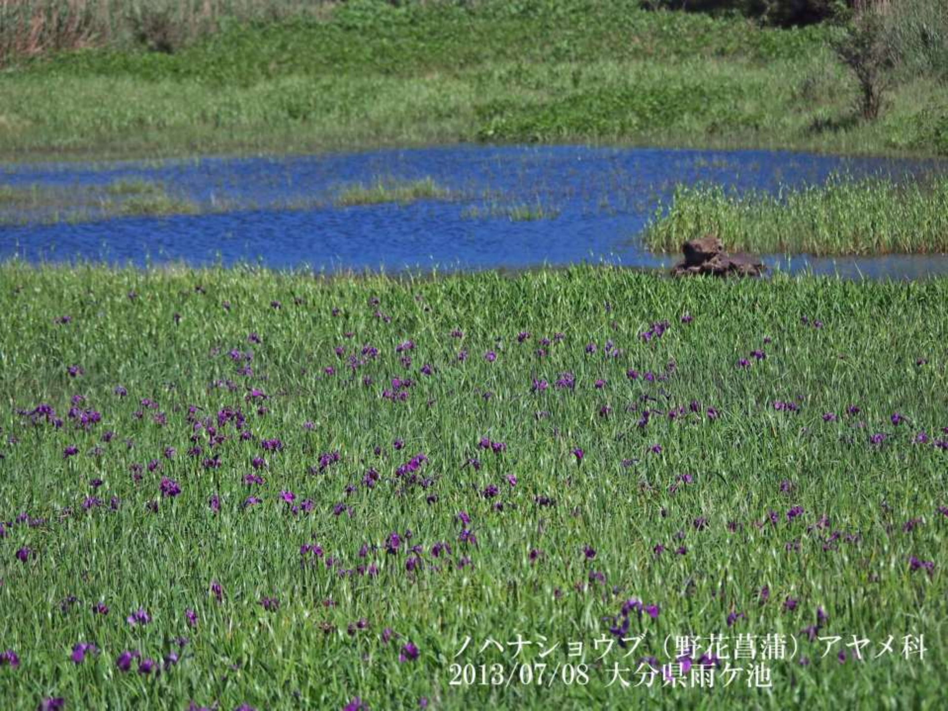
ノハナショウブ（野花菖蒲）アヤメ科 2013/07/08 大分県雨ヶ池