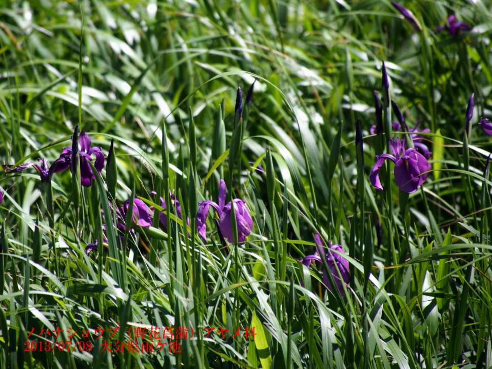
ノバナショウブ (野花菖蒲) アヤメ科 2013/07/08 大分県雨夕池