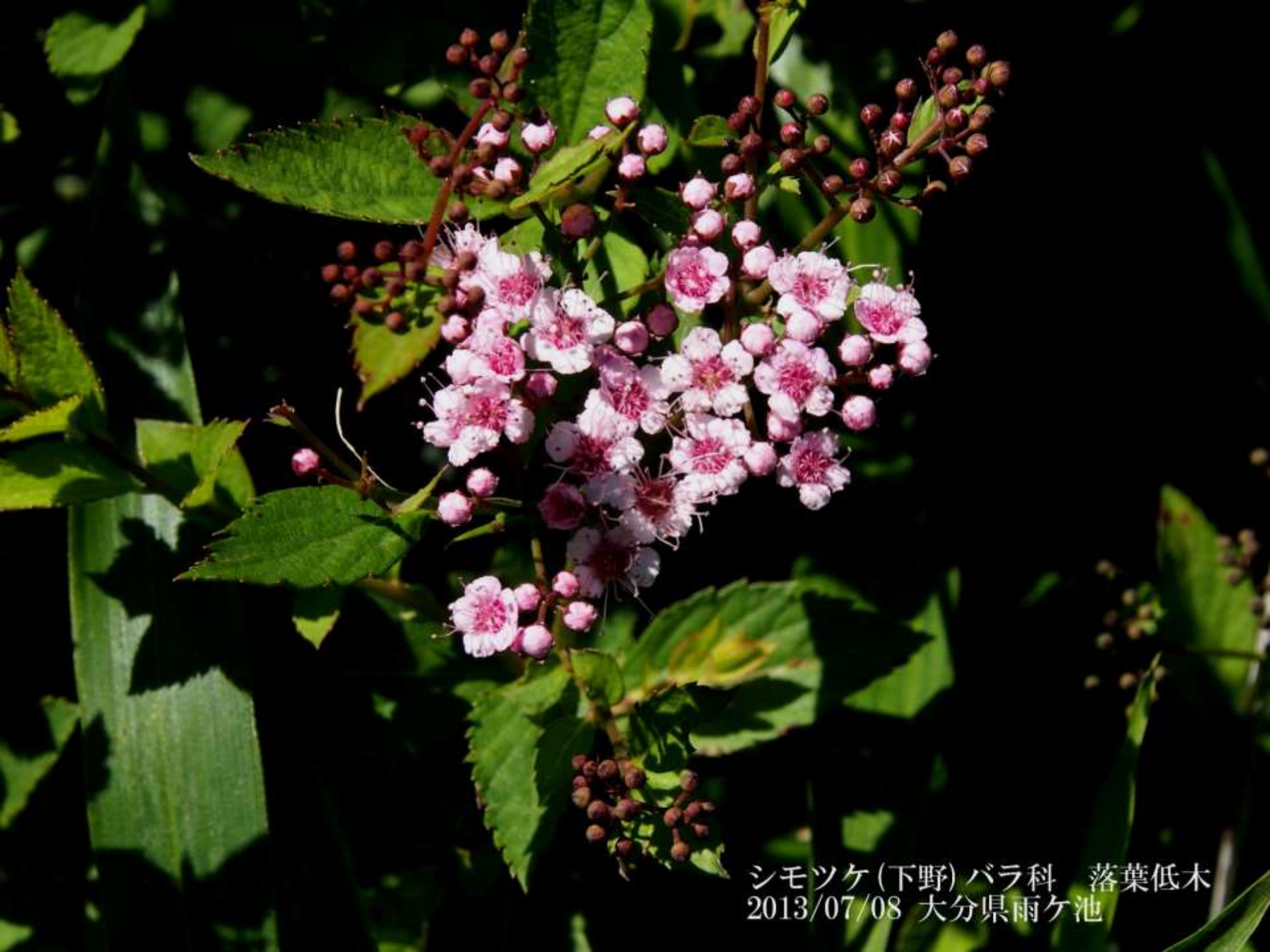
シモツケ(下野)バラ科 落葉低木 2013/07/08 大分県雨ヶ池