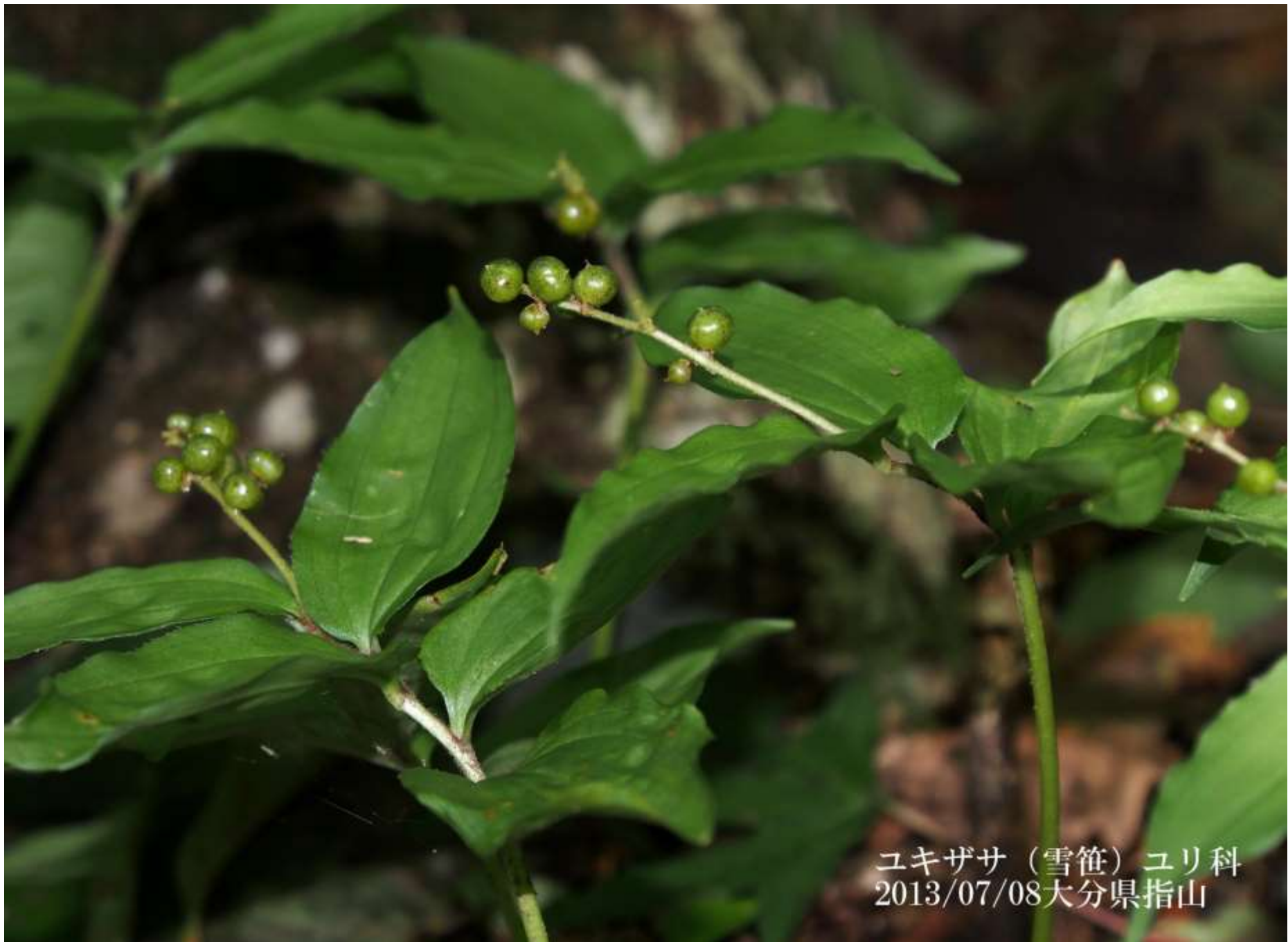
ユキザサ (雪笹) ユリ科 2013/07/08大分県指山