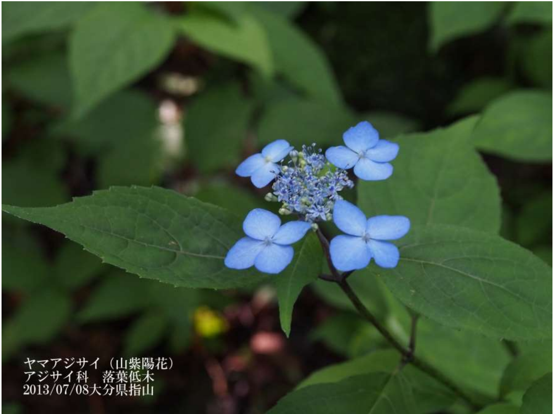
ヤマアジサイ (山紫陽花) アジサイ科 落葉低木 2013/07/08大分県指山