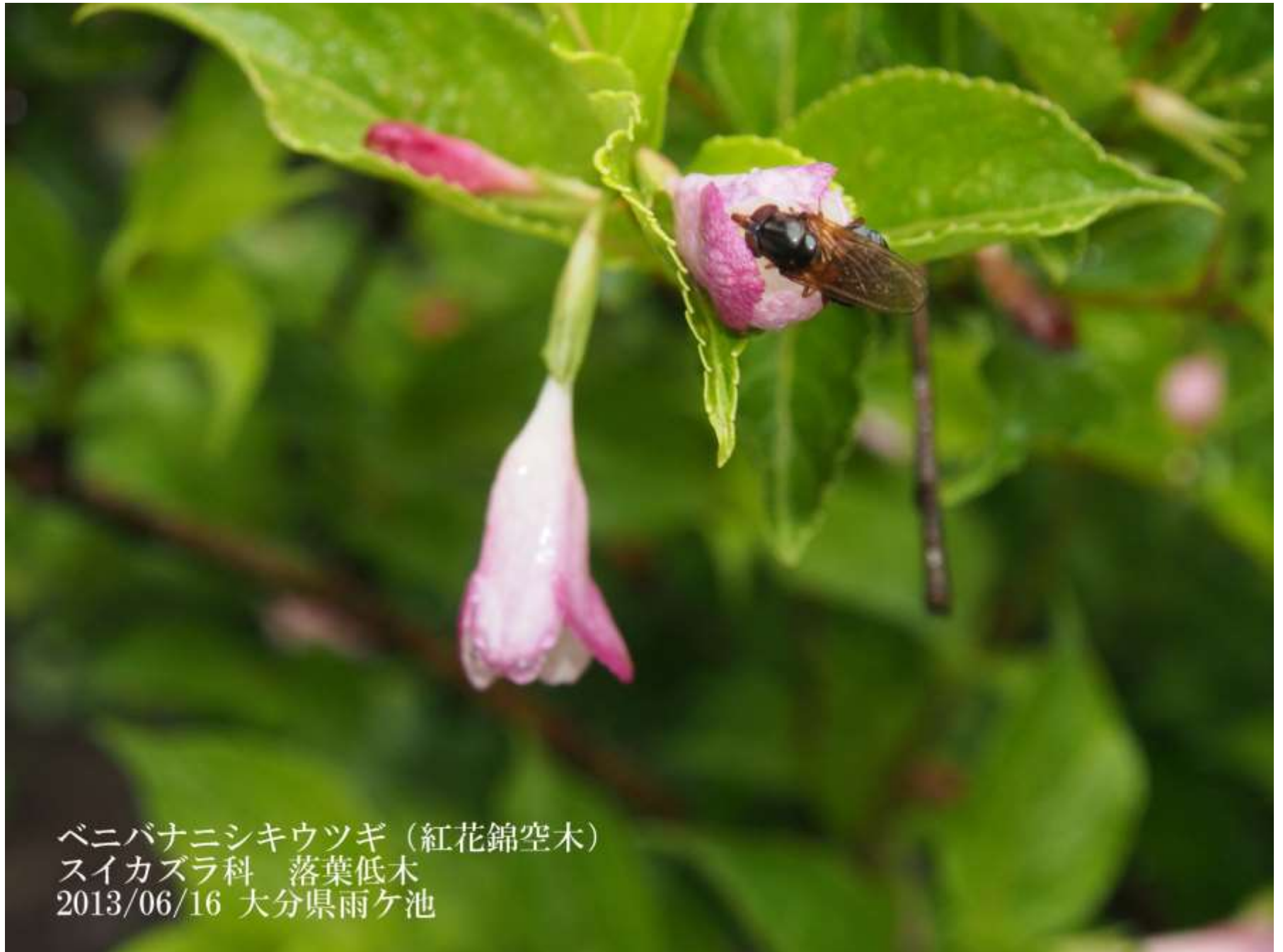
ベニバナニシキウツギ（紅花錦空木） スイカズラ科 落葉低木 2013/06/16 大分県雨ヶ池