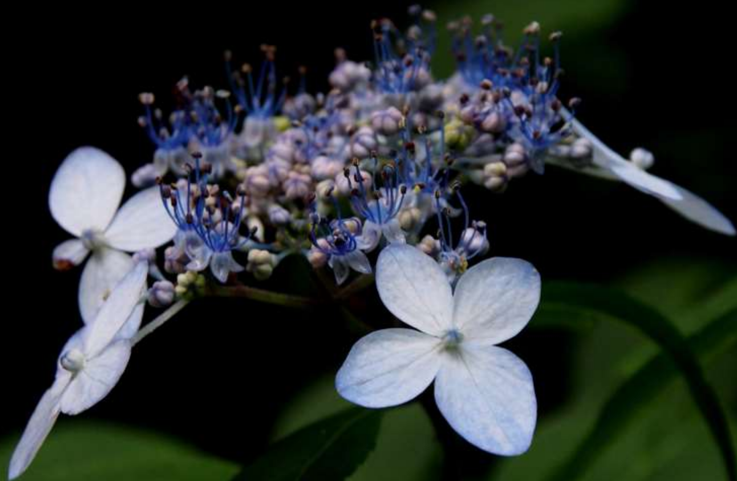
ヤマアジサイ（山紫陽花）アジサイ科 落葉低木 2013/06/29 大分県長者原～雨ヶ池