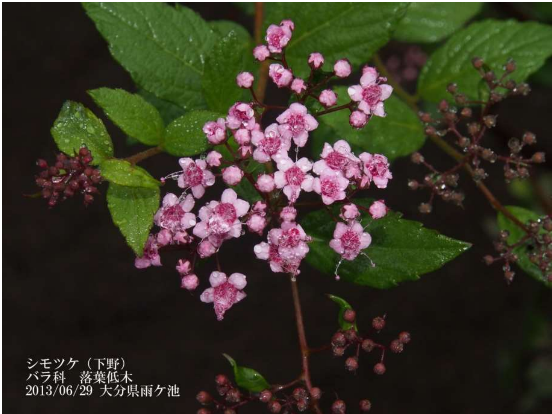
シモツケ（下野） バラ科 落葉低木 2013/06/29 大分県雨ヶ池