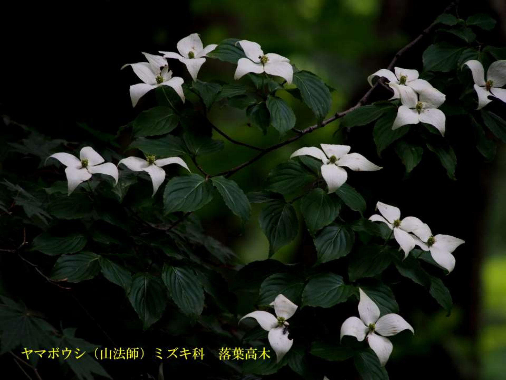
ヤマボウシ（山法師）ミズキ科 落葉高木