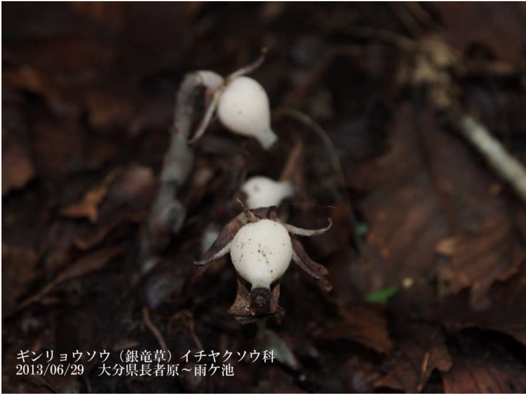
ギンリョウソウ（銀竜草）イチヤクソウ科 2013/06/29 大分県長者原～雨ヶ池