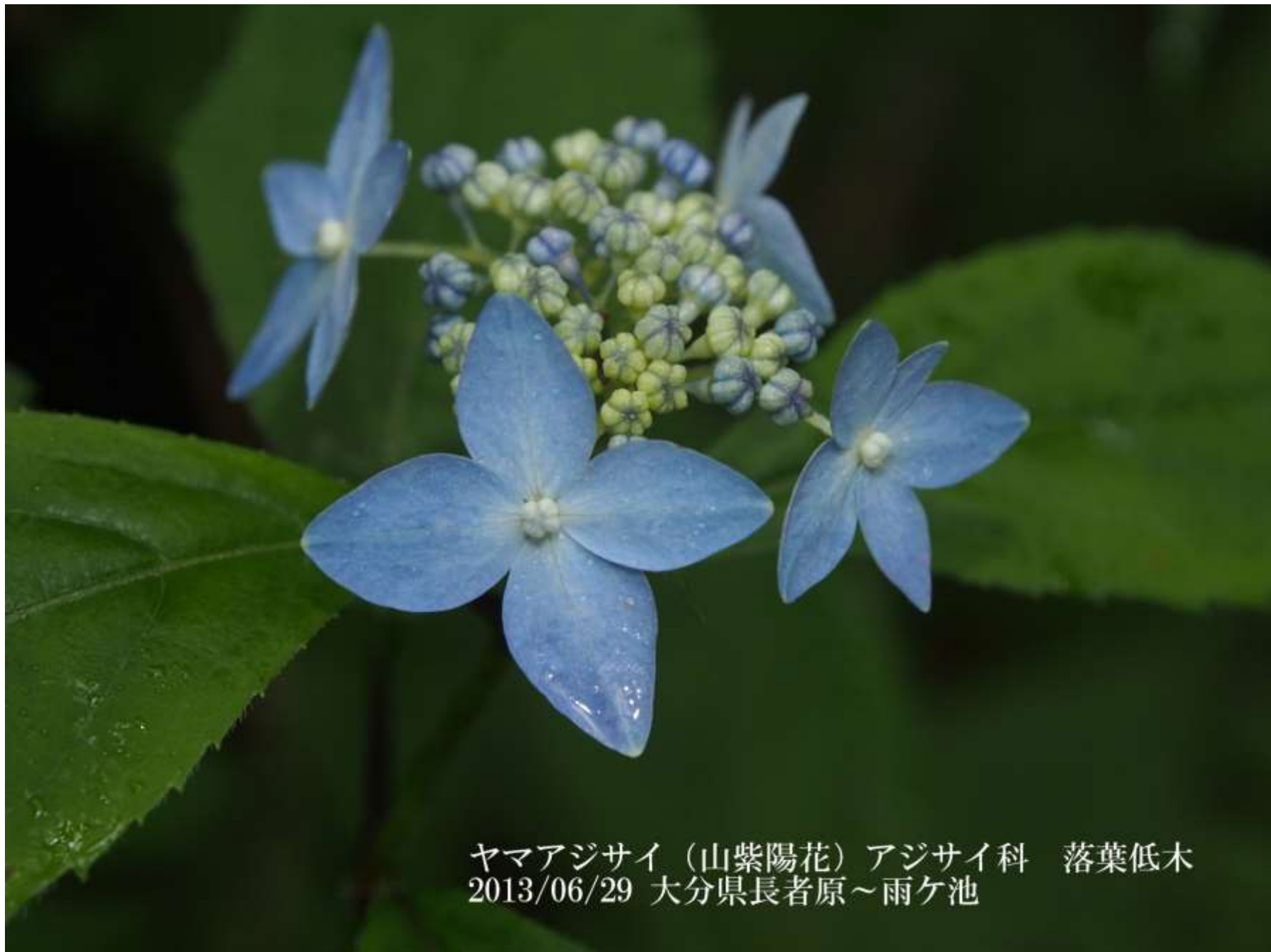
ヤマアジサイ (山紫陽花) アジサイ科 落葉低木 2013/06/29 大分県長者原～雨ヶ池