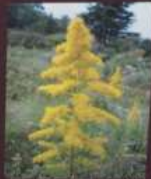
セイタカアワダチソウ