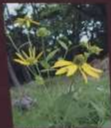
オオハンゴンソウ