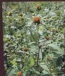
アメリカセンダングサ