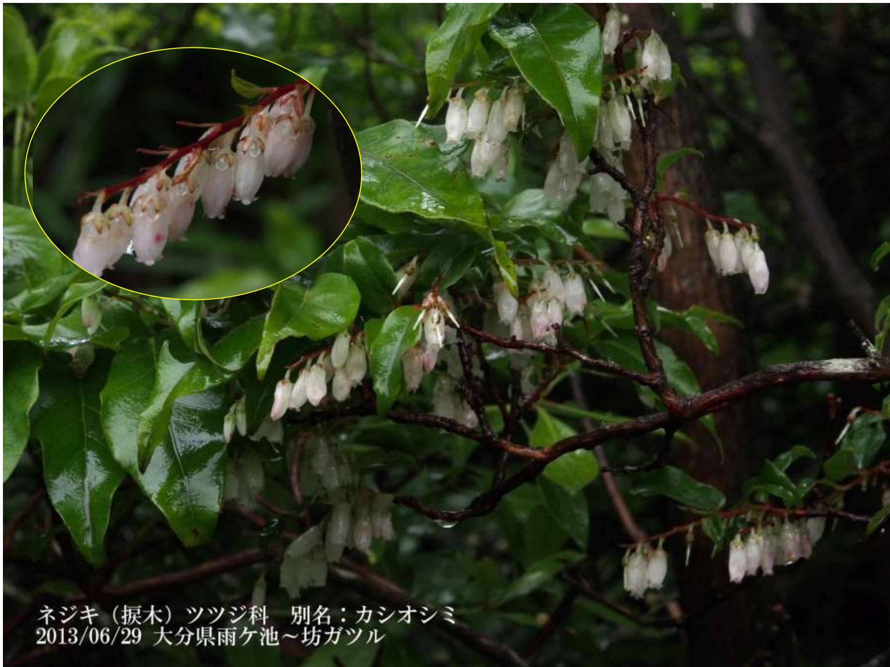
ネジキ (捩木) ツツジ科 別名：カシオシミ 2013/06/29 大分県雨ヶ池～坊ガツル