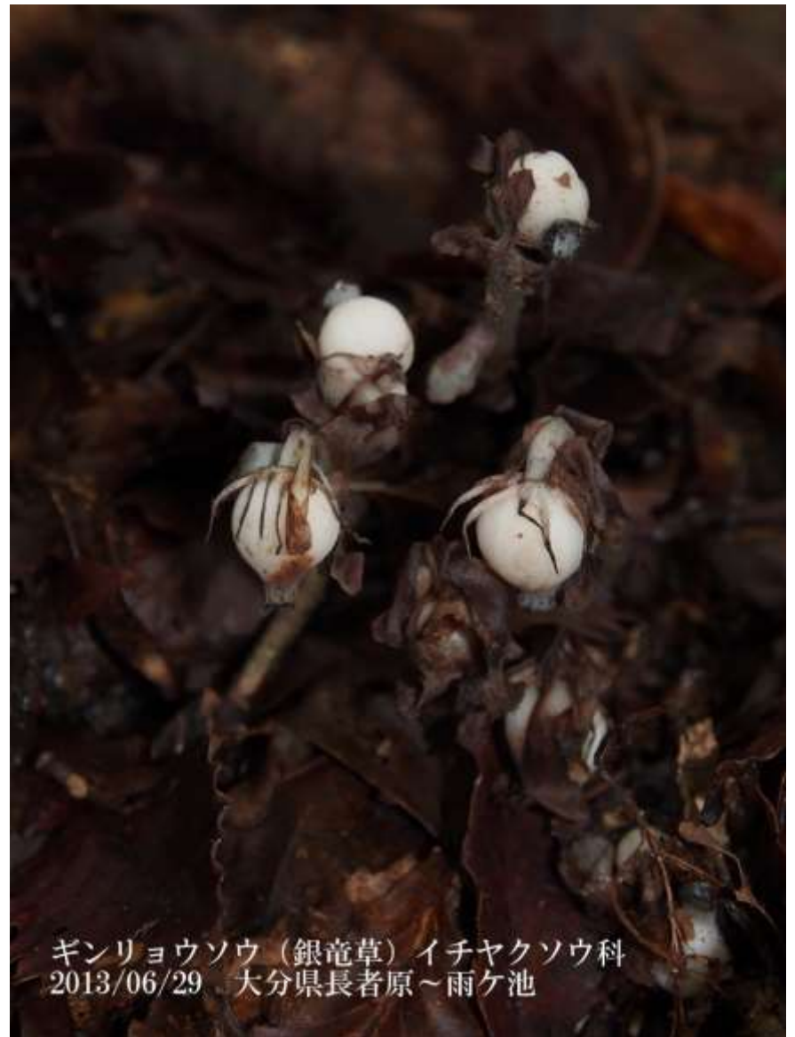
ギンリョウソウ（銀竜草）イチャクソウ科 2013/06/29 大分県長者原～雨ヶ池