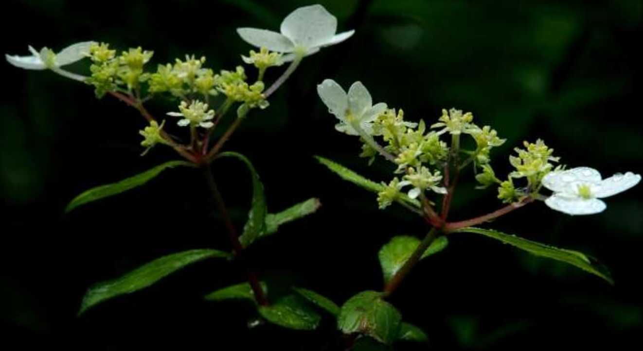
コガクウツギ(小額空木)ユキノシタ科 2013/06/01 佐賀県七山村檜原湿原