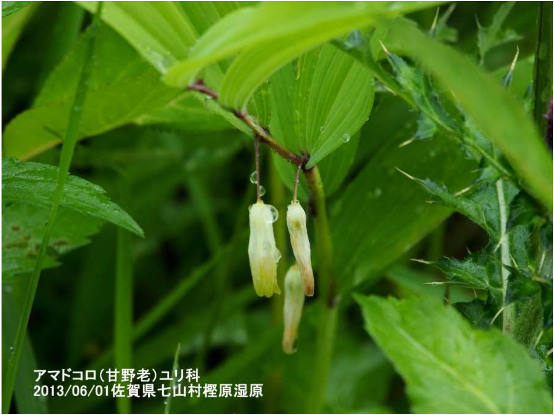
アマドコロ(甘野老)ユリ科 2013/06/01佐賀県七山村檜原湿原