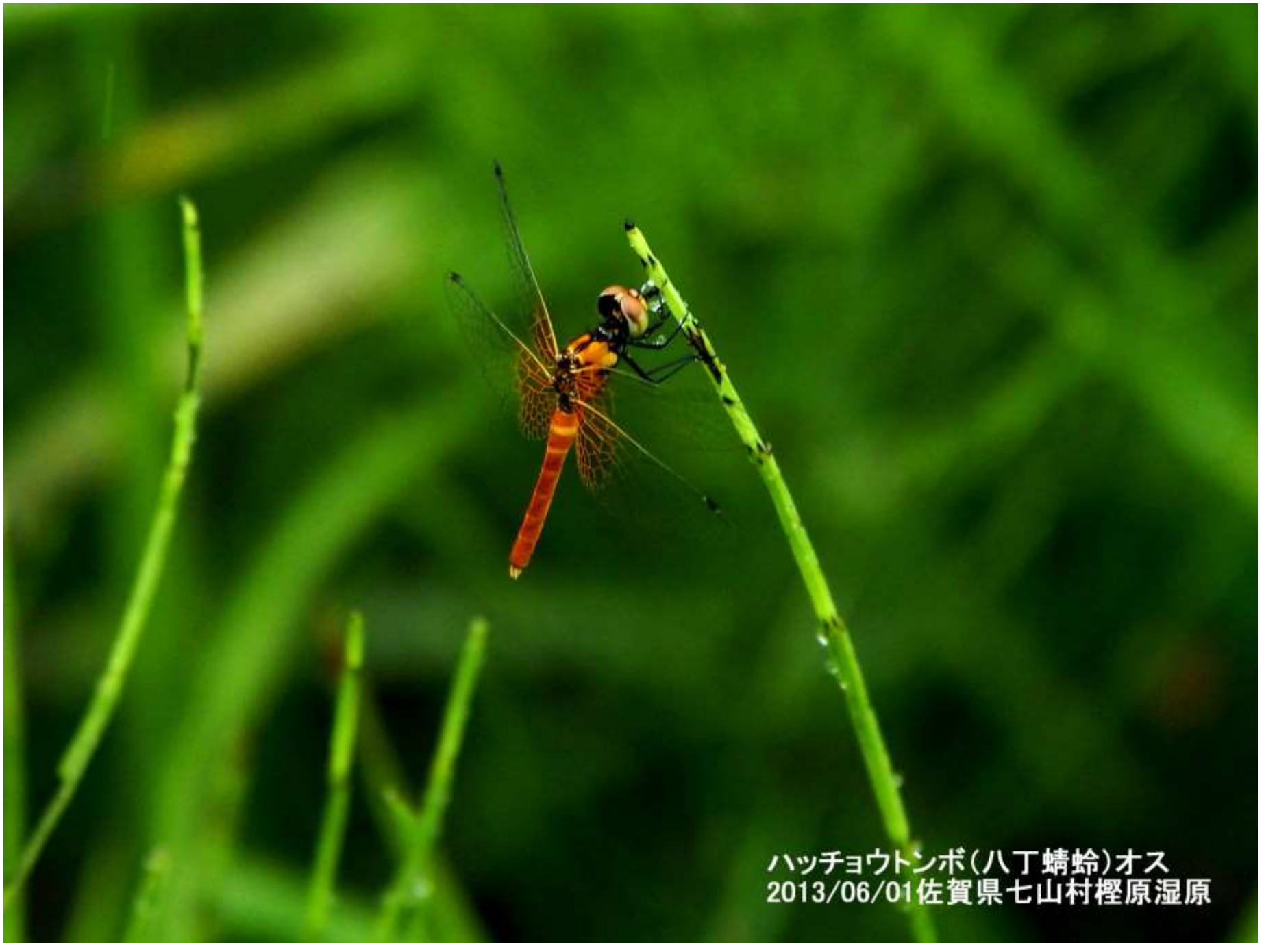
ハッチョウトンボ(八丁蜻蛉)オス 2013/06/01佐賀県七山村檜原湿原