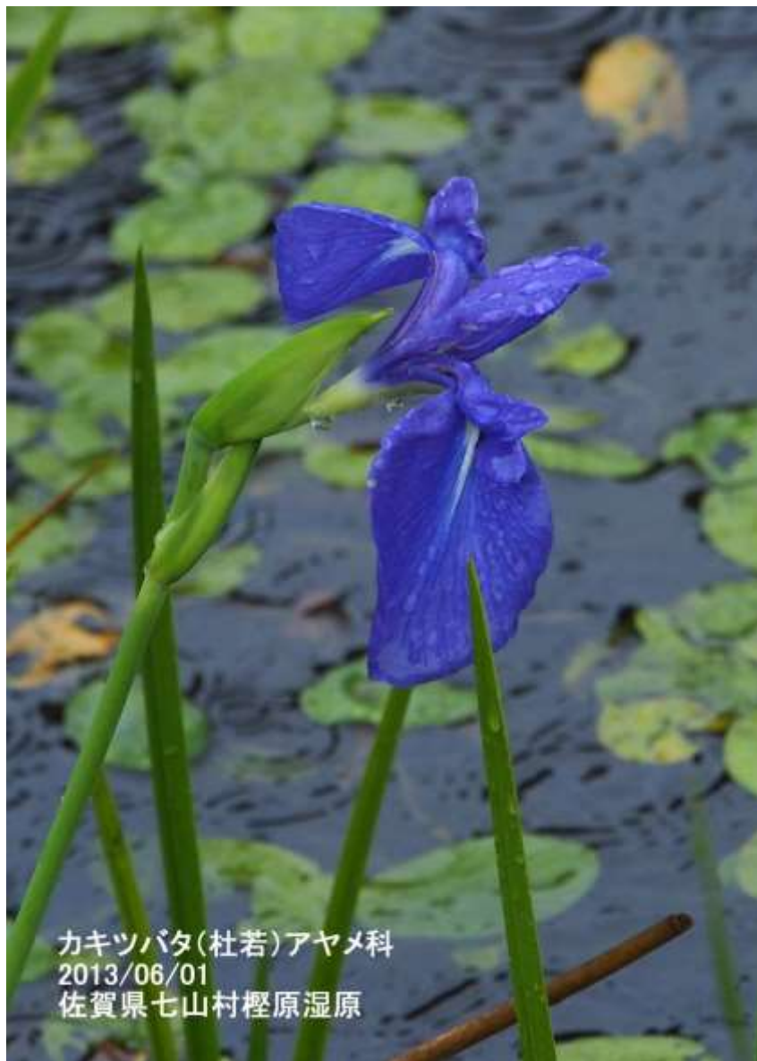
カキツバタ(杜若)アヤメ科 2013/06/01 佐賀県七山村檜原湿原