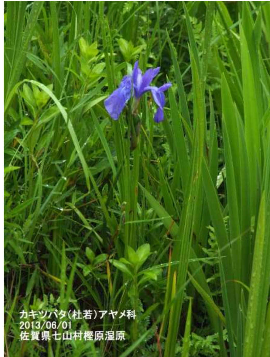
カキツバタ(杜若)アヤメ科 2013/06/01 佐賀県七山村檜原湿原