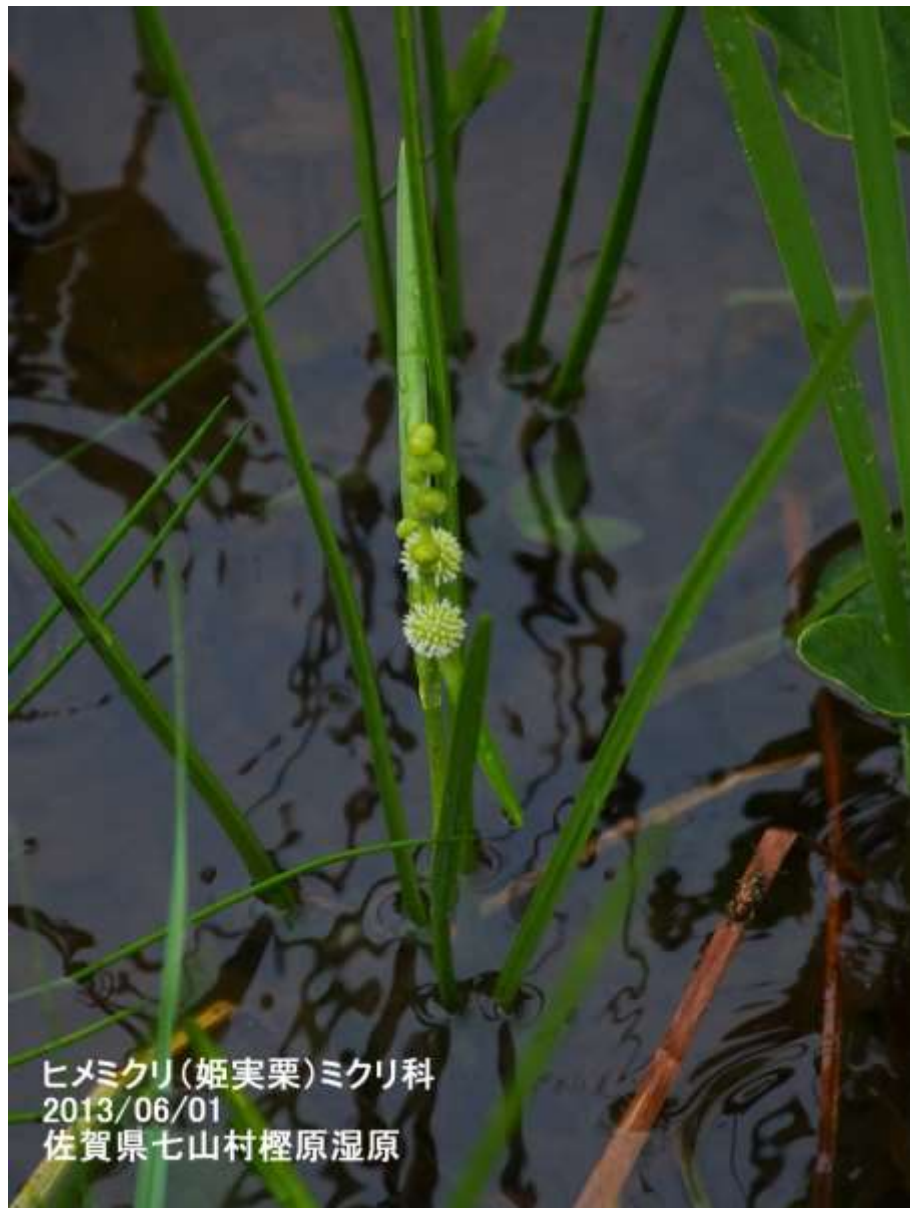
ヒメミクリ(姫実栗)ミクリ科 2013/06/01 佐賀県七山村檜原湿原