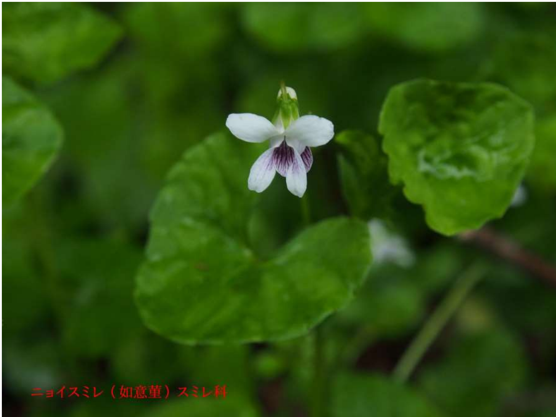
ニョイスミレ（如意堇）スミレ科