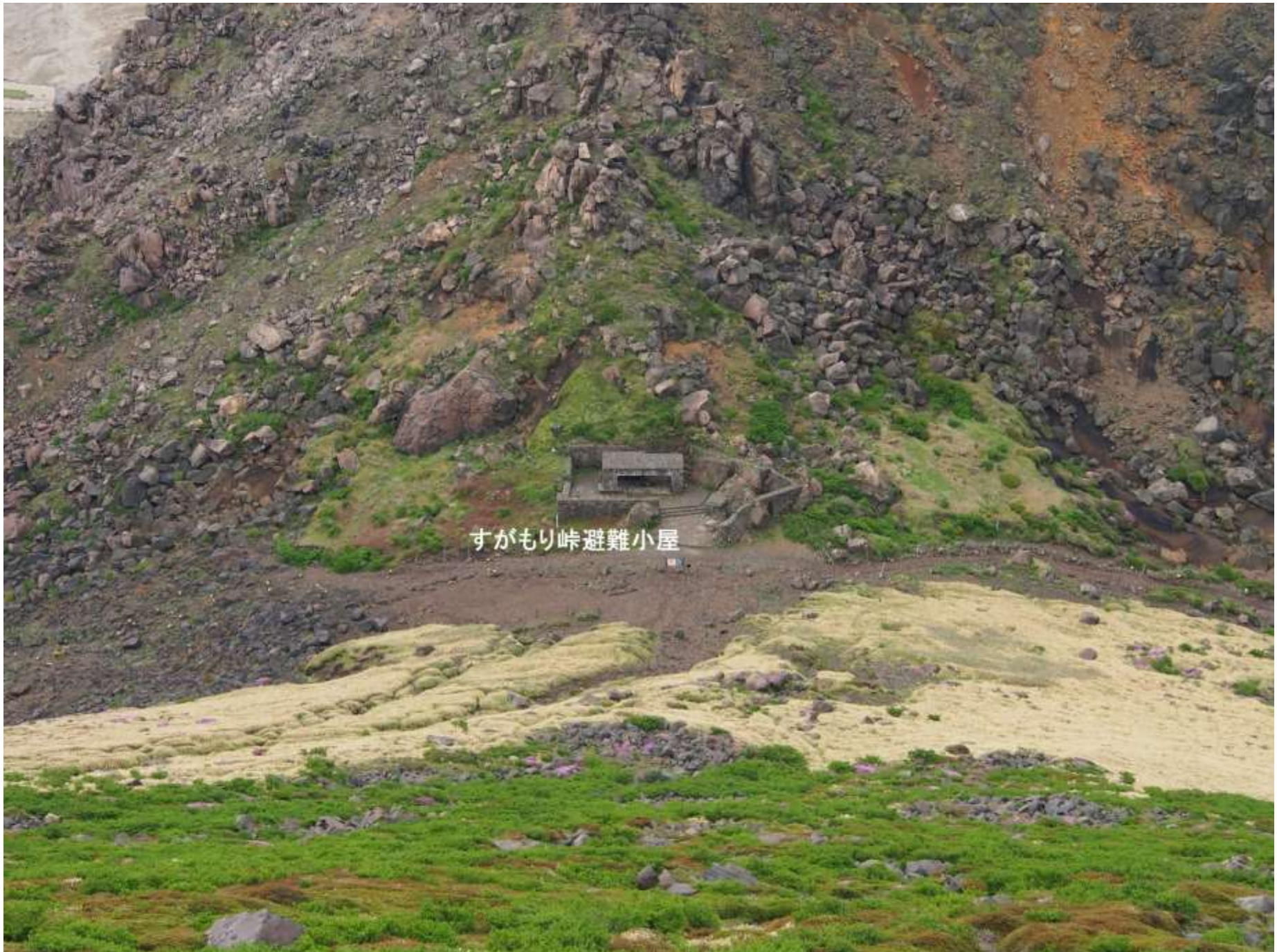
すがもり峠避難小屋