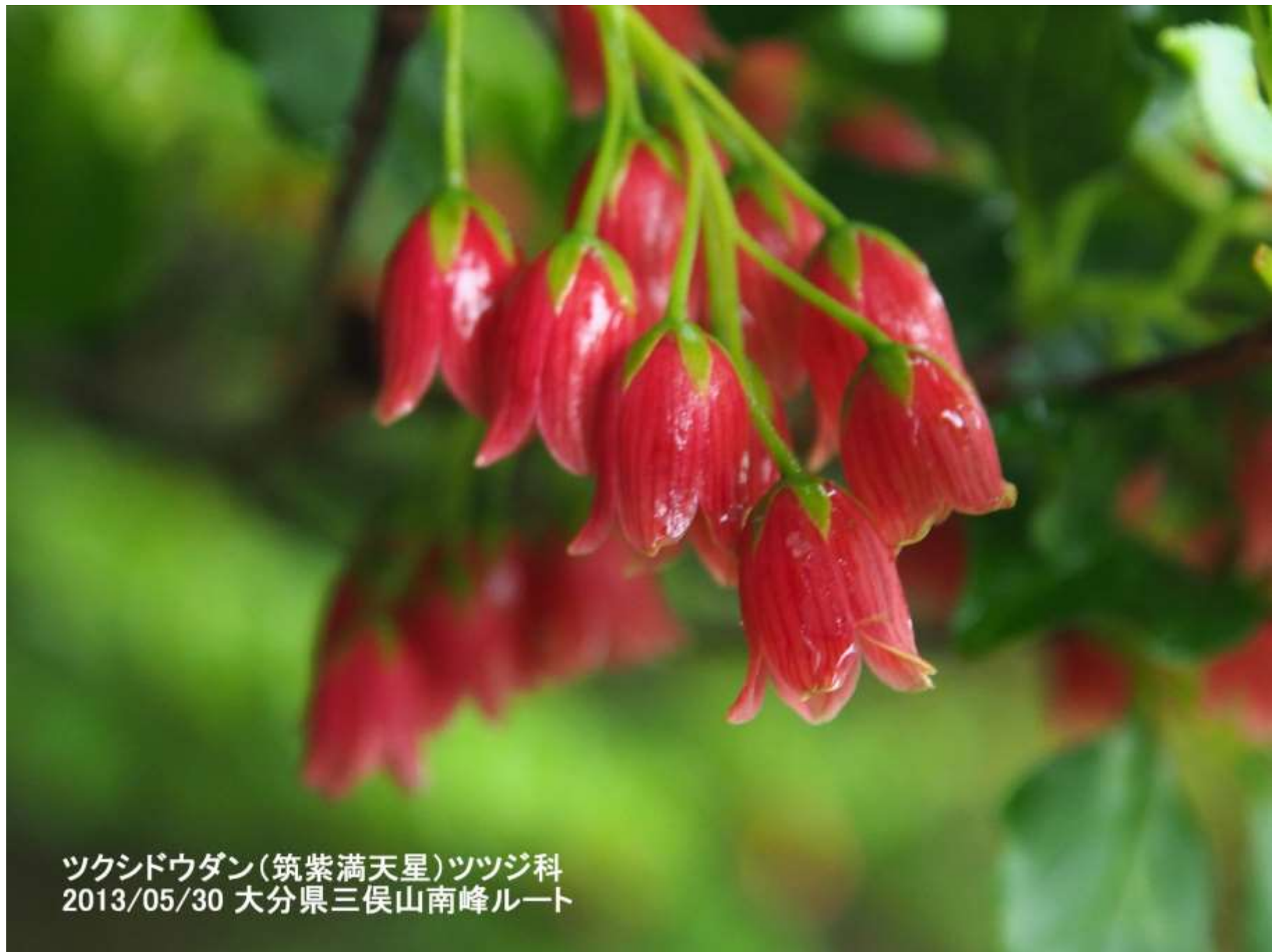
ツクシドウダン(筑紫満天星)ツツジ科 2013/05/30 大分県三俣山南峰ルート