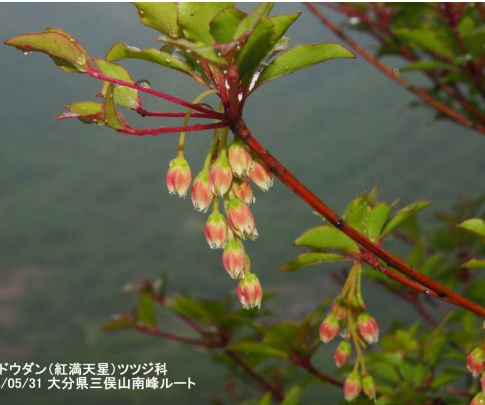
ベニドウダン(紅満天星)ツツジ科 2013/05/31 大分県三俣山南峰ルート