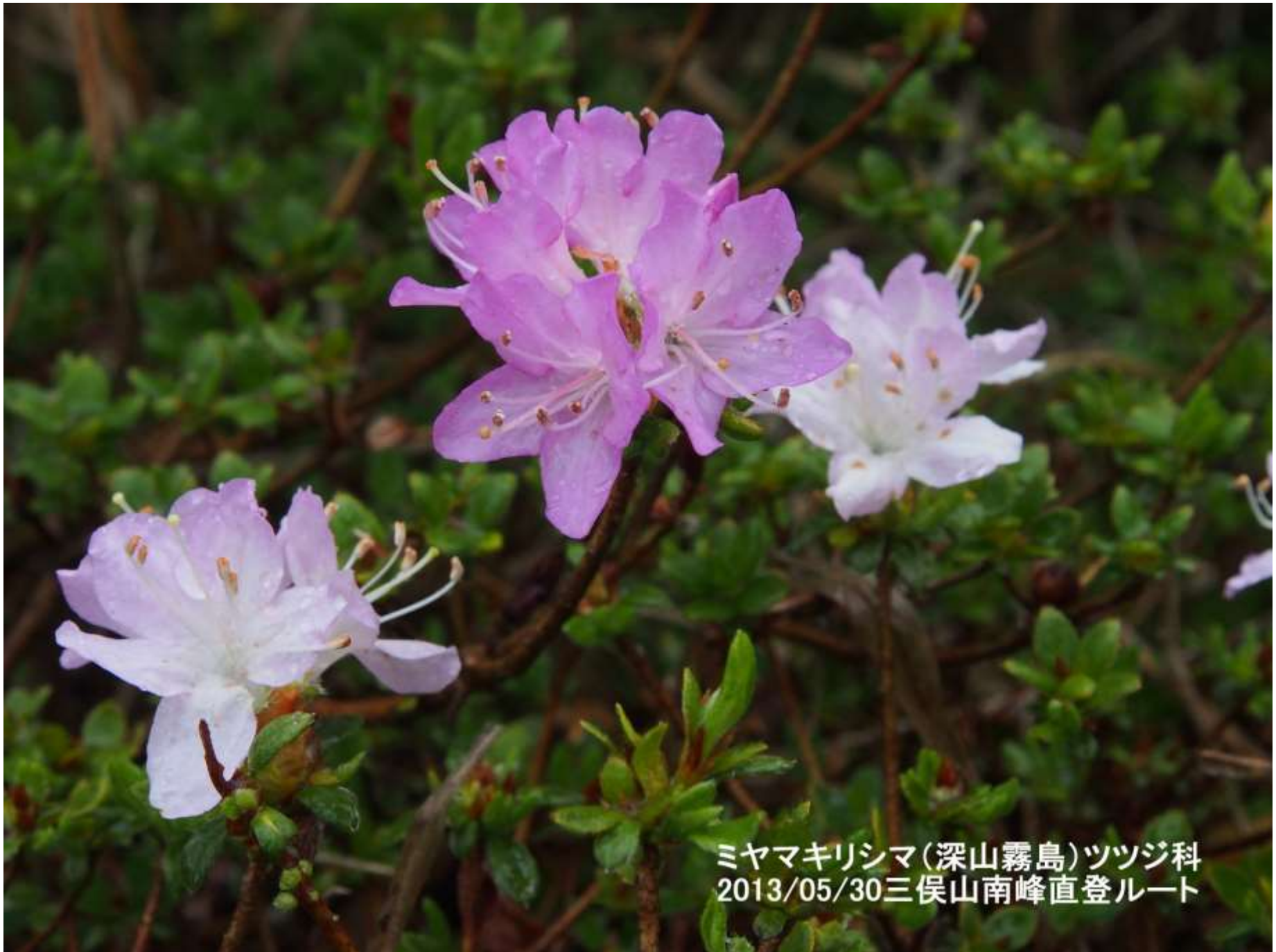
ミヤマキリシマ(深山霧島)ツツジ科 2013/05/30三俣山南峰直登ルート