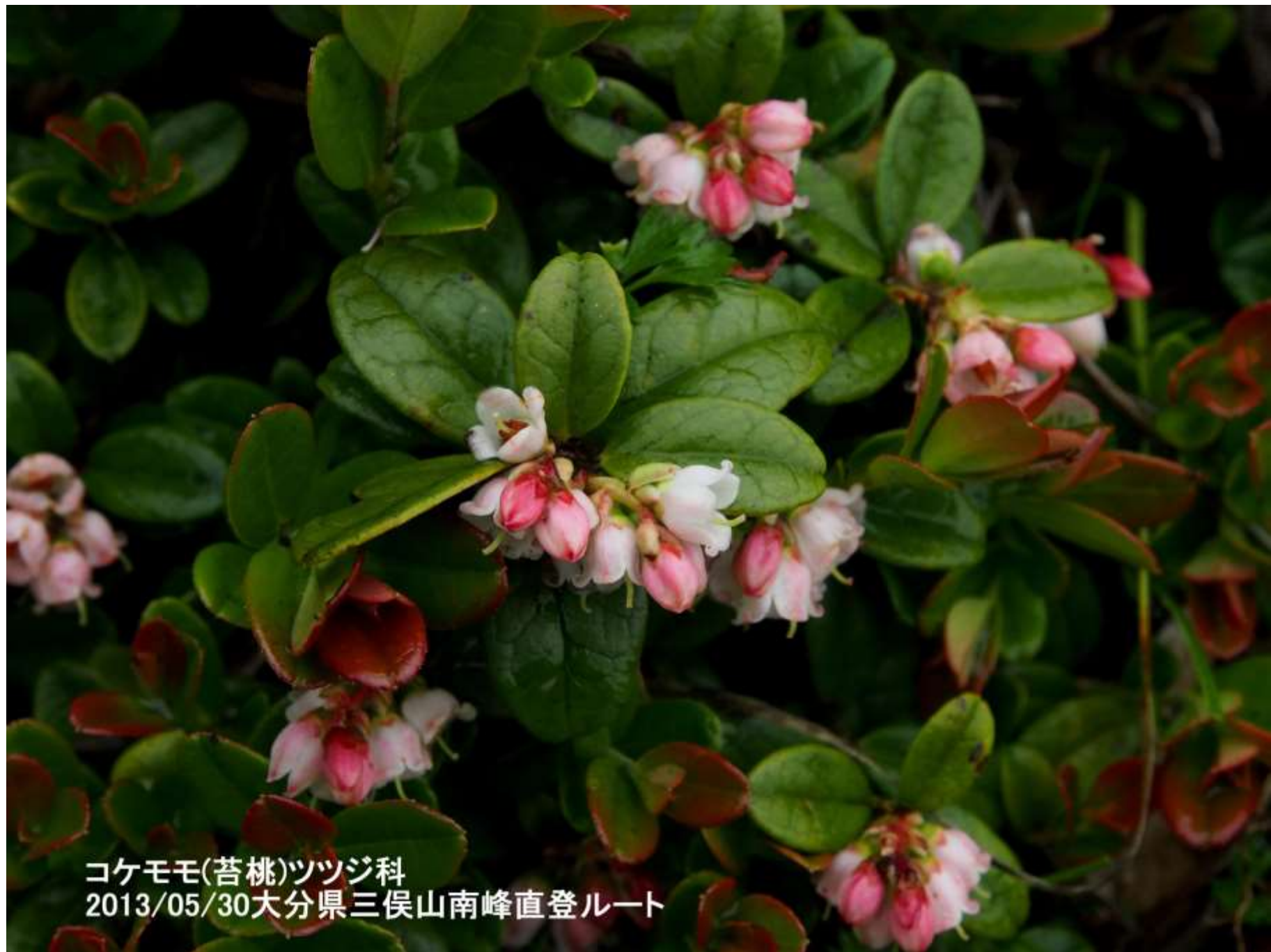
コケモモ(苔桃)ツツジ科 2013/05/30大分県三俣山南峰直登ルート