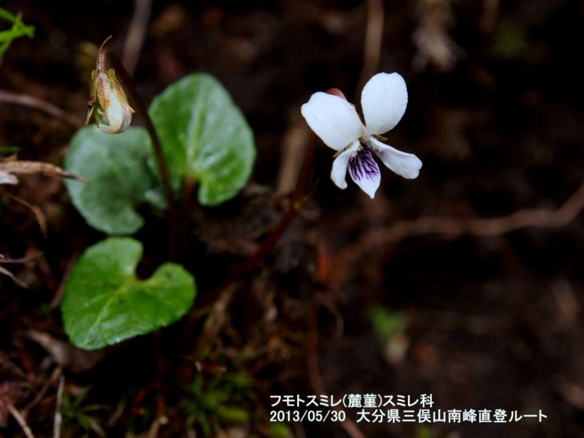
フモトスミレ(麓堇)スミレ科 2013/05/30 大分県三俣山南峰直登ルート