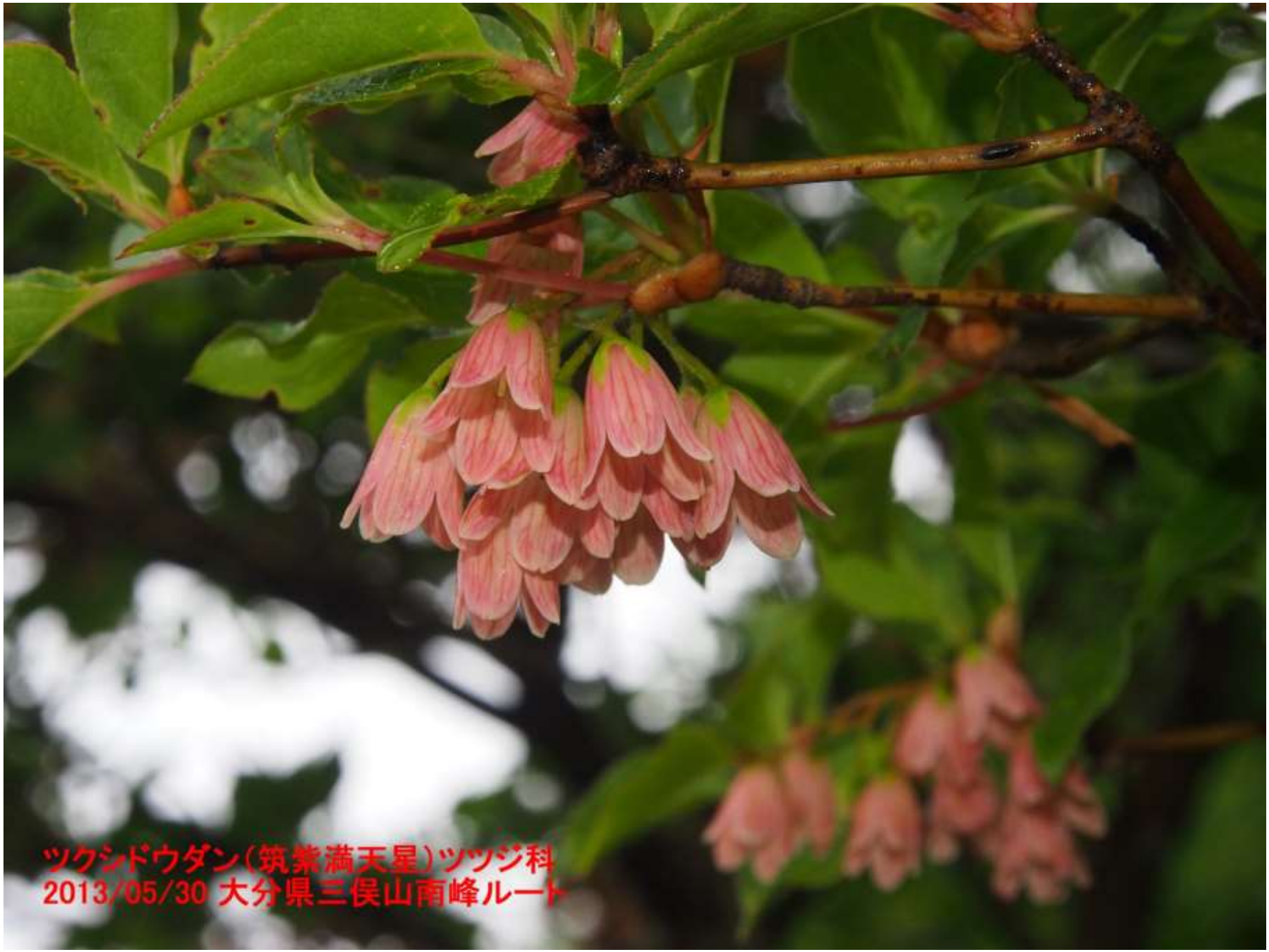
ツクシドウダン(筑紫満天星)ツツジ科 2013/05/30 大分県三俣山南峰ルート