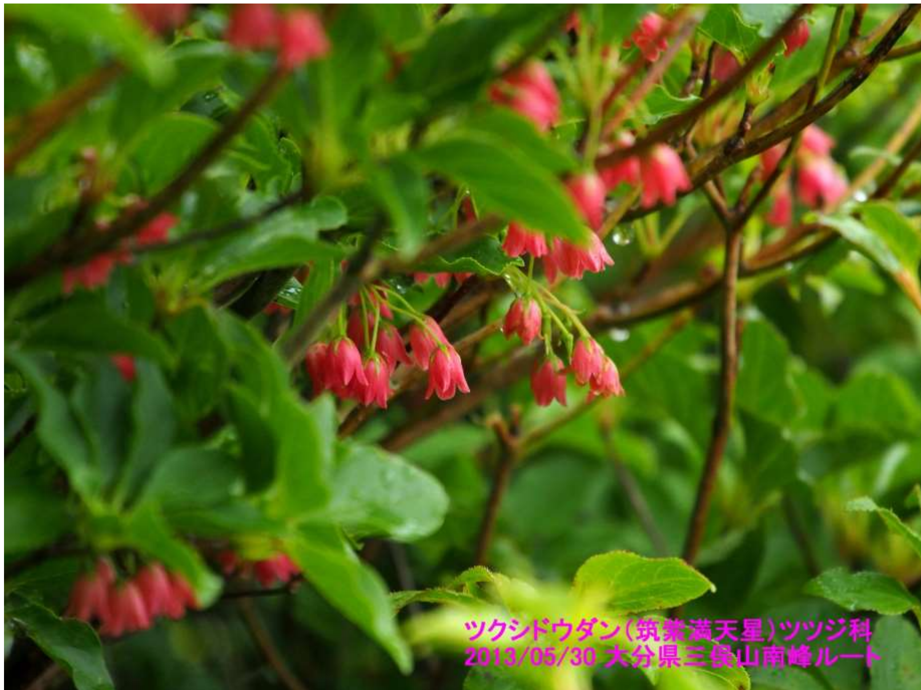
ツクシドウダン(筑紫満天星)ツツジ科 2013/05/30 大分県三俣山南峰ルート