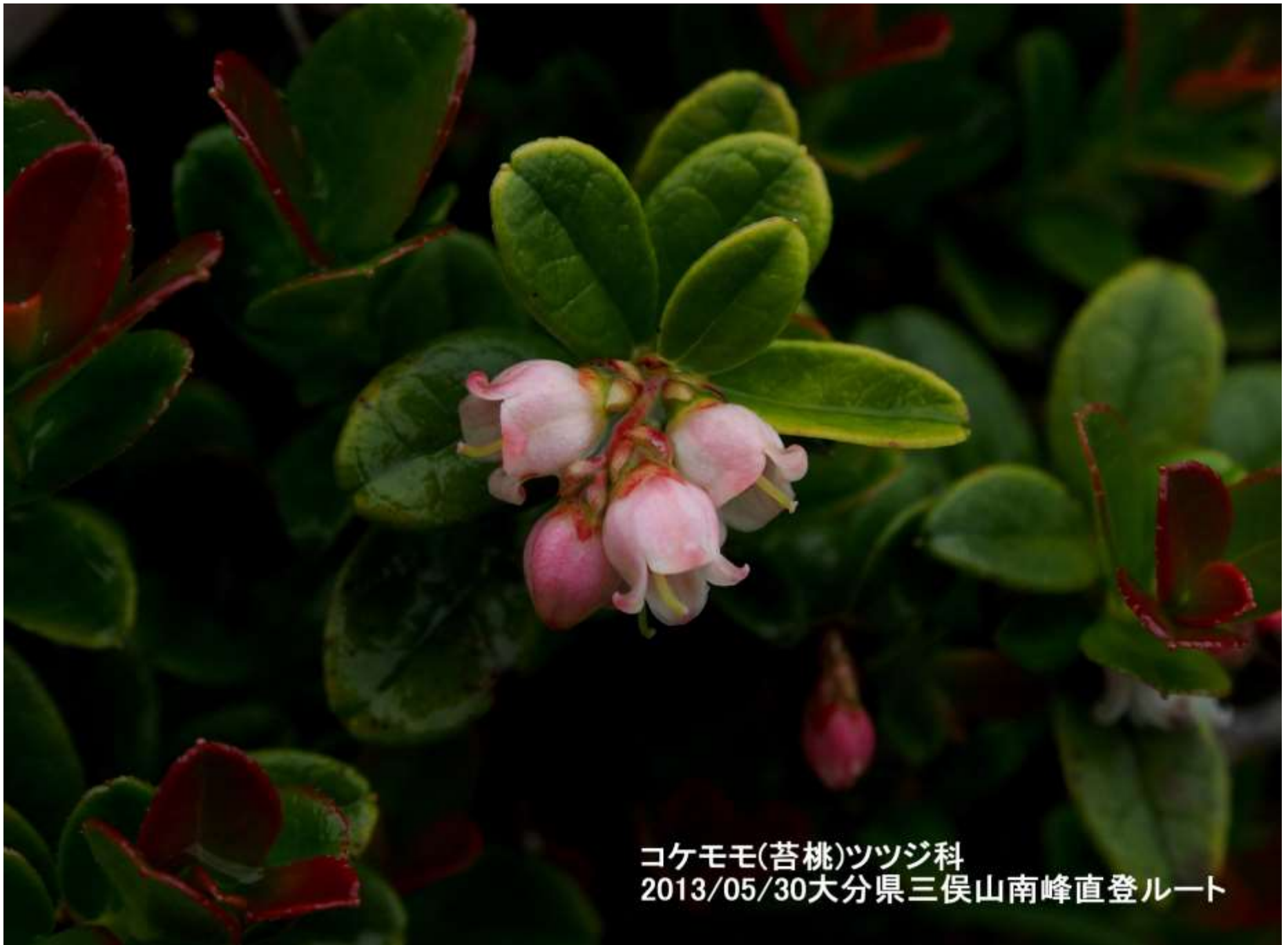
コケモモ(苔桃)ツツジ科 2013/05/30大分県三俣山南峰直登ルート