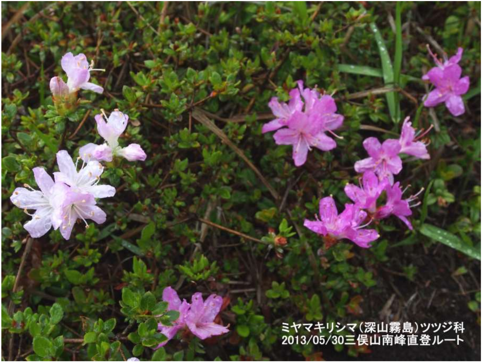
ミヤマキリシマ(深山霧島)ツツジ科 2013/05/30三俣山南峰直登ルート