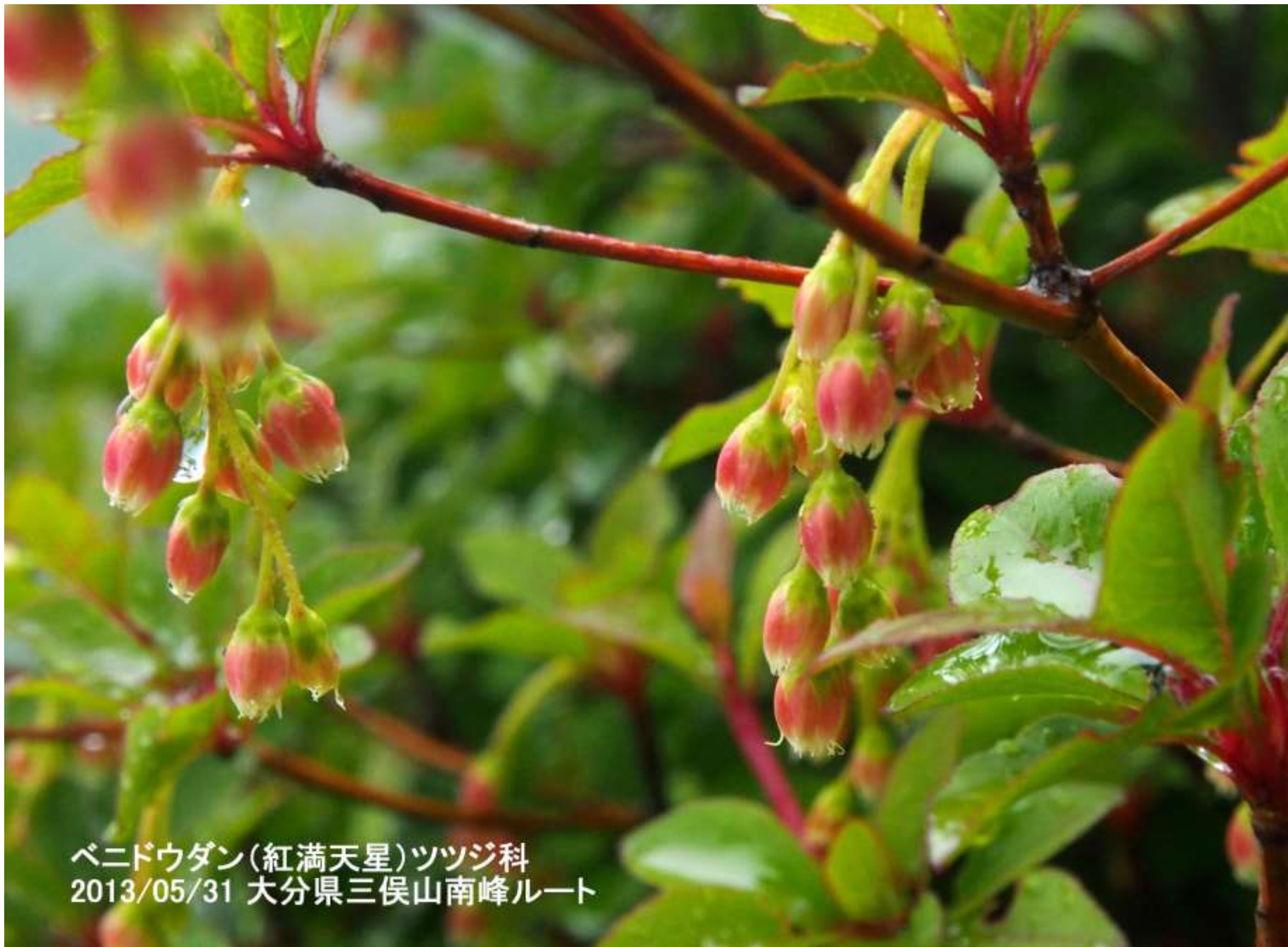
ベニドウダン(紅満天星)ツツジ科 2013/05/31 大分県三俣山南峰ルート