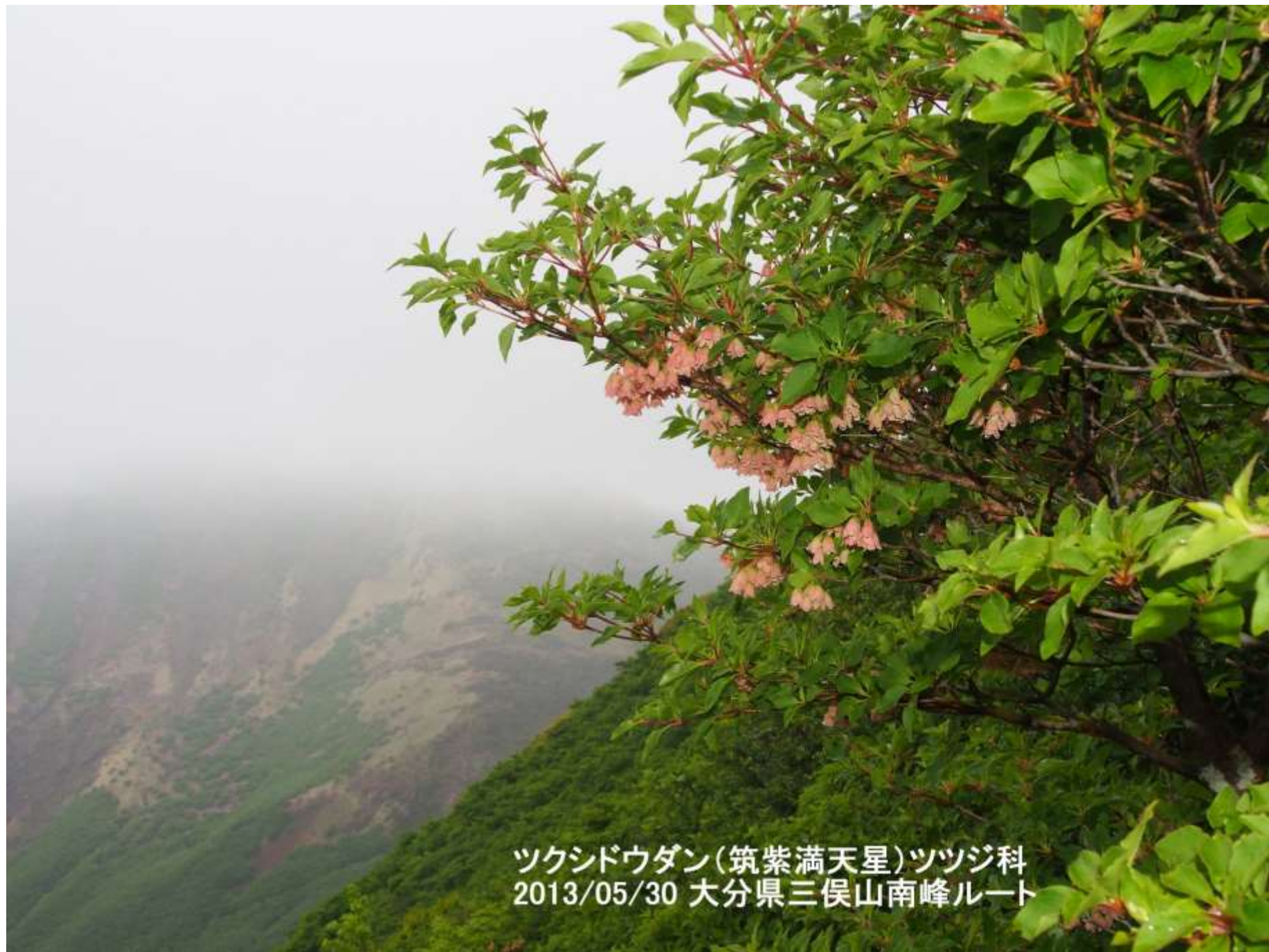
ツクシドウダン(筑紫満天星)ツツジ科 2013/05/30 大分県三俣山南峰ルート