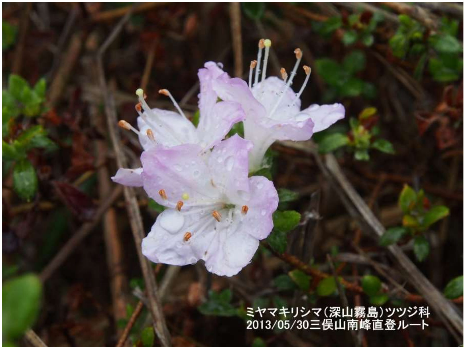
ミヤマキリシマ(深山霧島)ツツジ科 2013/05/30三俣山南峰直登ルート