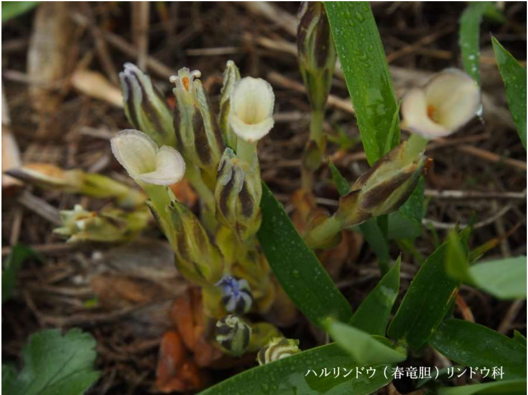
ハルリンドウ (春竜胆) リンドウ科