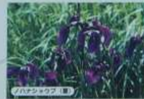
イトハショクフ（夏）