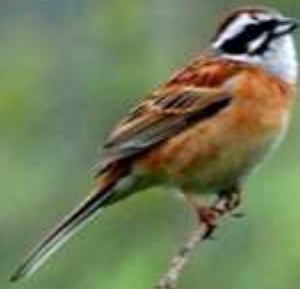
ホオジロ(頬白)ホオジロ科 L=16.5cm