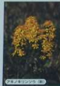
アケミキリシツ（春）