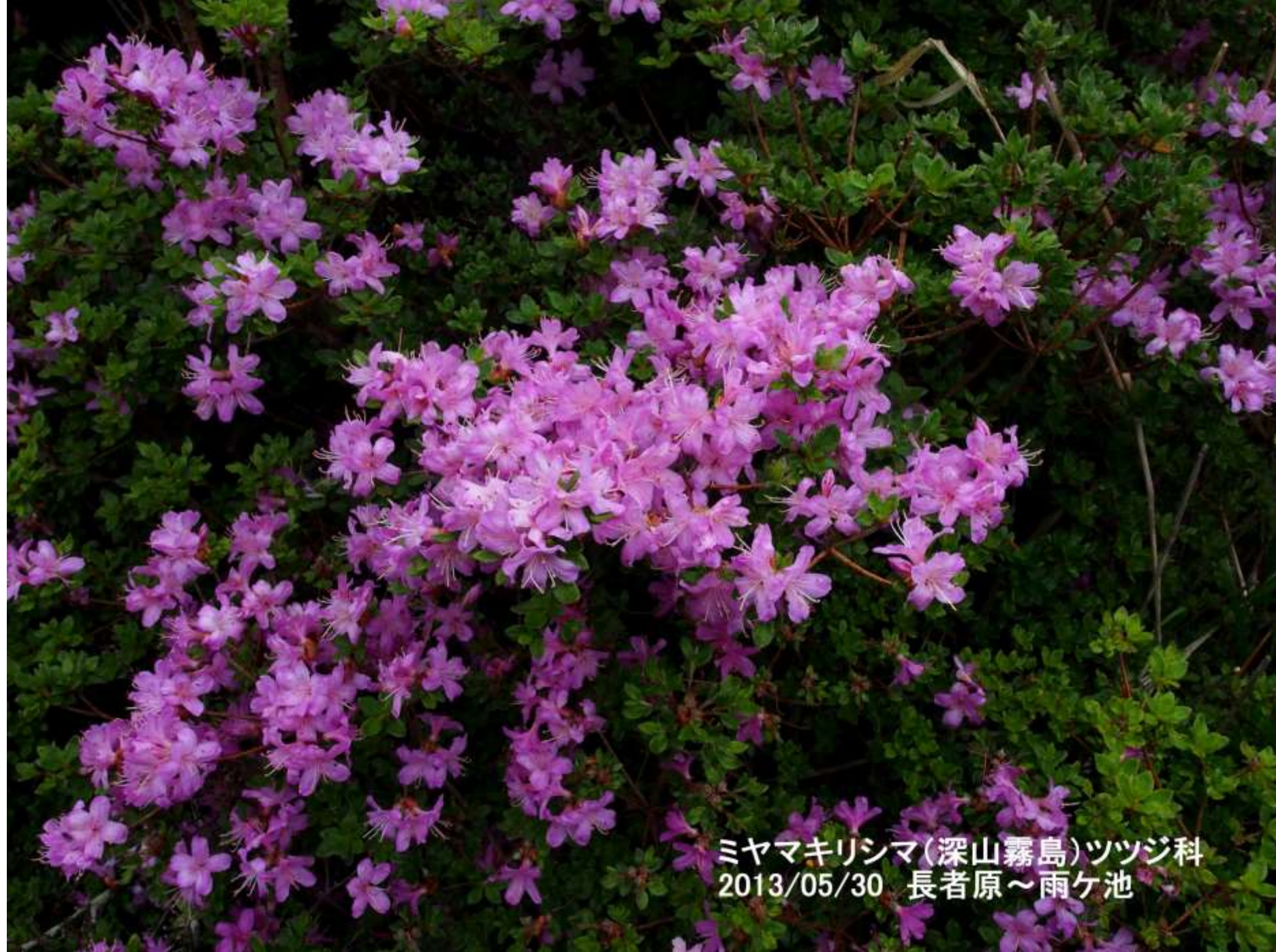
ミヤマキリシマ(深山霧島)ツツジ科 2013/05/30 長者原～雨ヶ池