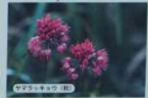
ヤマクラキキョウ（夏）