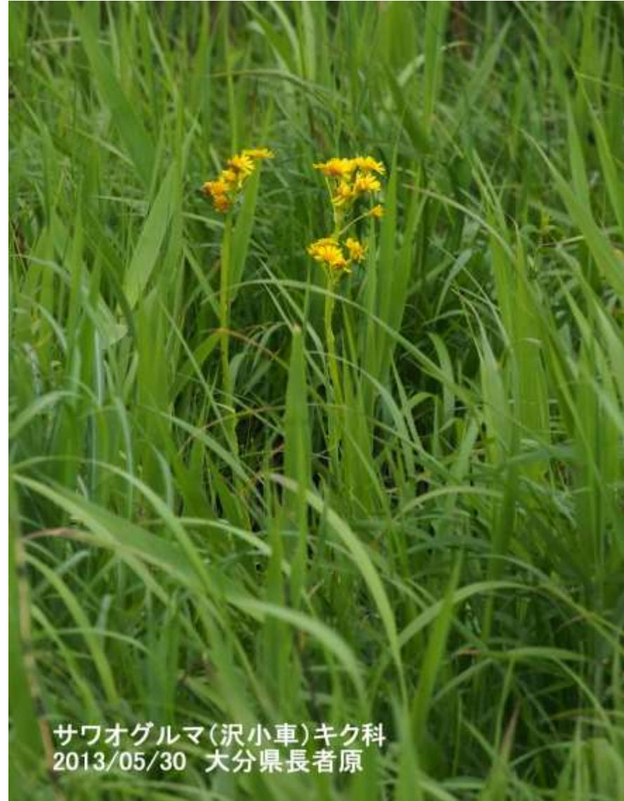
サワオグルマ(沢小車)キク科 2013/05/30 大分県長者原