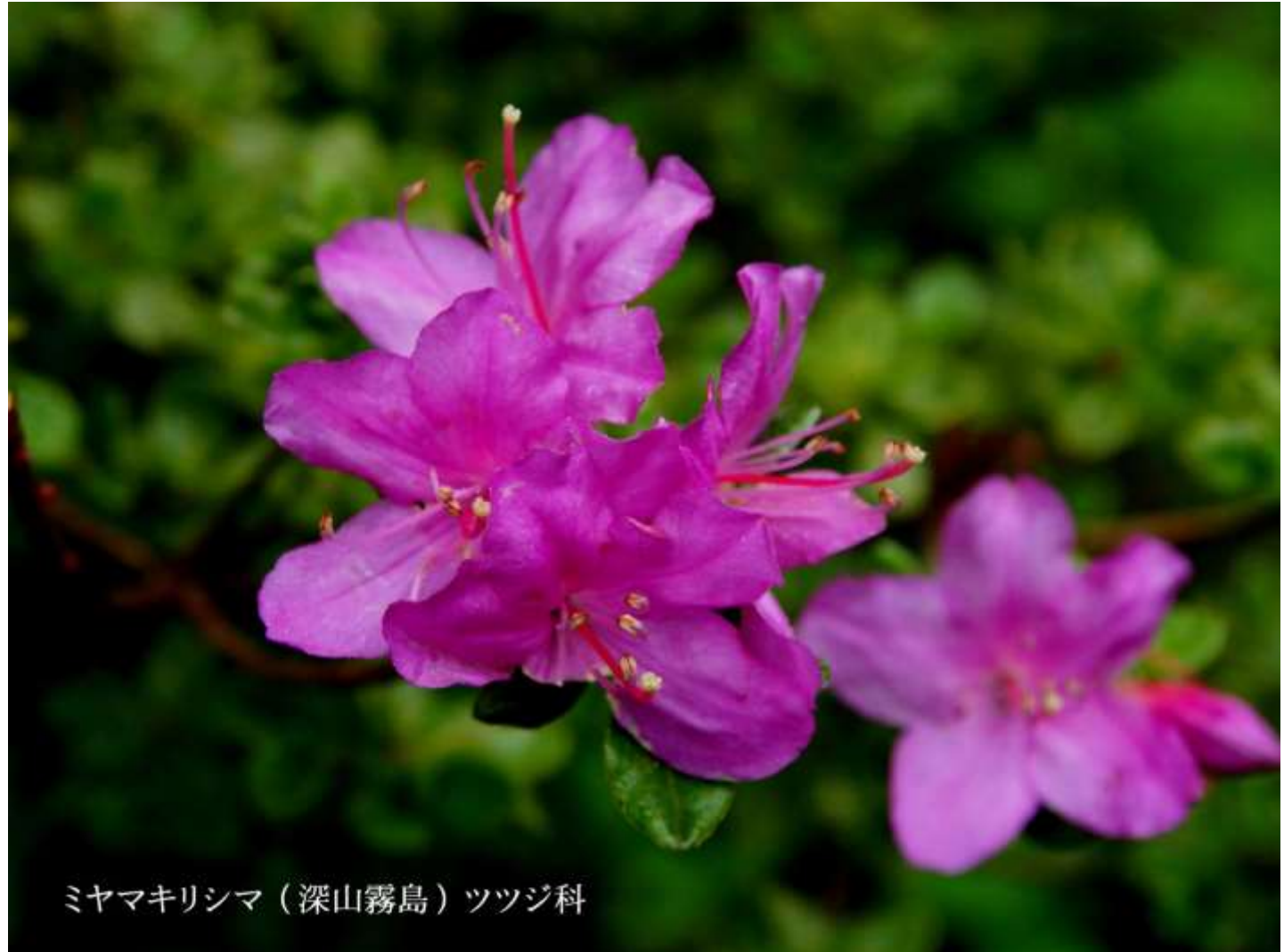
ミヤマキリシマ（深山霧島）ツツジ科

まずは雨ヶ池まで の画像です。 マイヅルソウの 花は少し 早かったが、 ハルリンドウの 花は峠を過ぎて、 実を付けていた。