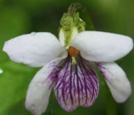
ニョイスミレ(如意堇)スミレ科 2013/05/30大分県長者原～雨ヶ池