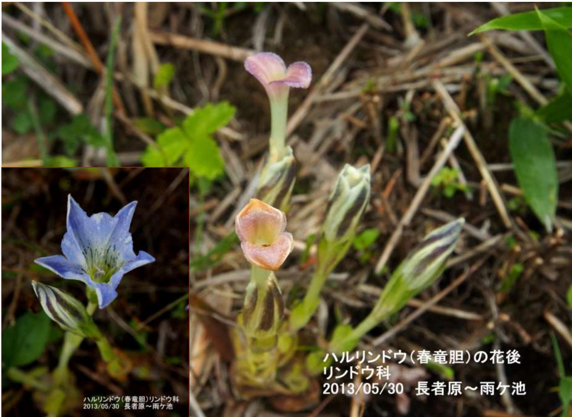
ハルリンドウ(春竜胆)の花後 リンドウ科 2013/05/30 長者原～雨ヶ池