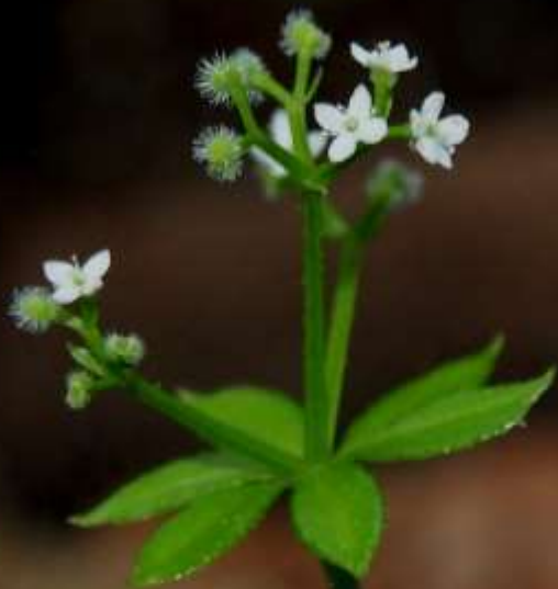
クルマムグラ(車薺)アカネ科 2013/05/30 大分県長者原～雨ヶ池