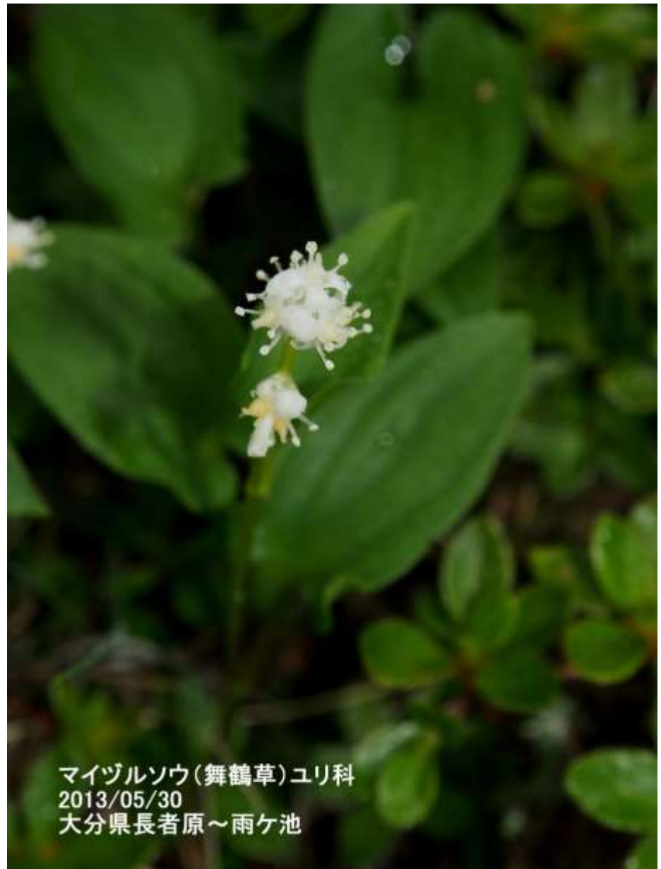
マイヅルソウ(舞鶴草)ユリ科 2013/05/30 大分県長者原～雨ヶ池