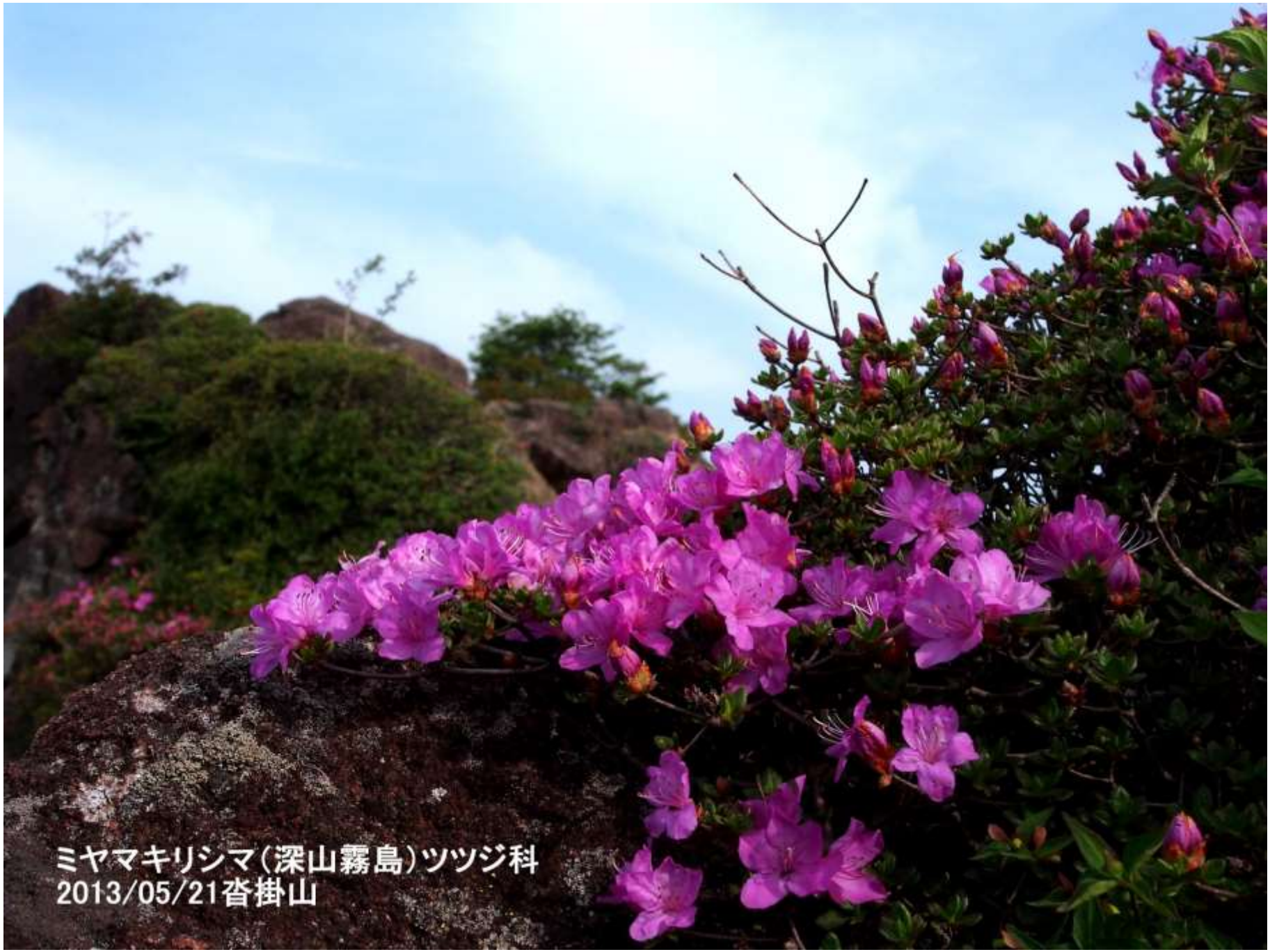
ミヤマキリシマ(深山霧島)ツツジ科 2013/05/21沓掛山