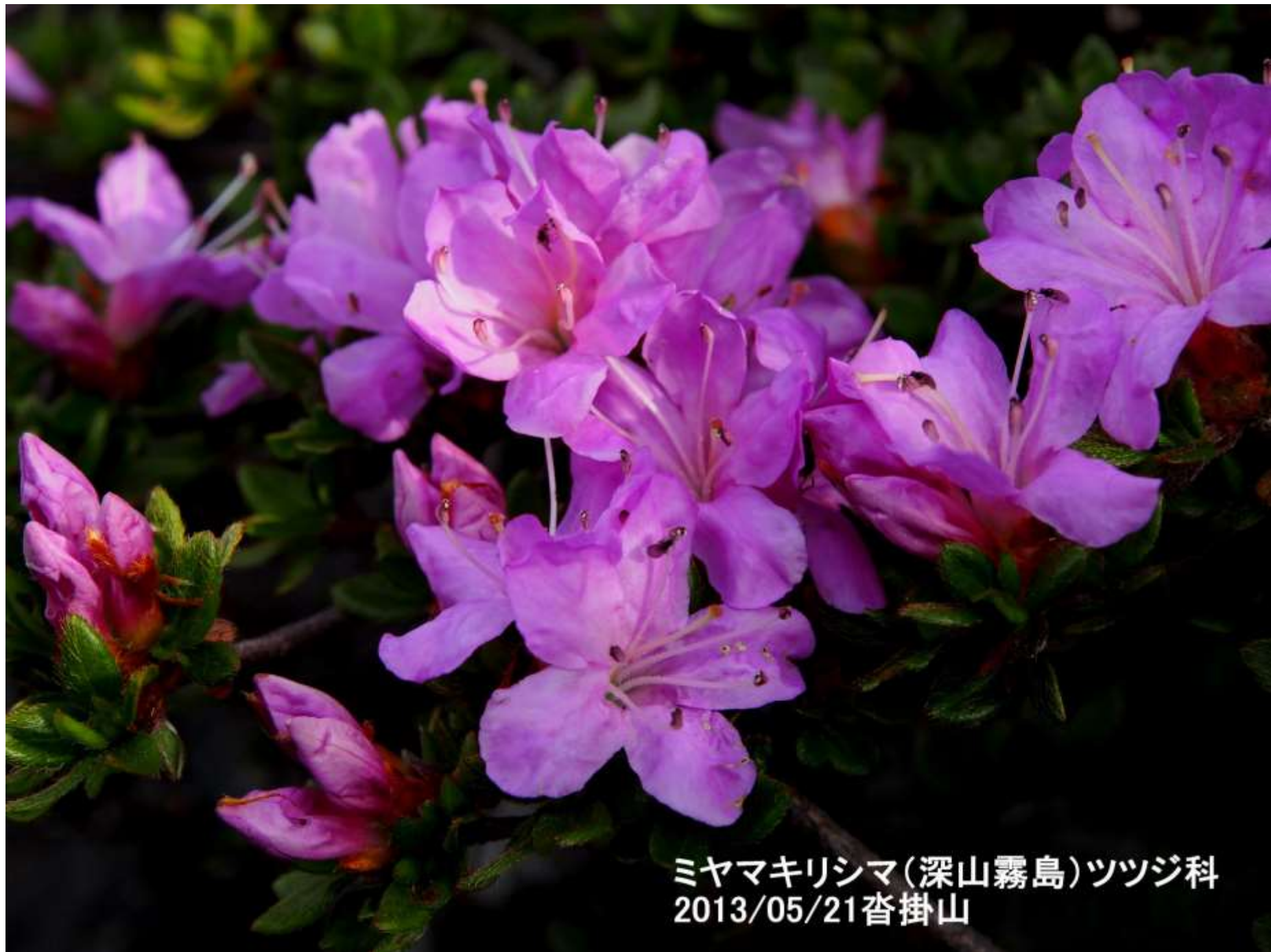
ミヤマキリシマ(深山霧島)ツツジ科 2013/05/21沓掛山