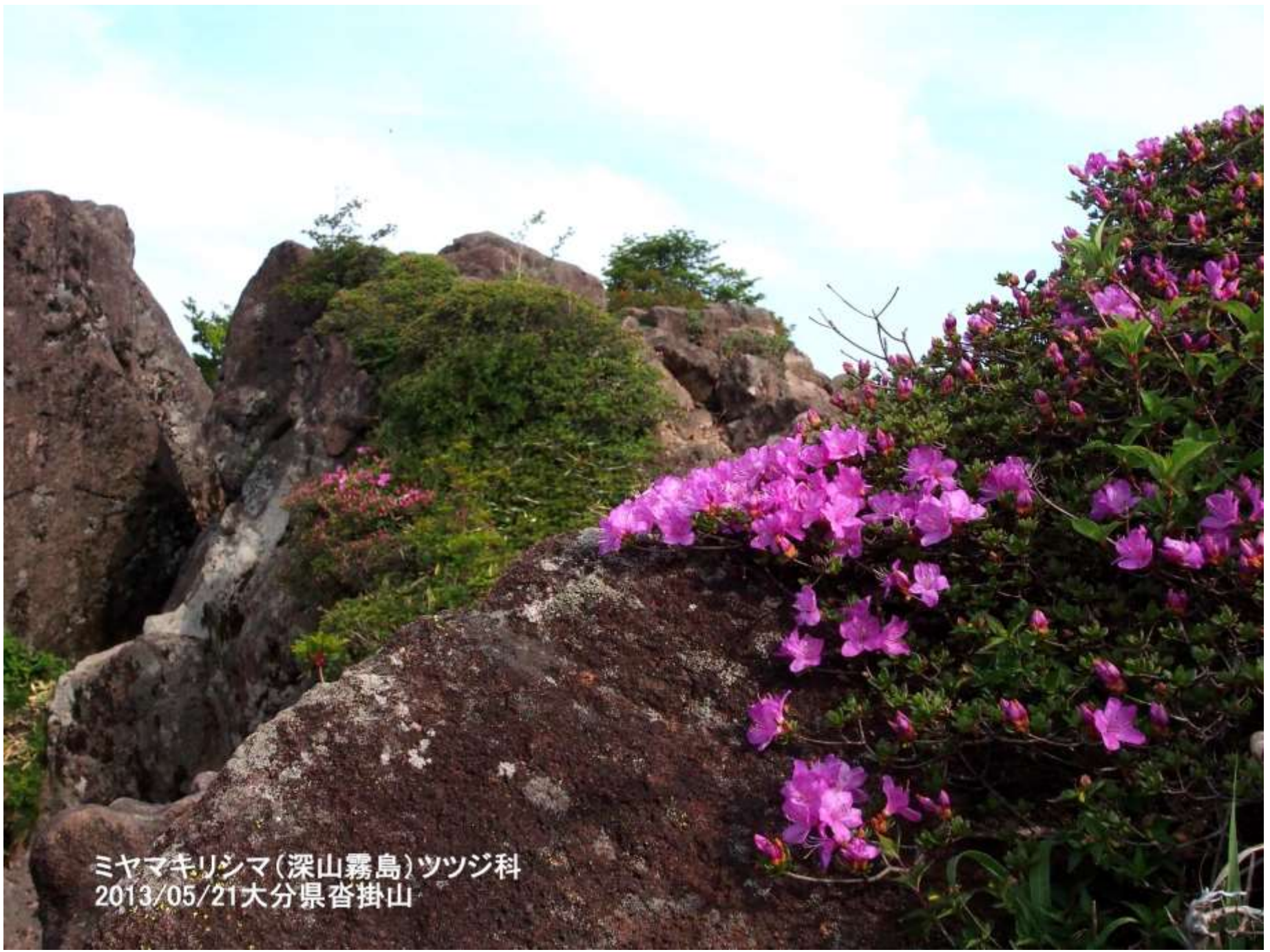
ミヤマキリシマ(深山霧島)ツツジ科 2013/05/21大分県沓掛山