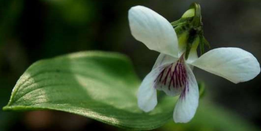
ニョイスミレ(如意堇)スミレ科 2013/05/21 大分県沓掛山