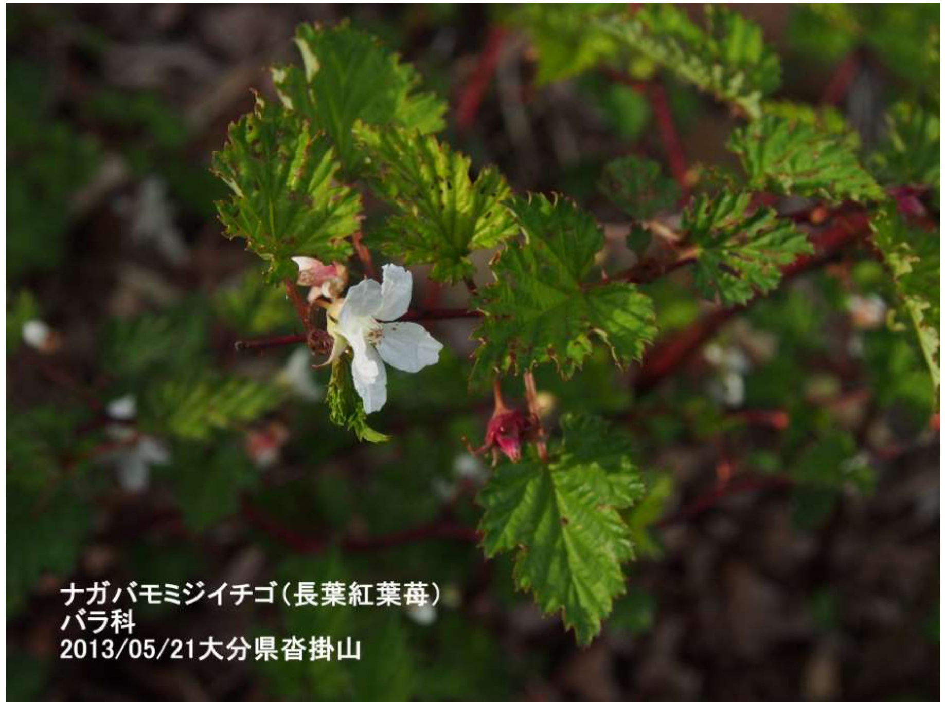
ナガバモミジイチゴ(長葉紅葉苺) バラ科 2013/05/21大分県杵掛山