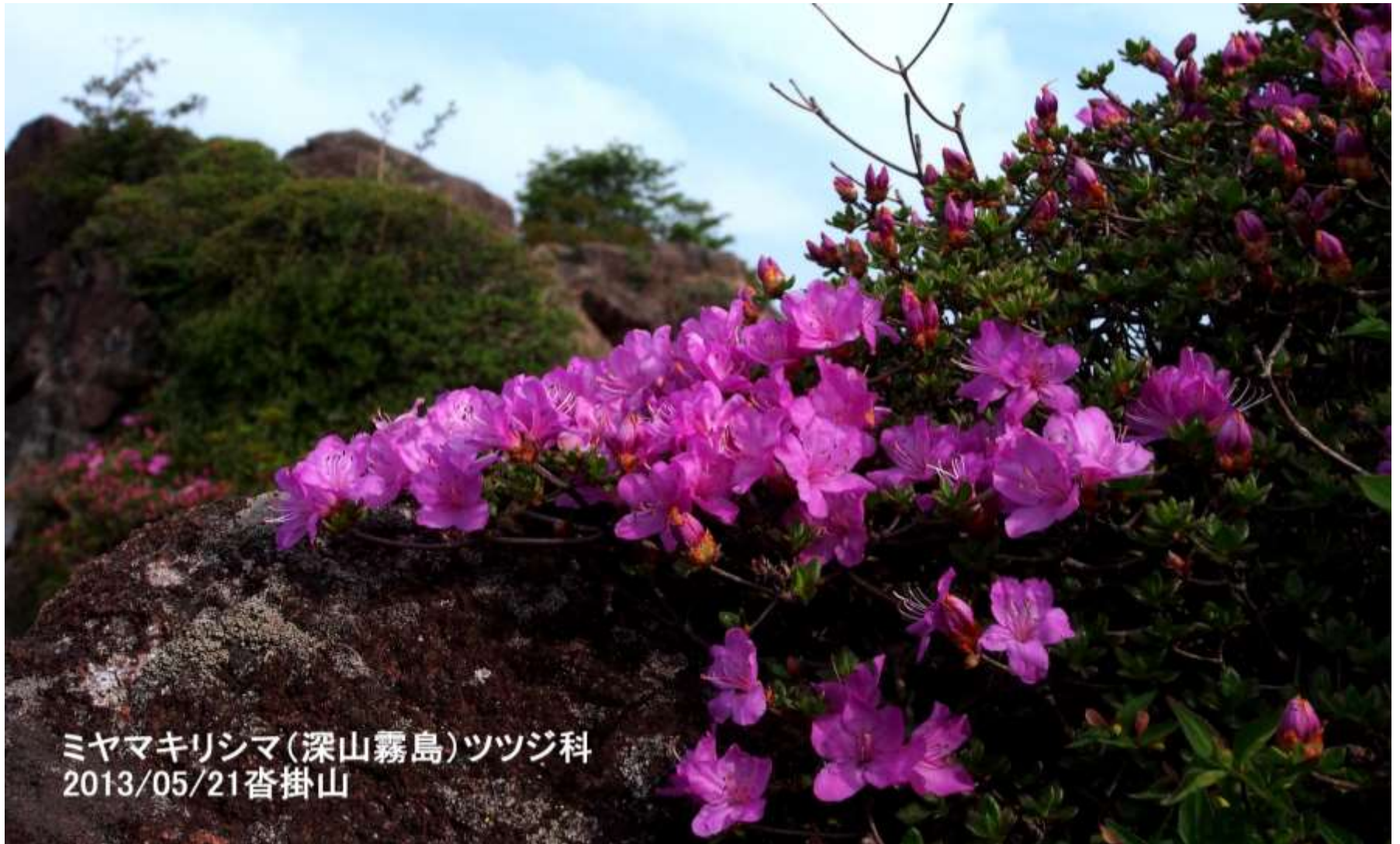
ミヤマキリシマ(深山霧島)ツツジ科 2013/05/21沓掛山