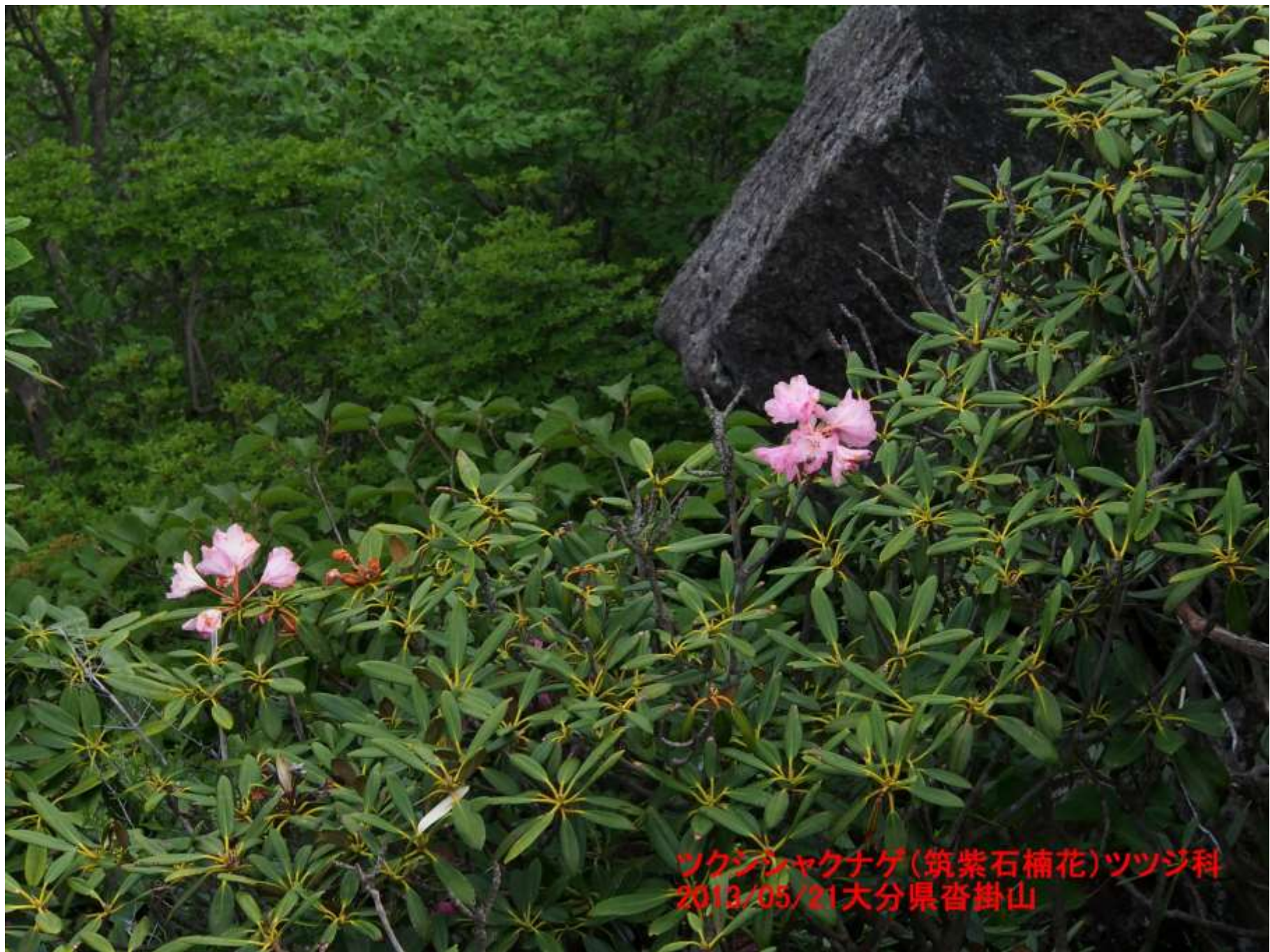
ツクシヤクナゲ(筑紫石楠花)ツツジ科 2013/05/21大分県沓掛山