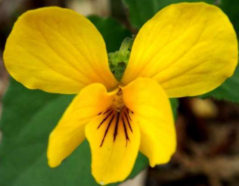
キスミレ(黄堇)スミレ科 2013/05/21沓掛山