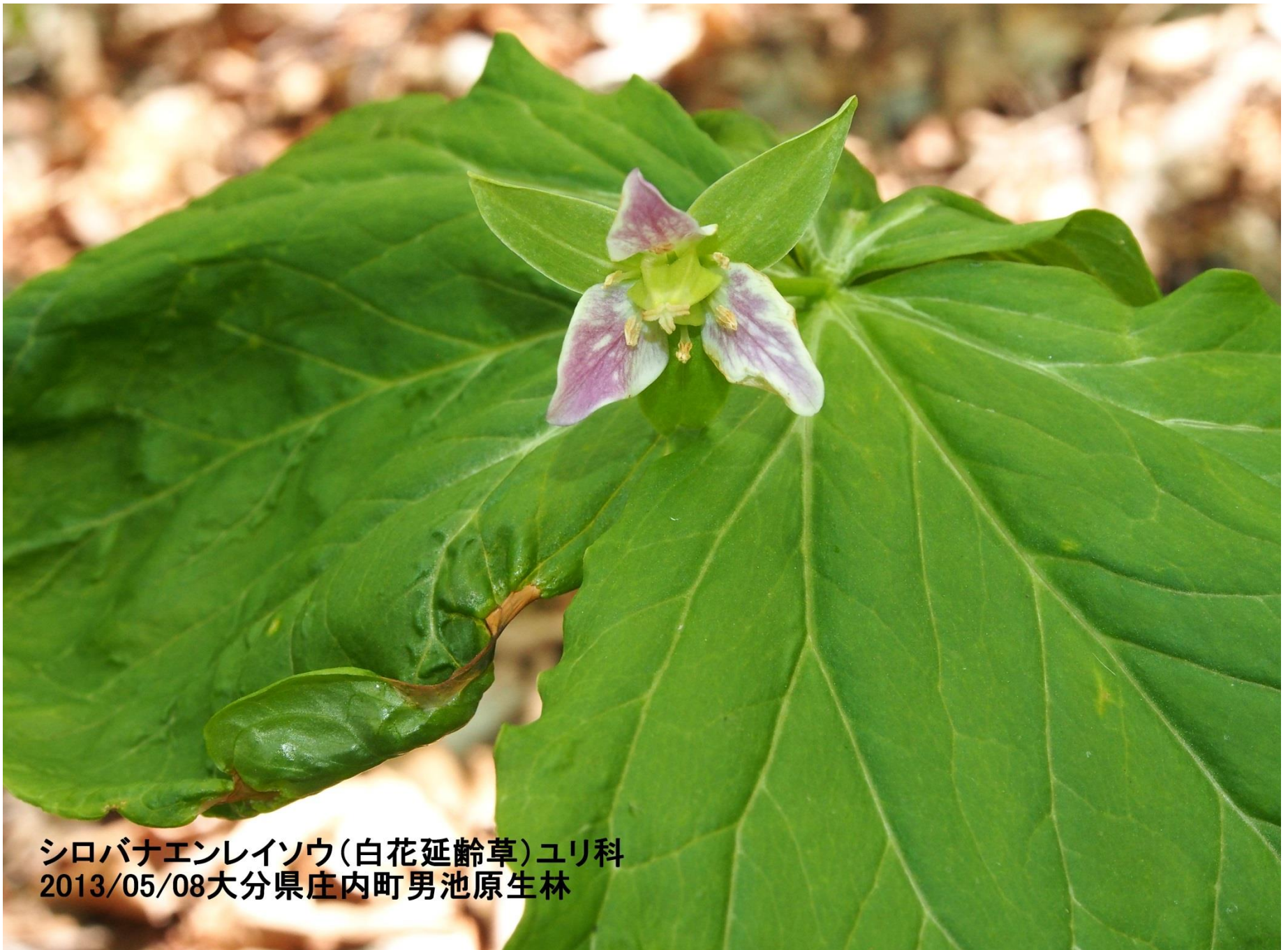
シロバナエンレイソウ(白花延齡草)ユリ科 2013/05/08大分県庄内町男池原生林