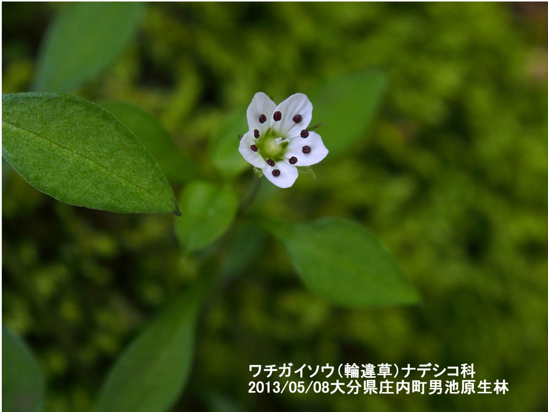
ワチガイソウ(輪違草)ナデシコ科 2013/05/08大分県庄内町男池原生林