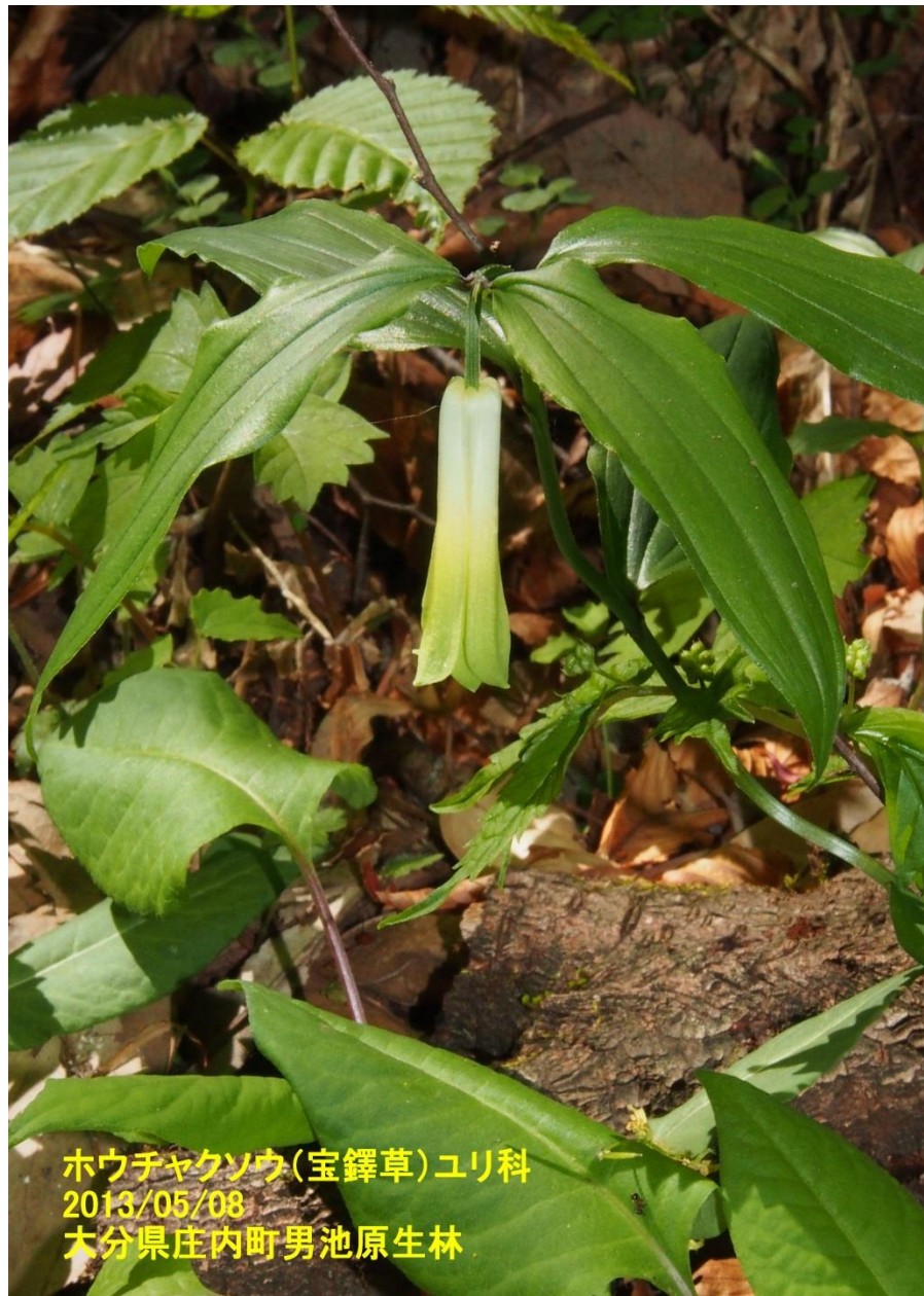
ホウチャクソウ(宝鐸草)ユリ科 2013/05/08 大分県庄内町男池原生林