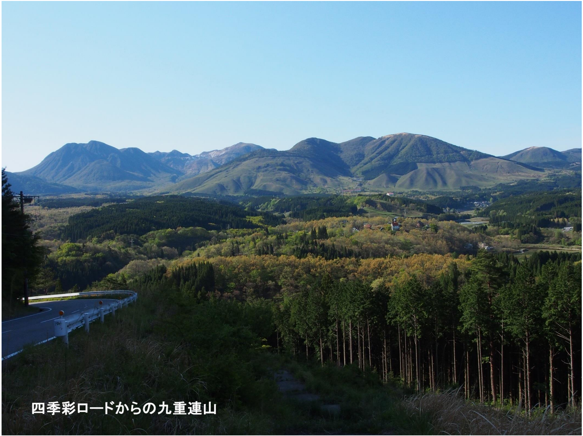
四季彩ロードからの九重連山