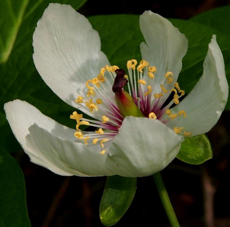
ヤマシャクヤク(山芍薬)キンポウゲ科 2013/05/08大分県庄内町男池原生林