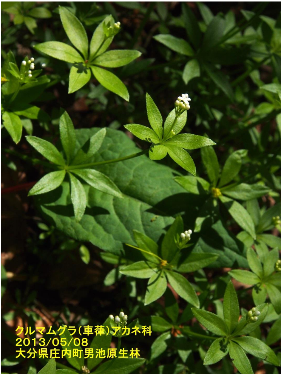
クルマムグラ(車薺)アカネ科 2013/05/08 大分県庄内町男池原生林