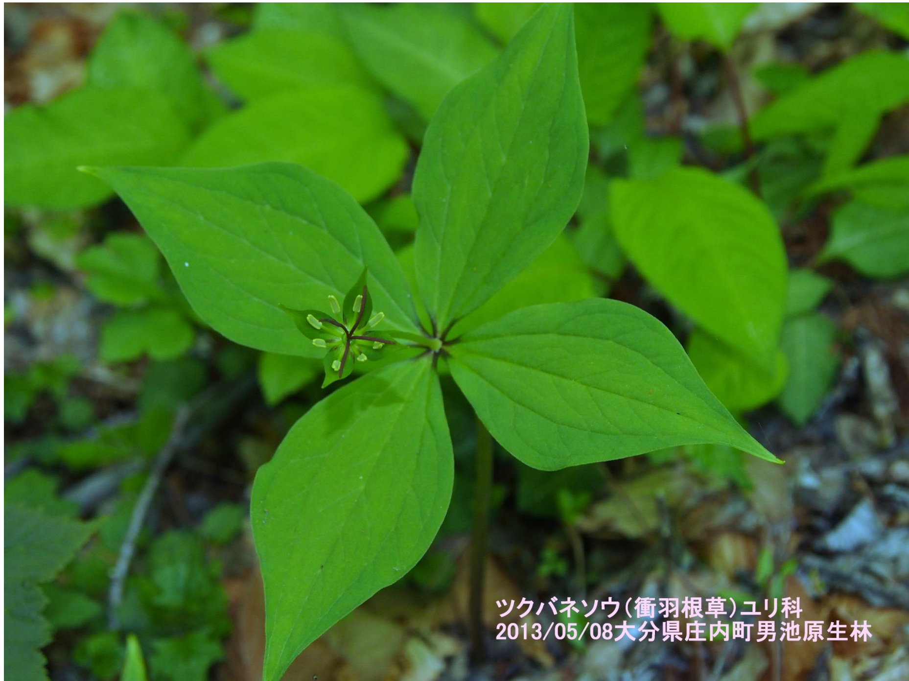
ツクバネソウ(衝羽根草)ユリ科 2013/05/08大分県庄内町男池原生林