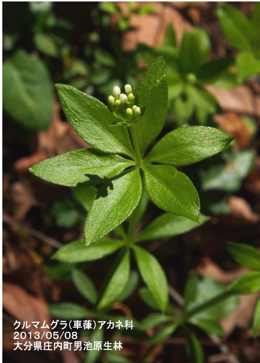
クルマムグラ(車薺)アカネ科 2013/05/08 大分県庄内町男池原生林