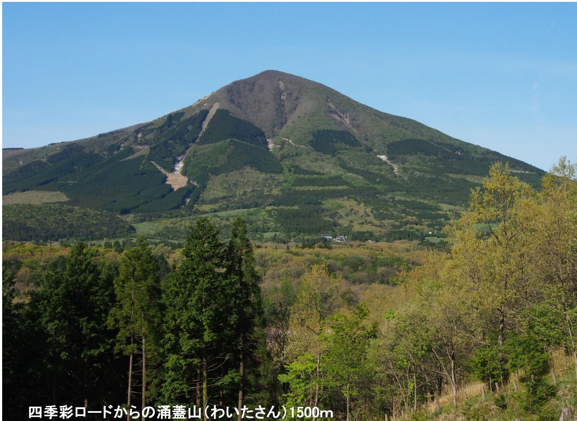
四季彩ロードからの涌蓋山(わいたさん)1500m