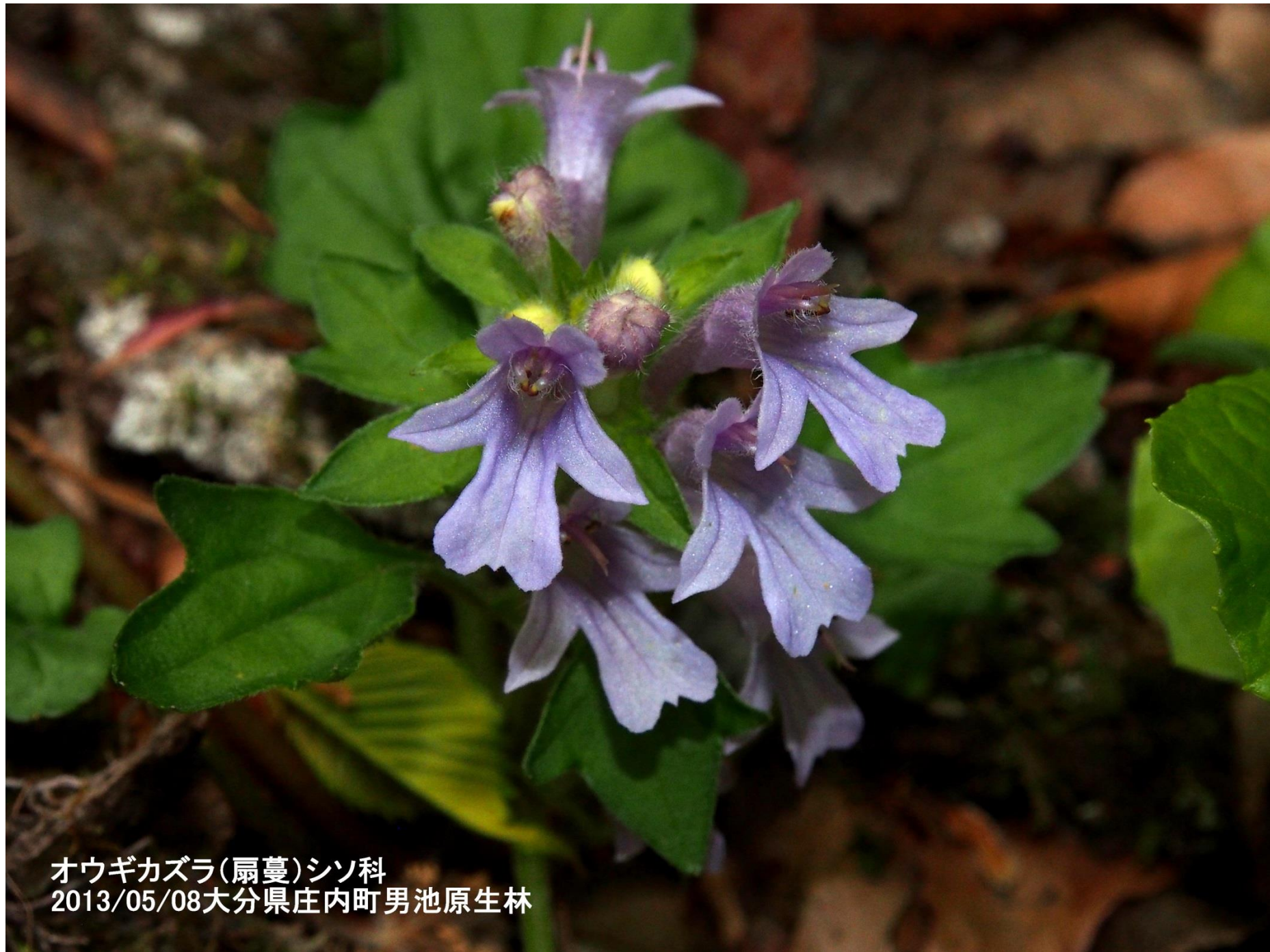
オウギカズラ(扇蔓)シソ科 2013/05/08大分県庄内町男池原生林