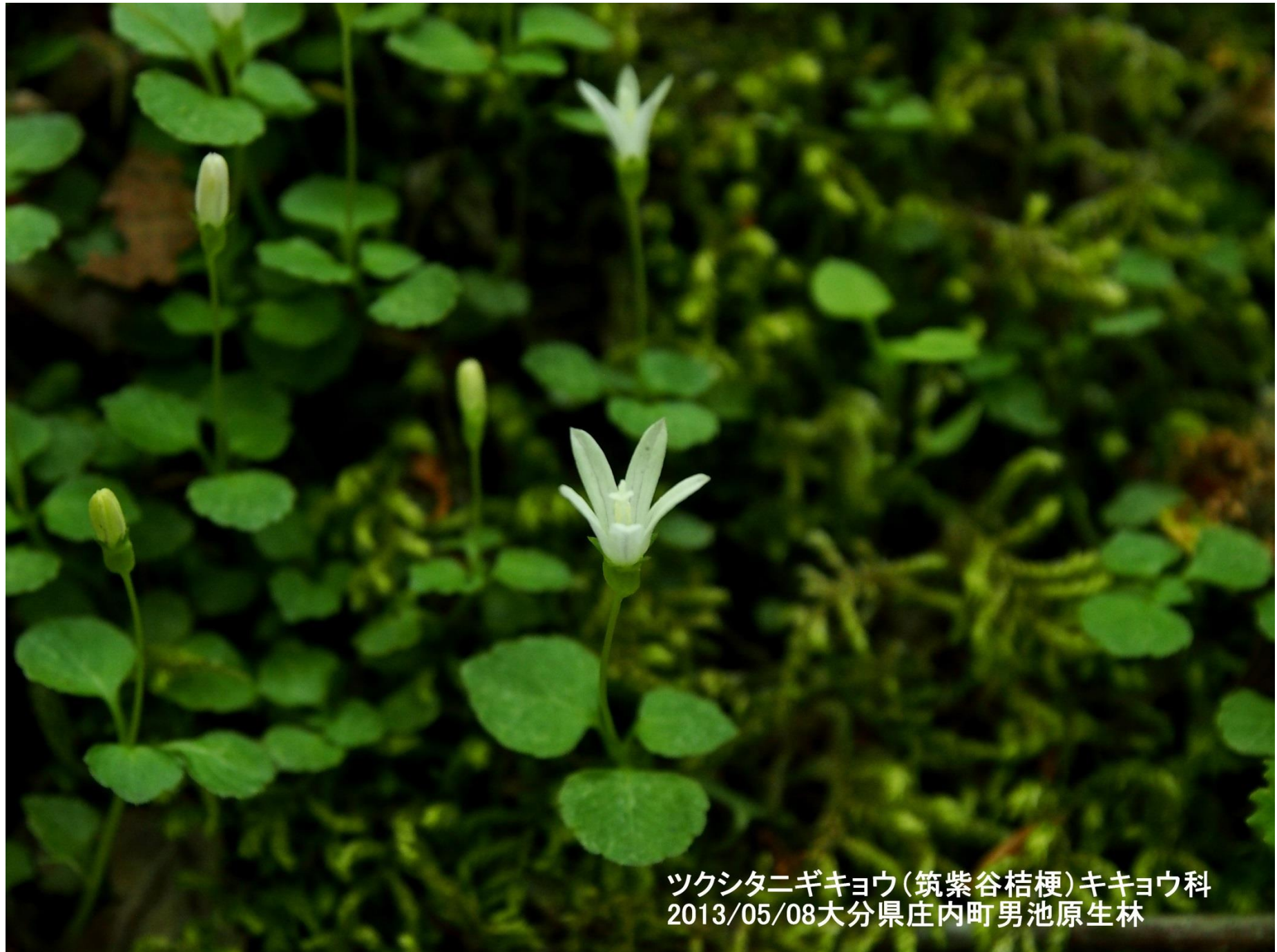
ツクシタニギキョウ(筑紫谷桔梗)キキョウ科 2013/05/08大分県庄内町男池原生林