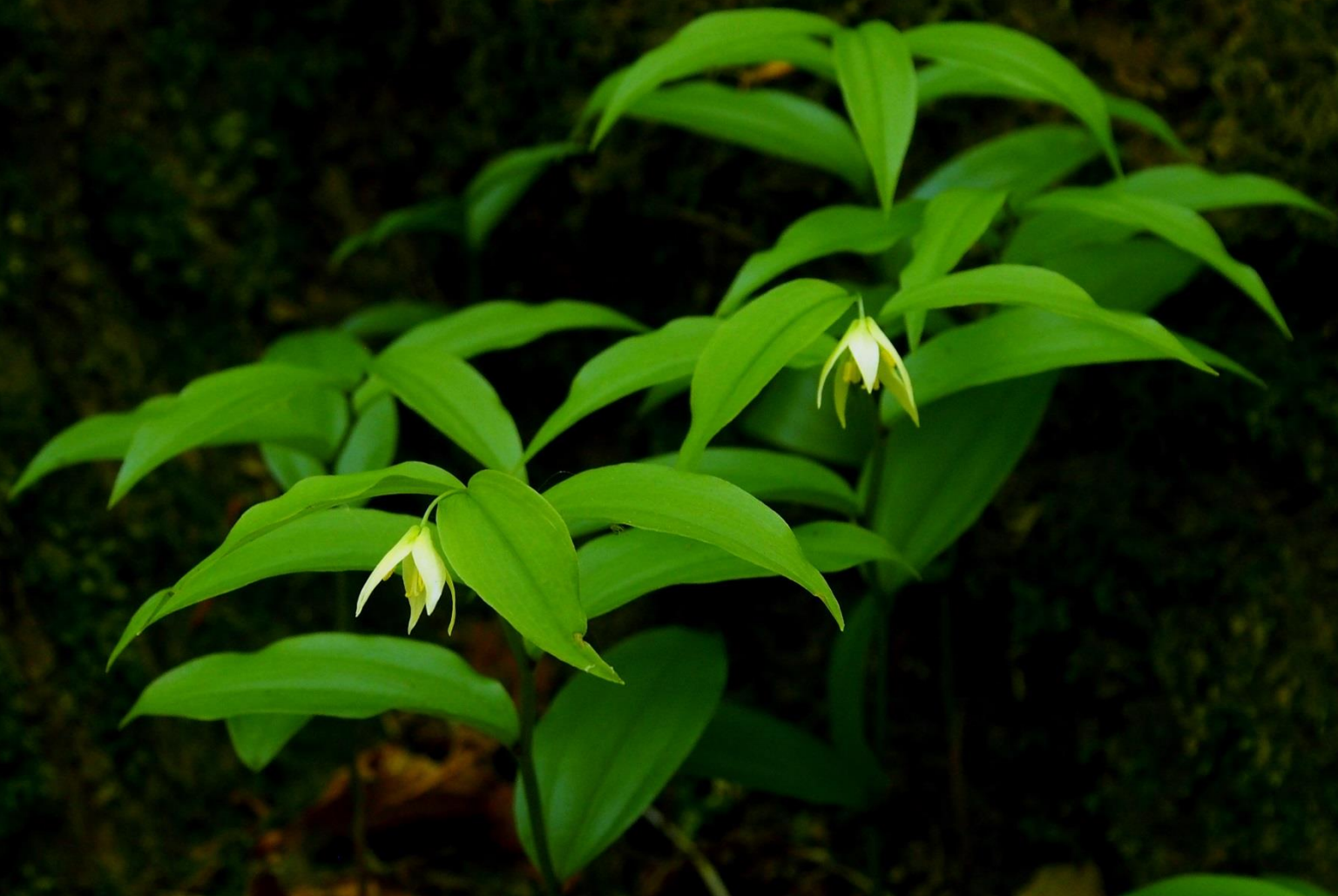
チゴユリ(稚児百合)ユリ科 2013/05/08大分県庄内町男池原生林