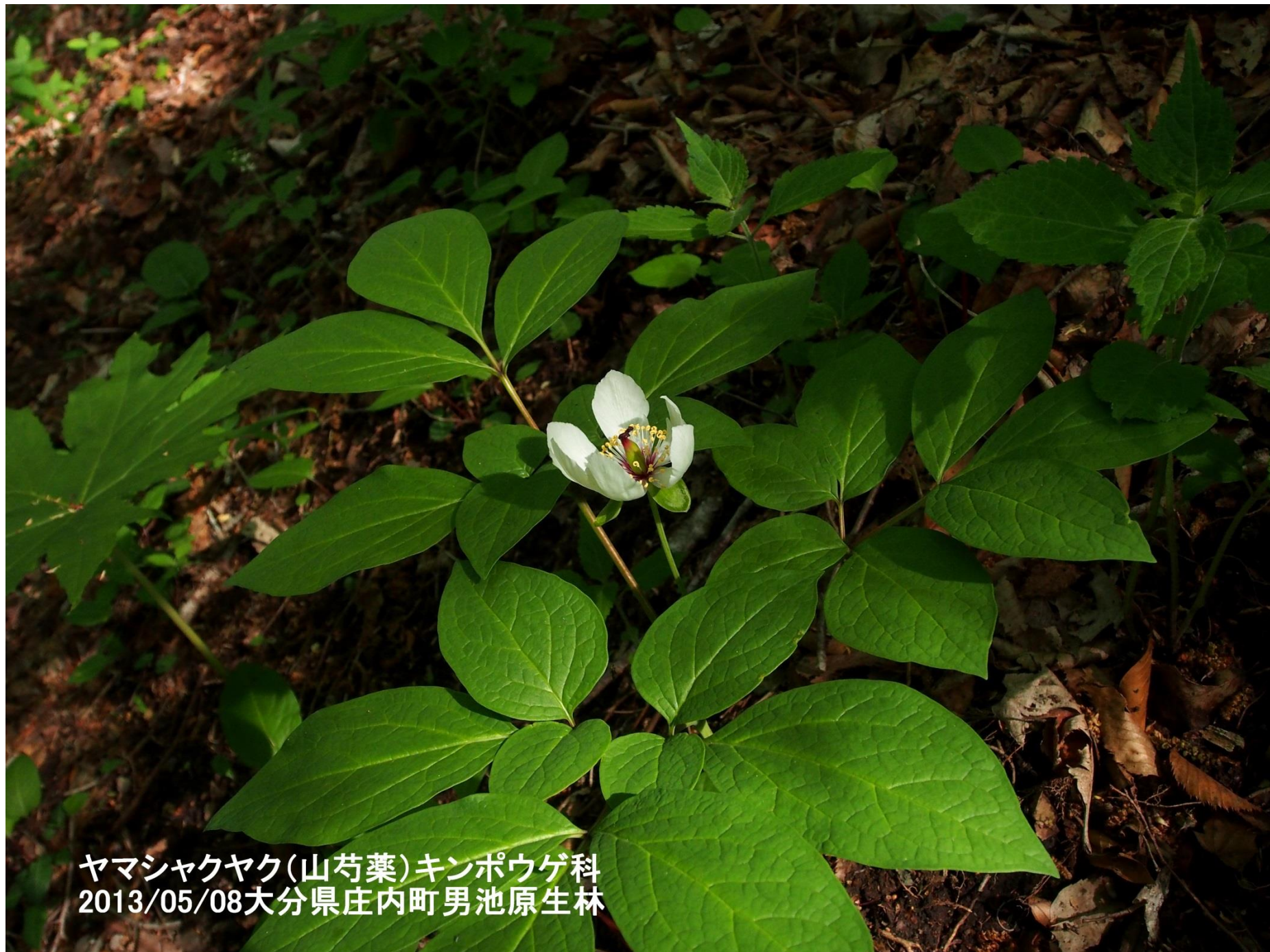
ヤマシャクヤク(山芍薬)キンポウゲ科 2013/05/08大分県庄内町男池原生林