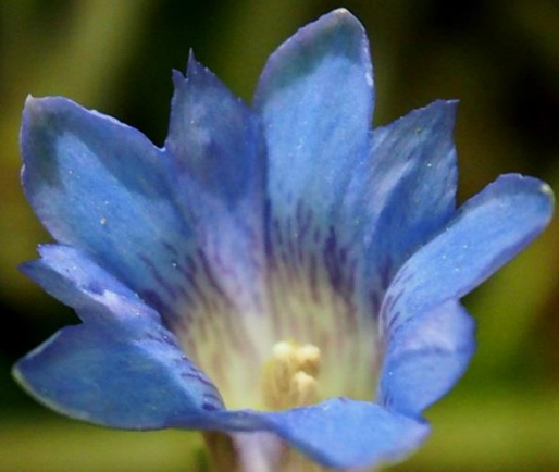
フデリンドウ(筆竜胆)リンドウ科 2013/05/08 大分県庄内町男池原生林