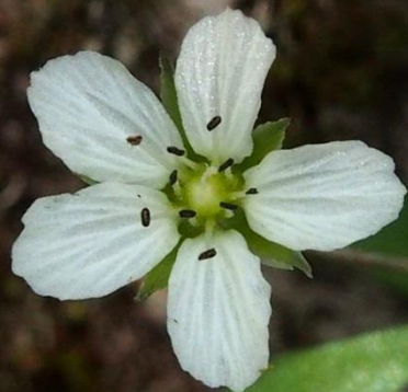
ワチガイソウ(輪違草)ナデシコ科 2013/05/08大分県庄内町男池原生林