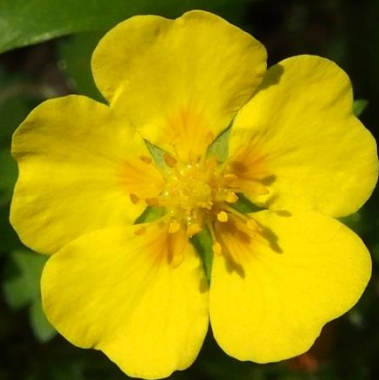
ツルキンバイ（蔓金梅）バラ科