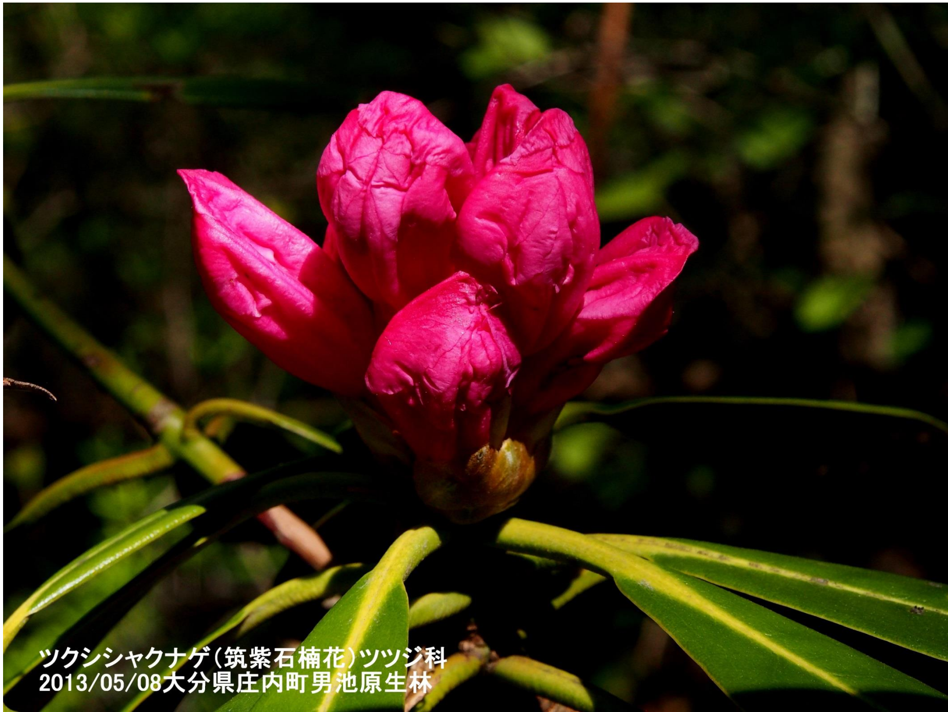
ツクシシャクナゲ(筑紫石楠花)ツツジ科 2013/05/08大分県庄内町男池原生林