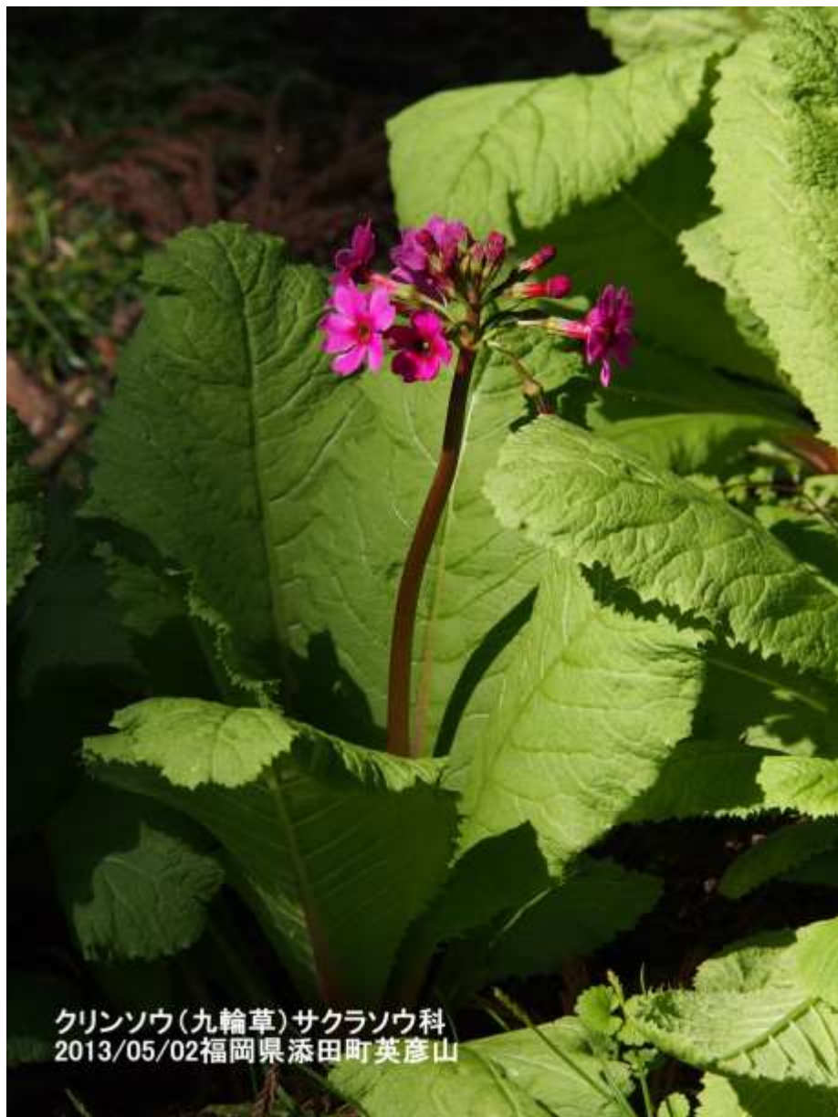
クリンソウ(九輪草)サクラソウ科 2013/05/02福岡県添田町英彦山