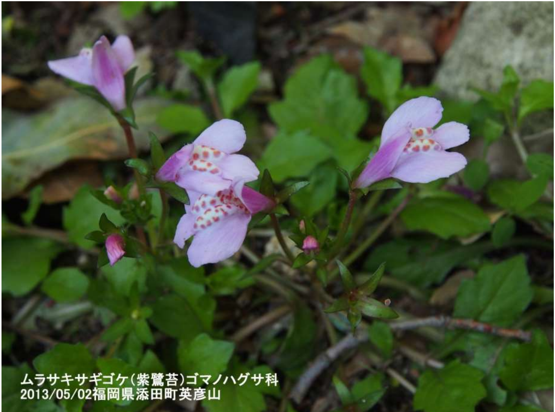
ムラサキサギゴケ(紫鷺苔)ゴマノハグサ科 2013/05/02福岡県添田町英彦山