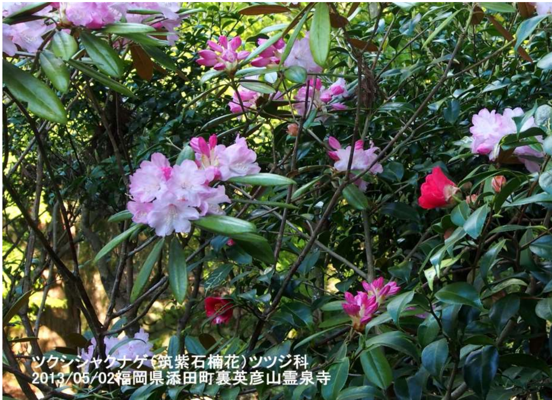
ツクシヤクナゲ(筑紫石楠花)ツツジ科 2013/05/02福岡県添田町裏英彦山霊泉寺