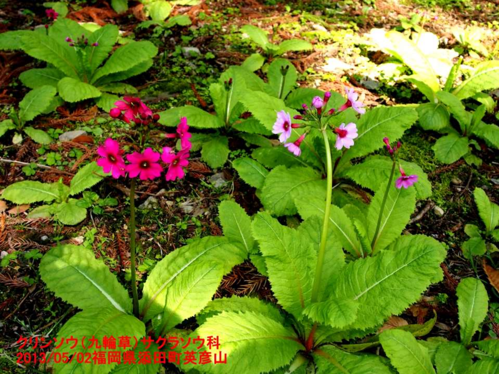
クリソウ(九輪草)サクラソウ科 2013/05/02福岡県添田町英彦山