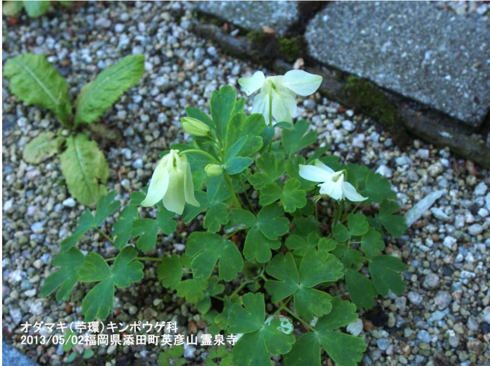
オダマキ(苧環)キンポウゲ科 2013/05/02福岡県添田町英彦山 霊泉寺