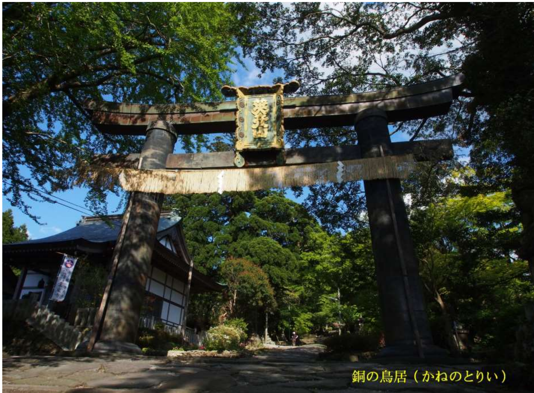
銅の鳥居（かねのとりい）