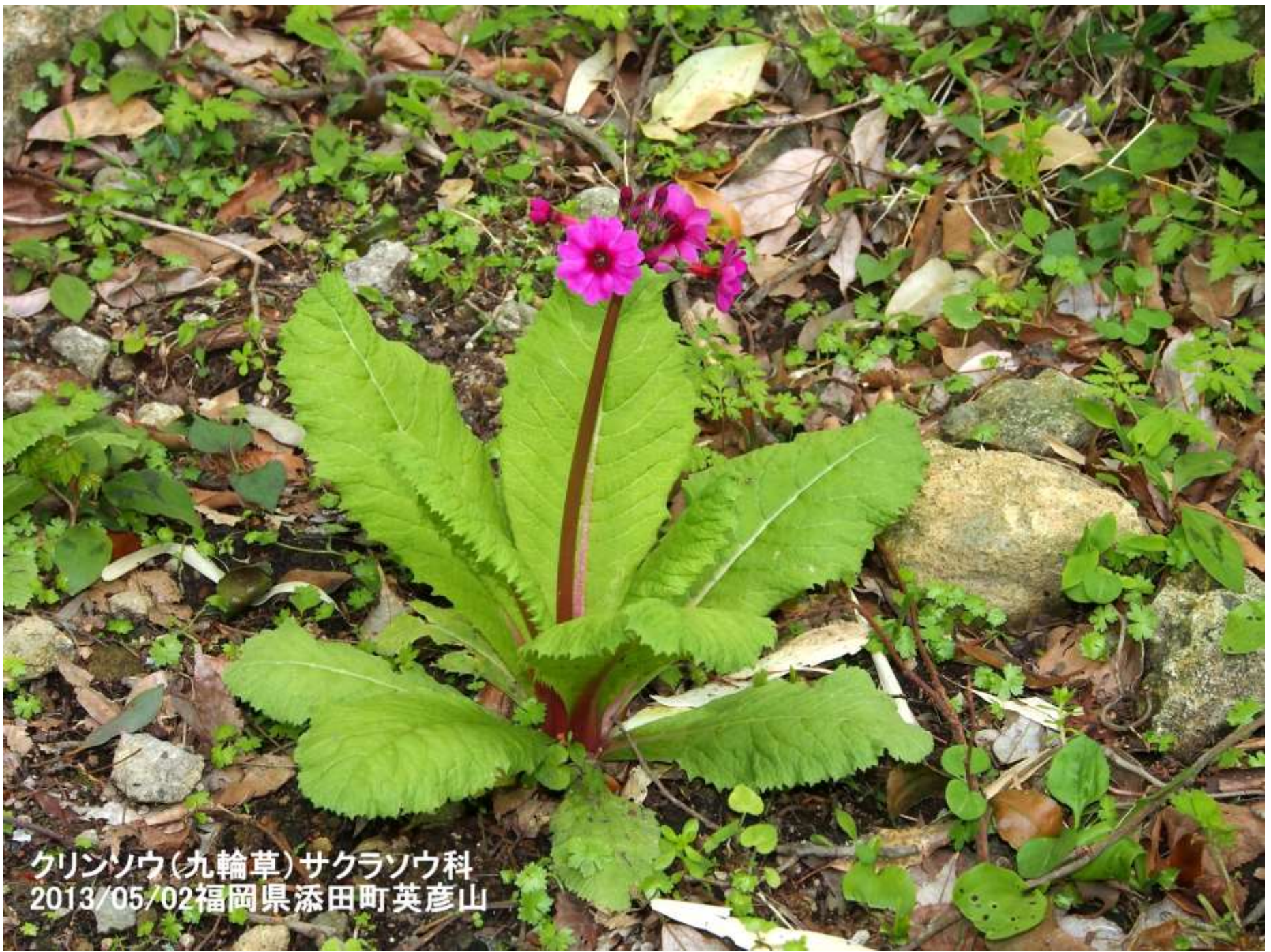
クリンソウ(丸輪草)サクラソウ科 2013/05/02福岡県添田町英彦山