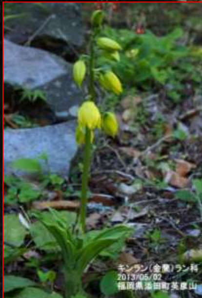
キンラン(金蘭)ラン科 2013/05/02 福島県滝田町英彦山