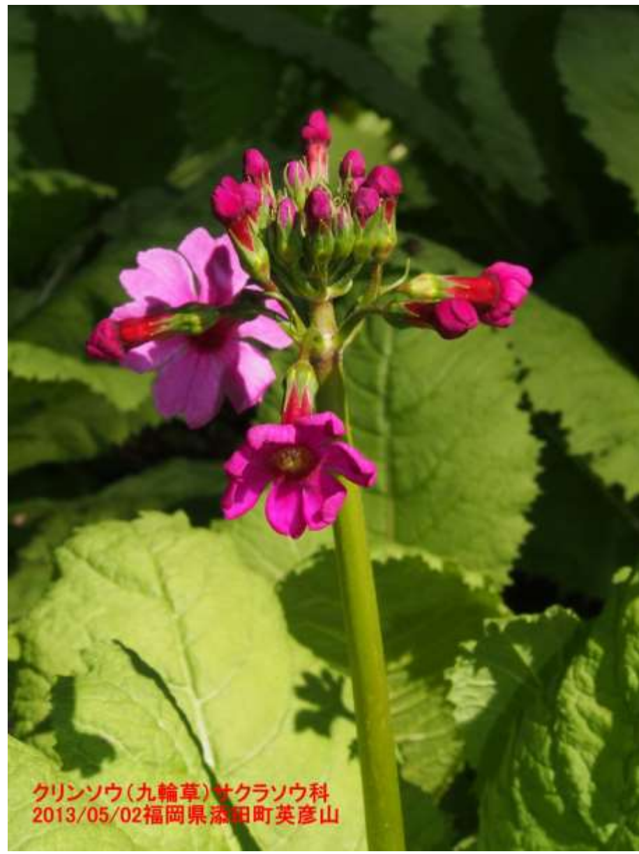
クリンソウ(九輪草)サクラソウ科 2013/05/02福岡県添田町英彦山