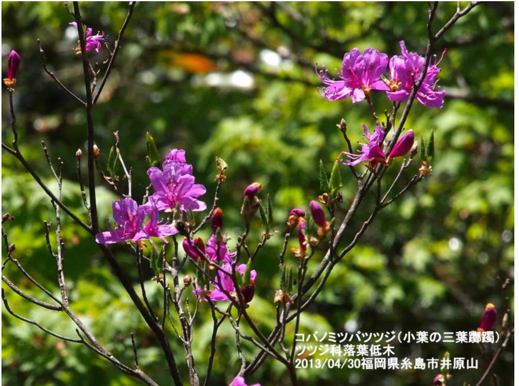
コバノミツバツツジ(小葉の三葉躑躅) ツツジ科落葉低木 2013/04/30福岡県糸島市井原山