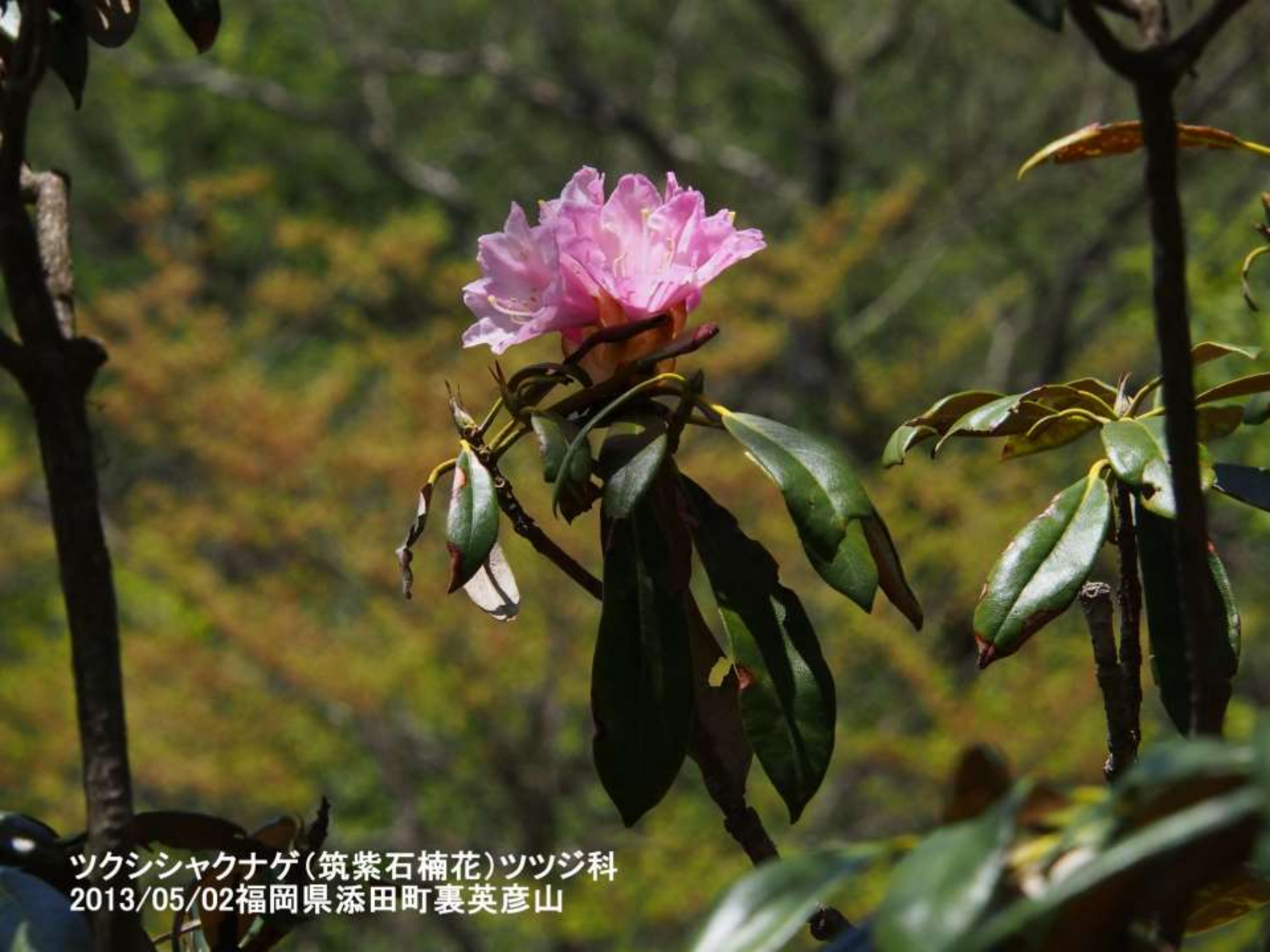
ツクシシャクナゲ(筑紫石楠花)ツツジ科 2013/05/02福岡県添田町裏英彦山