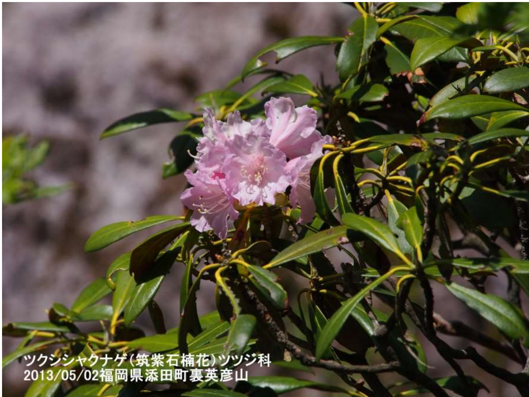
ツクシシャクナゲ(筑紫石楠花)ツツジ科 2013/05/02福岡県添田町裏英彦山