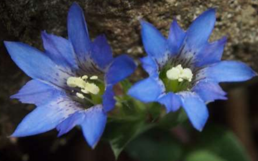
フデリンドウ(筆竜胆)リンドウ科 2013/05/02福岡県添田町裏英彦山