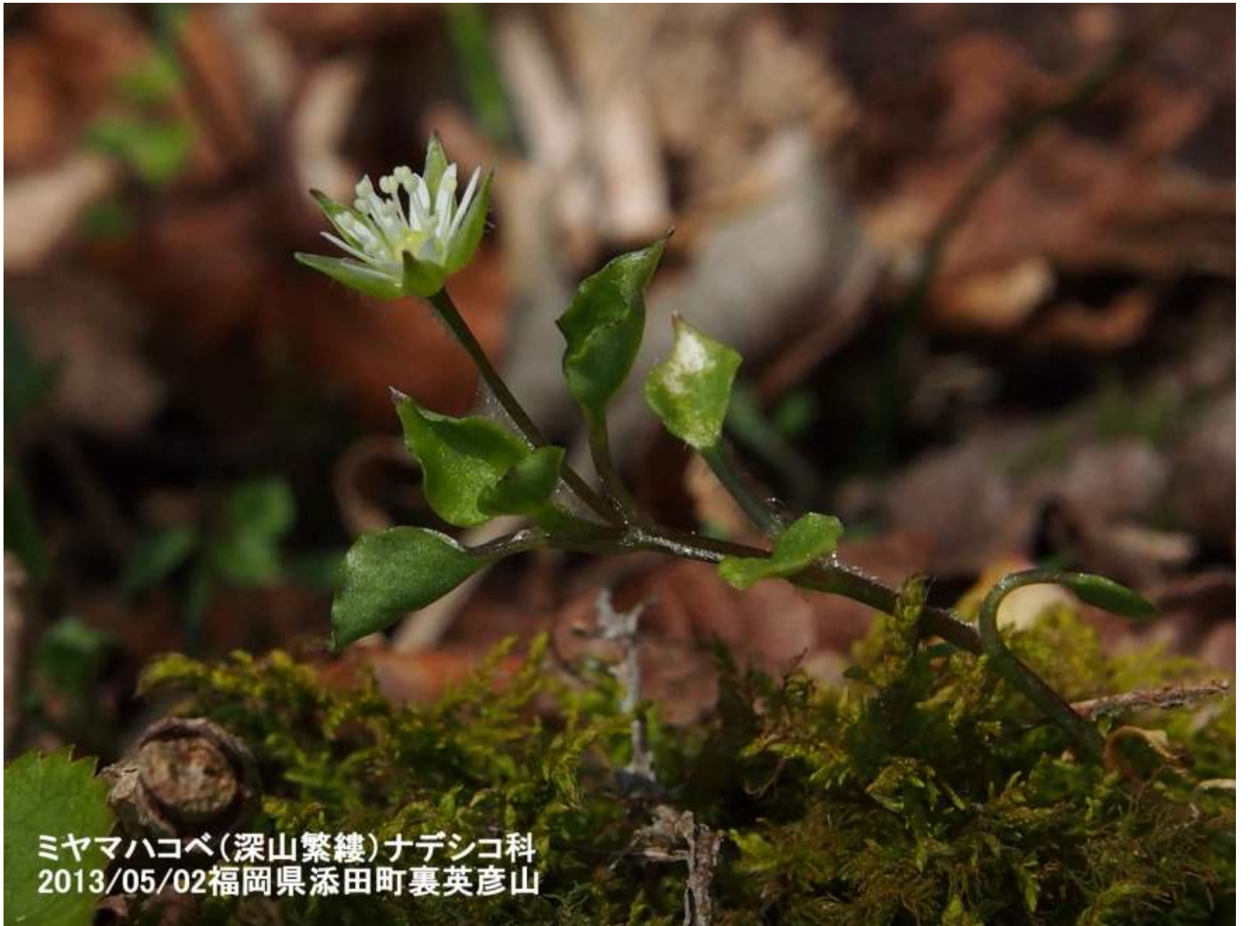
ミヤマハコベ(深山繁縷)ナデシコ科 2013/05/02福岡県添田町裏英彦山