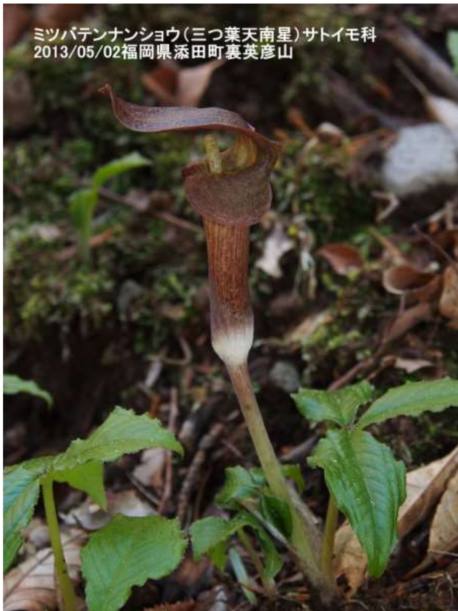
ミツバテンナンショウ(三つ葉天南星) サトイモ科 2013/05/02福岡県添田町裏英彦山