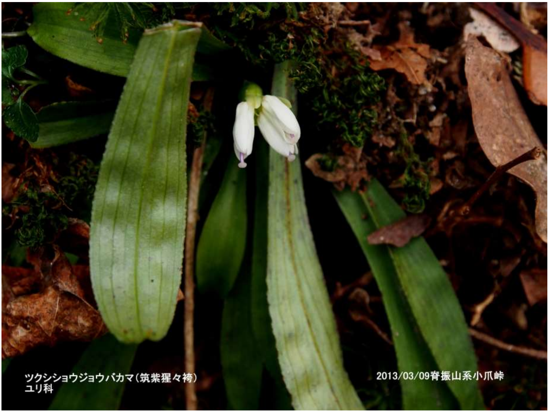
ツクシショウジョウバカマ(筑紫猩々袴) ユリ科