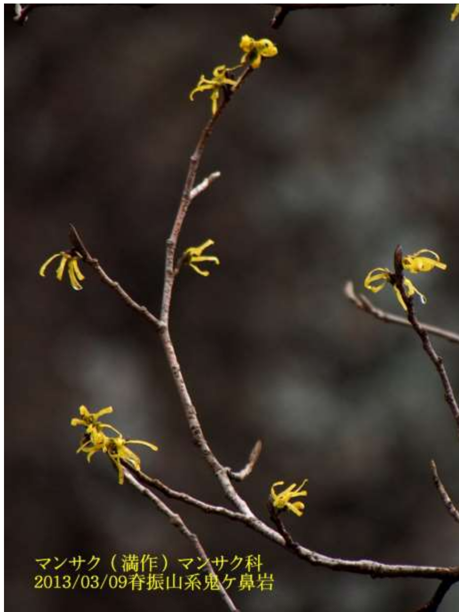
マンサク (満作) マンサク科 2013/03/09 春振山系鬼ヶ鼻岩