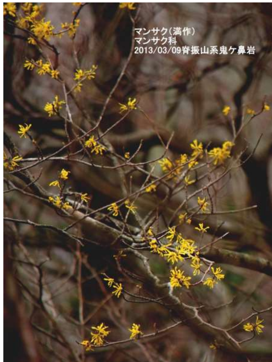
マンサク (満作) マンサク科 2013/03/09 春振山系鬼ヶ鼻岩