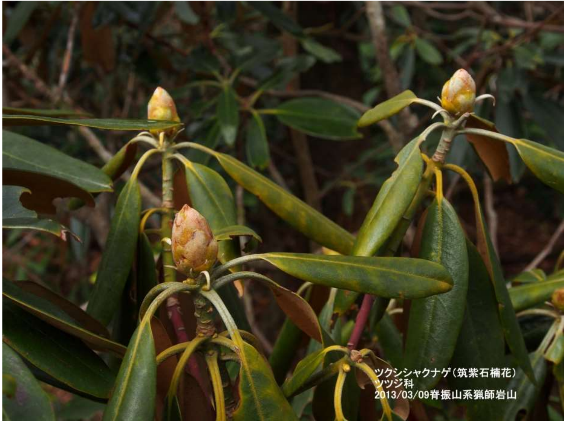
ツクシシャクナゲ(筑紫石楠花) ツツジ科 2013/03/09脊振山系獵師岩山