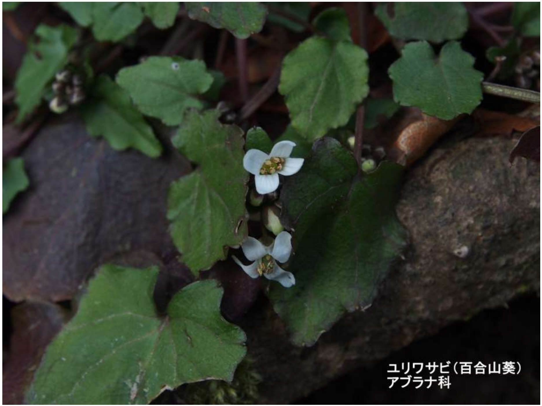
ユリワサビ(百合山葵) アブラナ科