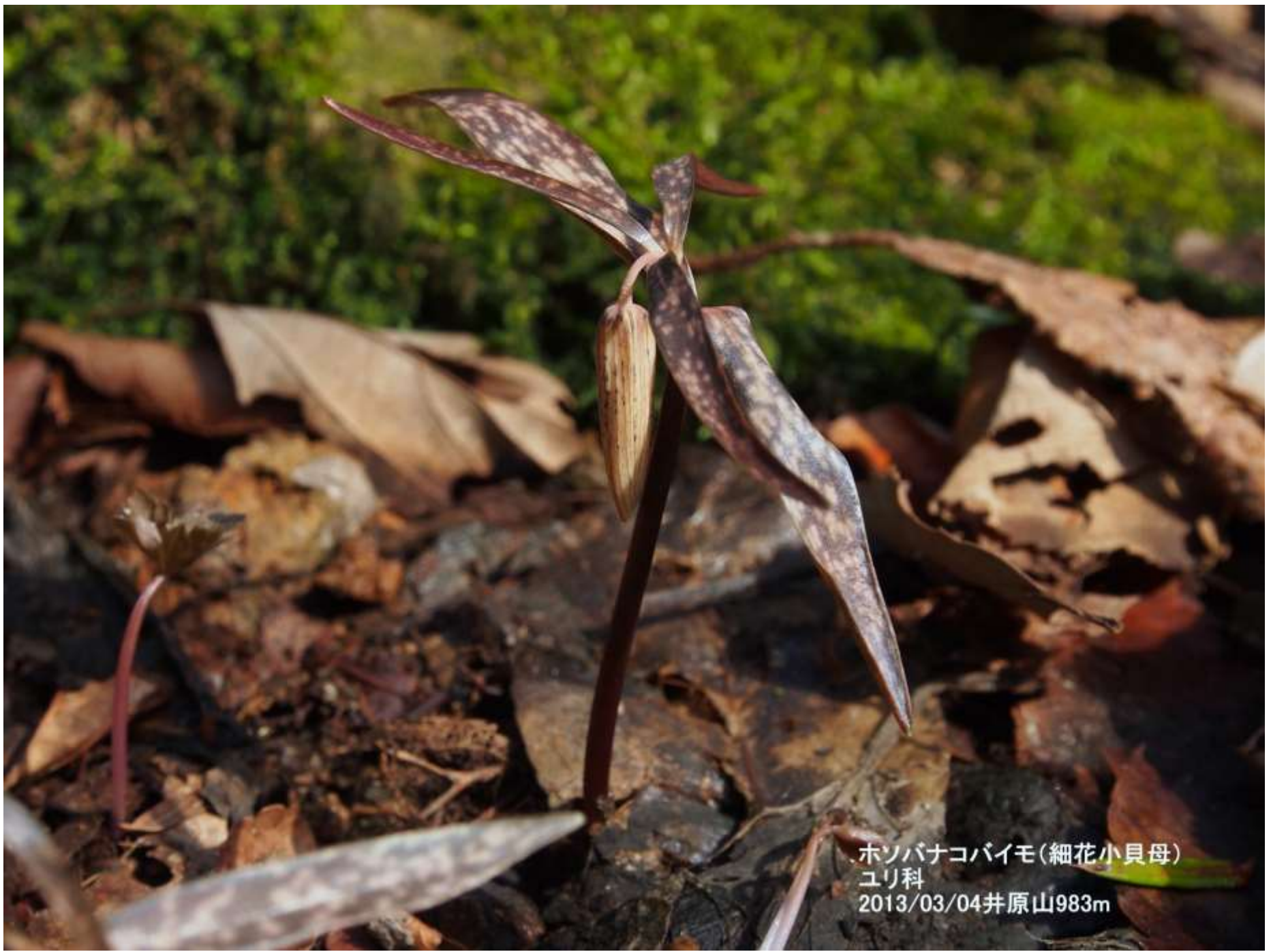
ホソバナコバイモ(細花小貝母) ユリ科 2013/03/04井原山983m