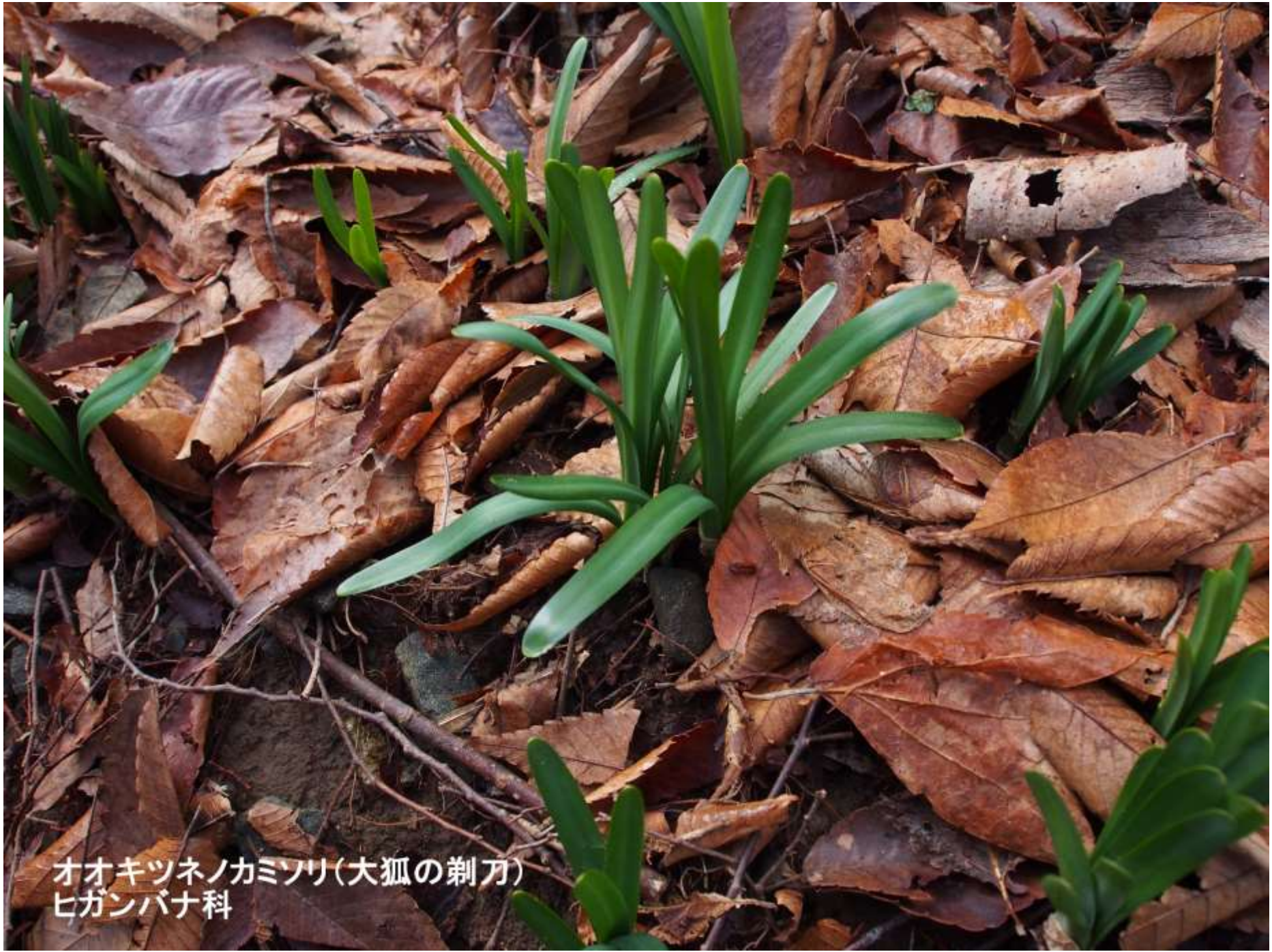
オオキツネノカミソリ(大狐の剃刀) ヒガンバナ科