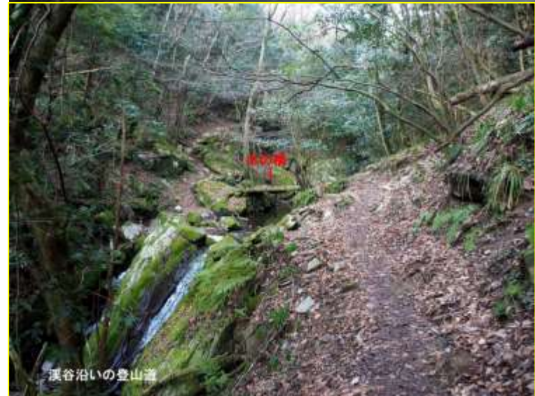
溪谷沿いの登山道