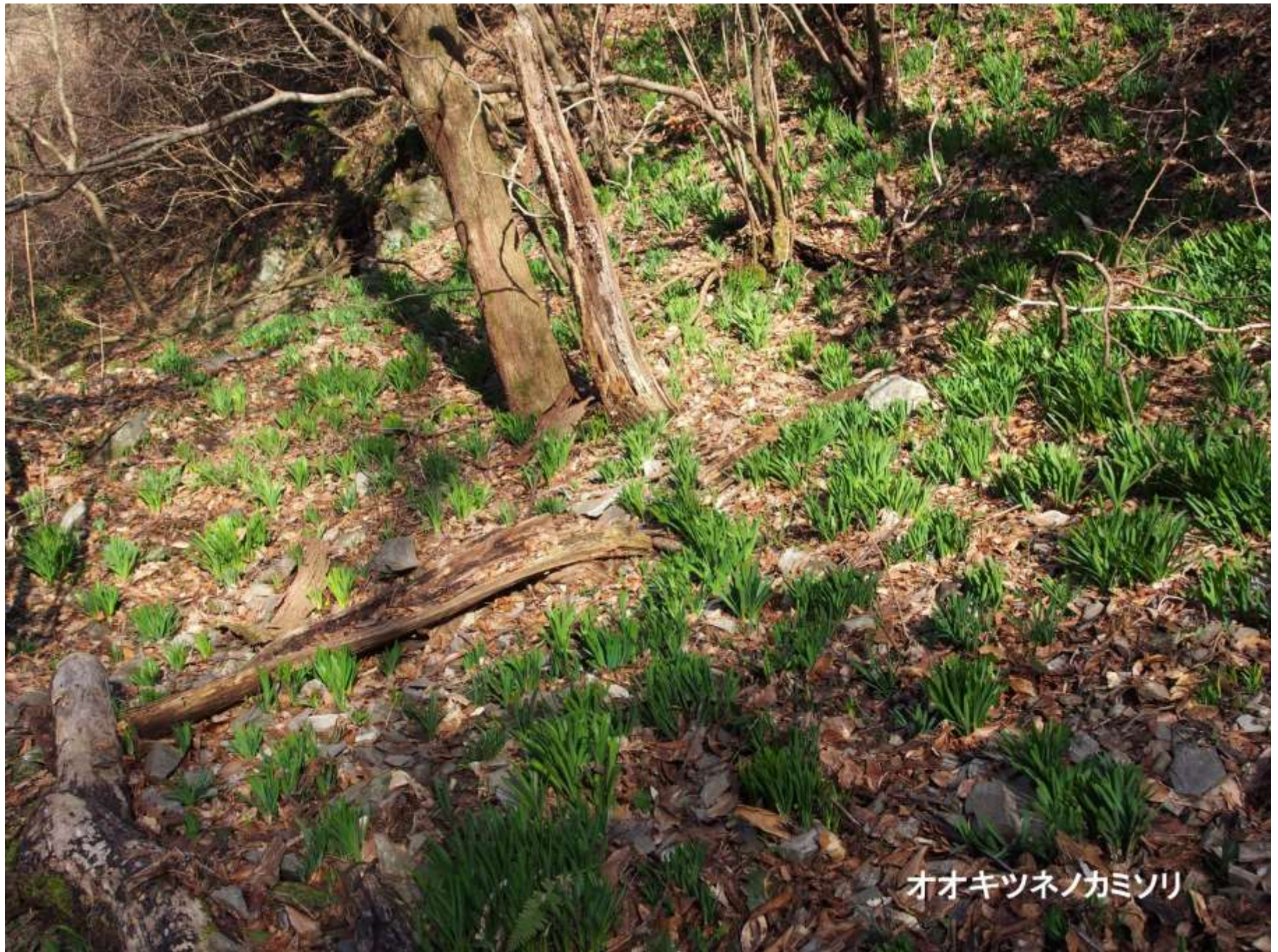
オオキツネノカミソリ