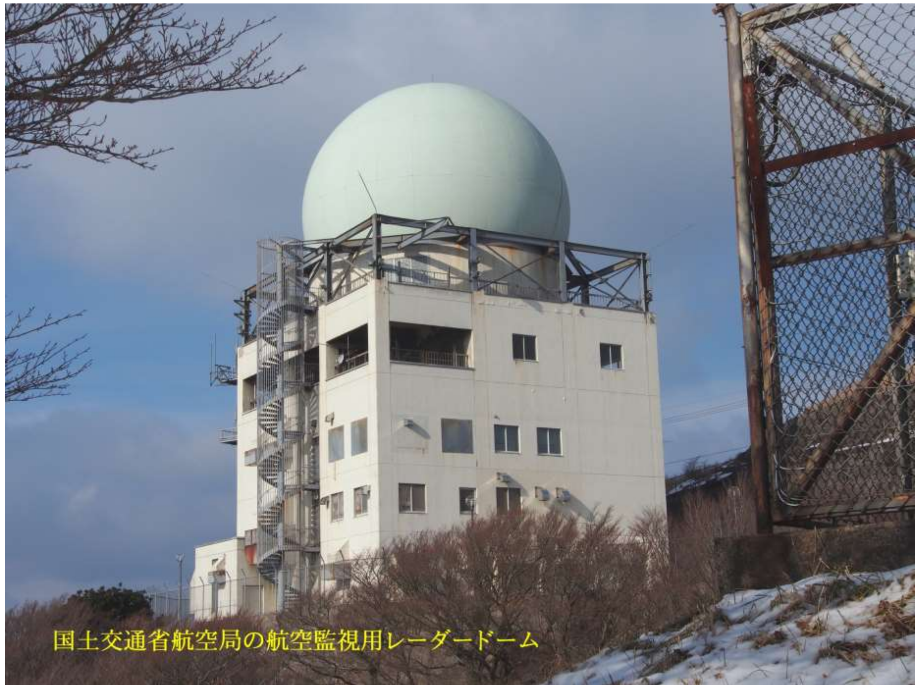
国土交通省航空局の航空監視用レーダードーム