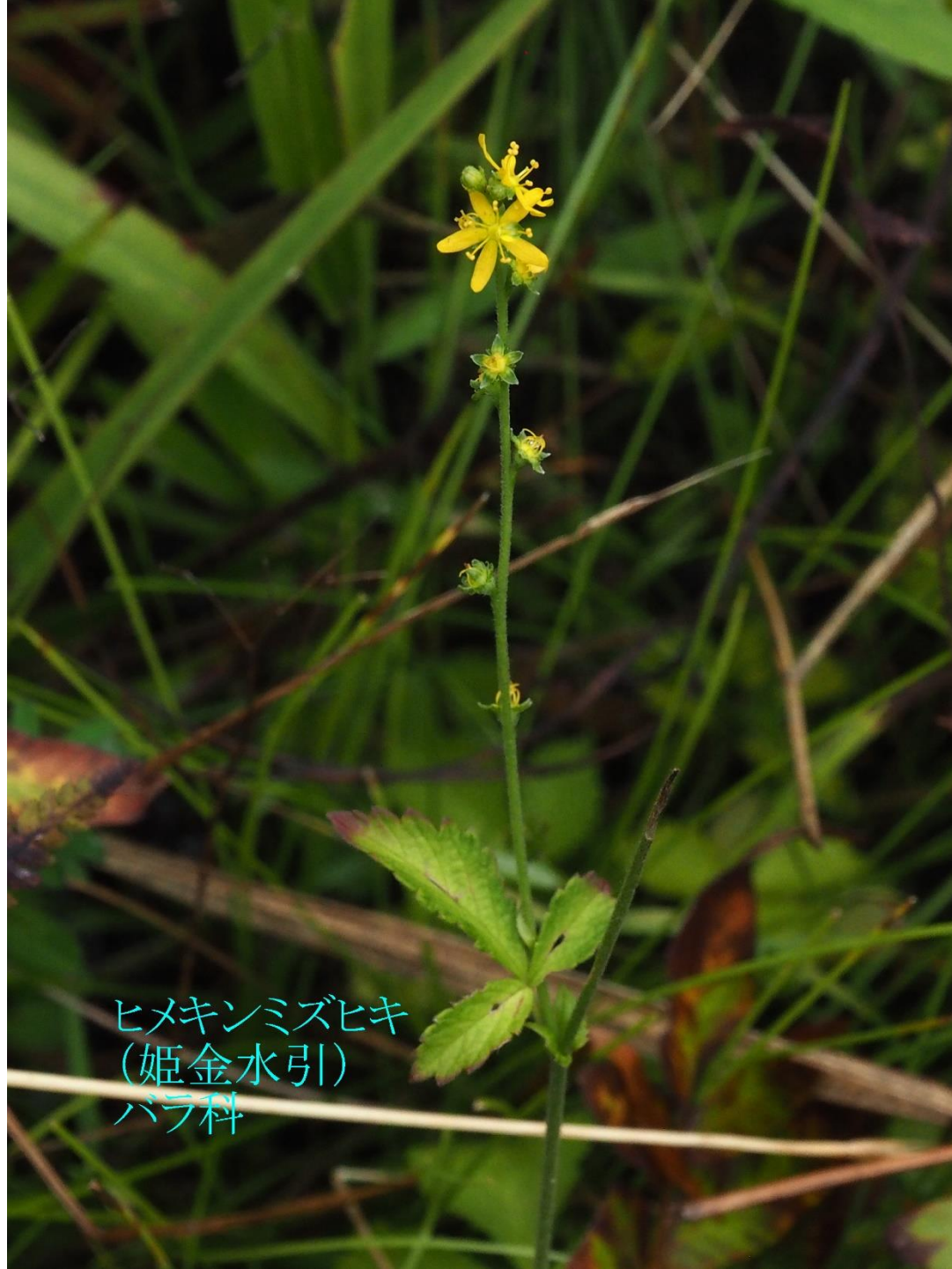
ヒメキンミズヒキ (姫金水引) バラ科