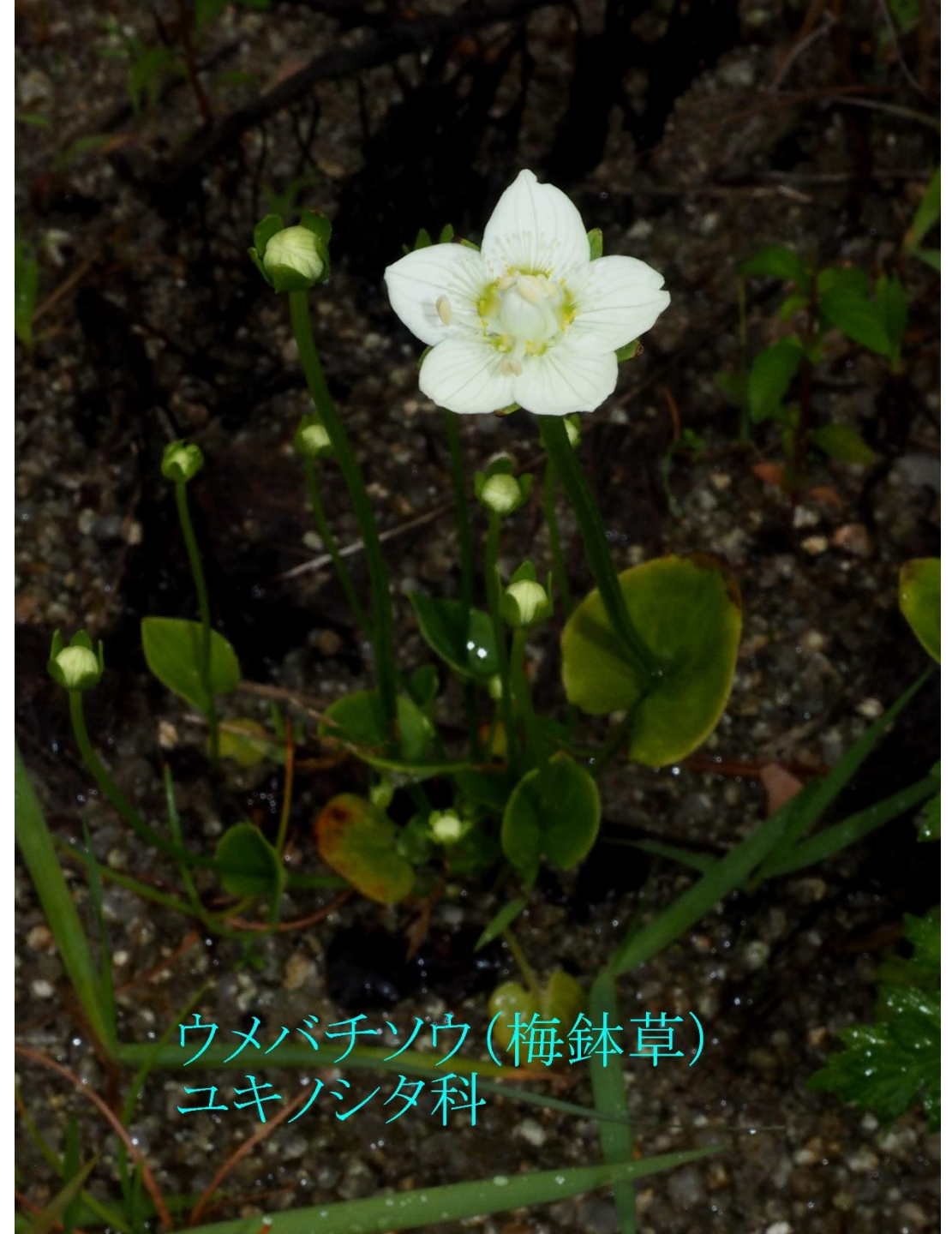
ウメバチソウ(梅鉢草) ユキノシタ科