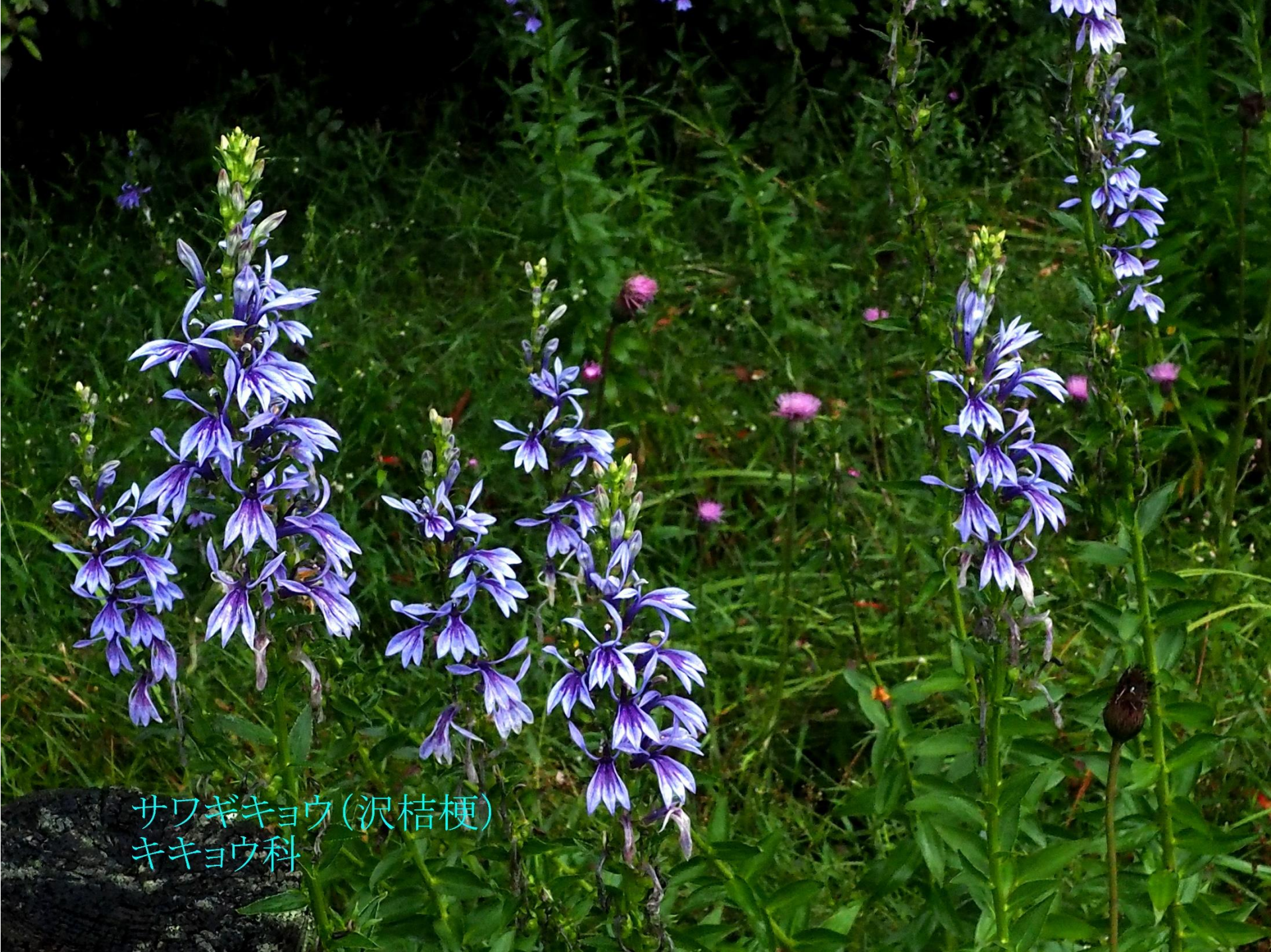
サワギキョウ(沢桔梗) キキョウ科