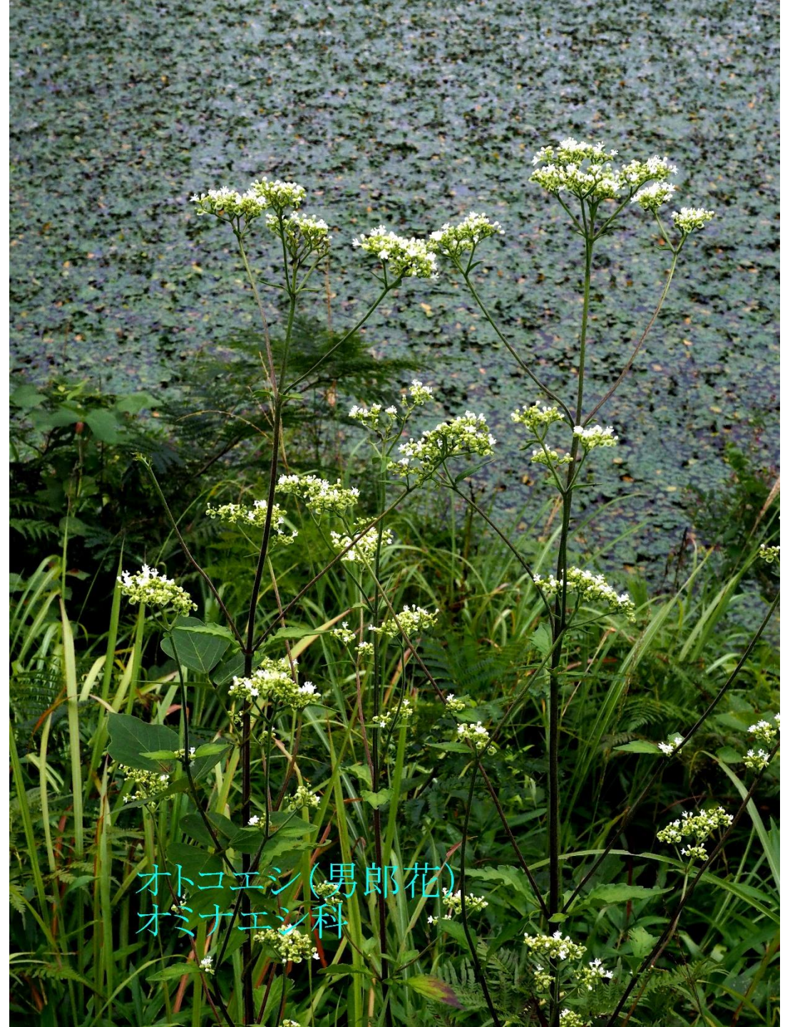
オトコエシ(男郎花) オミナエシ科