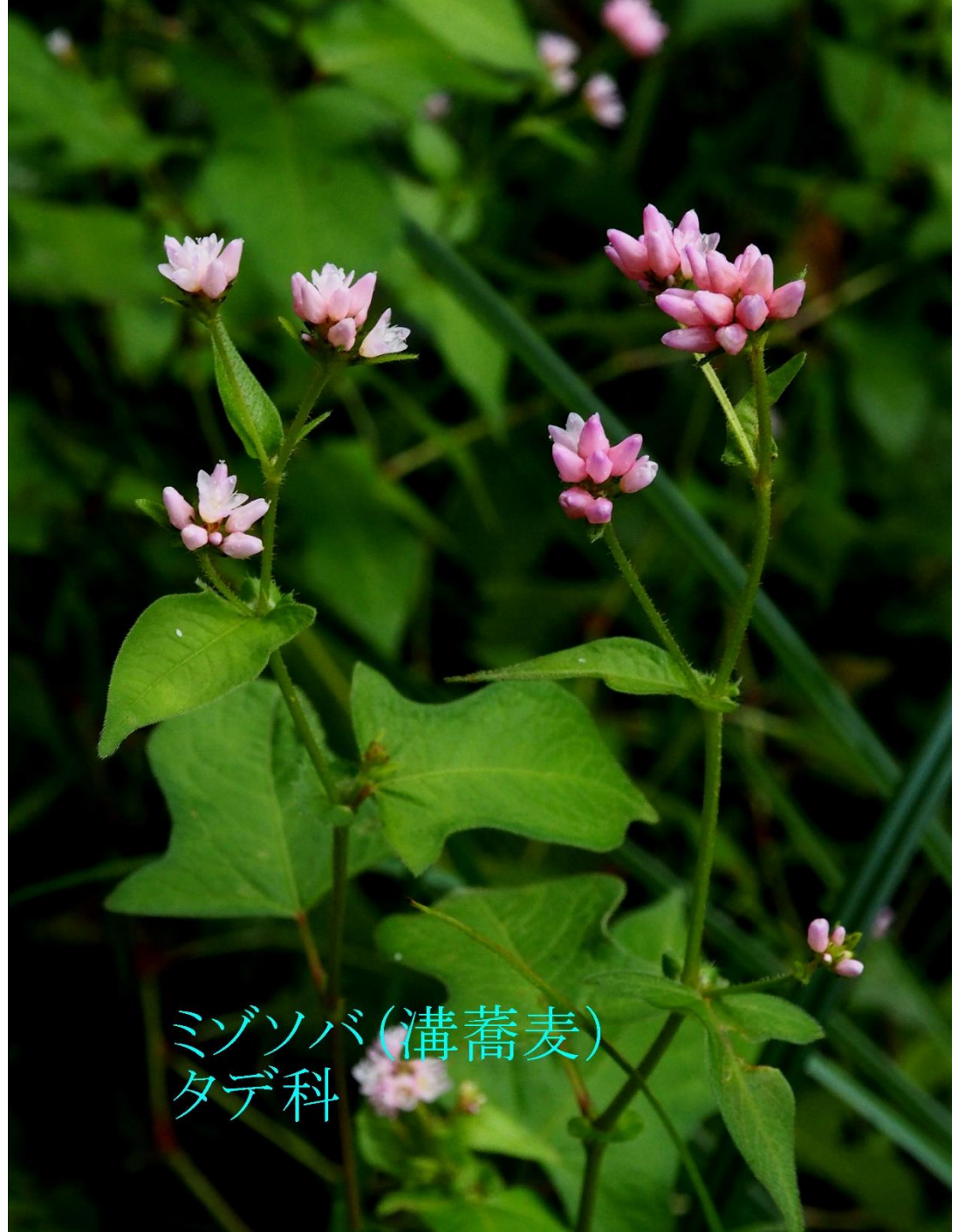
ミゾソバ(溝蕎麦) タデ科