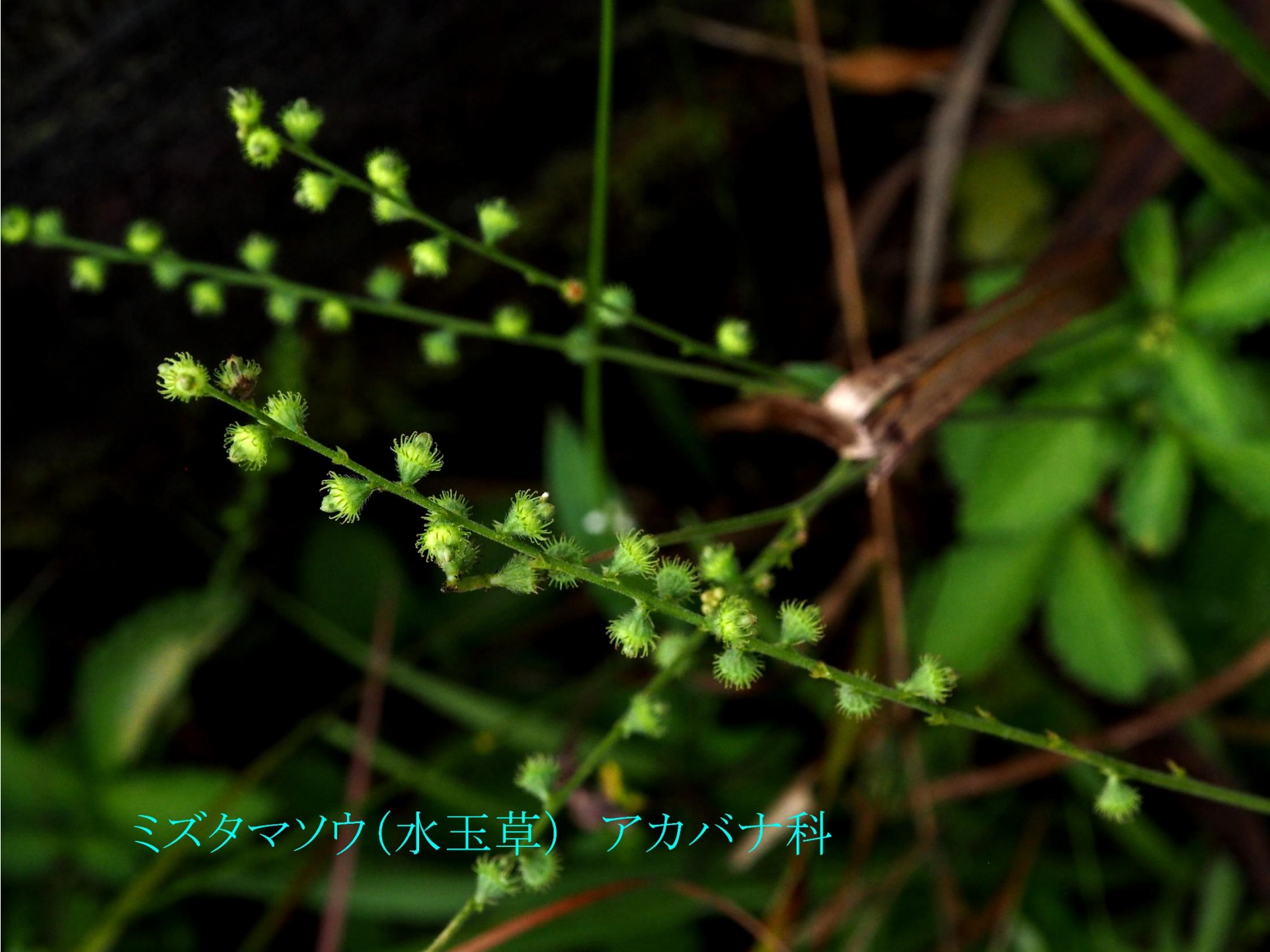
ミズタマソウ(水玉草) アカバナ科