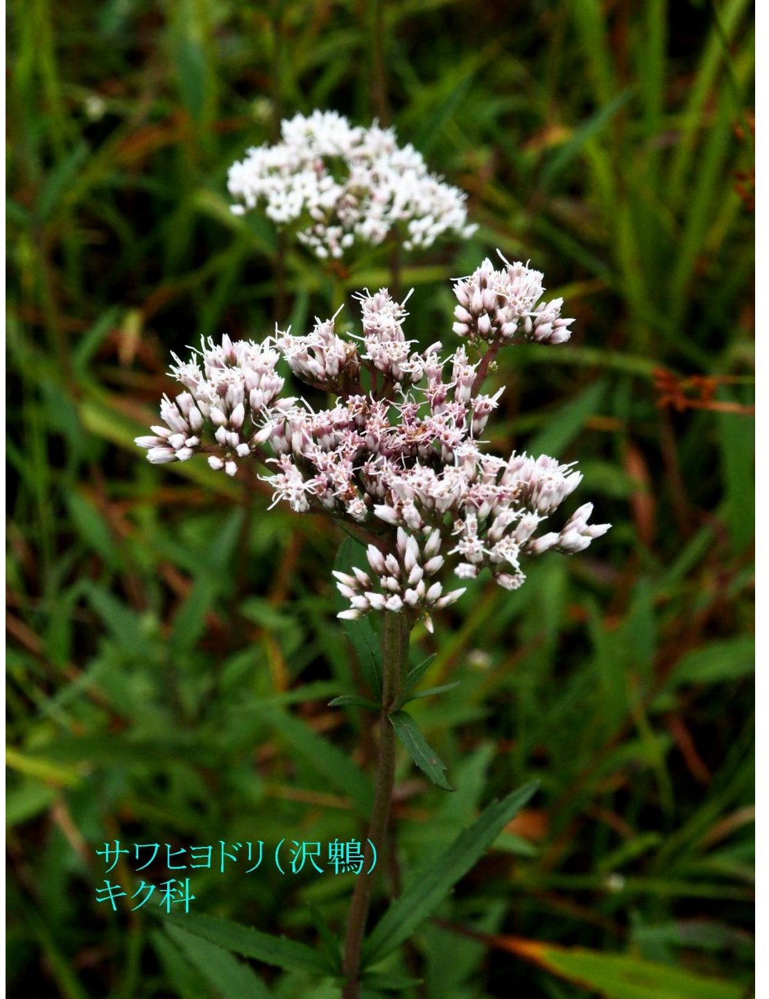
サワヒヨドリ(沢鶉) キク科