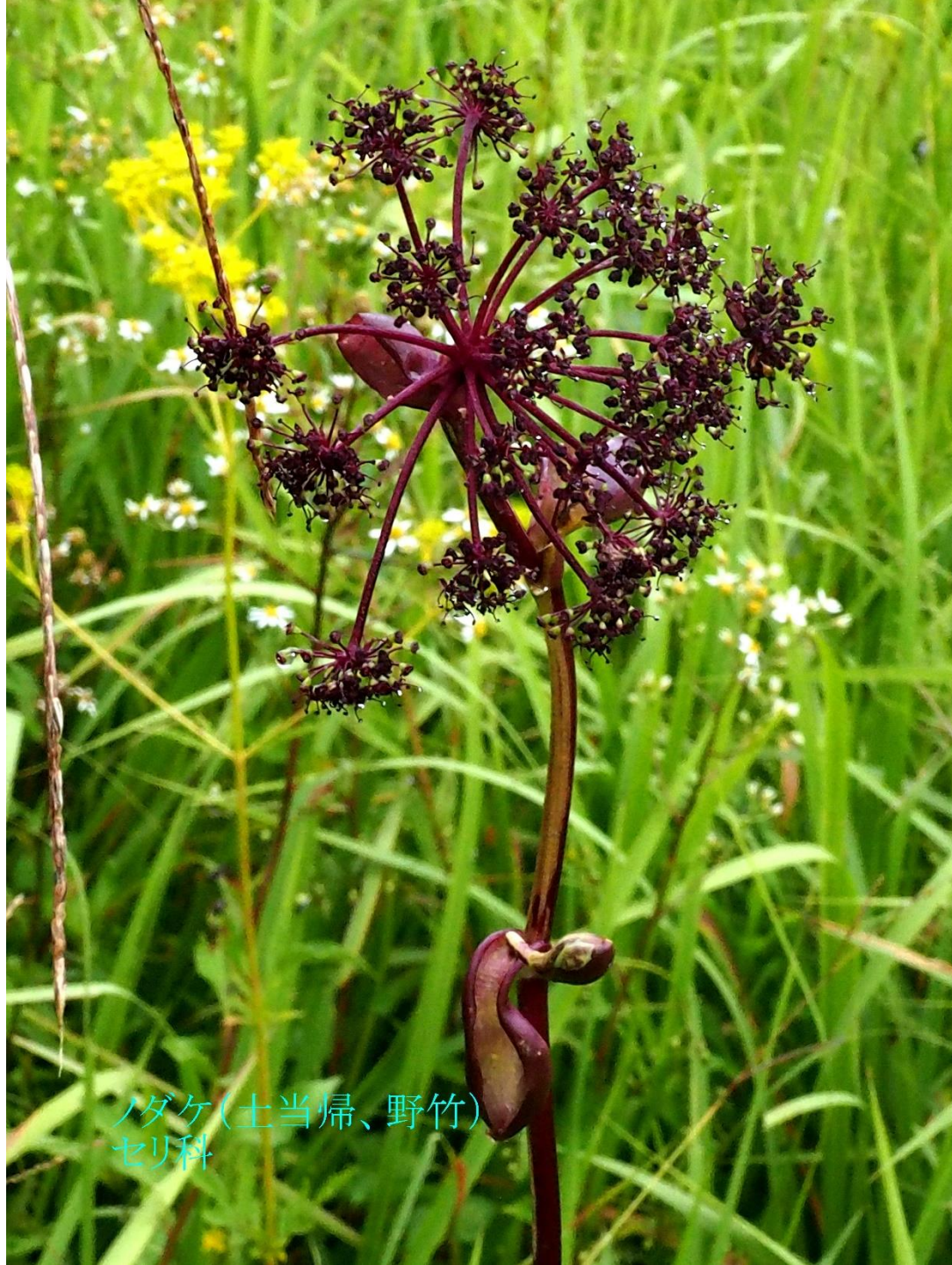
ノダケ(土当帰、野竹) セリ科