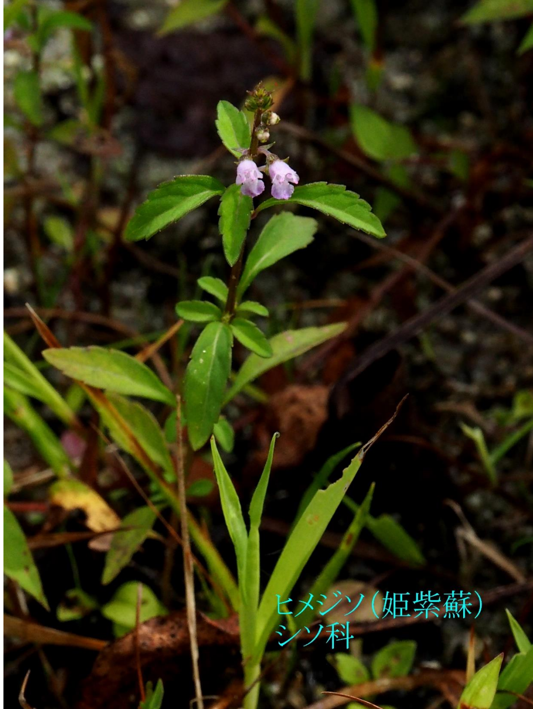
ヒメジソ(姫紫蘇) シソ科