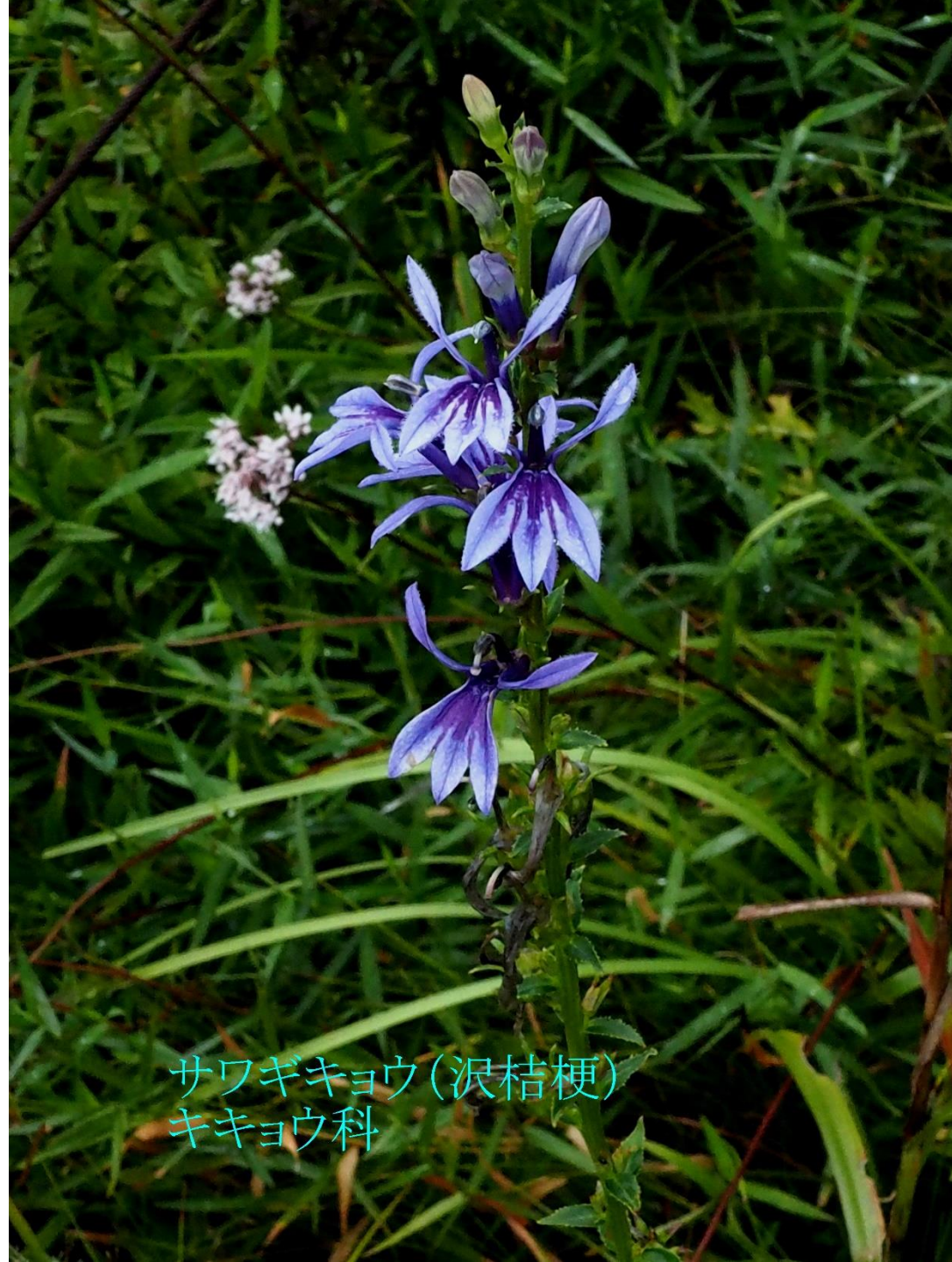
サワギキョウ(沢桔梗) キキョウ科