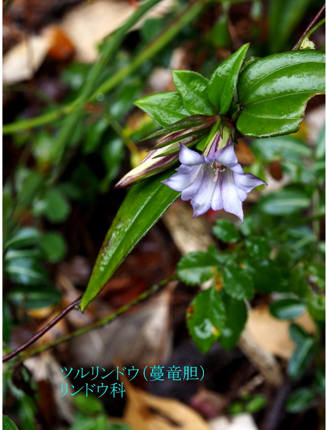
ツルリンドウ(蔓竜胆) リンドウ科