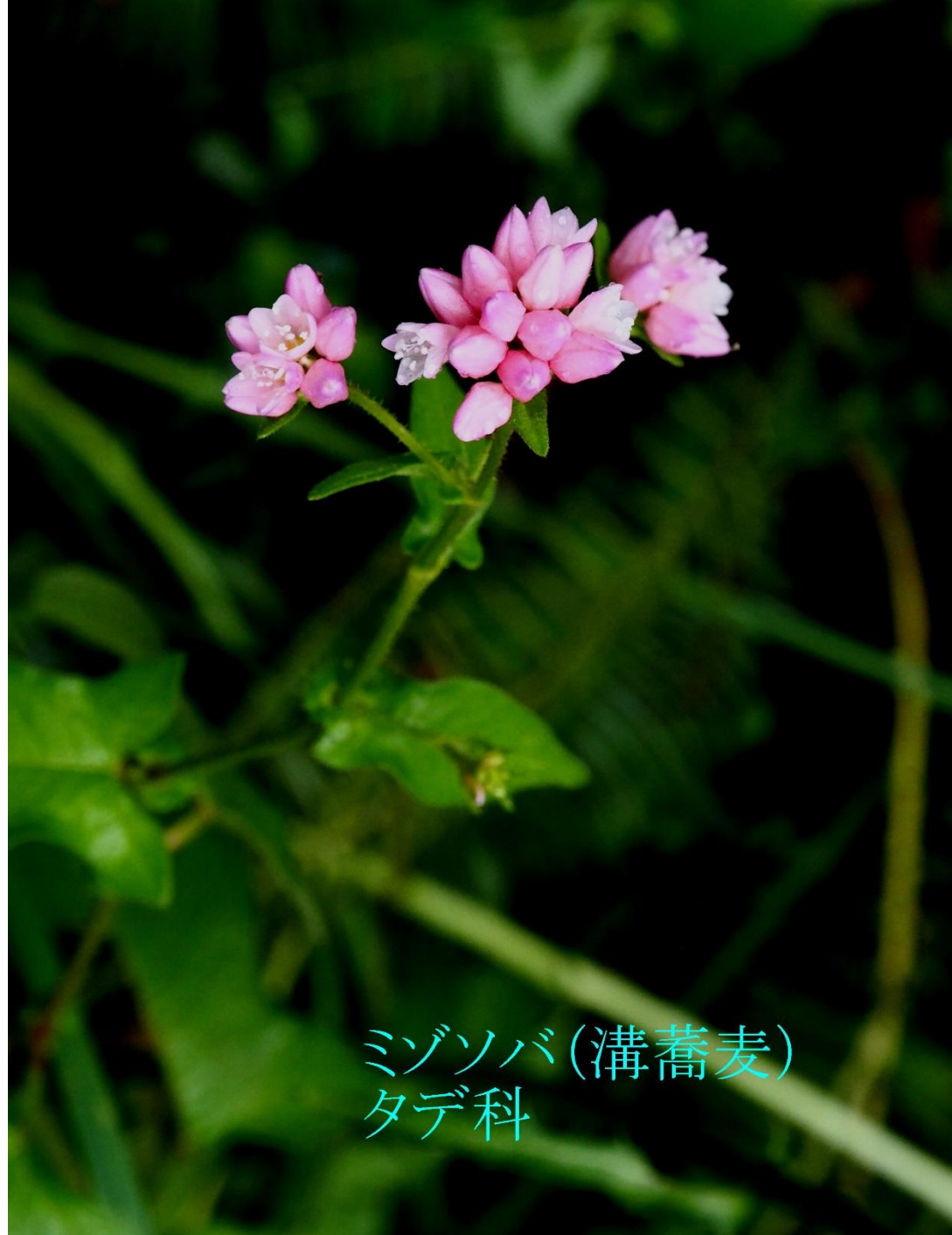
ミゾソバ(溝蕎麦) タデ科