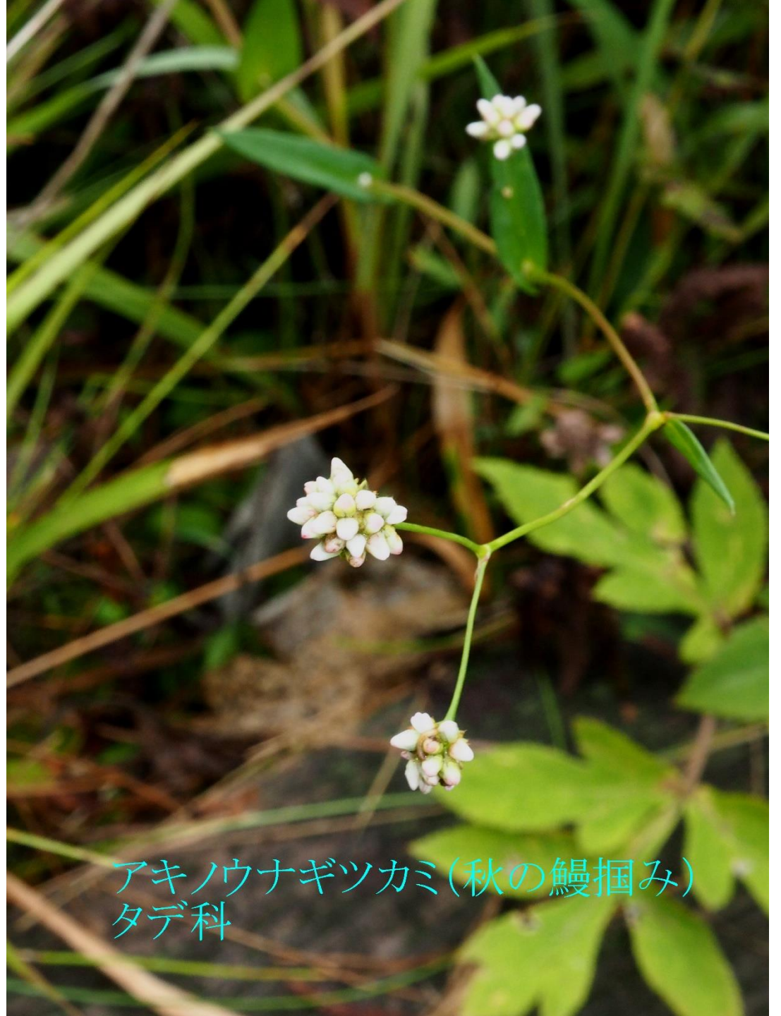
アキノウナギツカミ(秋の鰻掴み) タデ科