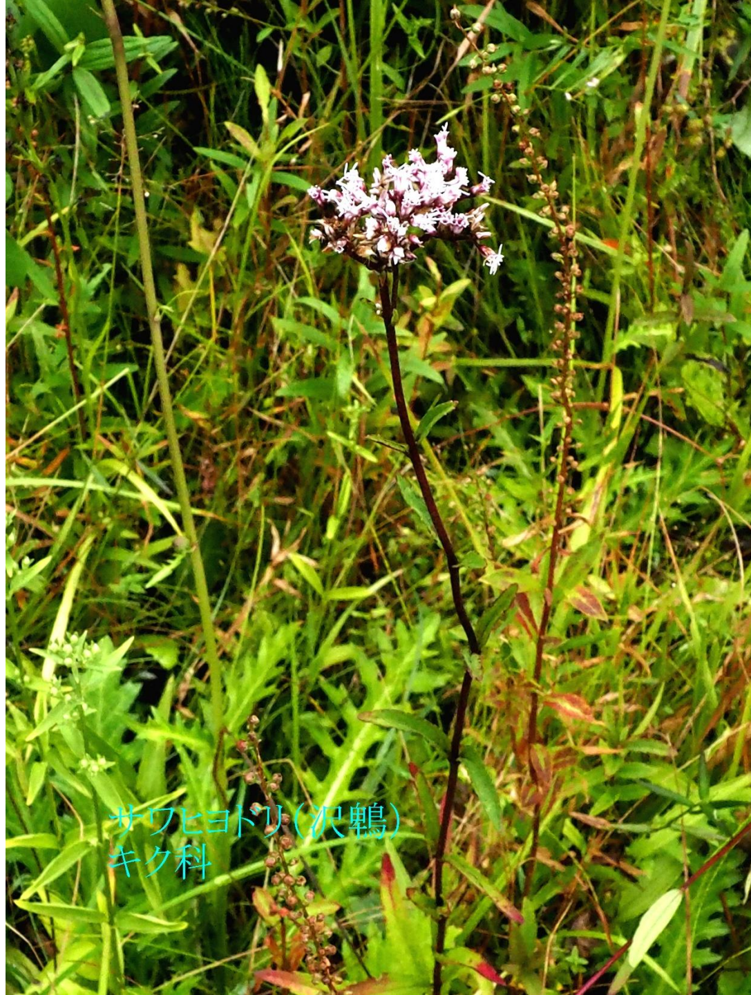
サウヒヨドリ(沢鶴) キク科