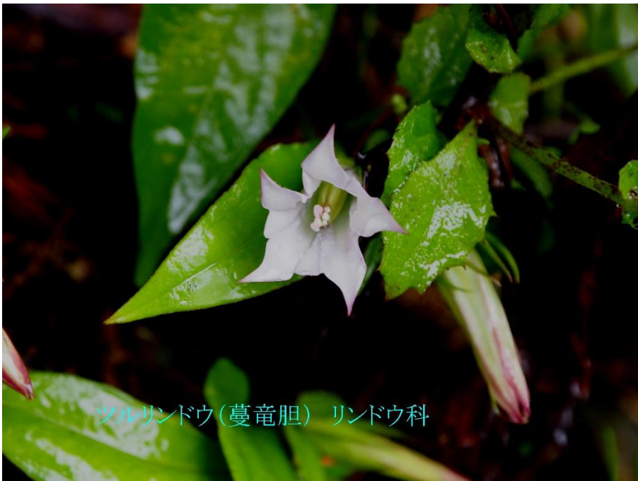
ツルリンドウ(蔓竜胆) リンドウ科