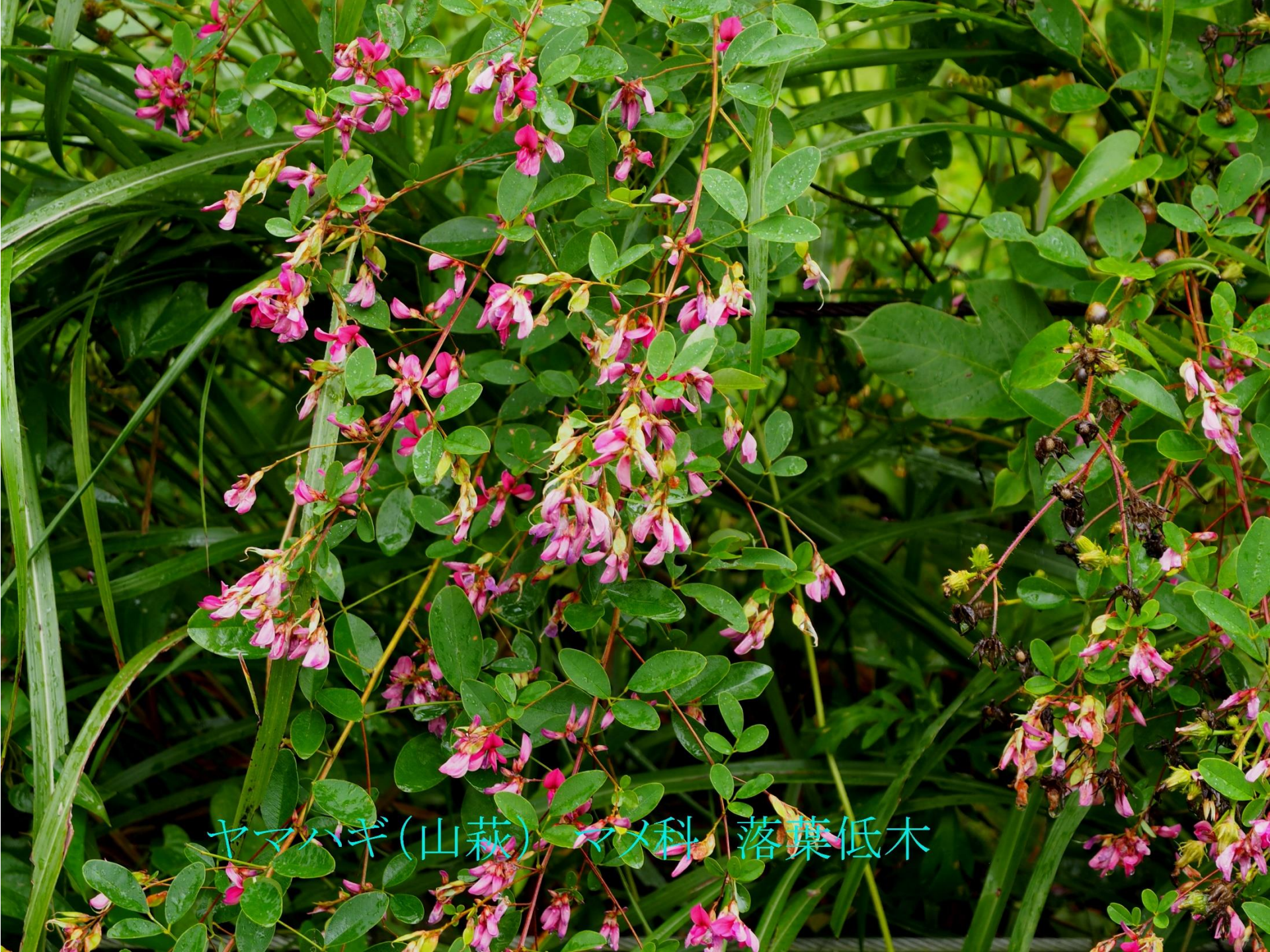
ヤマハギ(山萩) マメ科 落葉低木