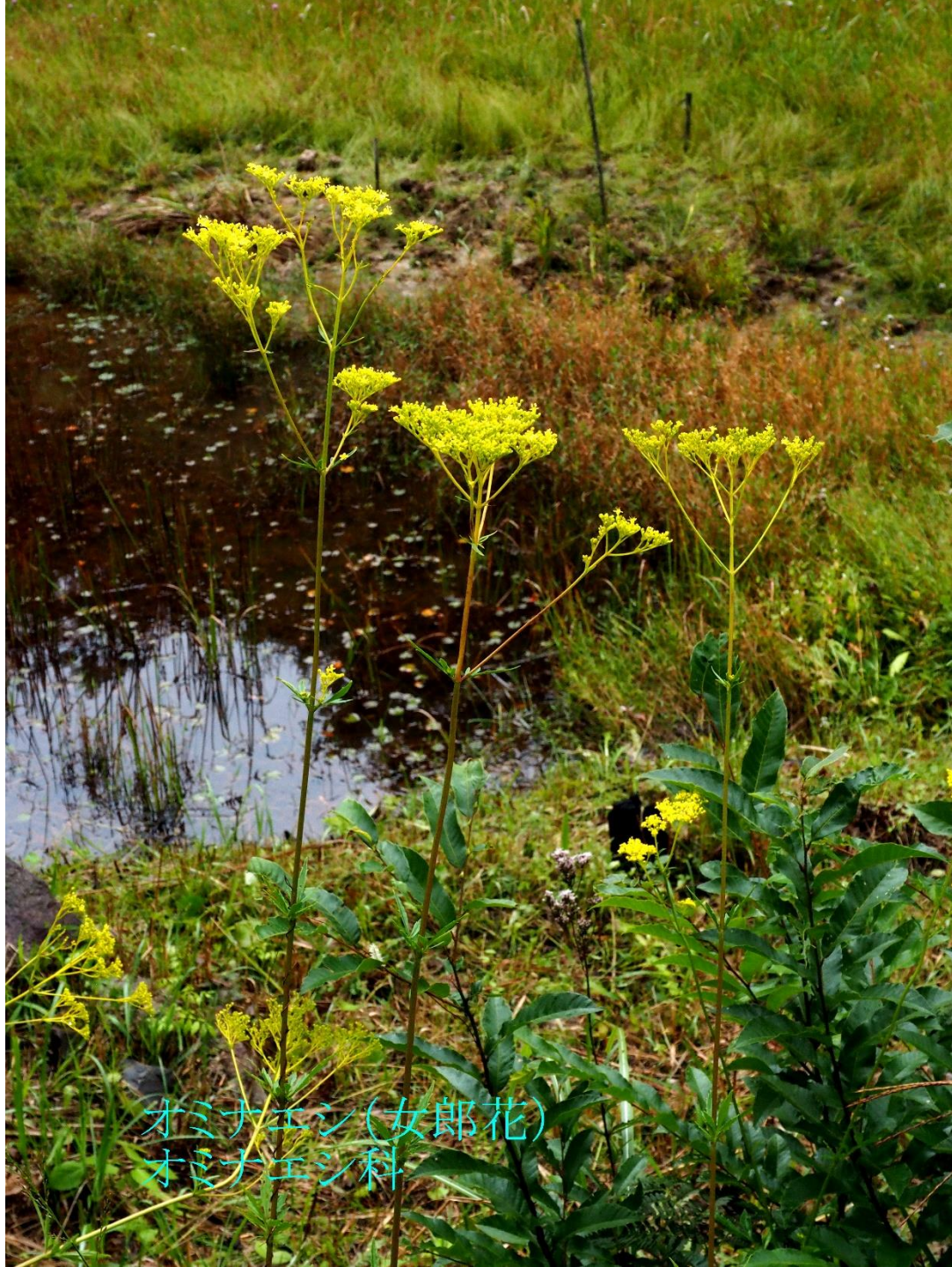
オミナエシ(女郎花) オミナエシ科