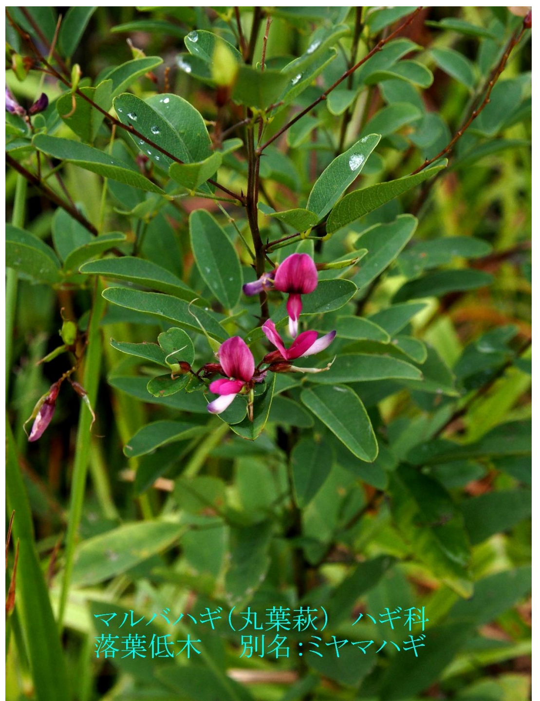
マルバハギ(丸葉萩) ハギ科 落葉低木 別名:ミヤマハギ