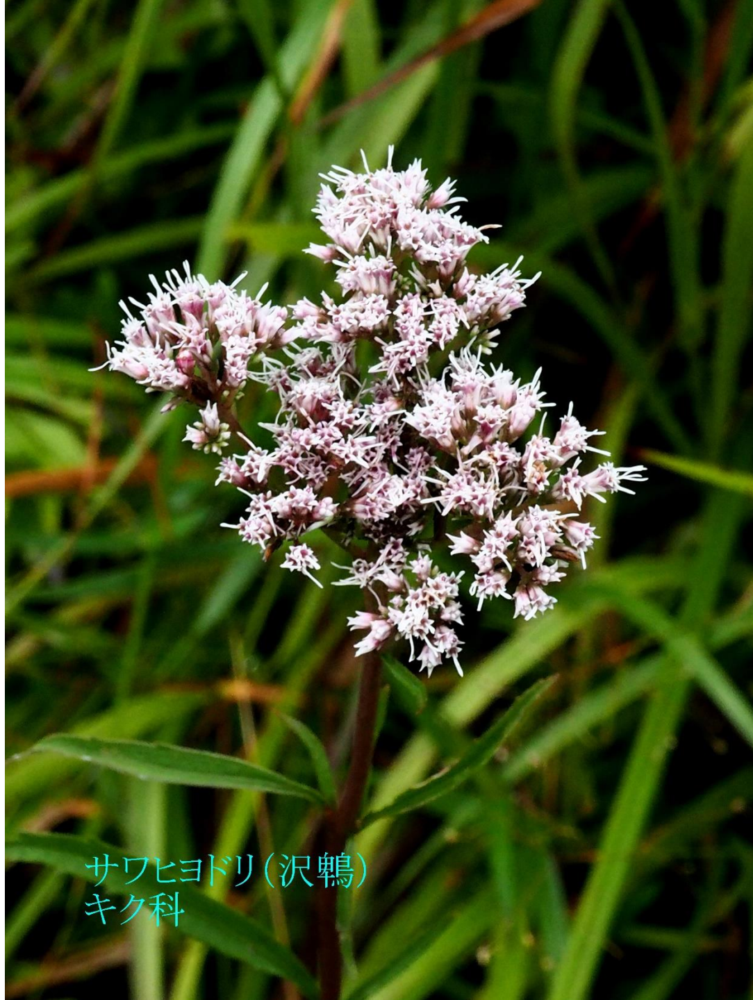
サワヒヨドリ(沢鶉) キク科