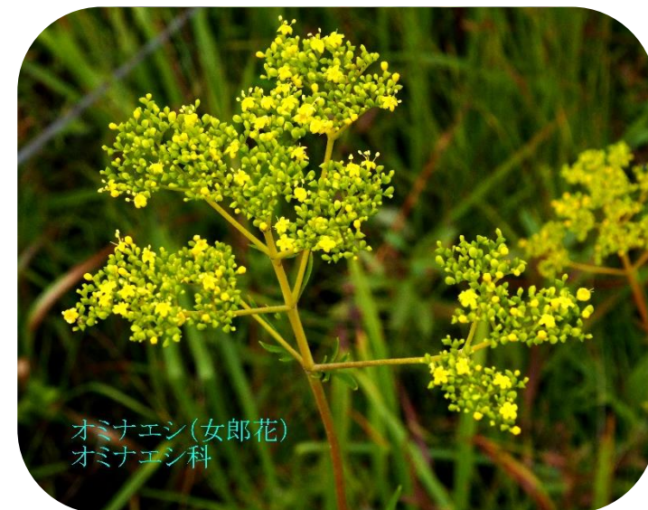
オミナエシ(女郎花) オミナエシ科