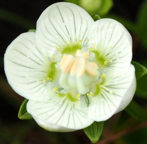
ウメバチソウ(梅鉢草) ユキノシタ科