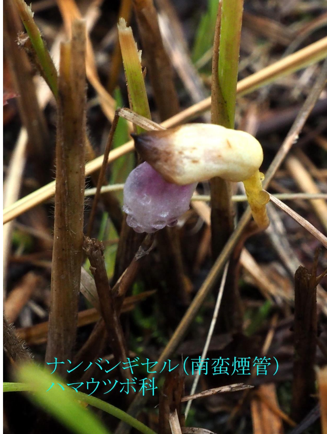
ナンバンギセル(南蛮煙管) ハマウツボ科