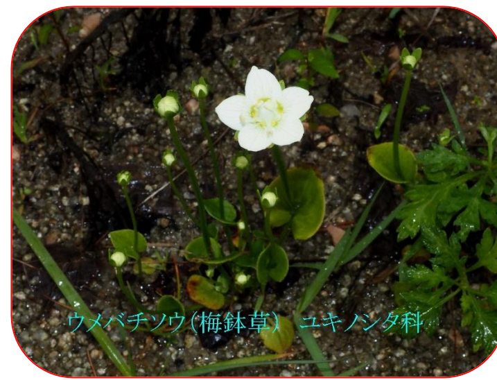
ウメバチソウ(梅鉢草) ユキノシタ科