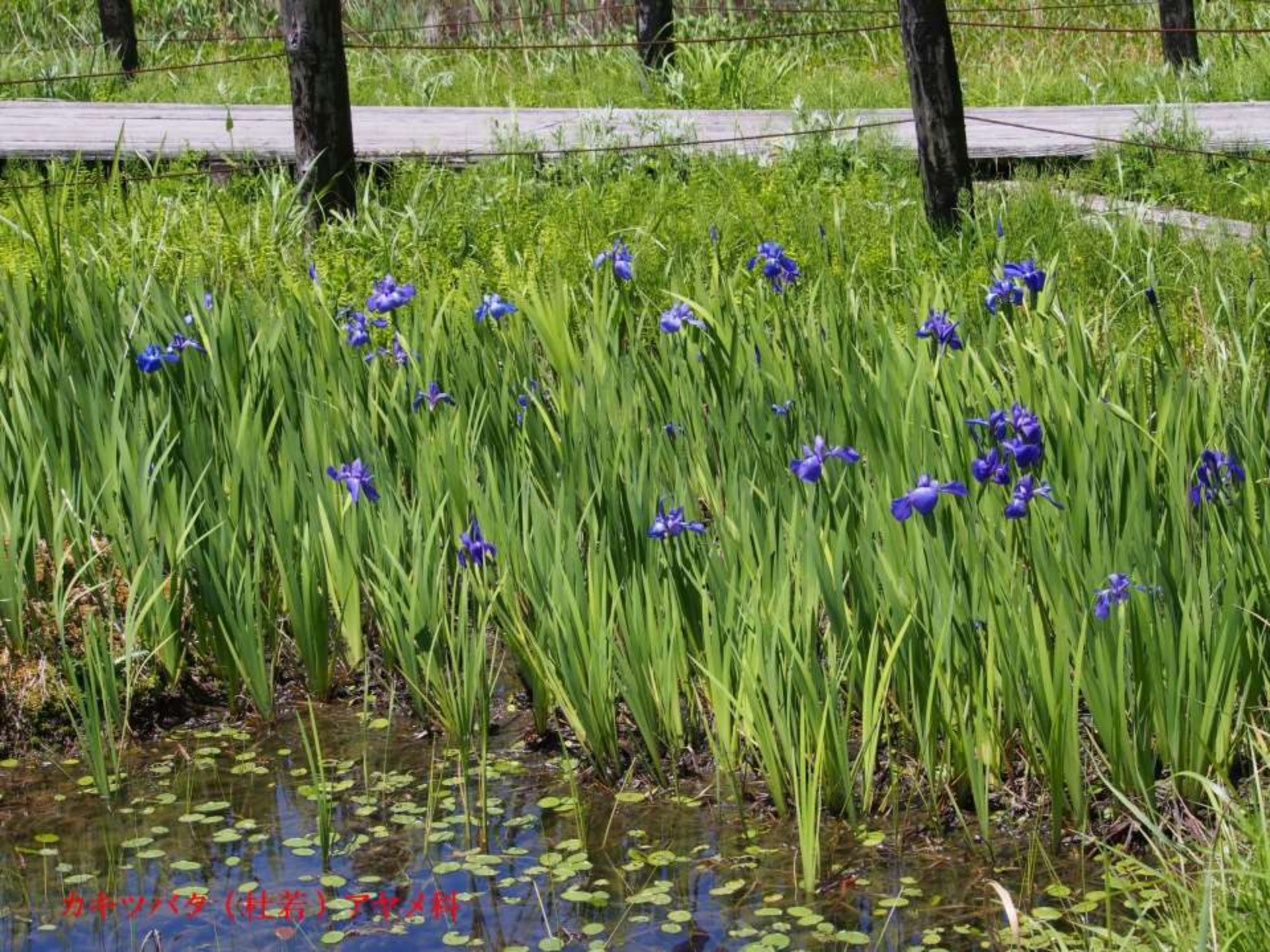
カキツバタ（杜若）アヤメ科