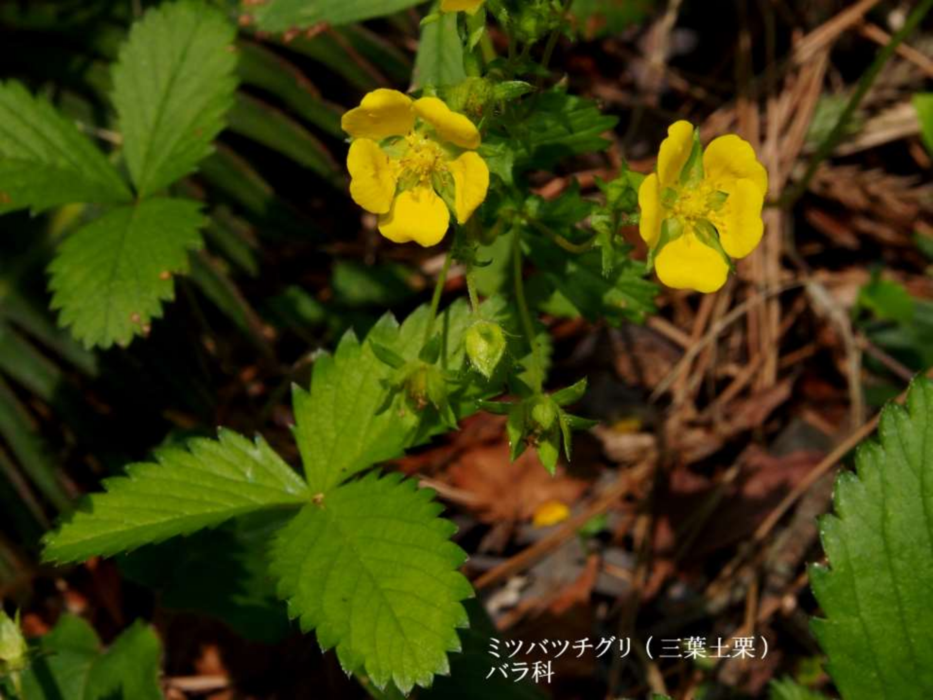
ミツバツチグリ（三葉土栗） バラ科