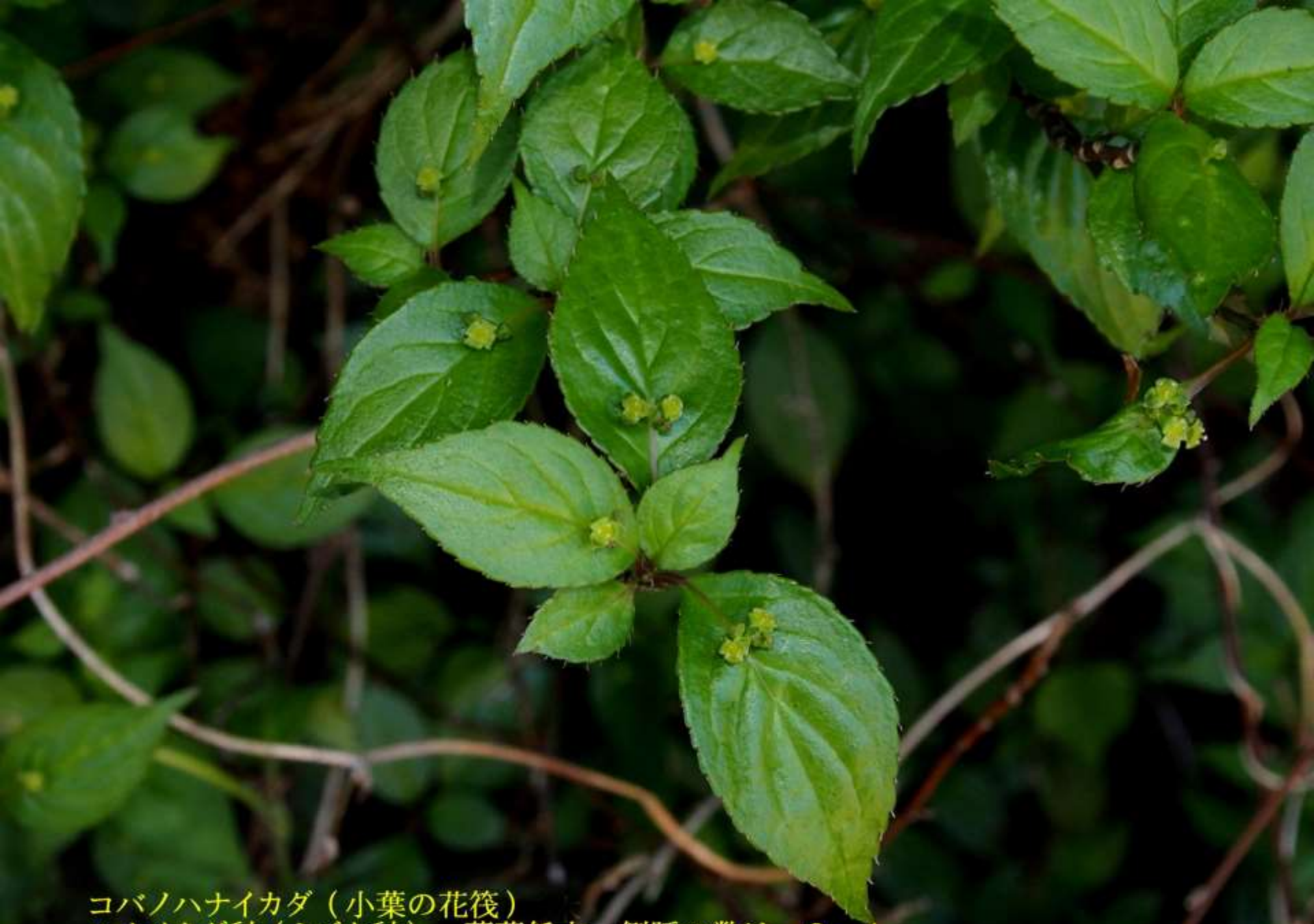
コバノハナイカダ（小葉の花筏） ハナイカダ科（ミズキ科） 落葉低木 側脈の数は、3～4