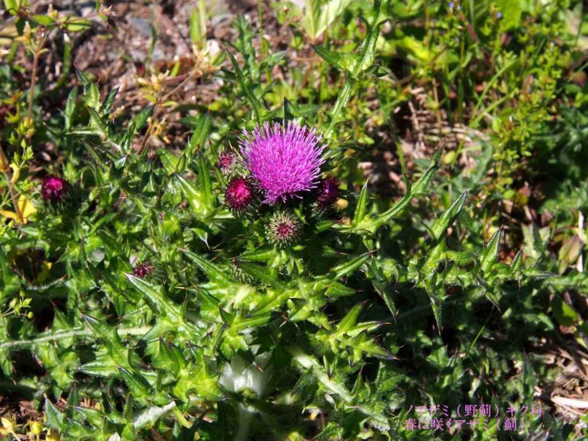
ノアザミ（野薊）キク科 春に咲くアザミ（薊）