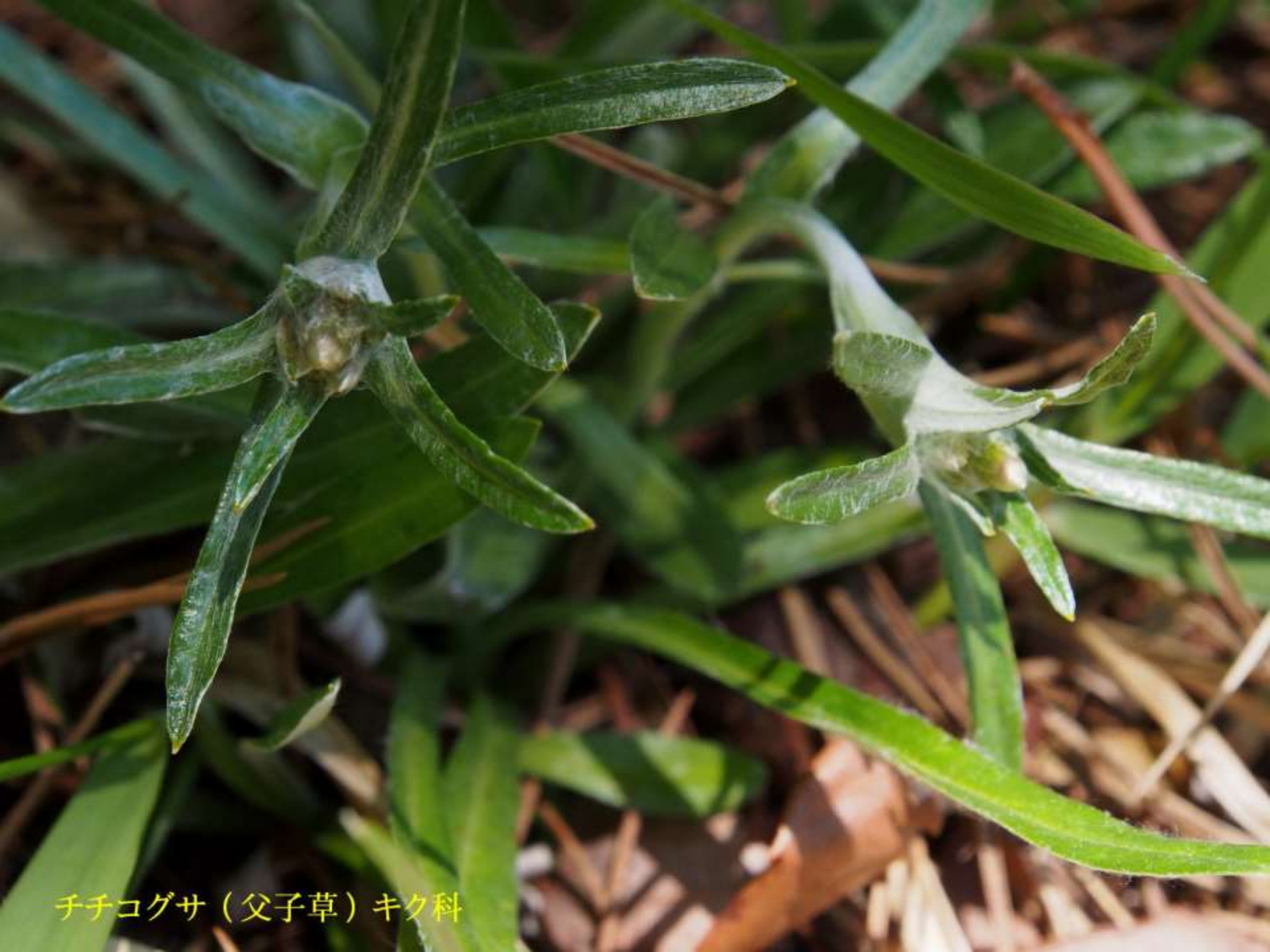
チチコグサ（父子草）キク科