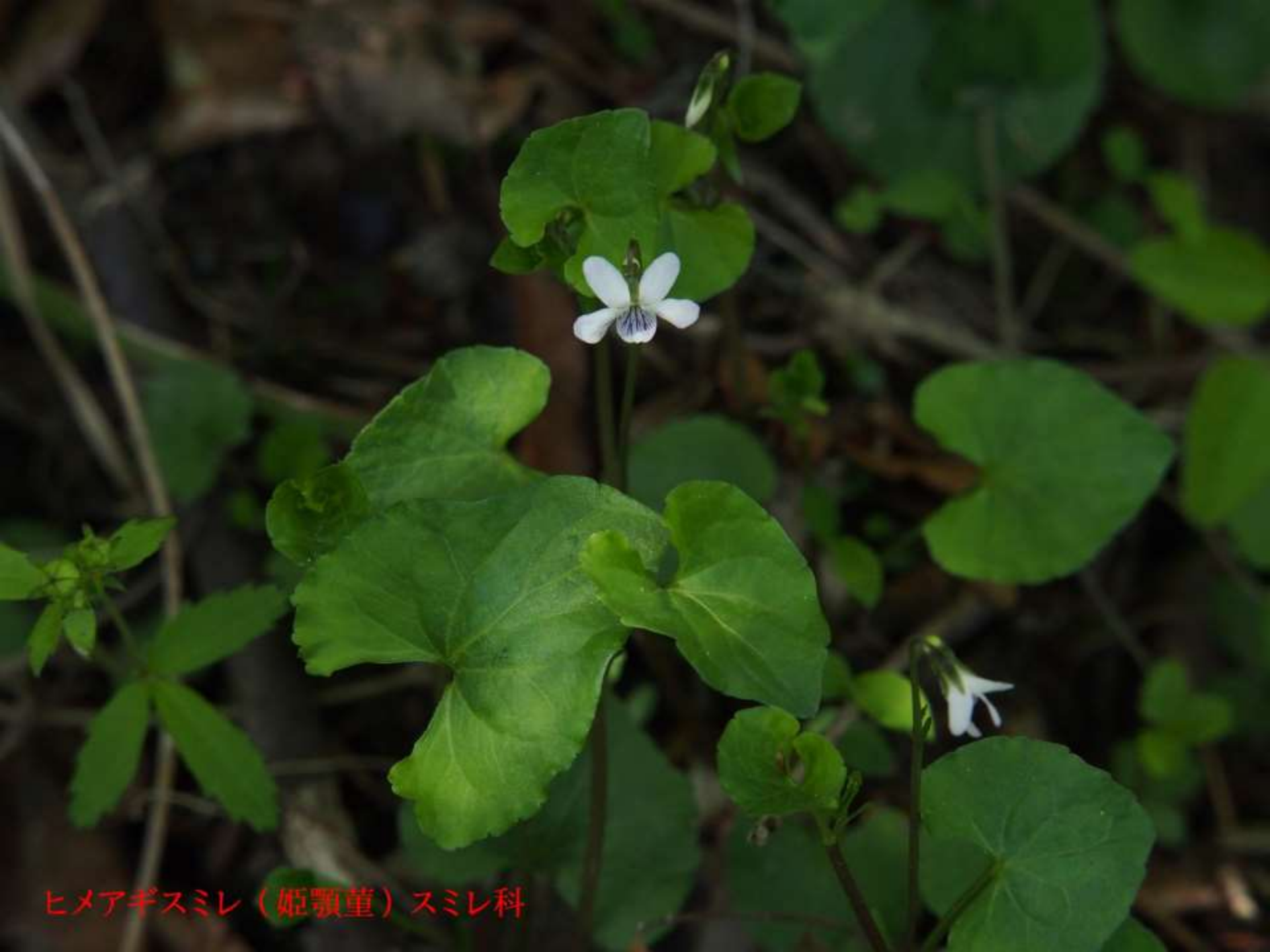
ヒメアギスマレ (姫顎堇) スミレ科