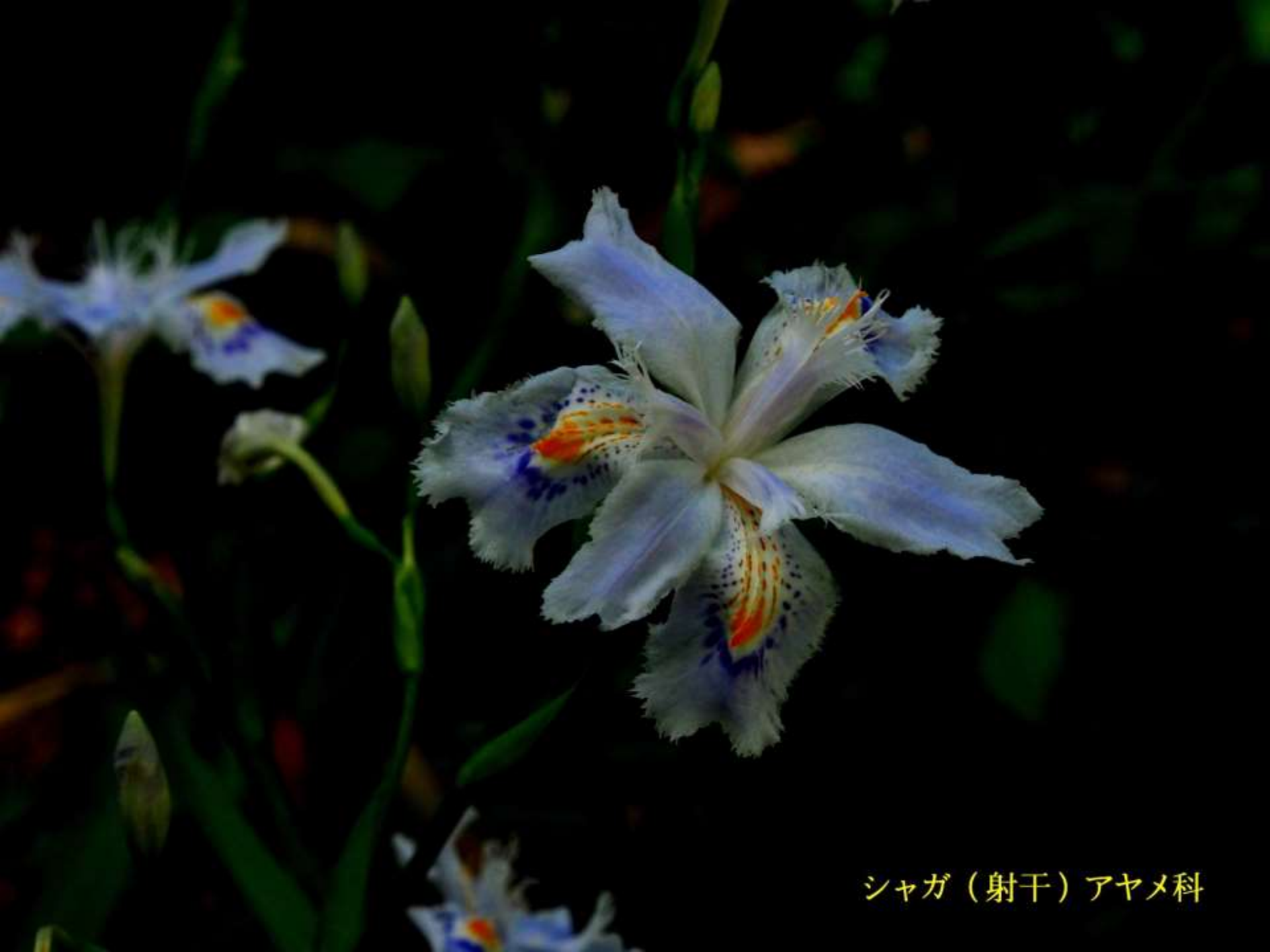
シャガ（射干）アヤメ科