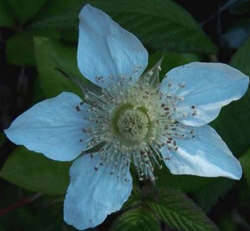
クサイチゴ（草莓）バラ科 落葉小低木