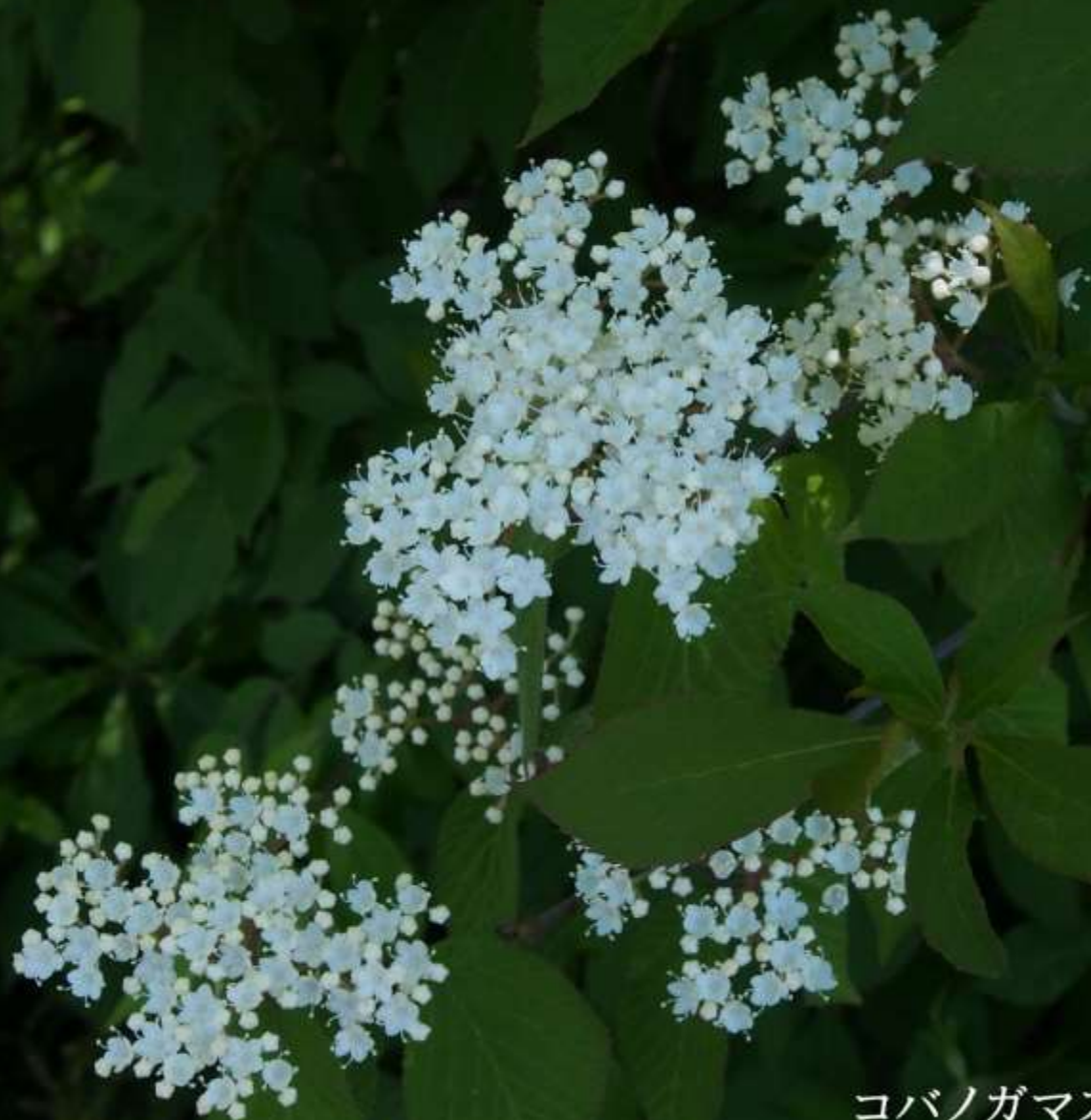
コバノガマズミ（小葉莢迷） スイカズラ科 落葉低木