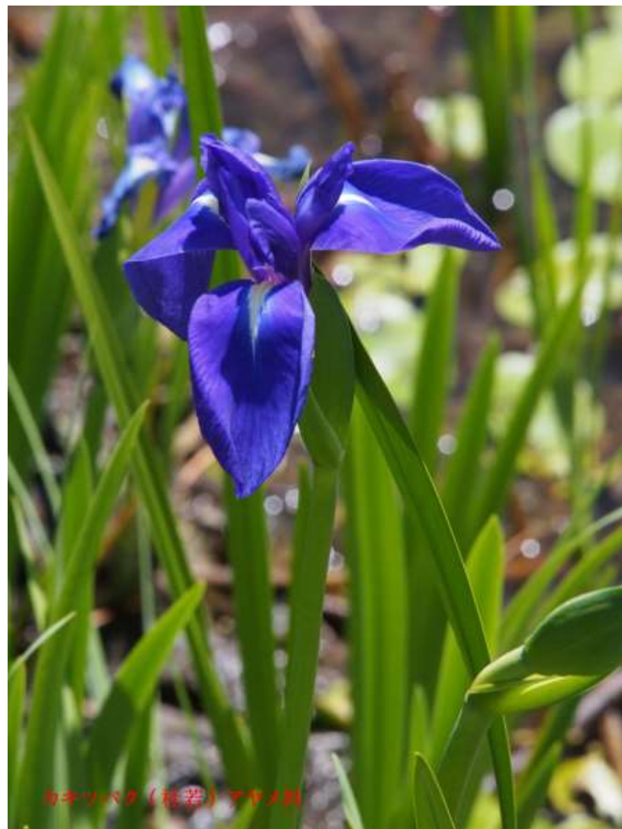
カキツバタ（杜若）アヤメ科