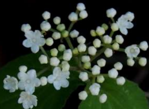
コバノガマズミ (小葉莢迷) スイカズラ科 落葉低木