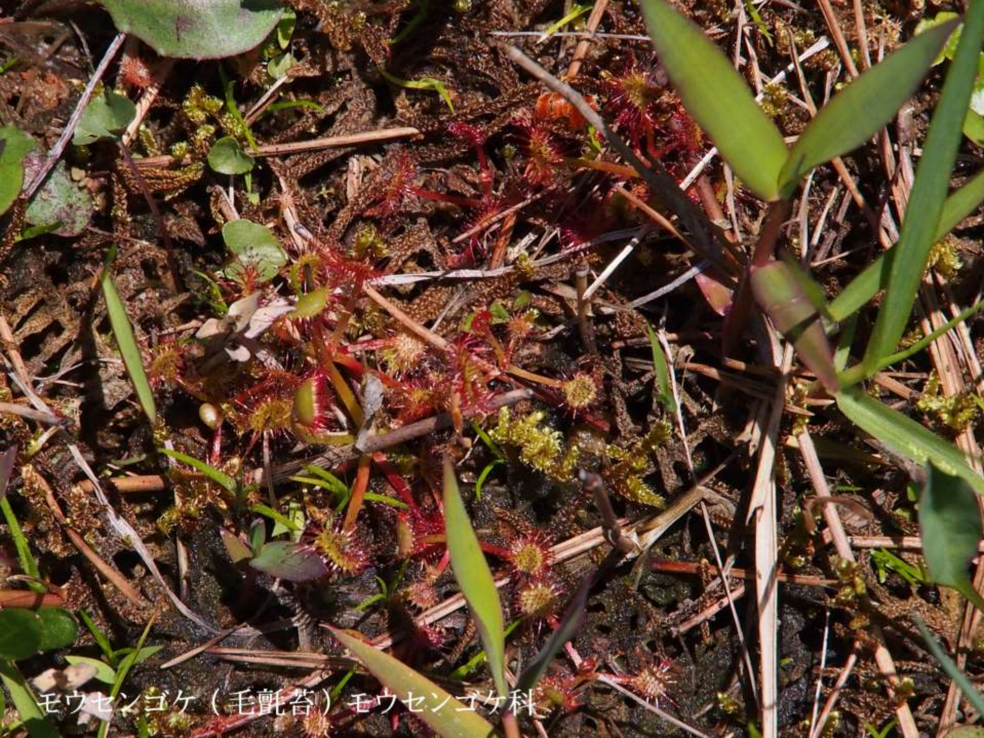
モウセンゴケ（毛氈苔）モウセンゴケ科