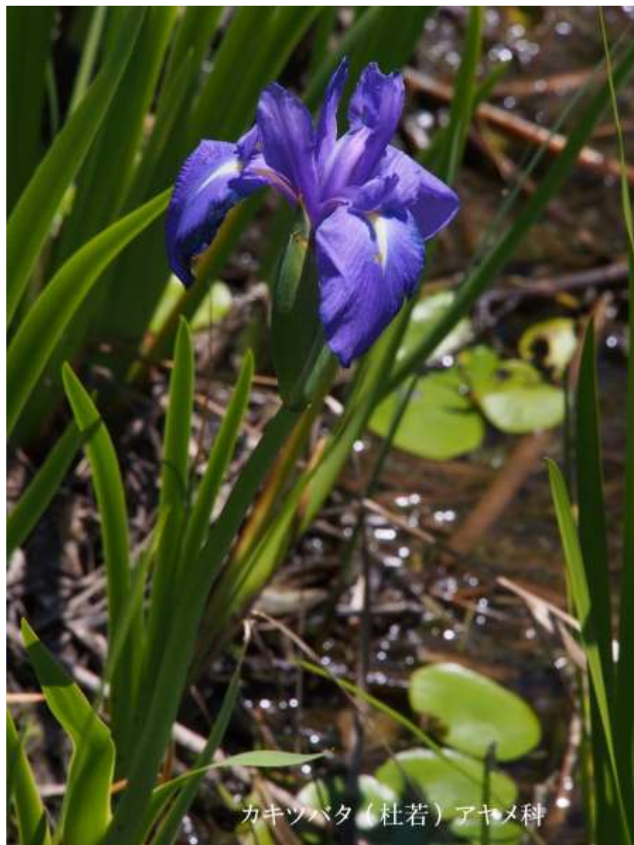
カキツバタ（杜若）アヤメ科