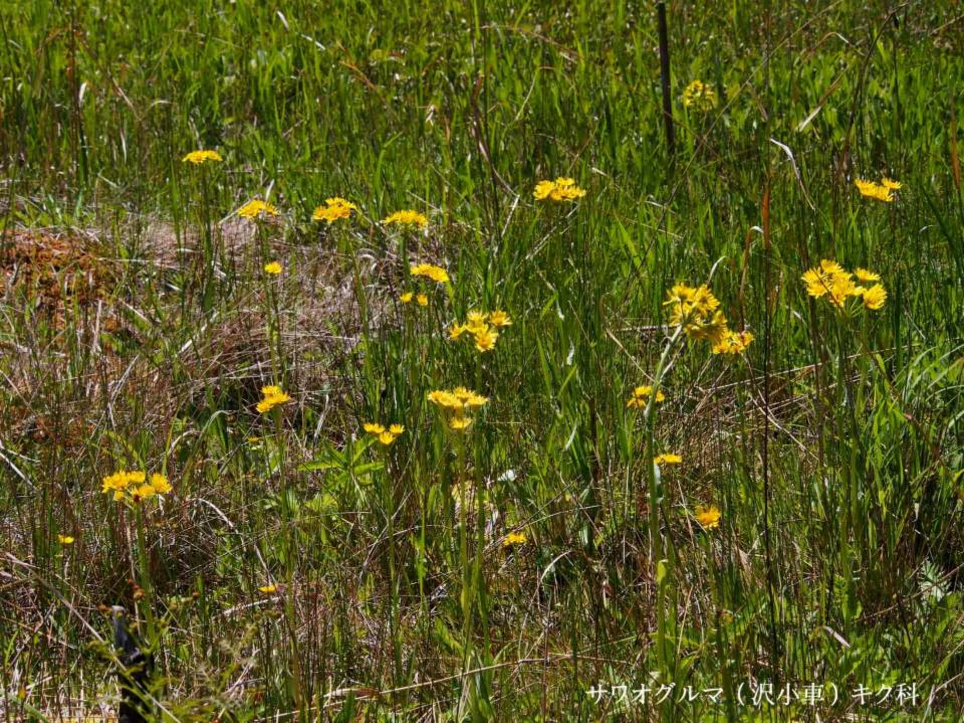
サウオグルマ（沢小車）キク科