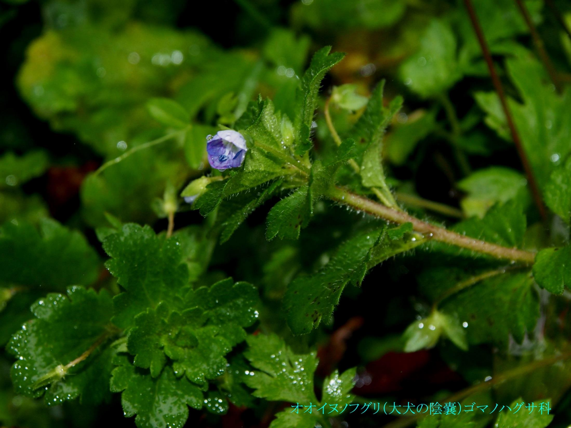
オオイヌノフグリ(大犬の陰囊)ゴマノハグサ科