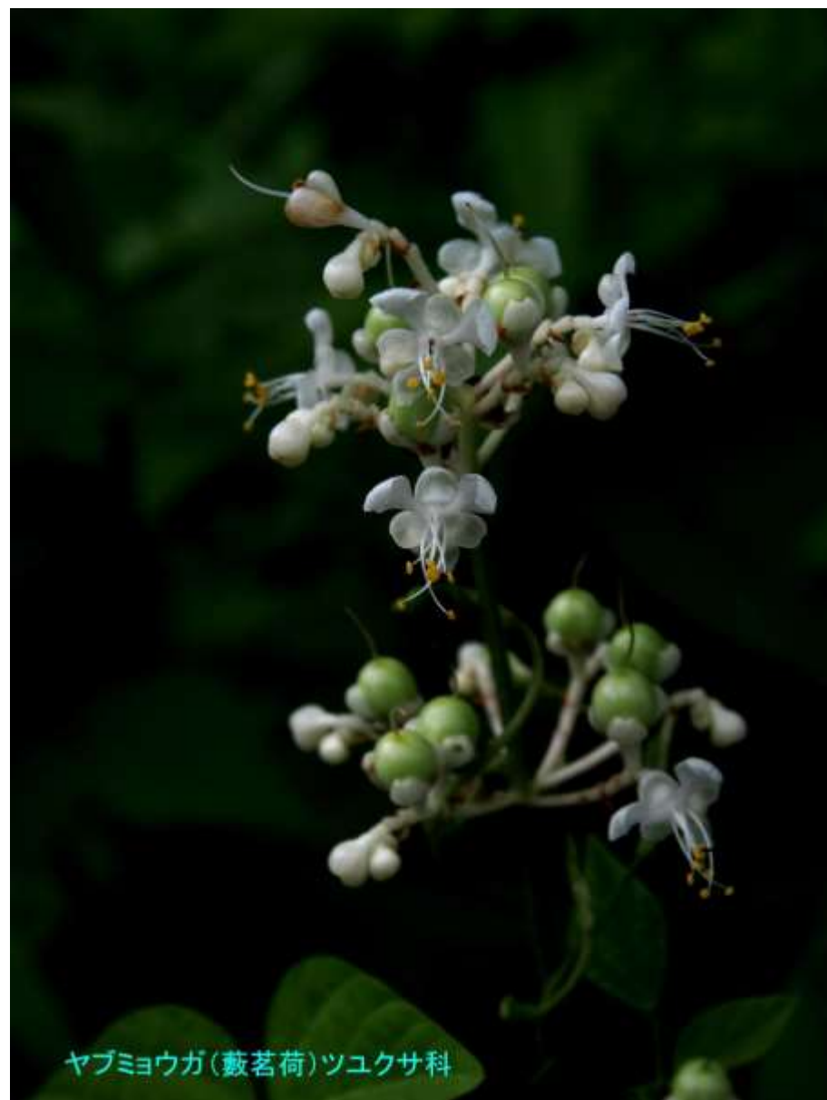
ヤブミョウガ(藪茗荷)ツユクサ科