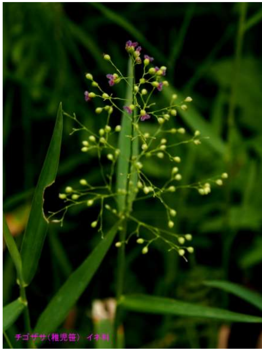
チゴザサ(稚児笹) イネ科