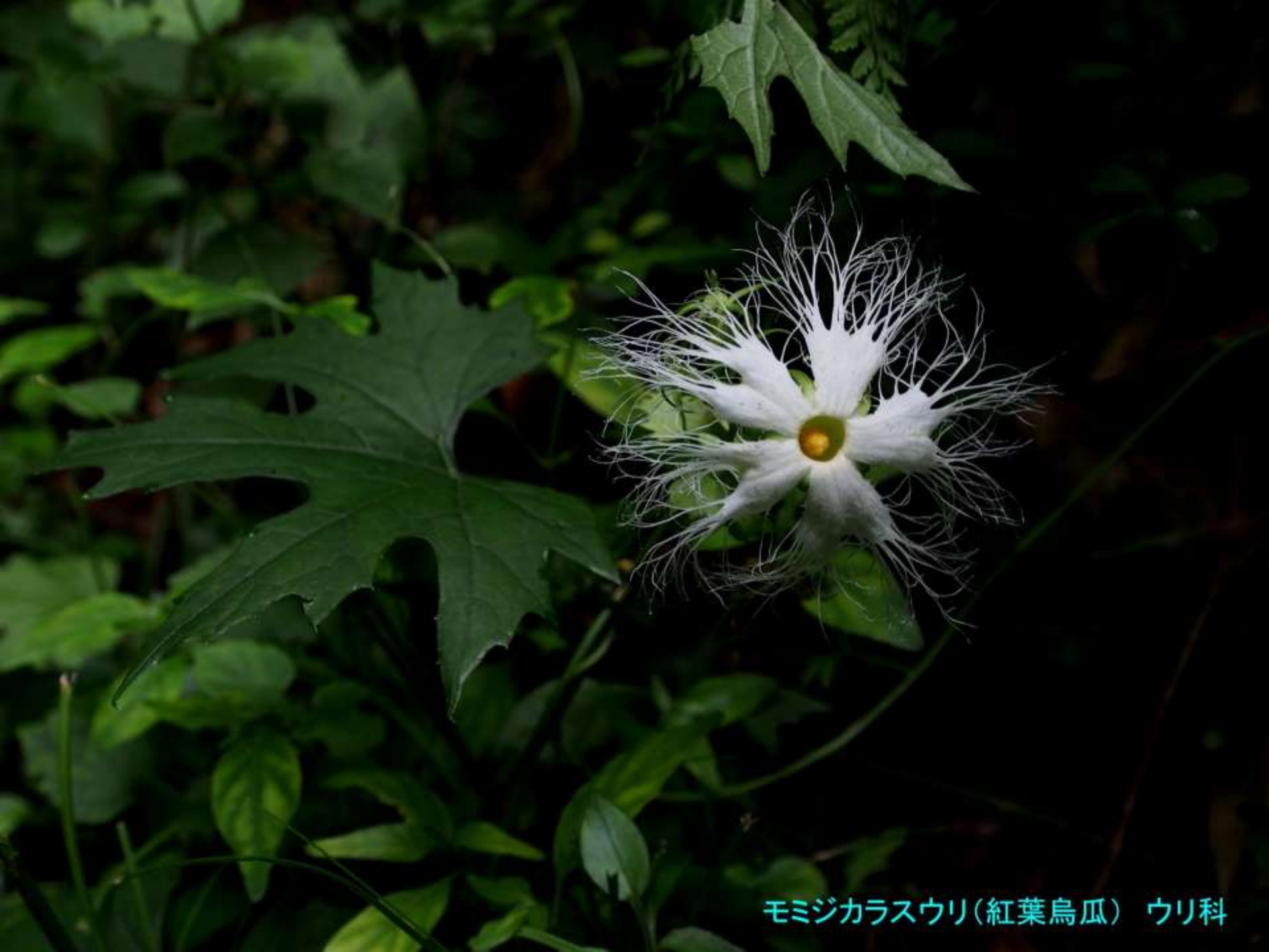
モミジカラスウリ(紅葉烏瓜) ウリ科