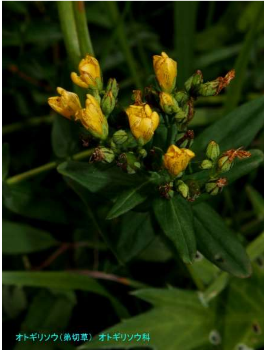
オトギリソウ(弟切草) オトギリソウ科