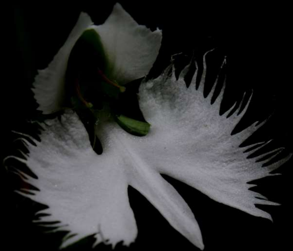
サギソウ(鷺草) ラン科