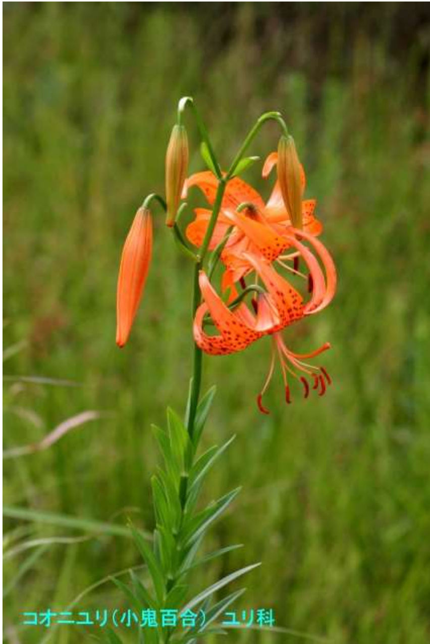
コオニユリ(小鬼百合) ユリ科