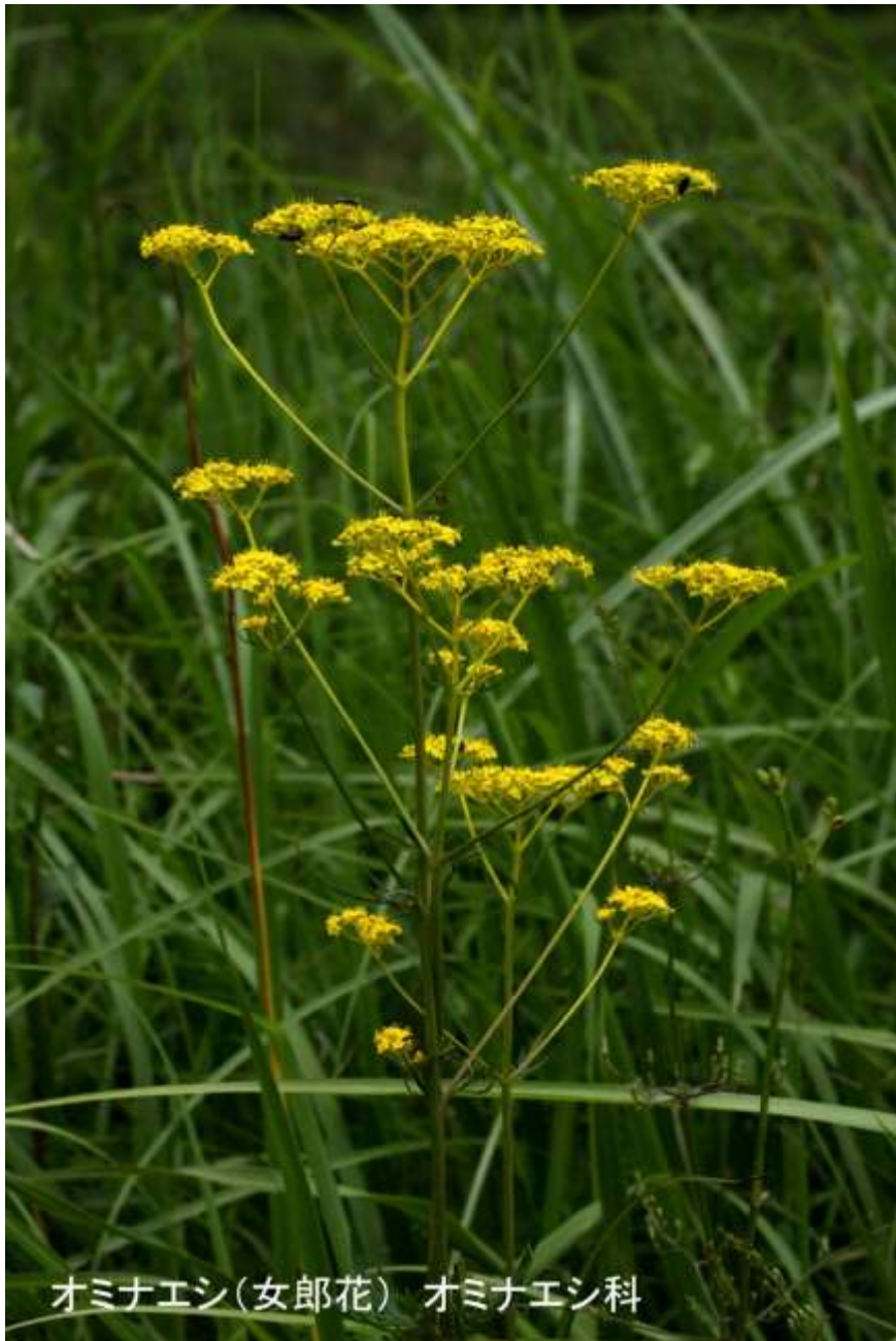
オミナエシ(女郎花) オミナエシ科