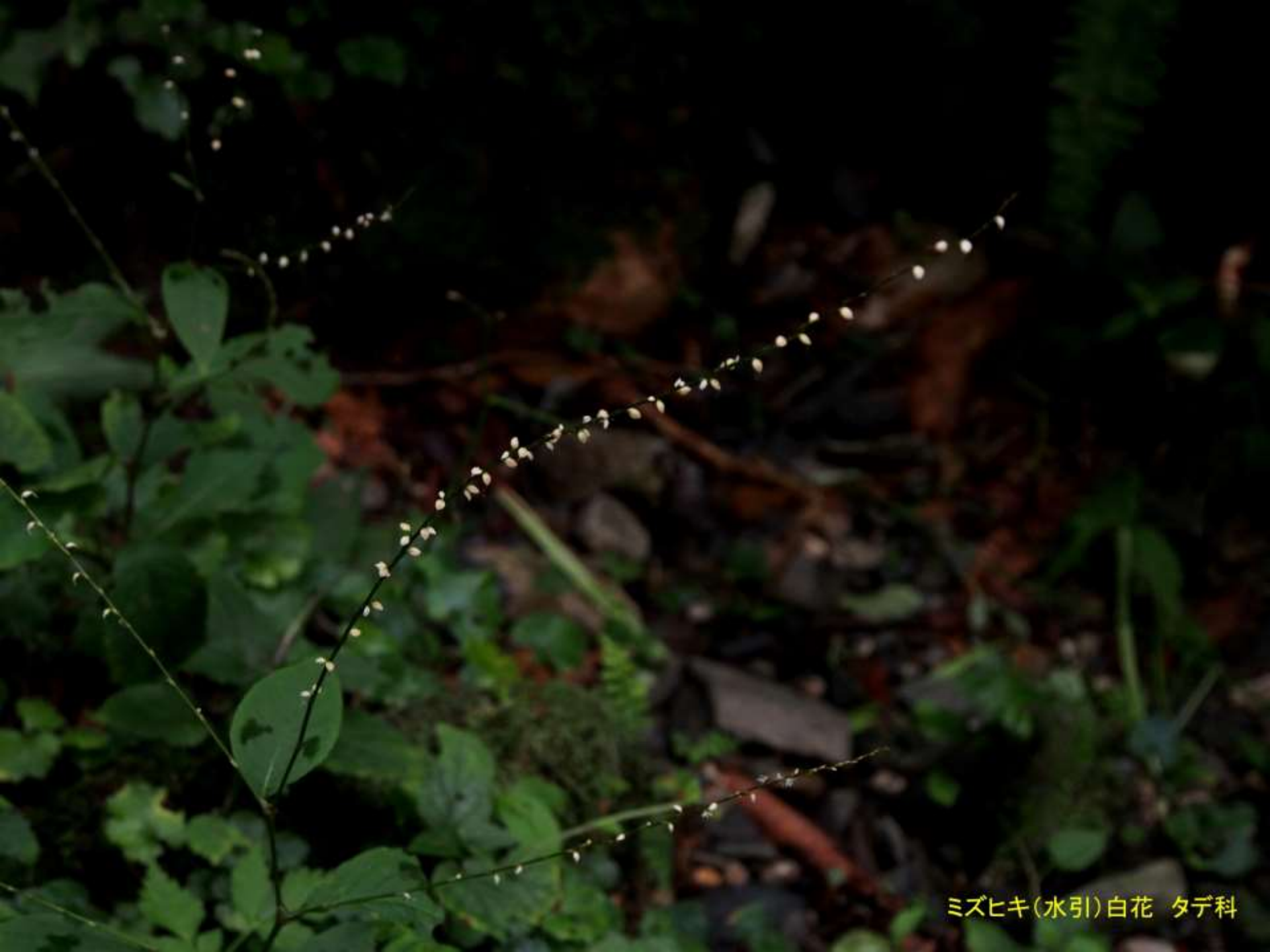
ミズヒキ(水引)白花 タデ科