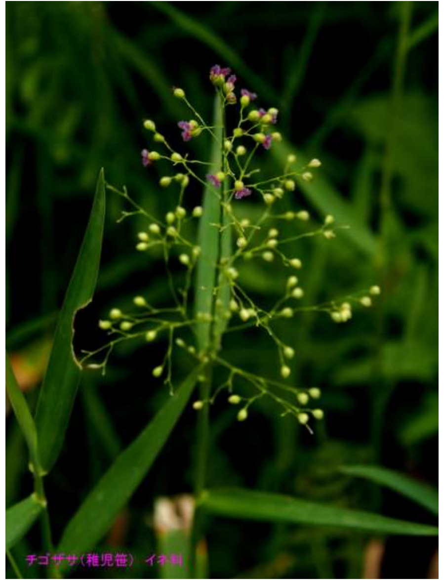
チゴザサ(稚児笹) イネ科