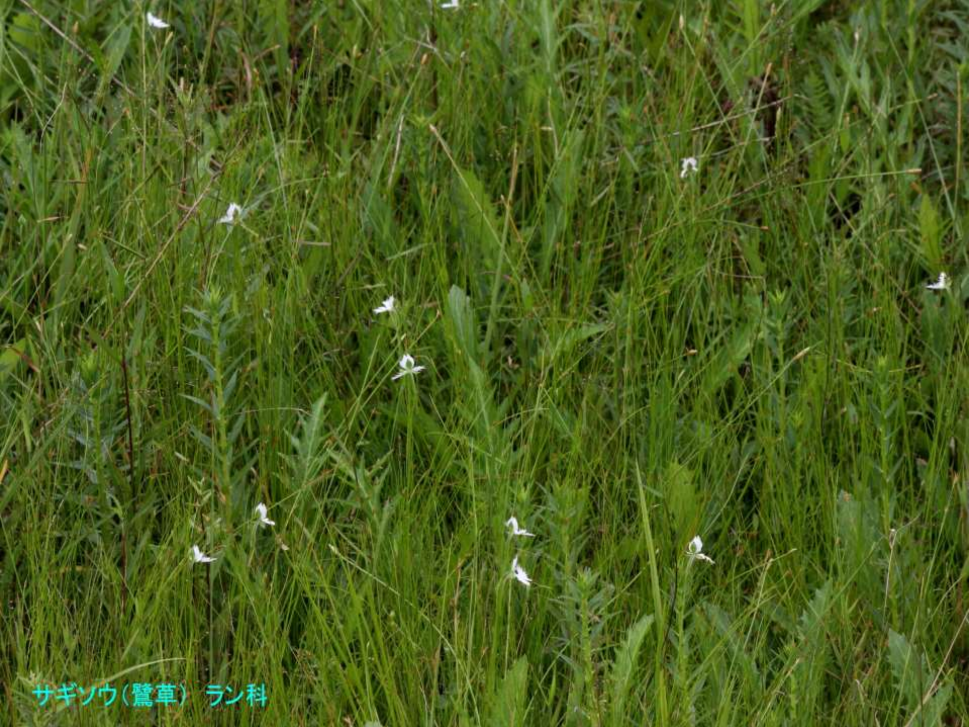
サギソウ(鷺草) ラン科