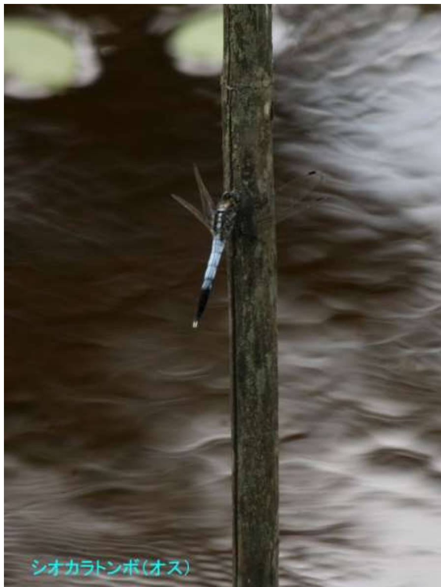
シオカラトンボ(オス)