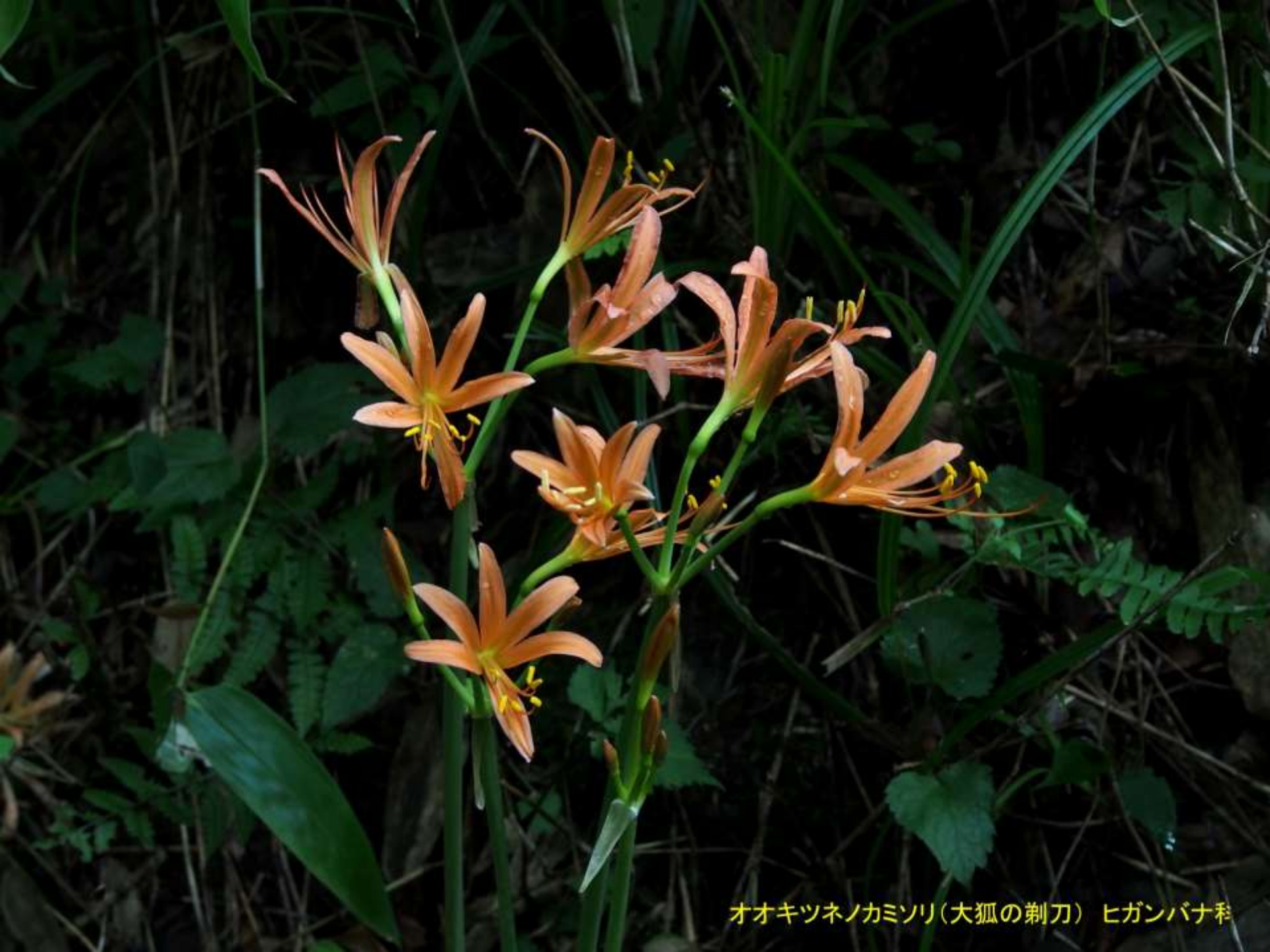
オオキツネノカミソリ(大狐の剃刀) ヒガンバナ科