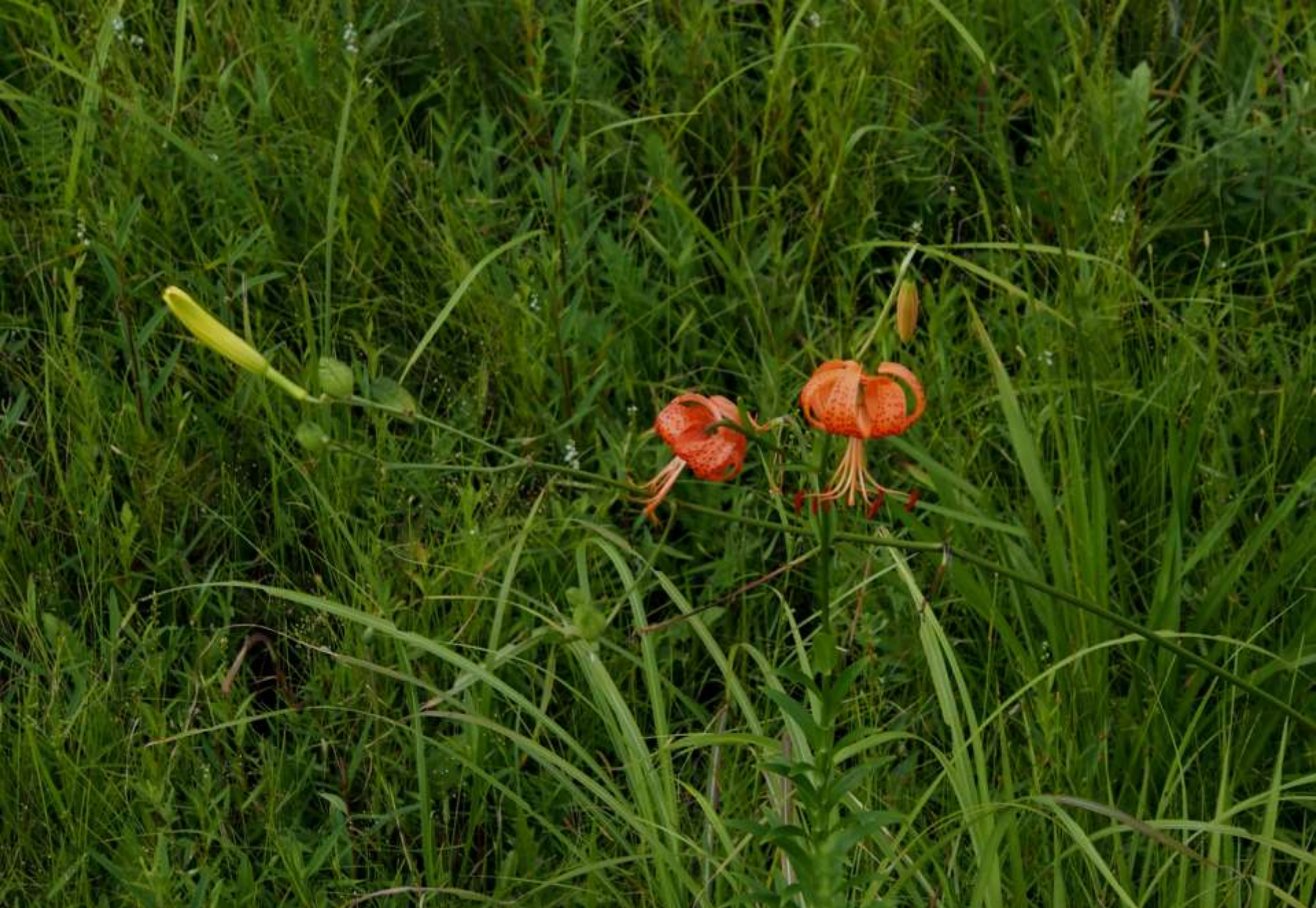
ユウスゲ(夕菅) ユリ科 別名:キスゲ(黄菅)