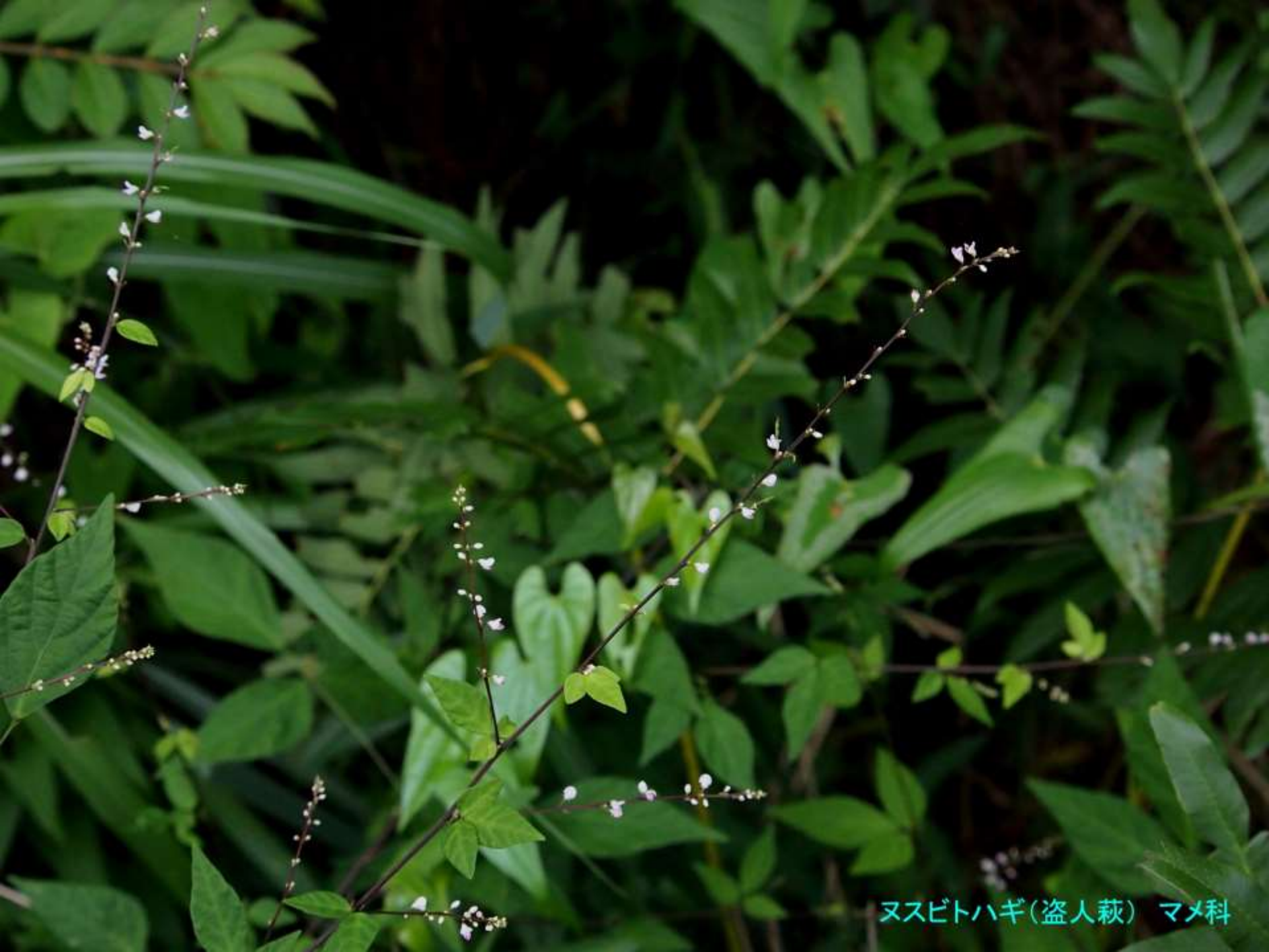
ヌスビトハギ(盗人萩) マメ科