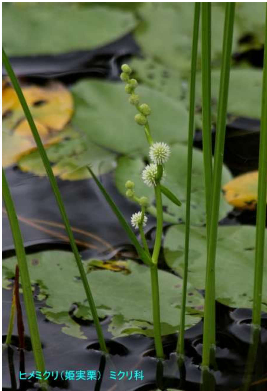
ヒメミクリ(姫実栗) ミクリ科