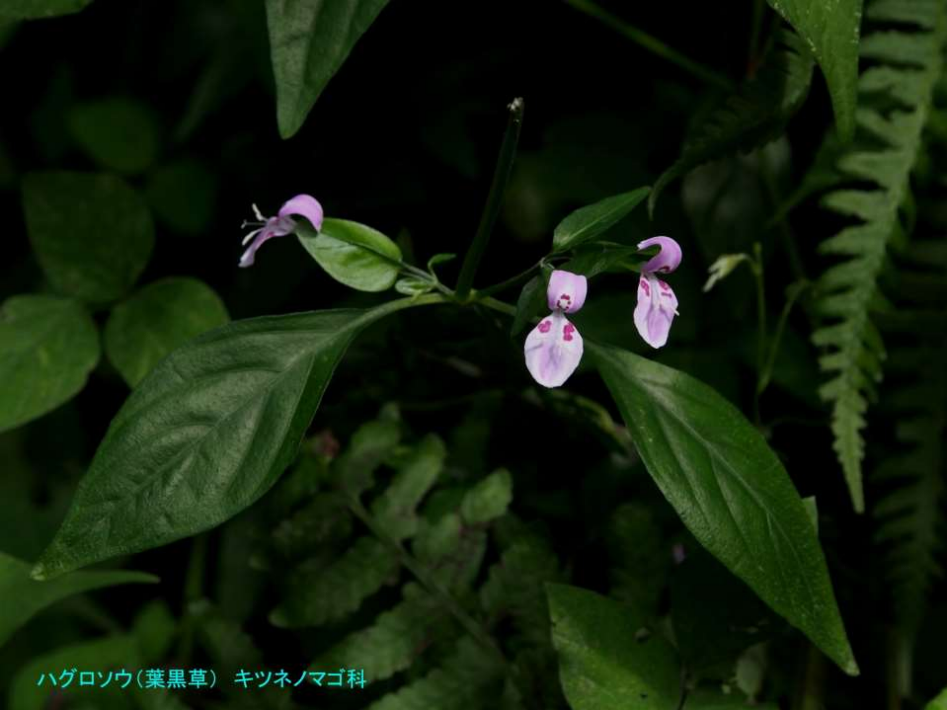
ハグロソウ(葉黒草) キツネノマゴ科