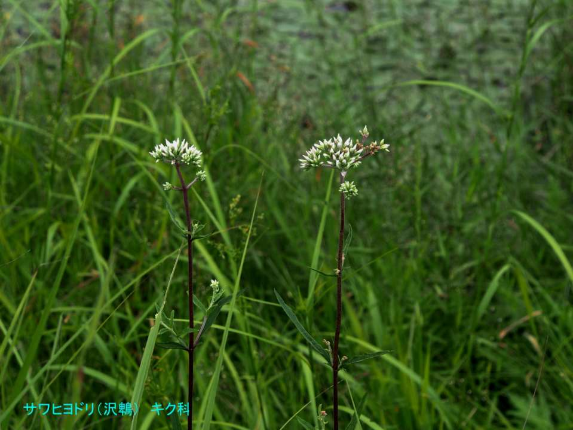
サワヒヨドリ(澤鶉) キク科