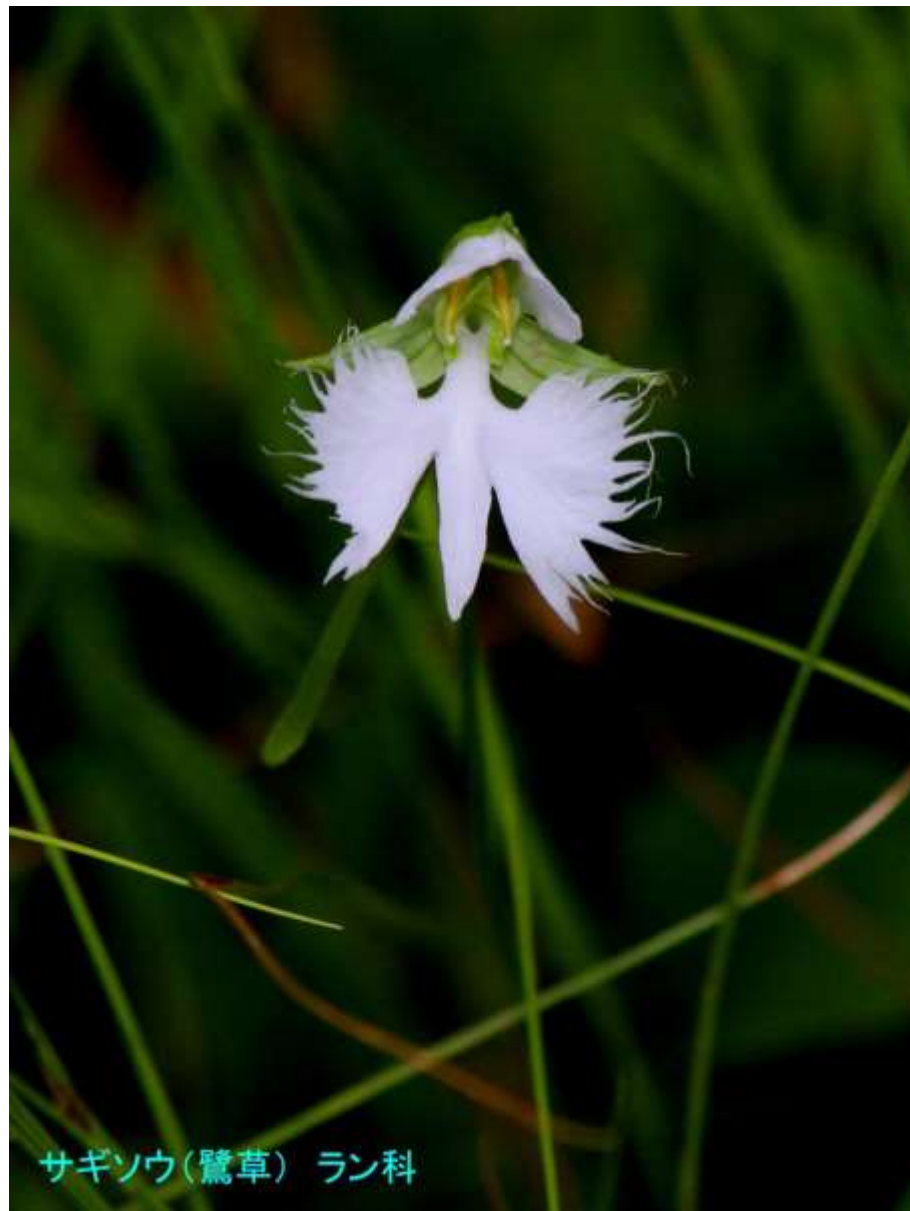
サギソウ(鷺草) ラン科