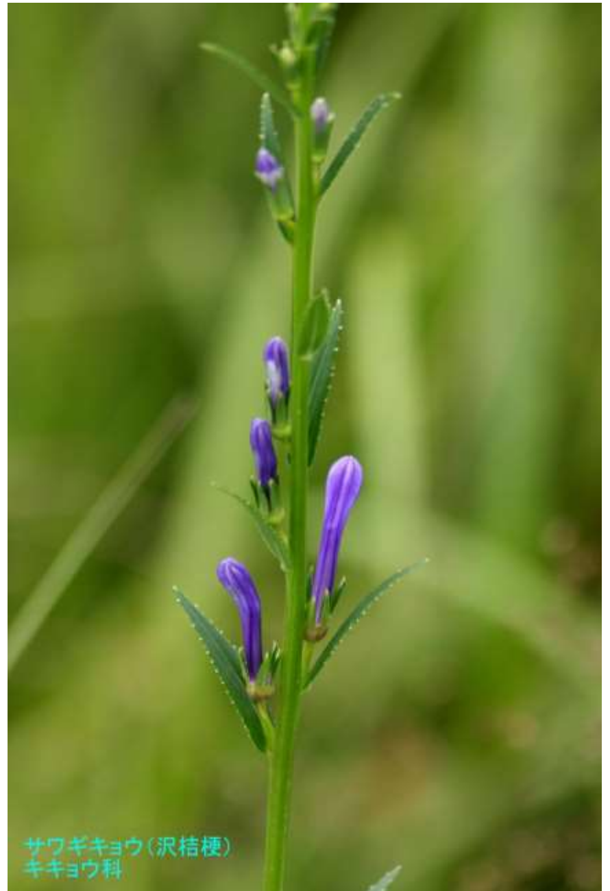
サワギキョウ(沢桔梗) キキョウ科