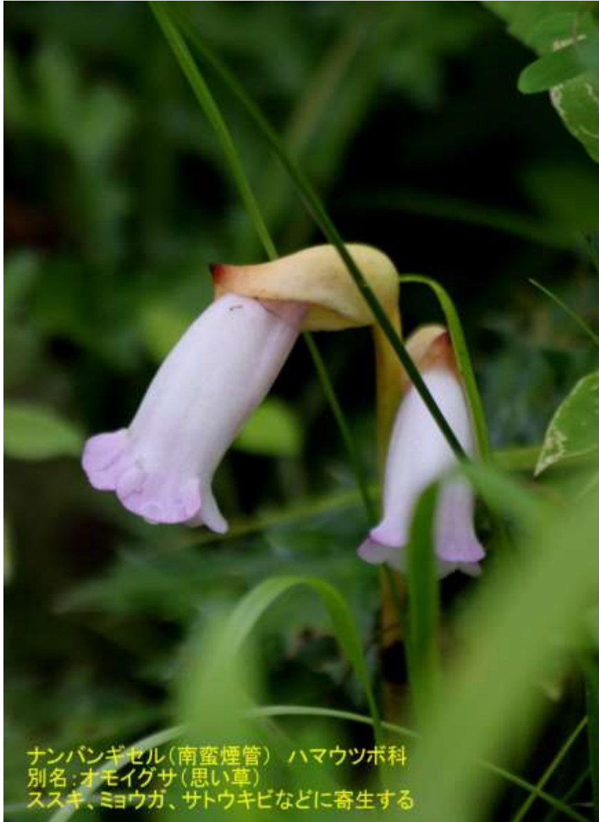
ナンバンギセル(南蛮煙管) ハマウツボ科 別名:オモイグサ(思い草) ススキ、ミヨウガ、サトウキビなどに寄生する