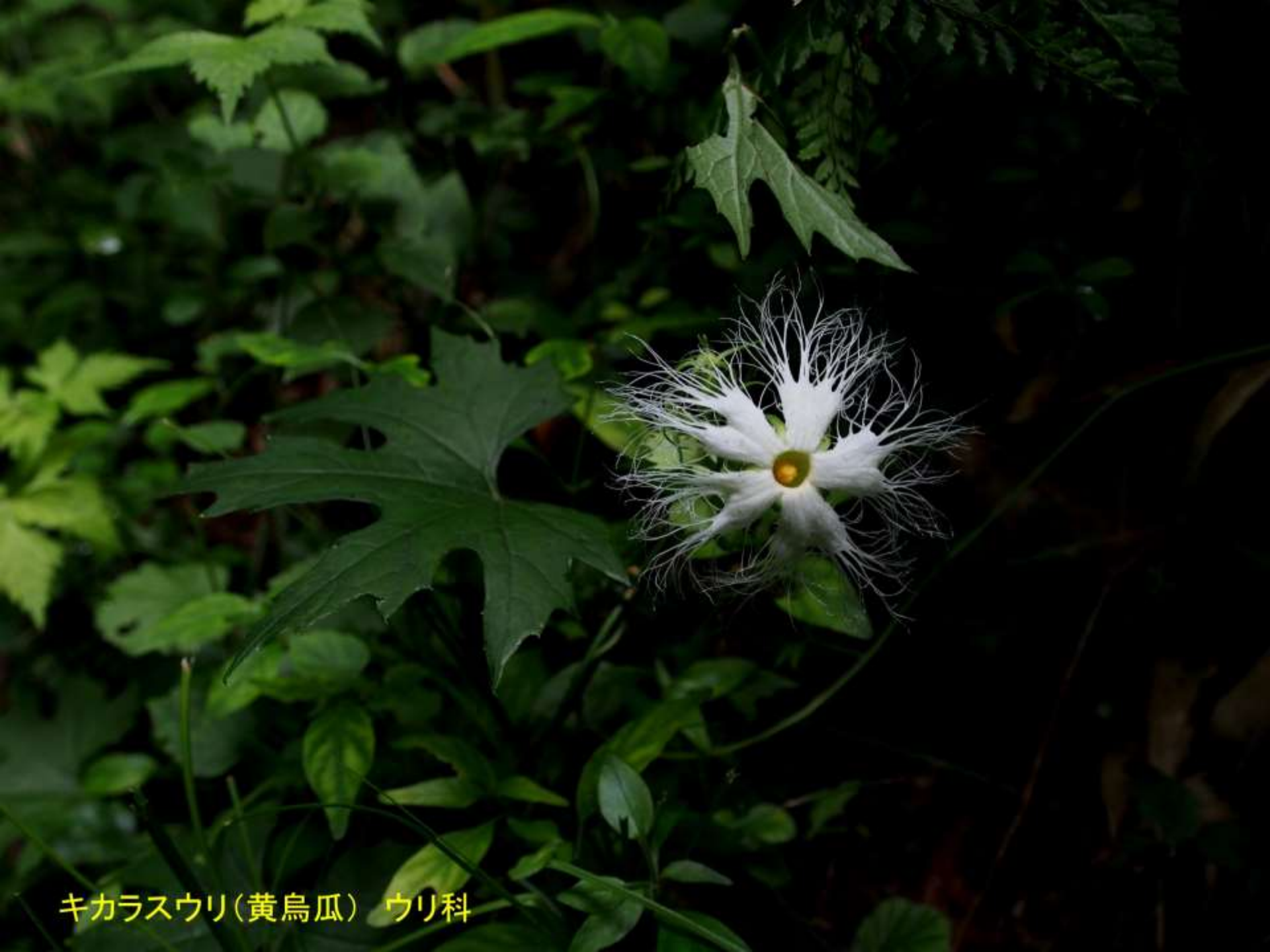
キカラスウリ(黄烏瓜) ウリ科