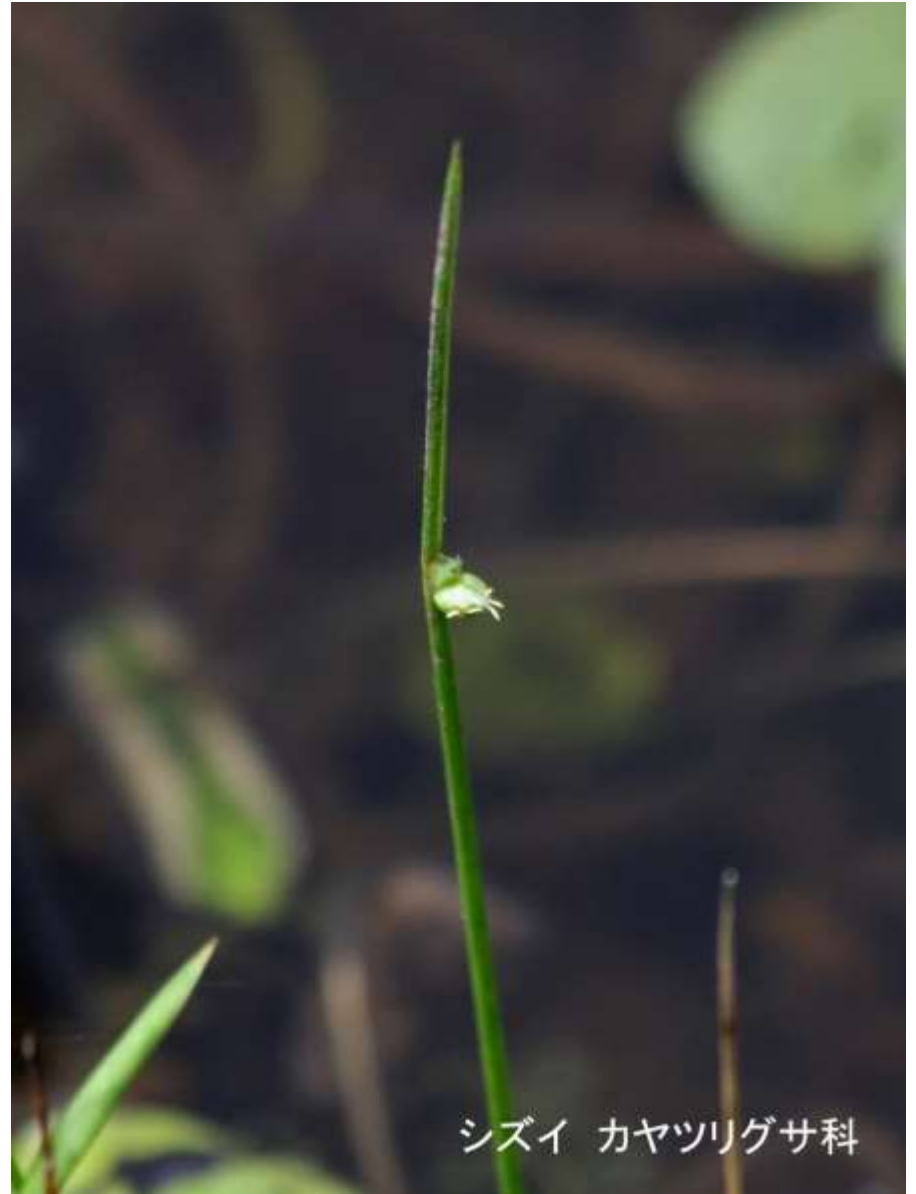
シズイ カヤツリグサ科