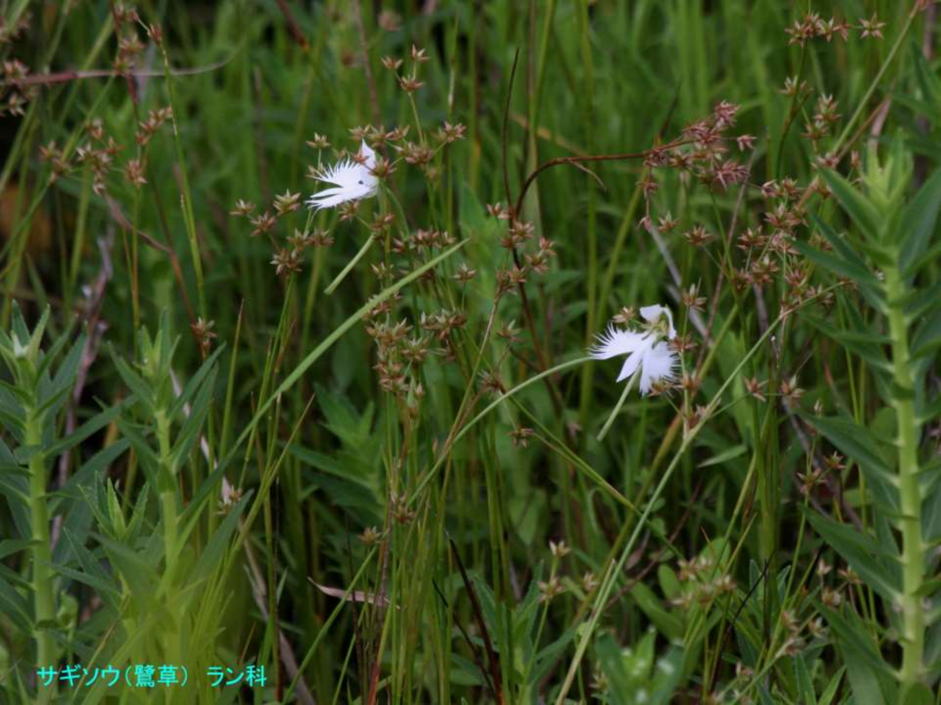
サギソウ(鷺草) ラン科