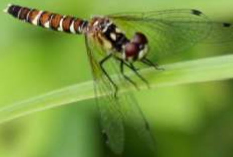
ハッチョウトンボ(八丁蜻蛉)メス