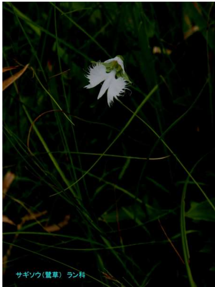
サギソウ(鷺草) ラン科