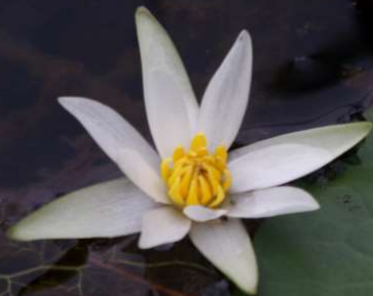
ヒツジグサ(未草) スイレン科