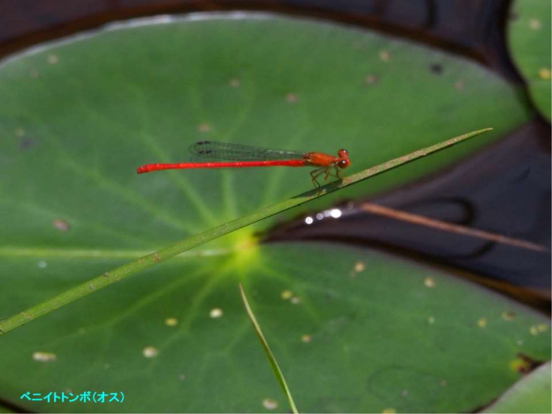
ベニイトトンボ(オス)