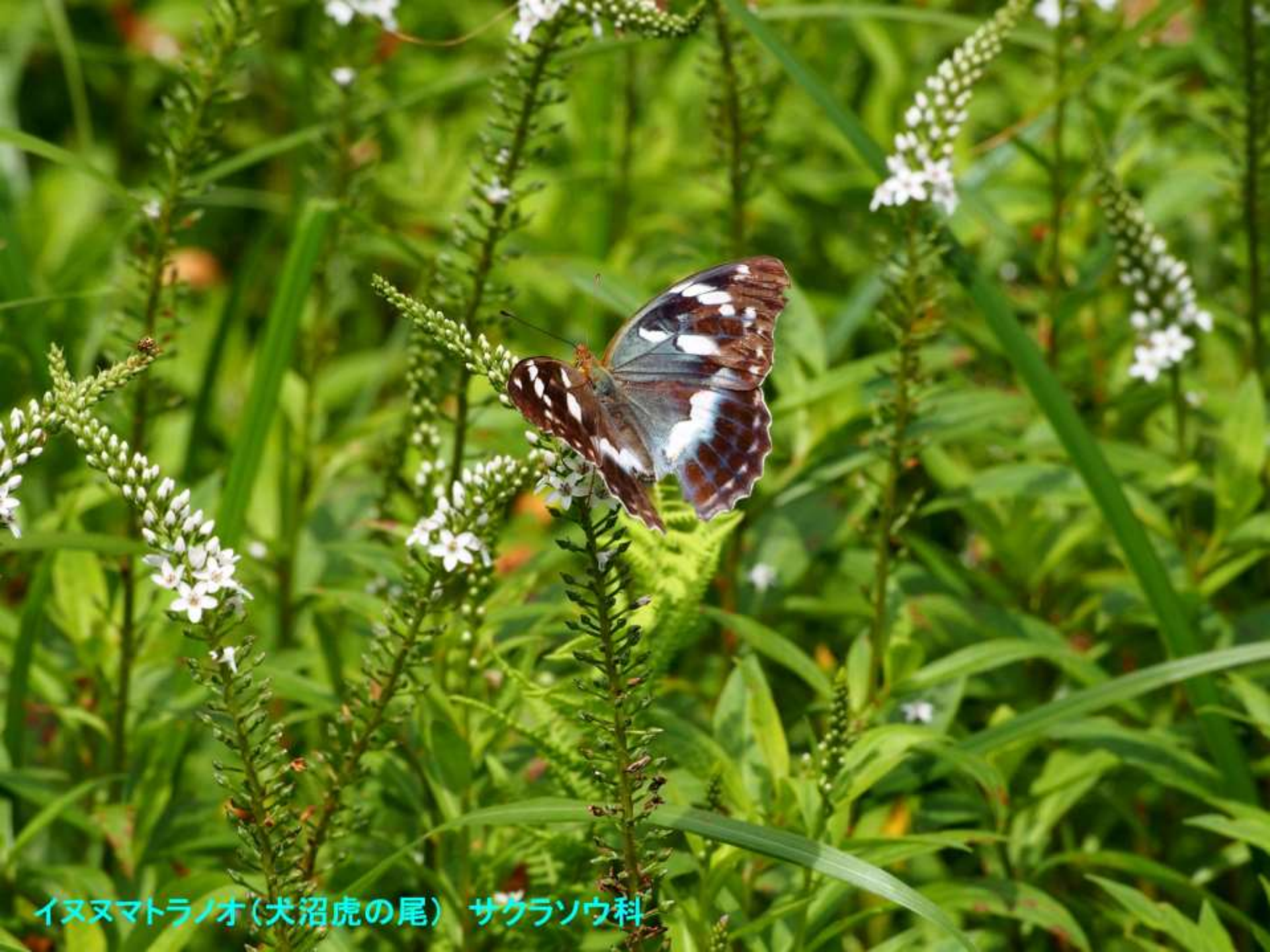
イヌヌマトラノオ(犬沼虎の尾) サクラソウ科