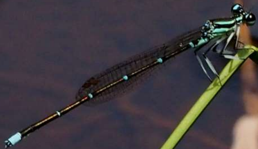
モノサシトンボ(物差蜻蛉) (オス)