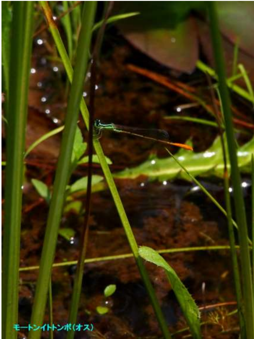
モートナイトトンボ(オス)