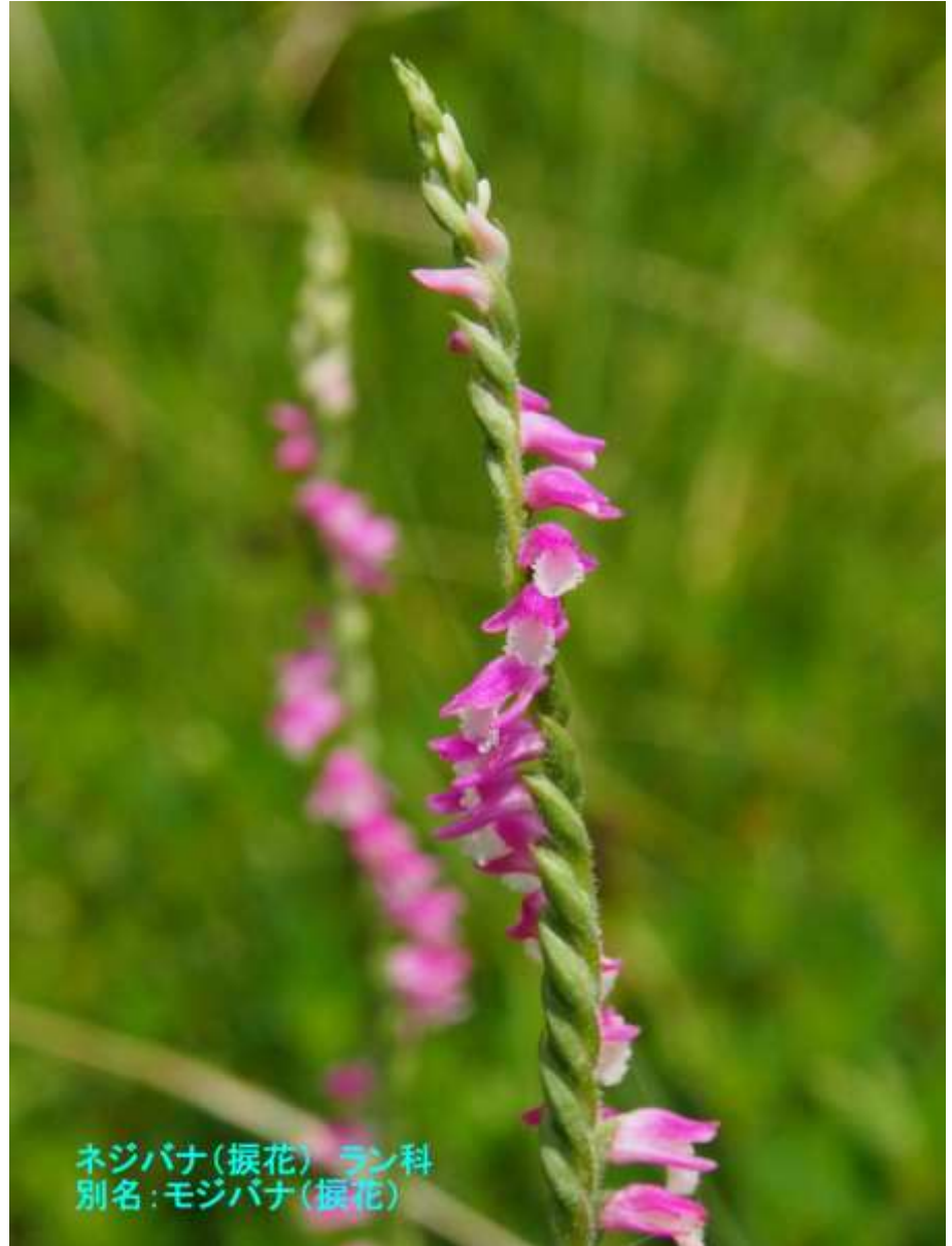
ネジバナ(振花) ラン科 別名:モジバナ(振花)