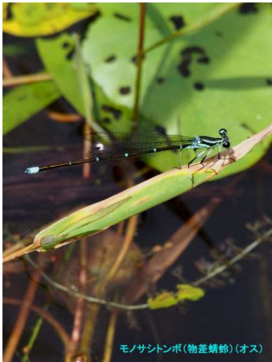
モノサシトンボ(物差蜻蛉)(オス)