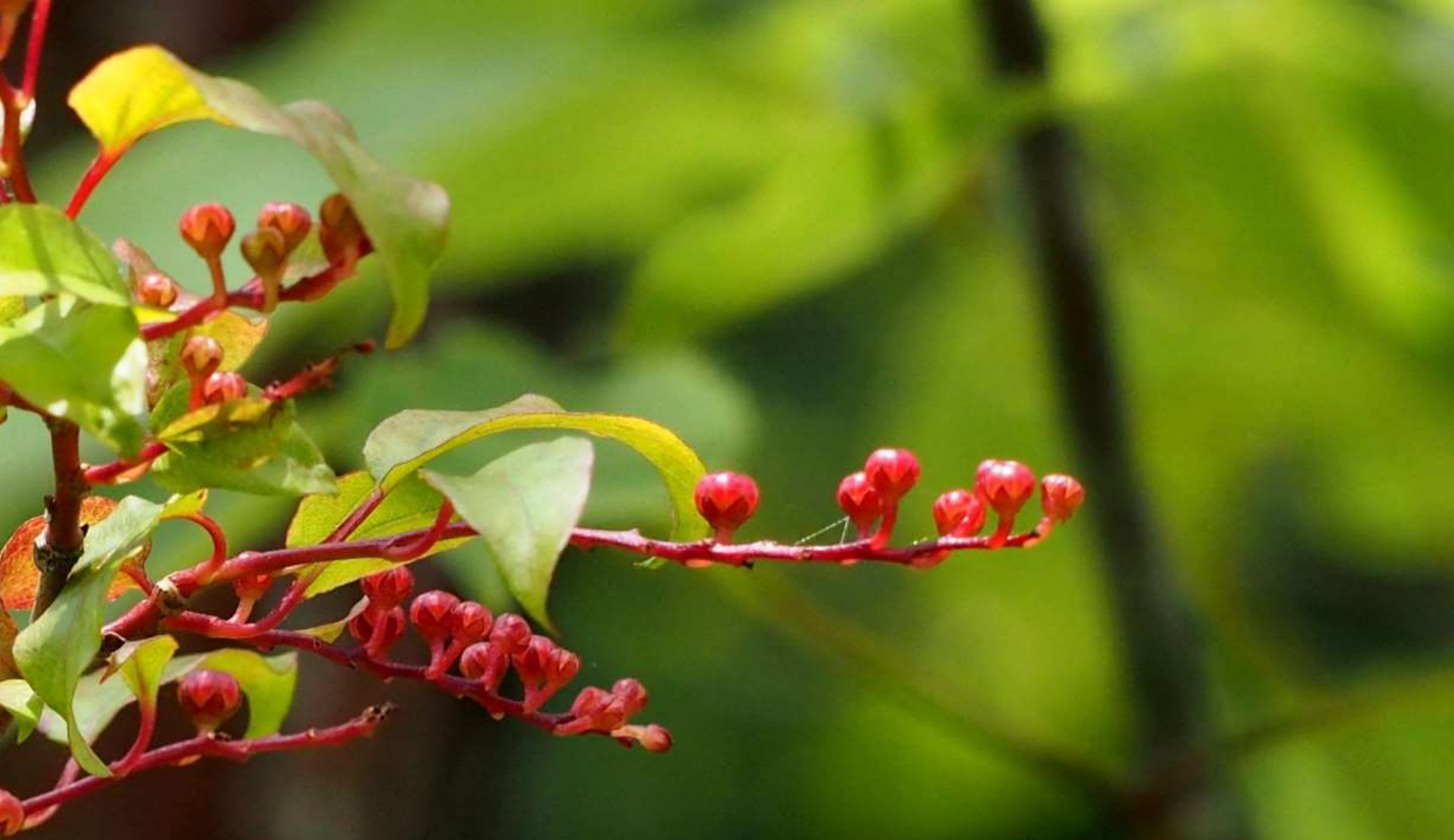
ナツハゼ(夏櫨) ツツジ科 落葉低木