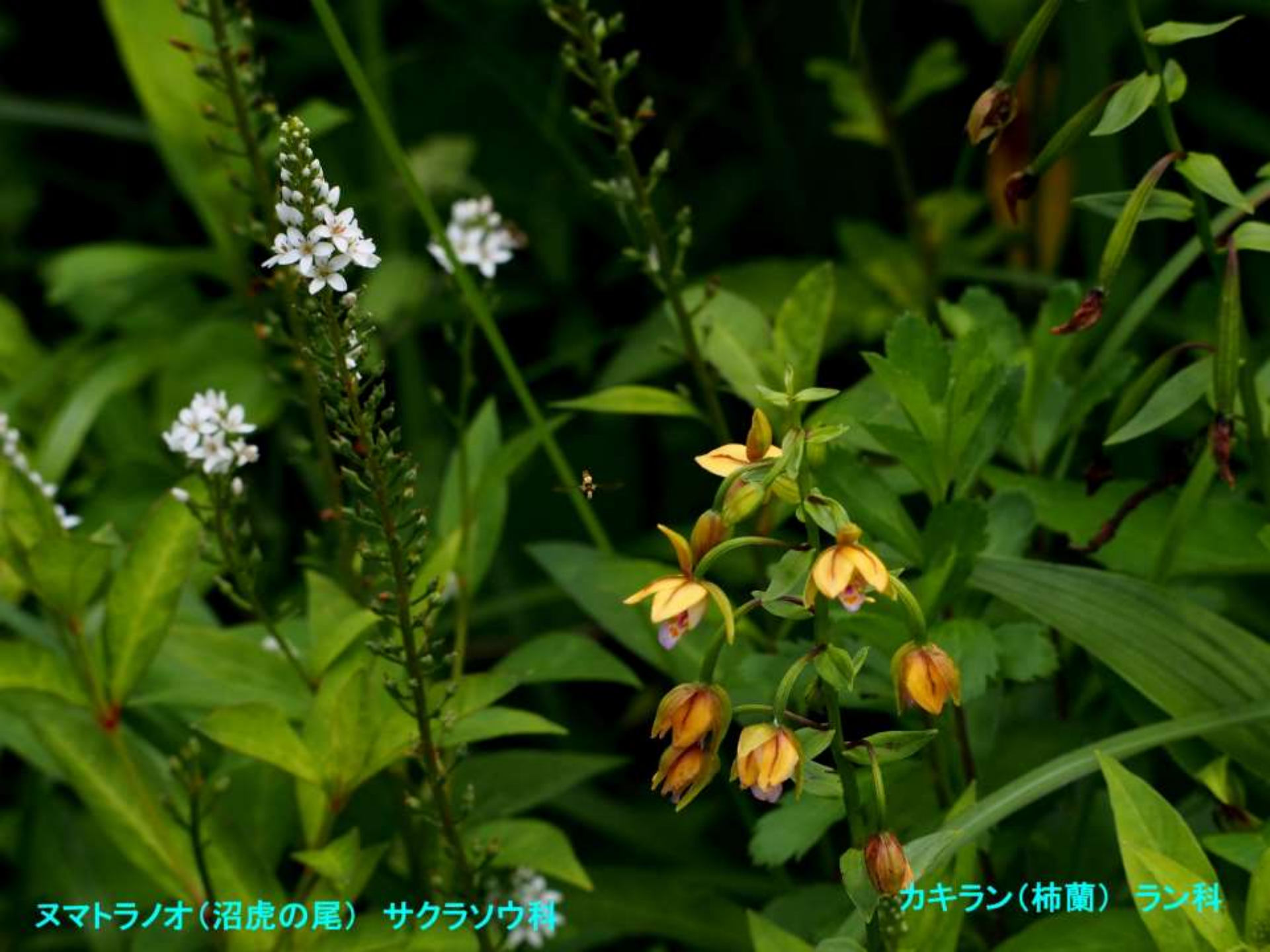
ヌマトラノオ(沼虎の尾) サクラソウ科