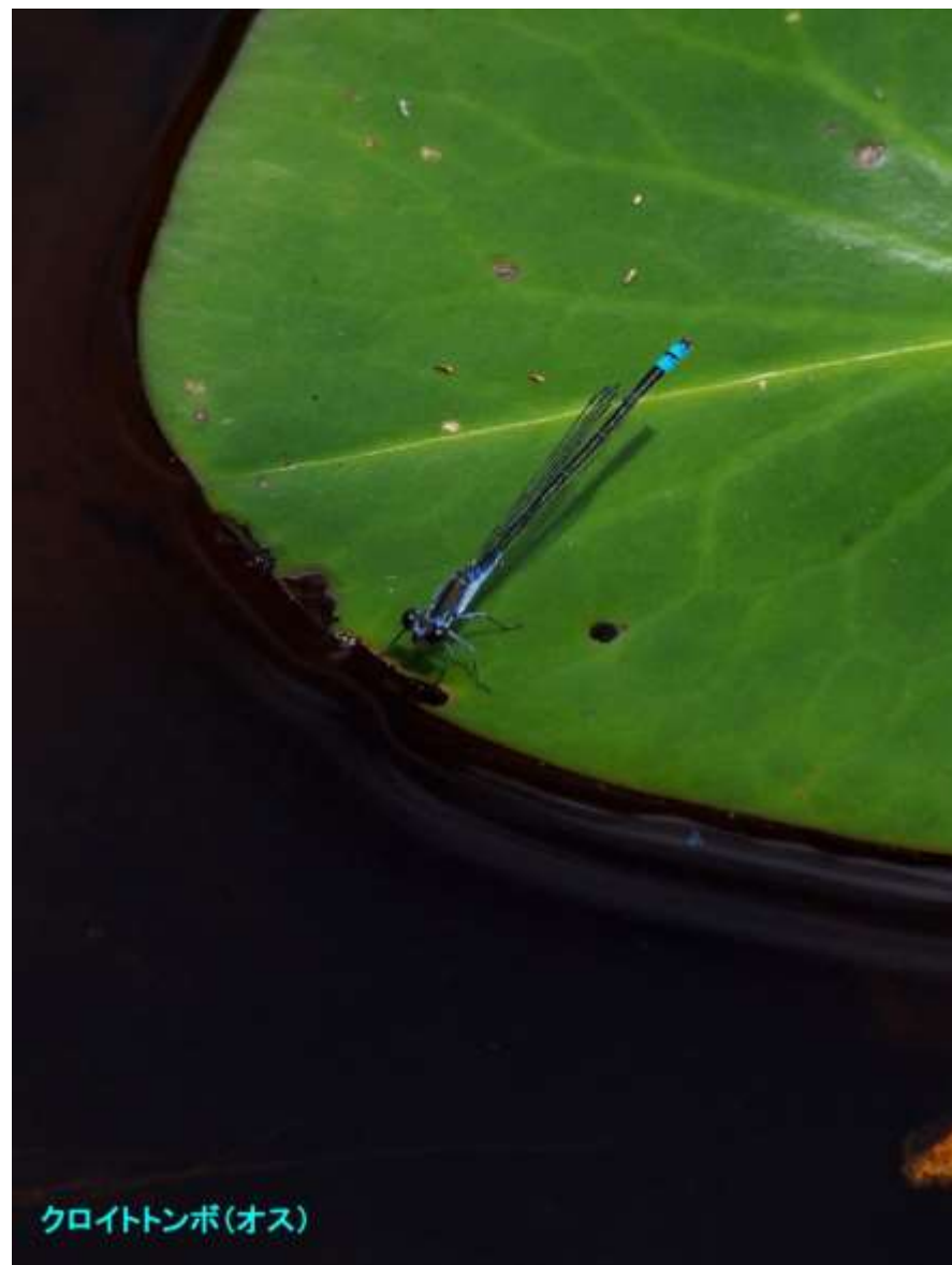
クロイトトンボ(オス)