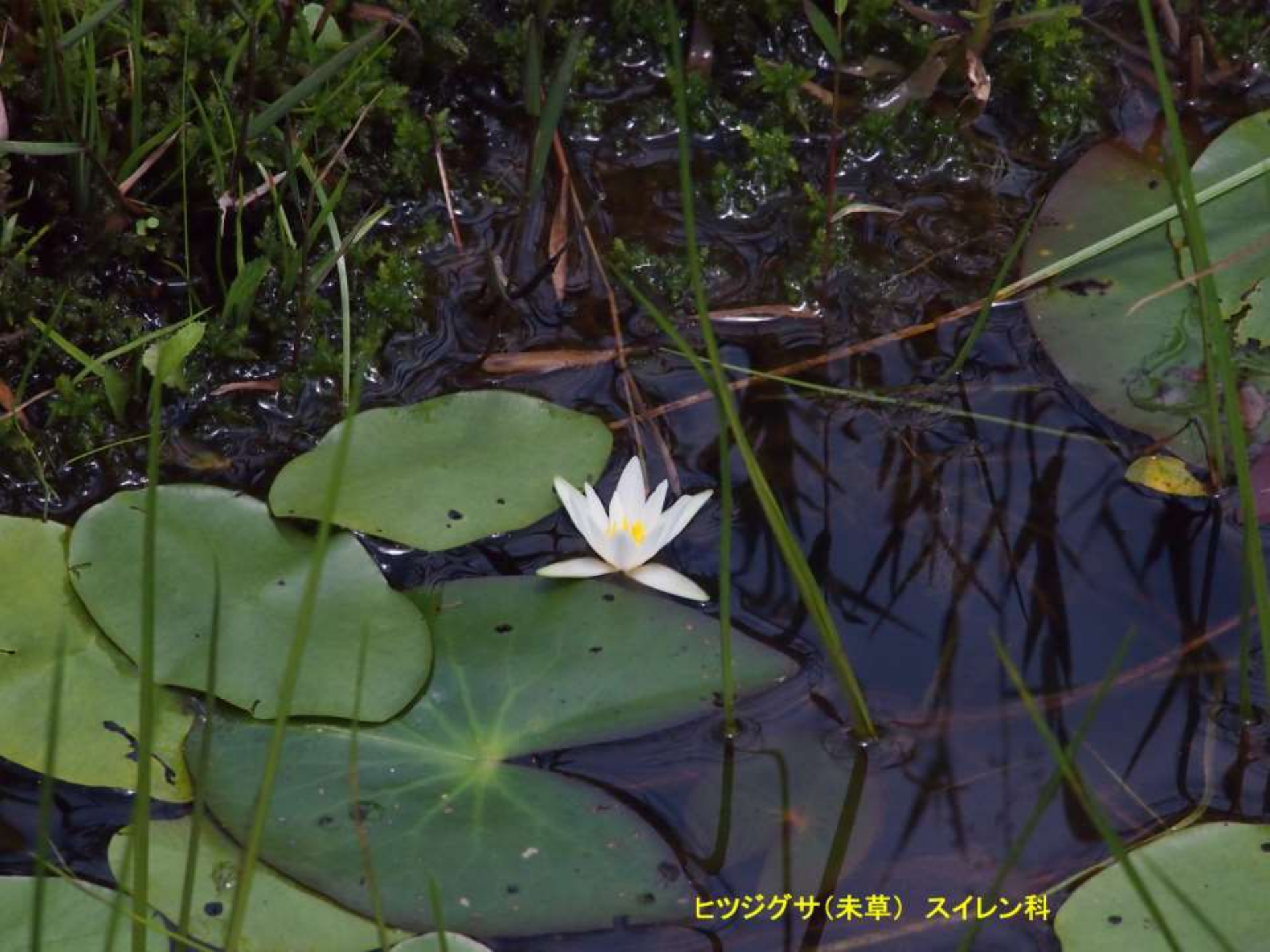
ヒツジグサ(未草) スイレン科