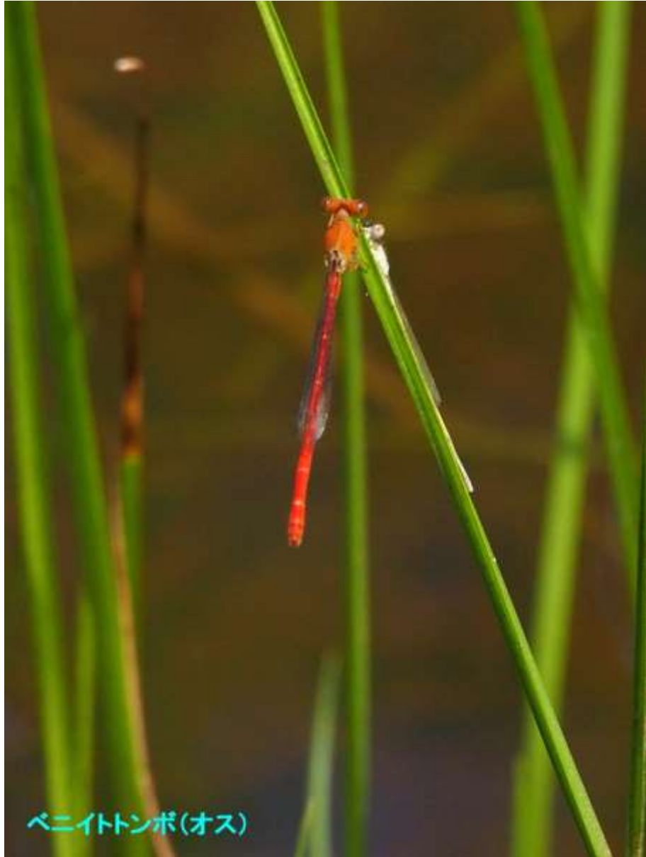
ベニイトトンボ(オス)