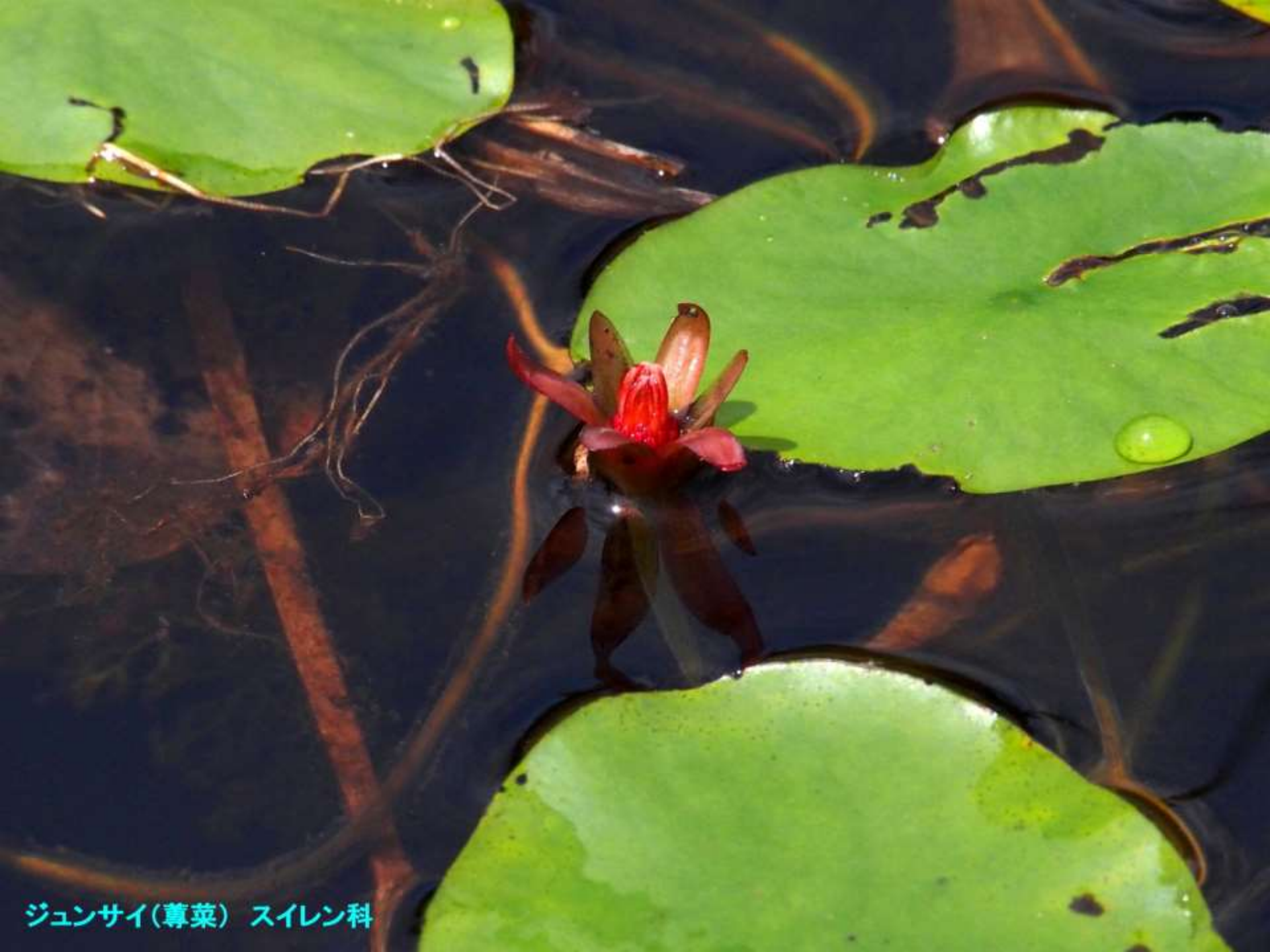
ジュンサイ(蓴菜) スイレン科