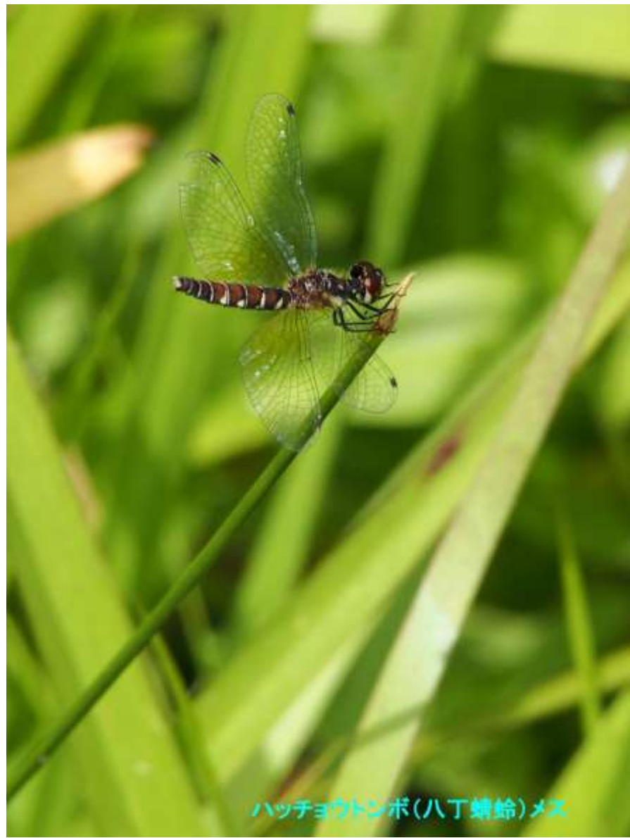
ハッチョウトンボ(八丁蜻蛉)メス