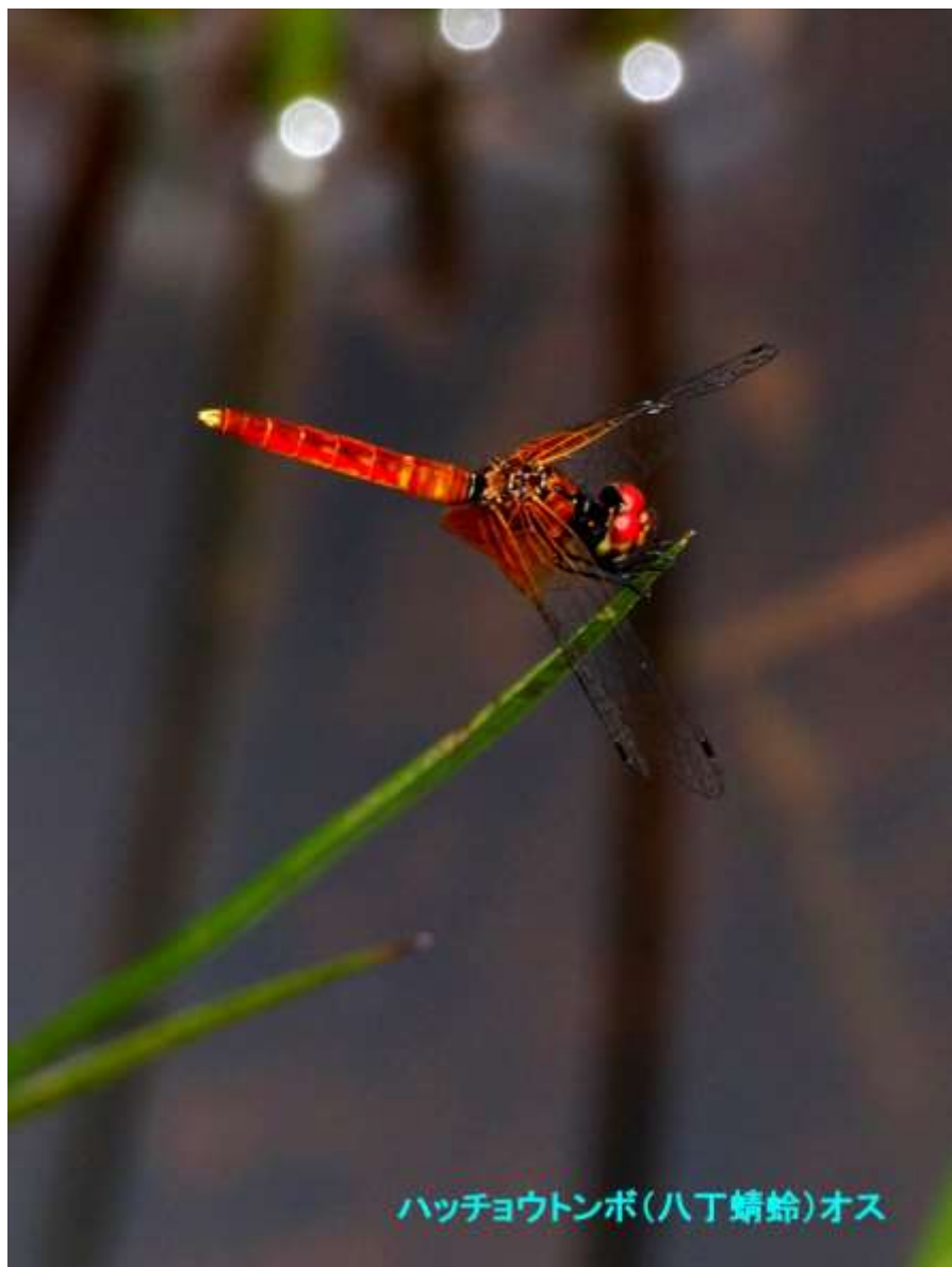
ハッチョウトンボ(八丁蜻蛉)オス