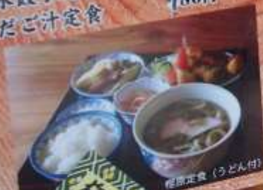
櫻原定食 (うどん付)