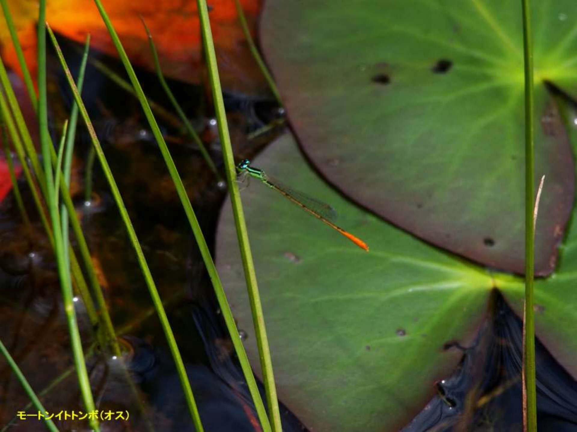
モートンイトトンボ(オス)